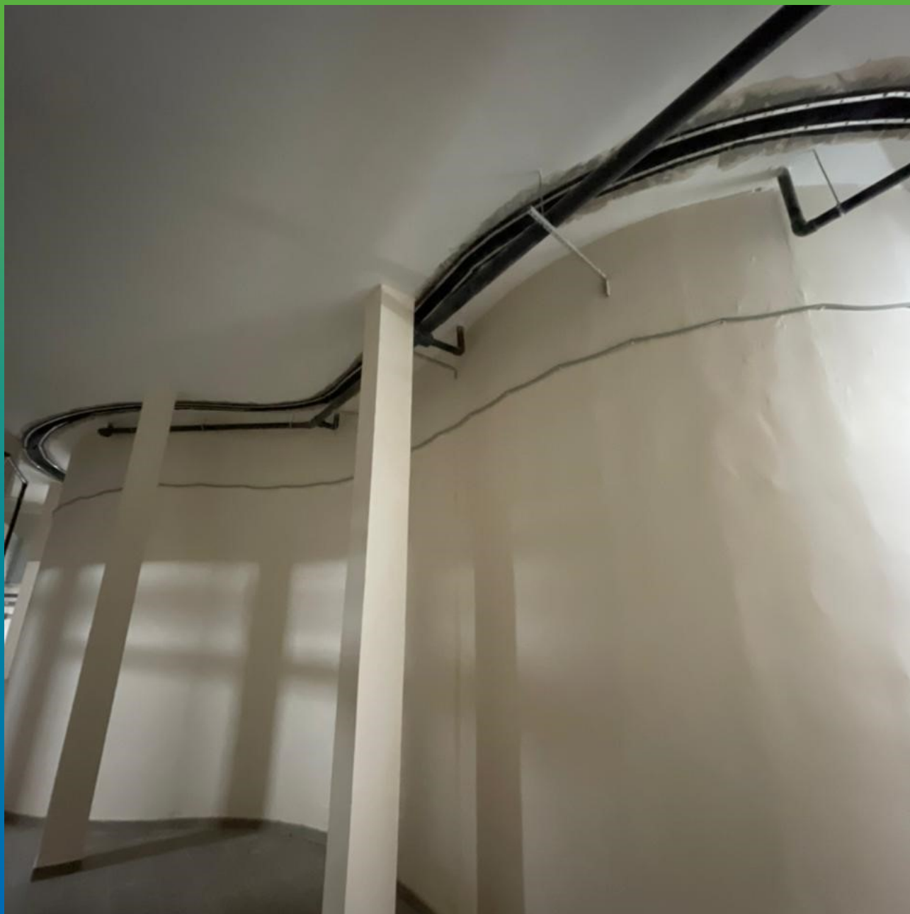
Лента Преласты СТ, монтированная на шов