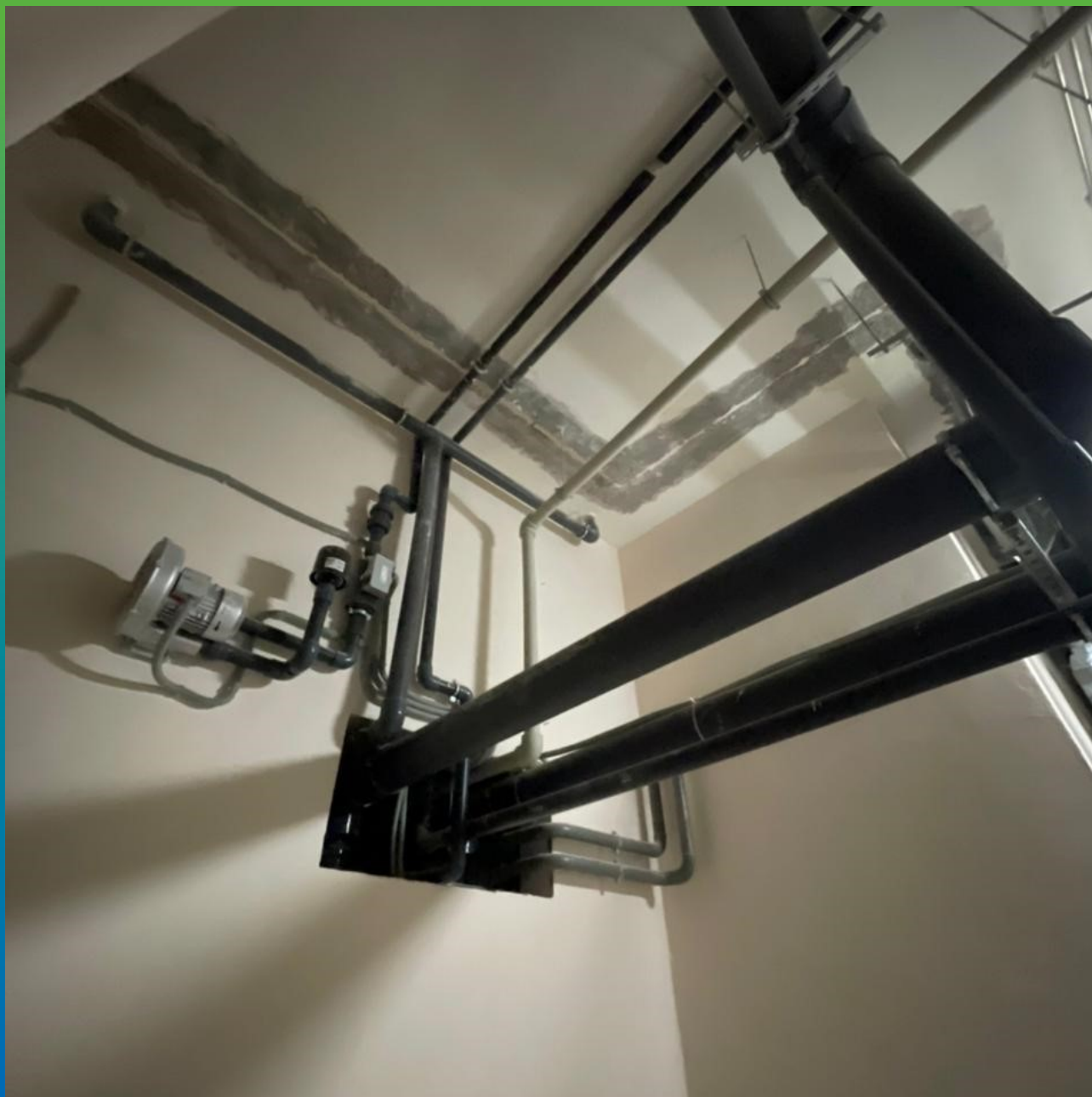
Поверхность шва, подготовленная к монтажу ЭПДМ ленты Преласта СТ на Манодил Бонд Ф