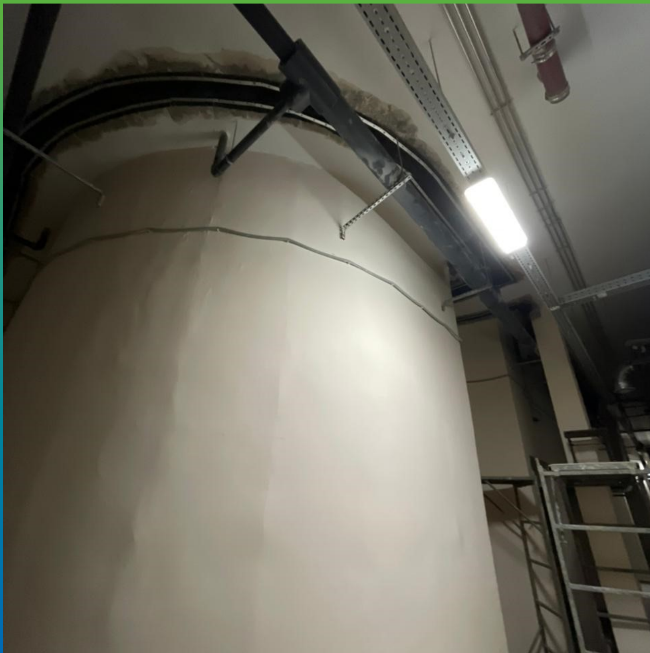
Лента Преласты СТ, монтированная на шов