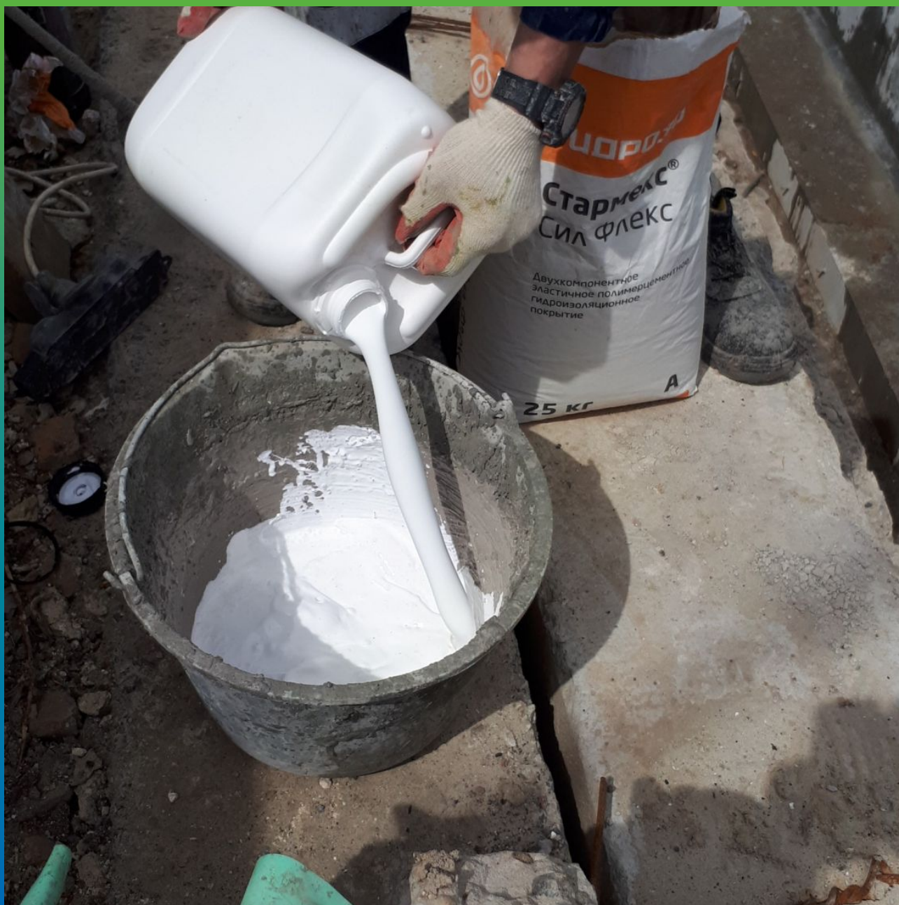
Выливаем акрил от Стармекс Сил Флекс в емкость