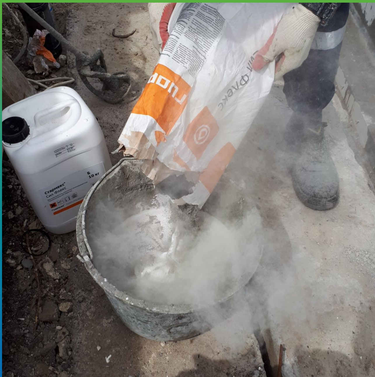
Засыпаем сухой компонент от Стармекс Сил Флекс