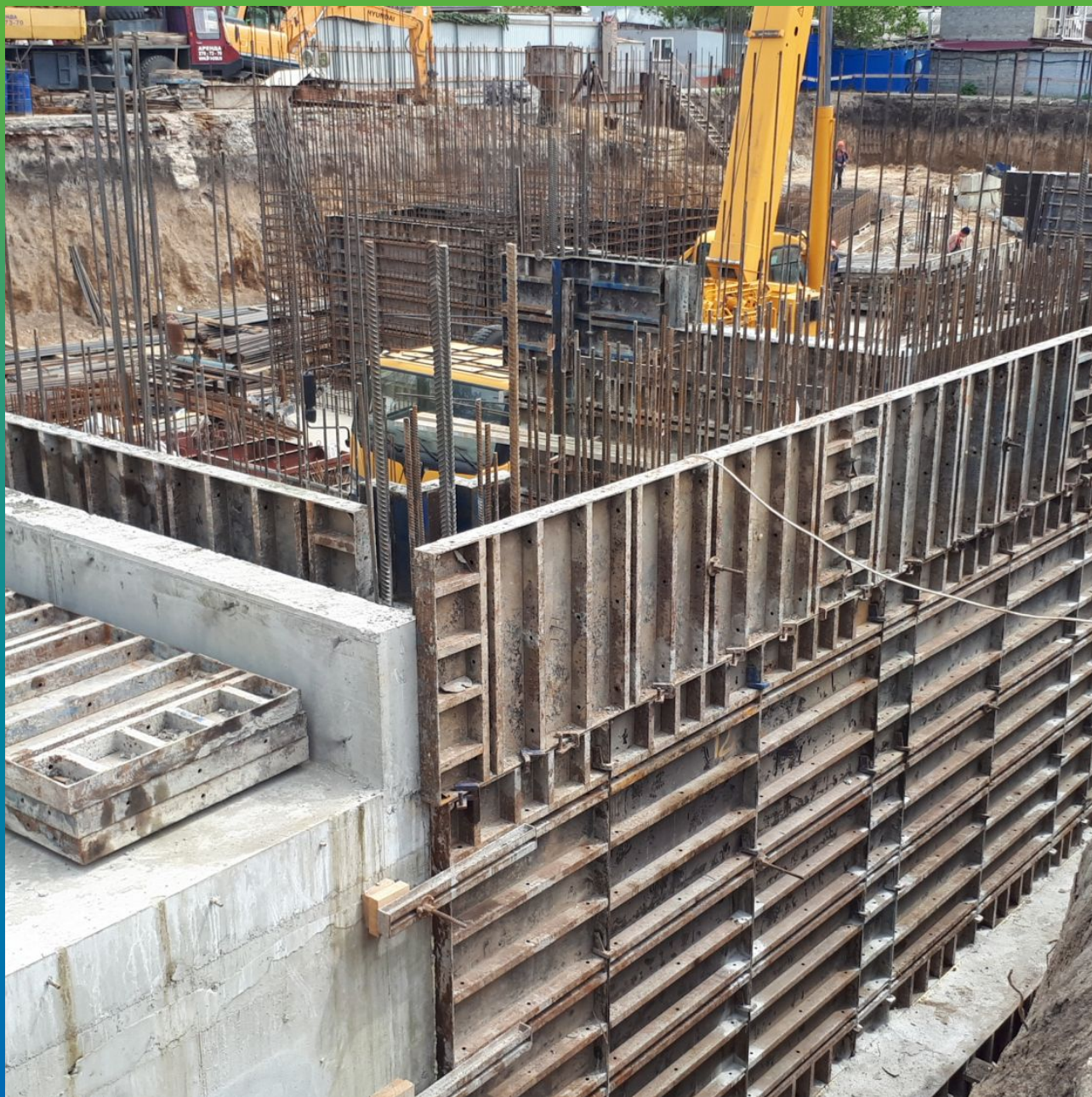
Общий вид ЖК Дом на 16-ой Линии