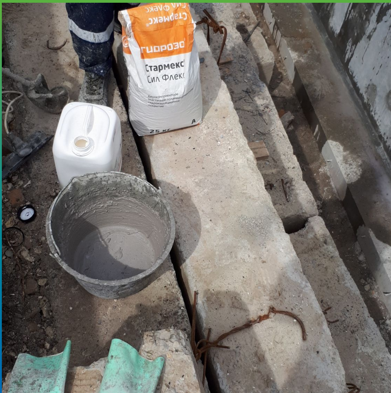
Материал Гидрозо на объекте