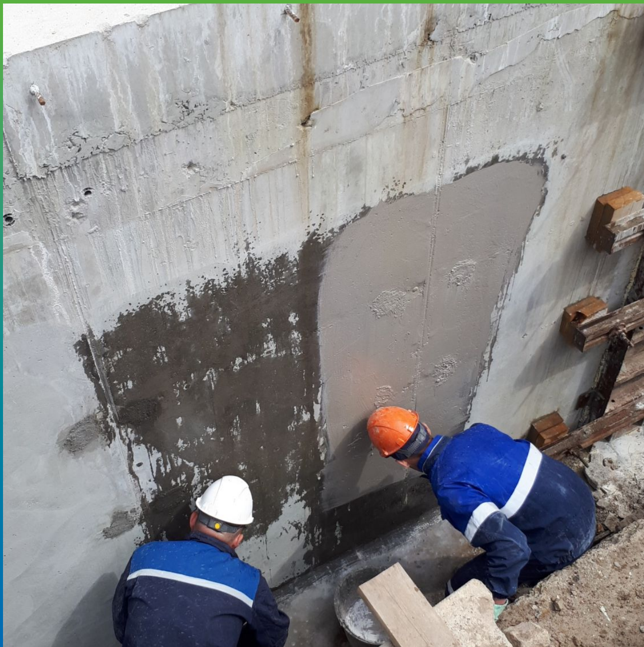
Увлажнение и нанесение состава Стармекс Сил Флекс на подготовленную поверхность