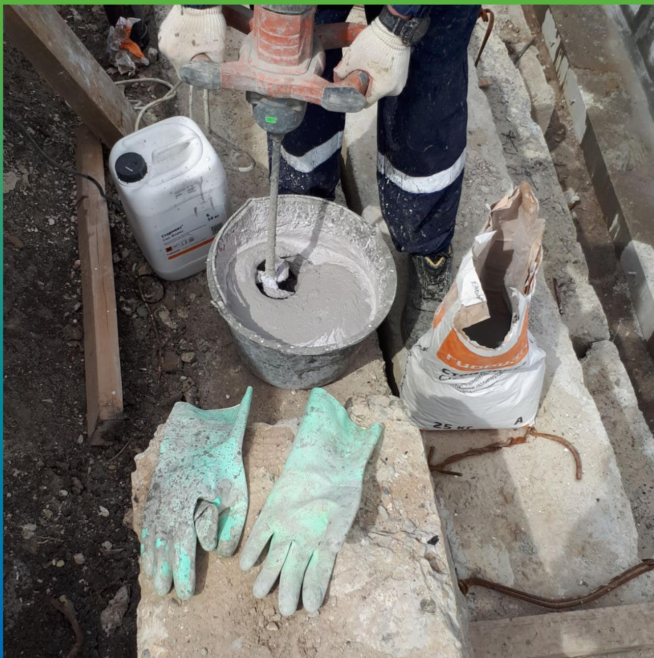
Смешиваем эластичную гидроизоляцию Стармекс Сил Флекс