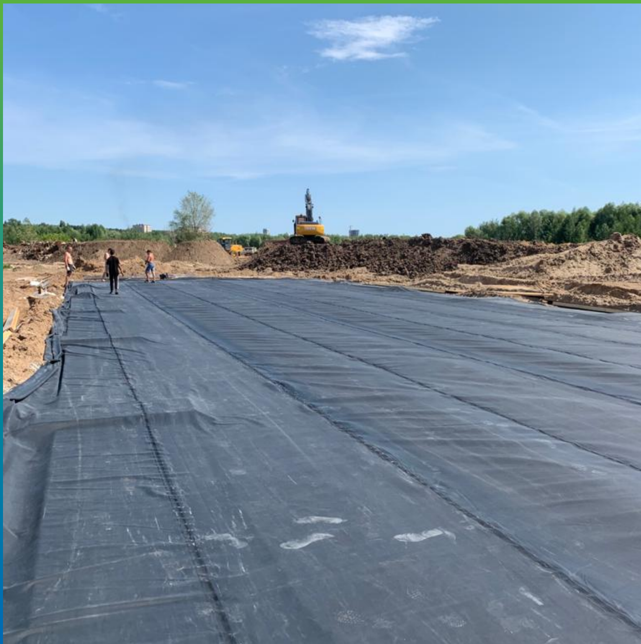
Мембрана, уложенная на основание