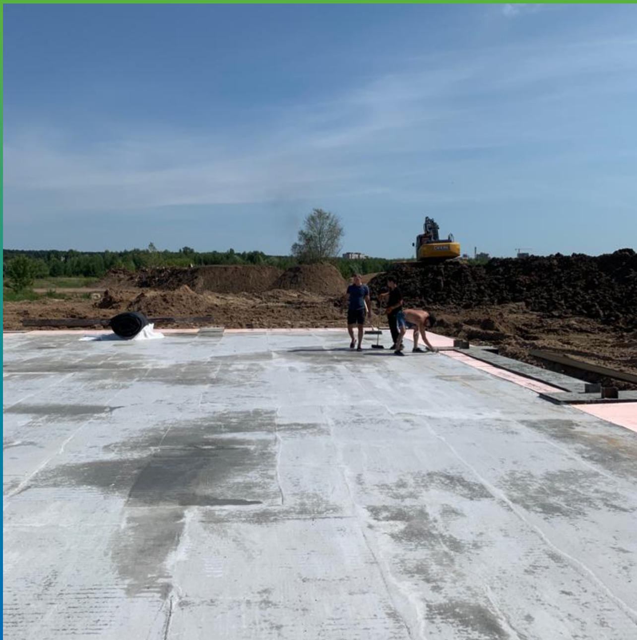
Подготовка площадки к укладке мембраны