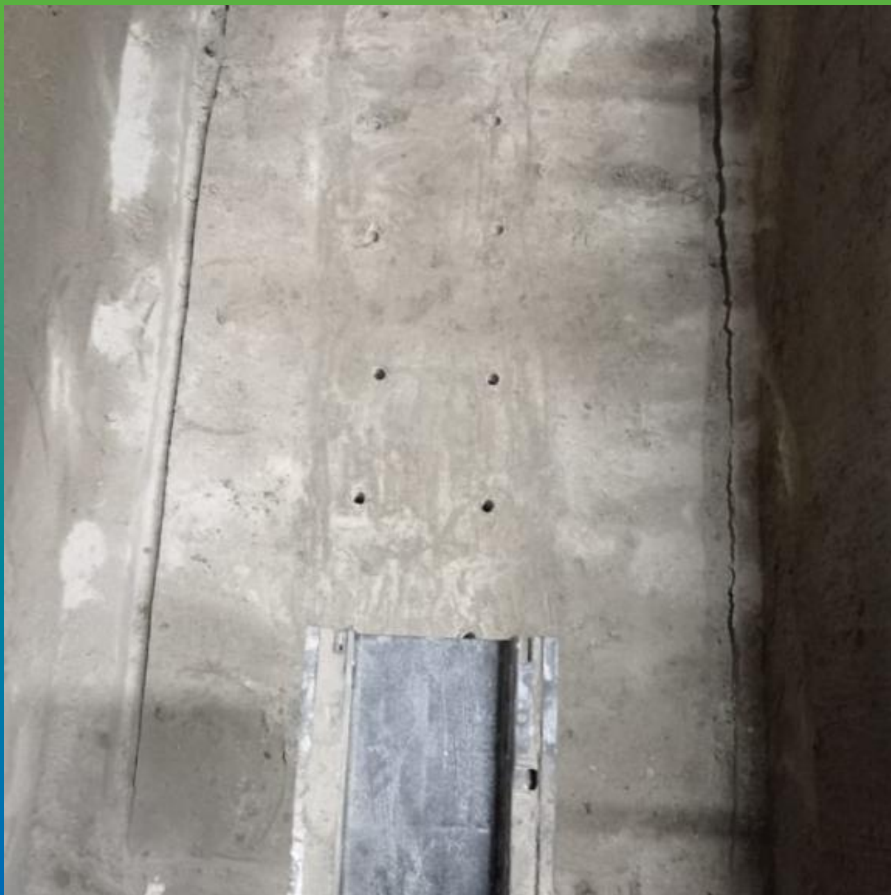
Шпуры, пробуренные для заливки Маноцем ТНТ