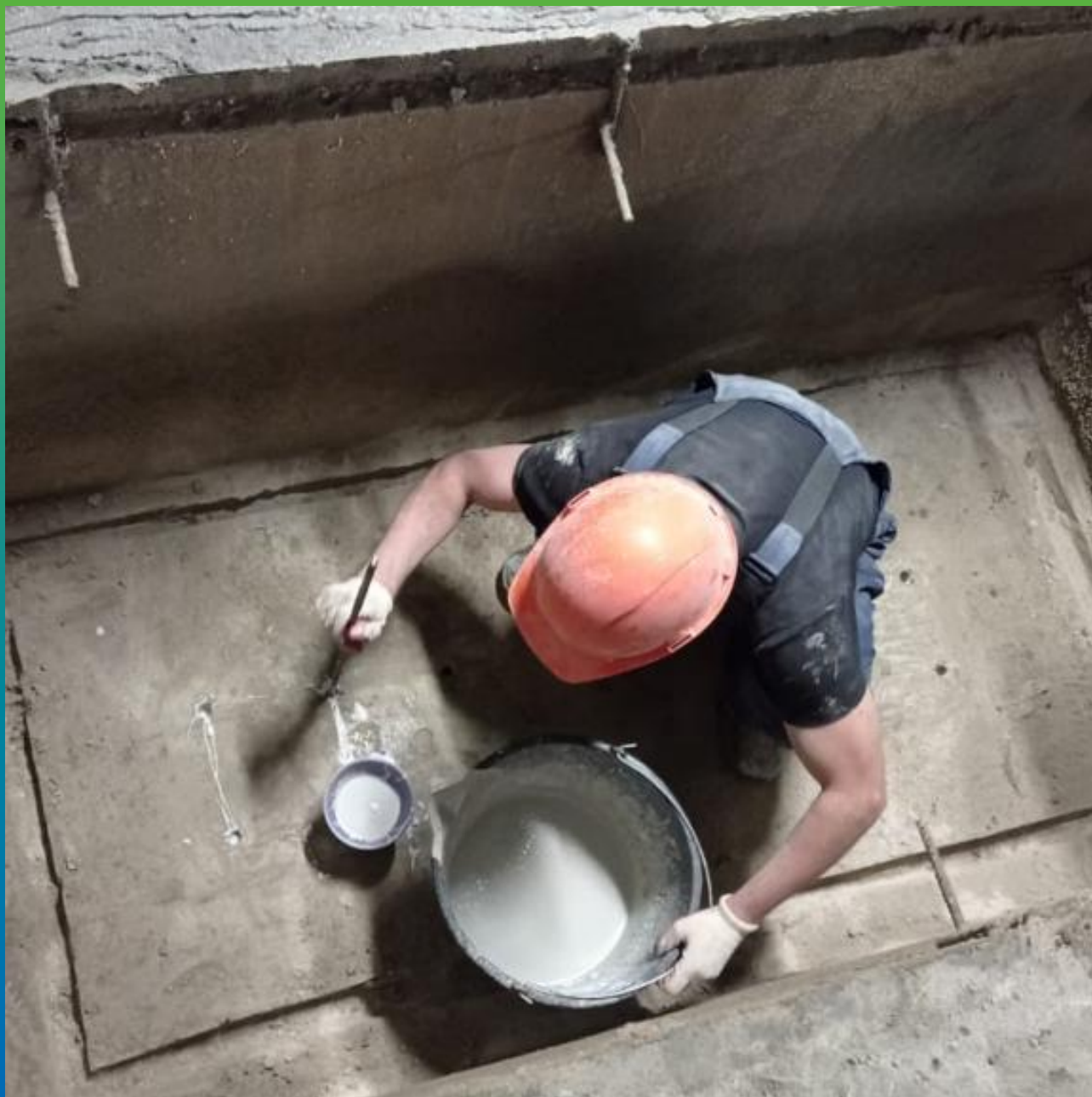
Заливка Маноцем ТНТ