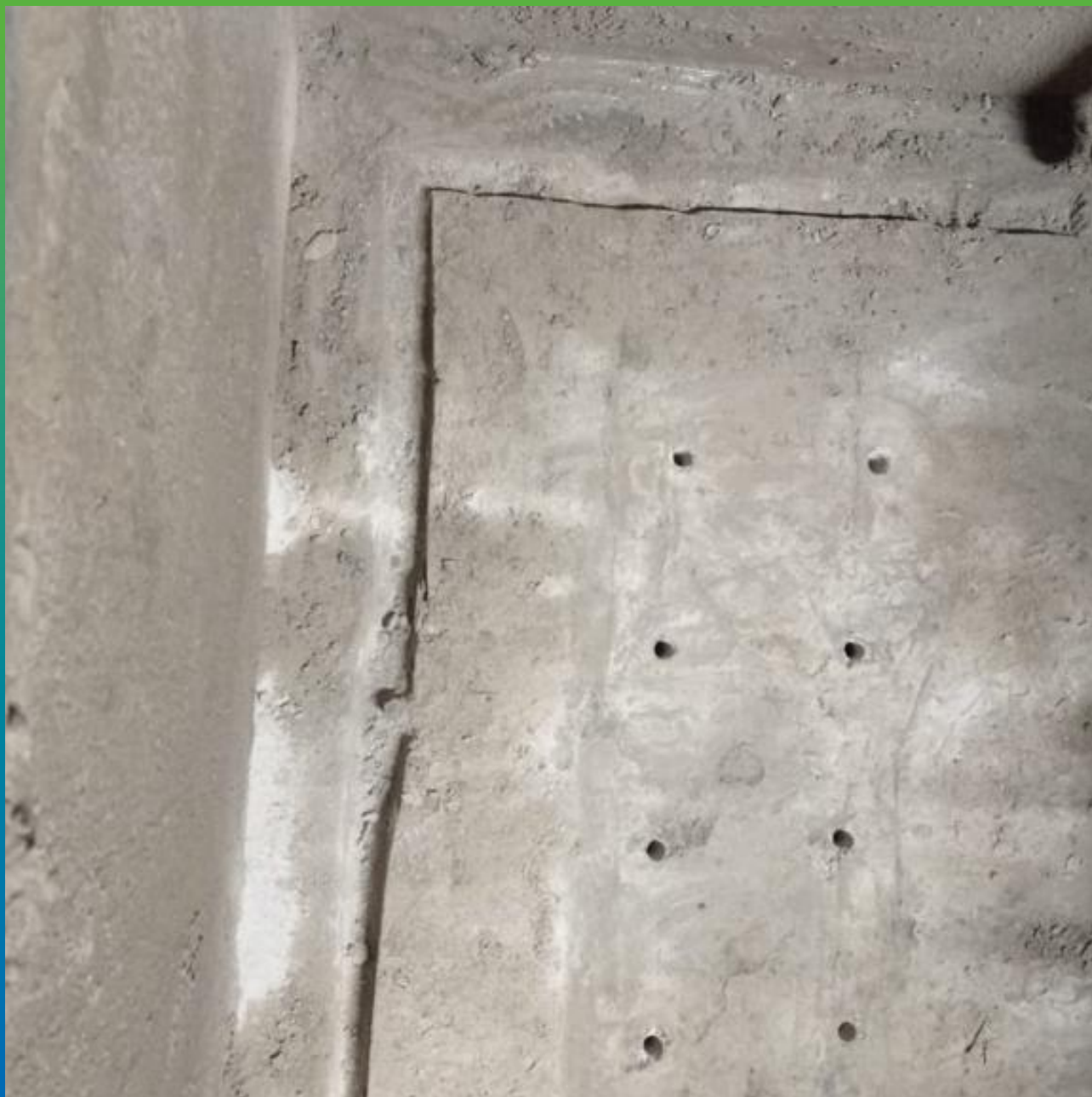
Шпуры, пробуренные для заливки Маноцем ТНТ