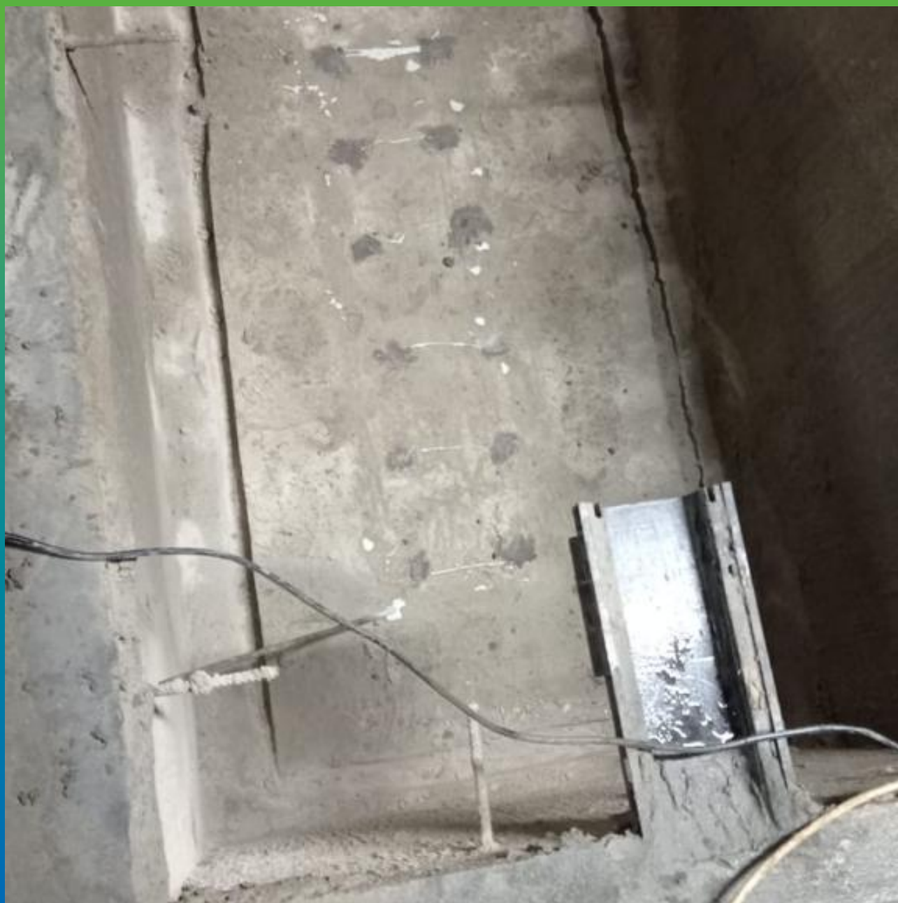
Отверстия, залитые Маноцем ТНТ