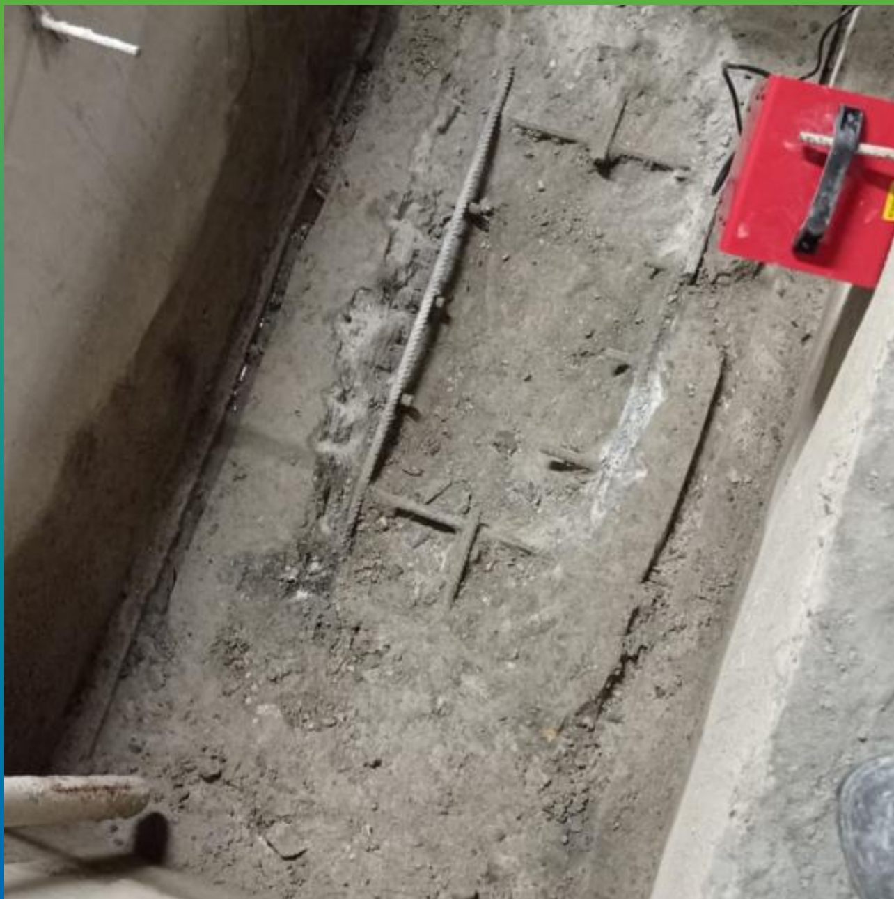
Выемка разрушенного бетона