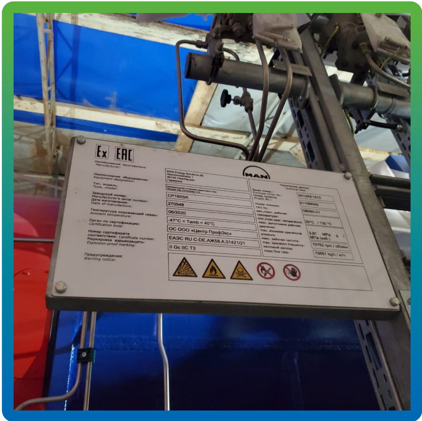
Компрессор к монтажу