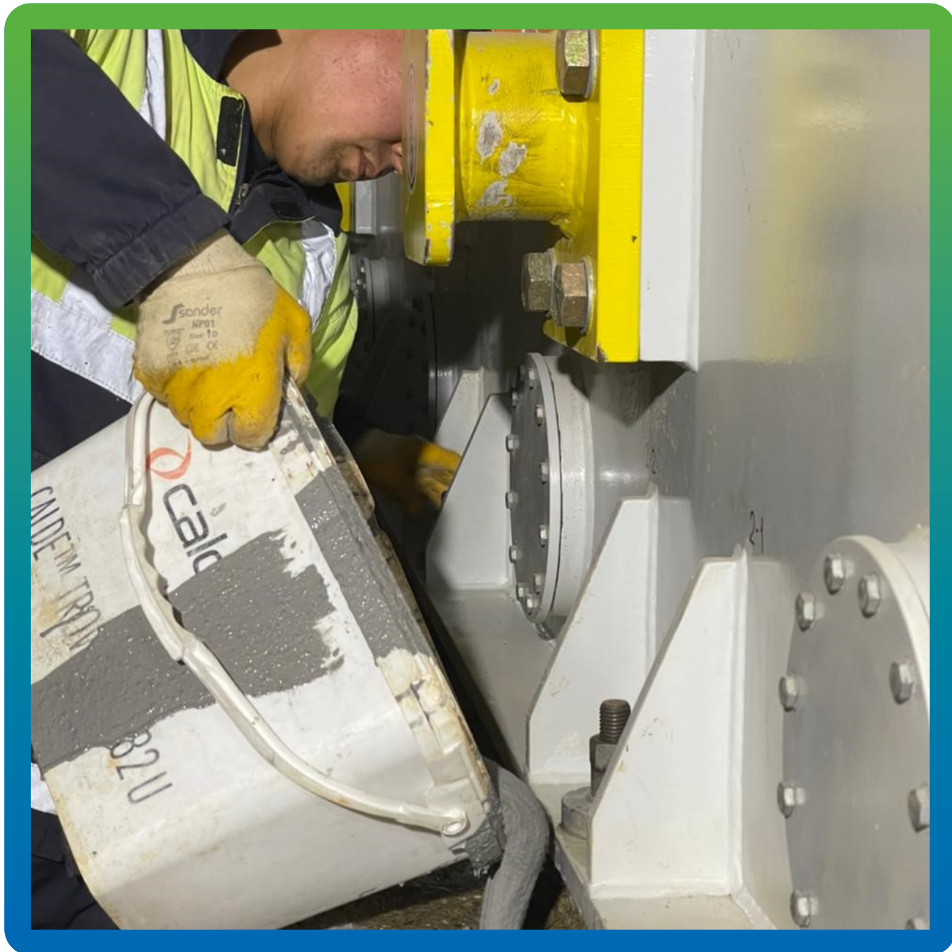
Подача готового состава в анкерные колодцы