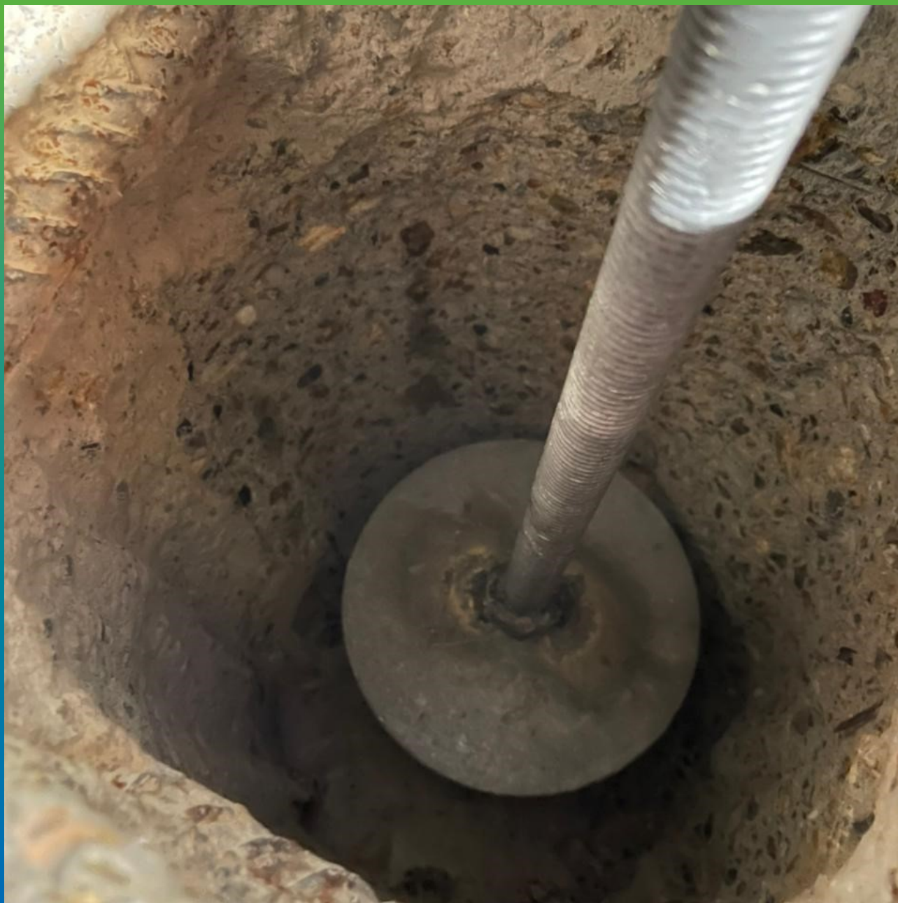
Анкерные колодцы под заливку