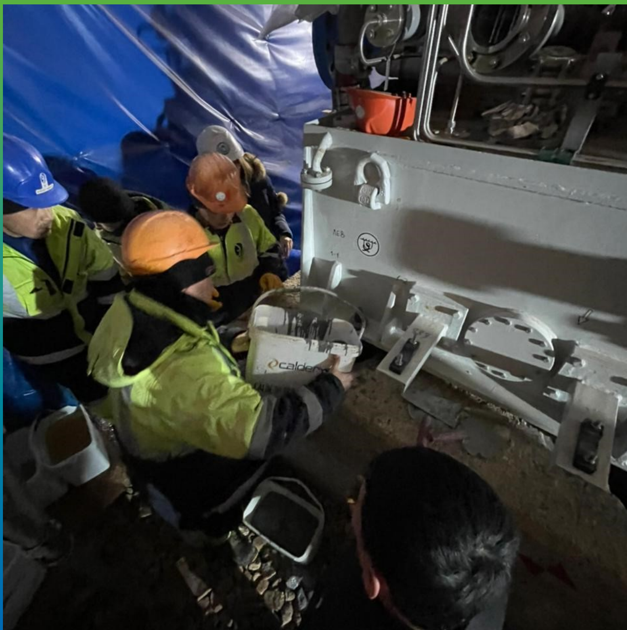
Подача готового состава в анкерные колодцы