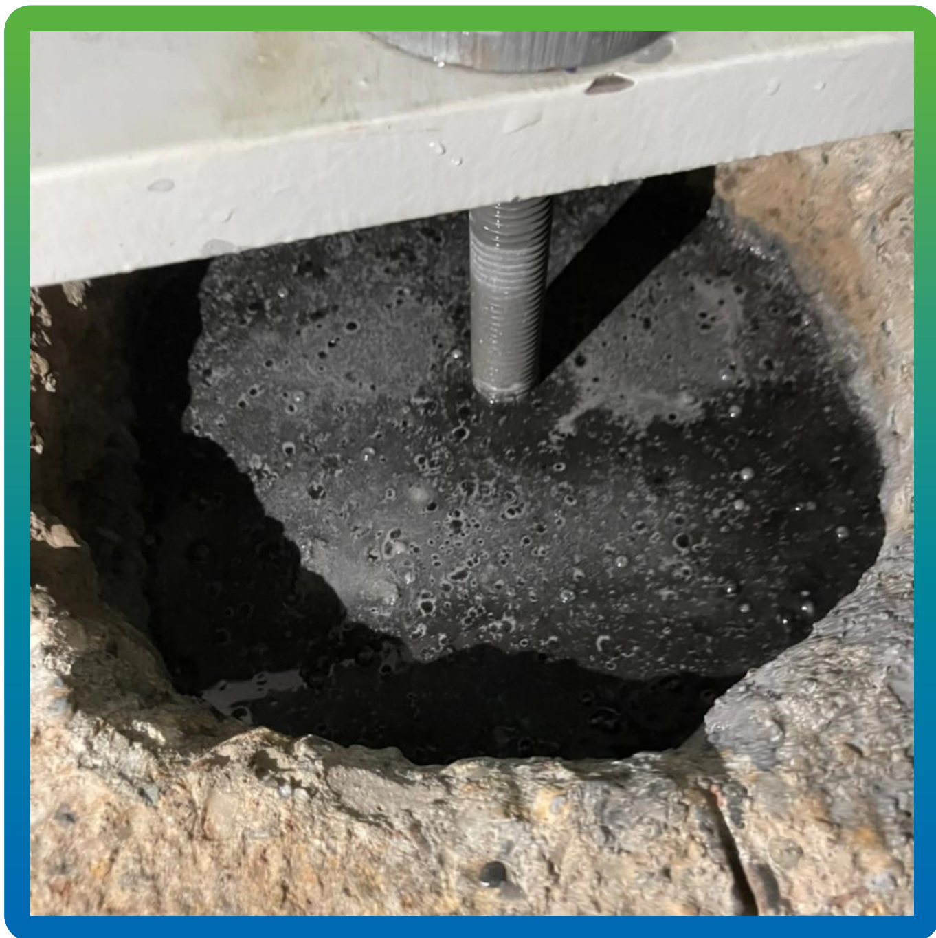
Подача готового состава в анкерные колодцы