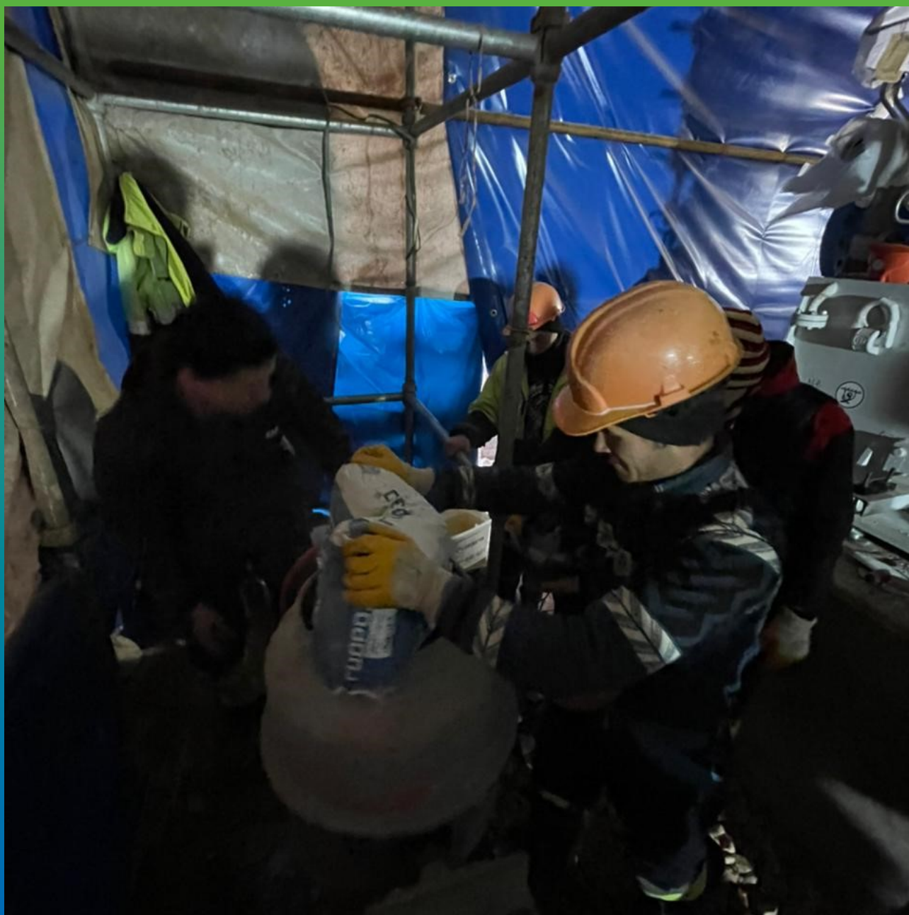
Замешивание подливочного состава Стамекс ФМ100 в гравитационной бетономешалке