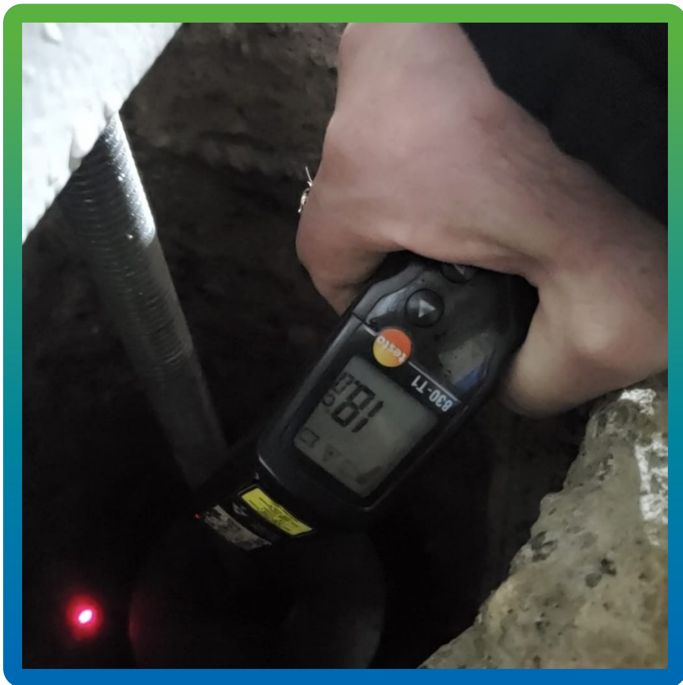
Контроль температуры основания