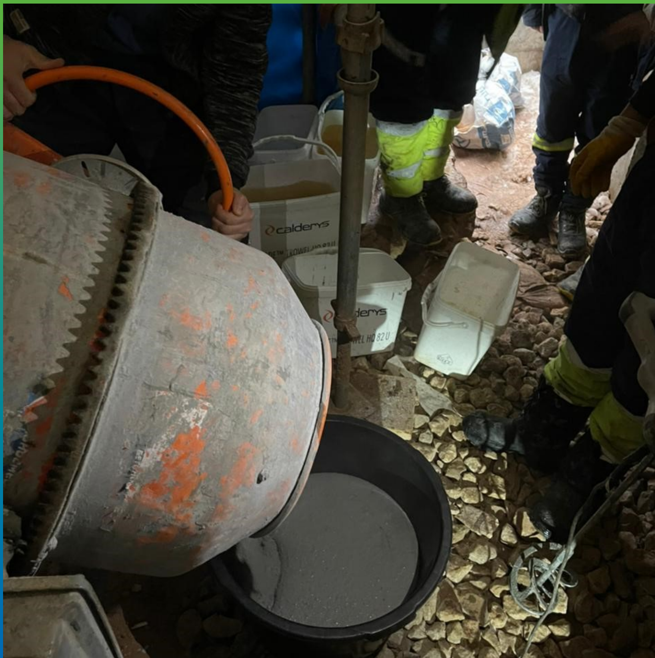
Дополнительное promeshivaniye ruchnym dvukhlopastnym mikserom.