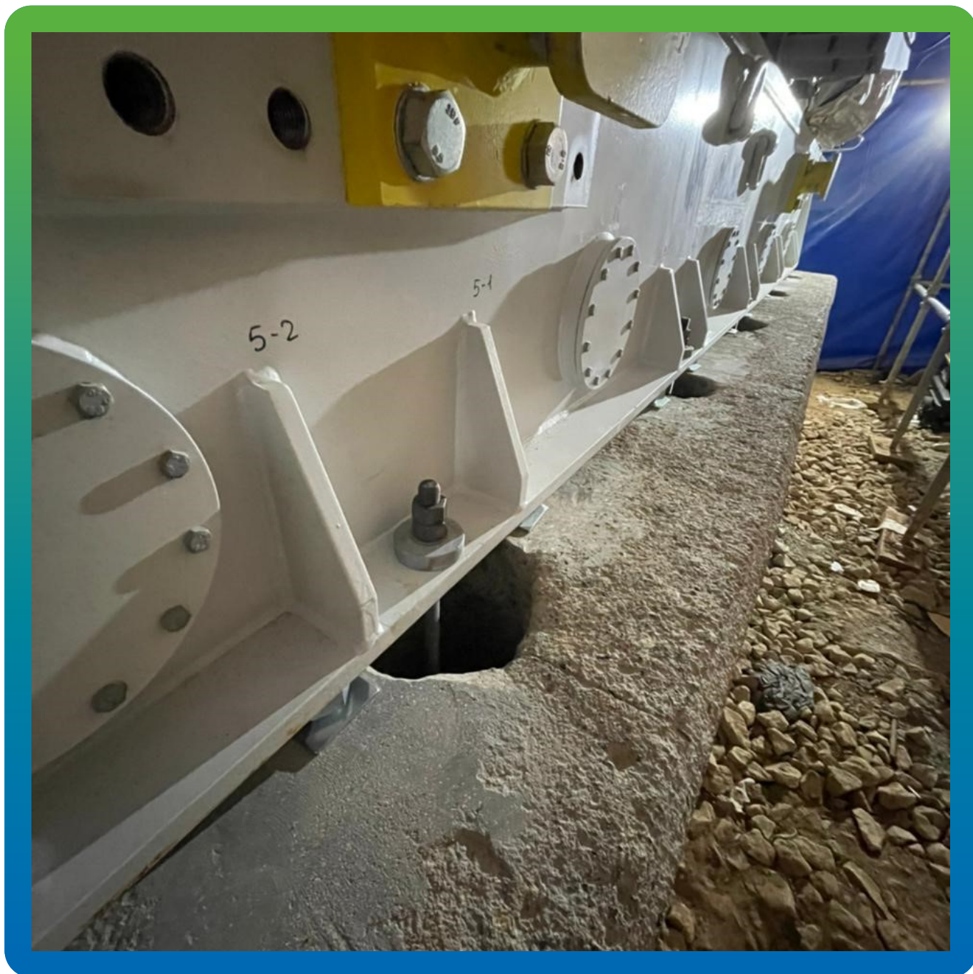
Анкерные колотцы под заливку