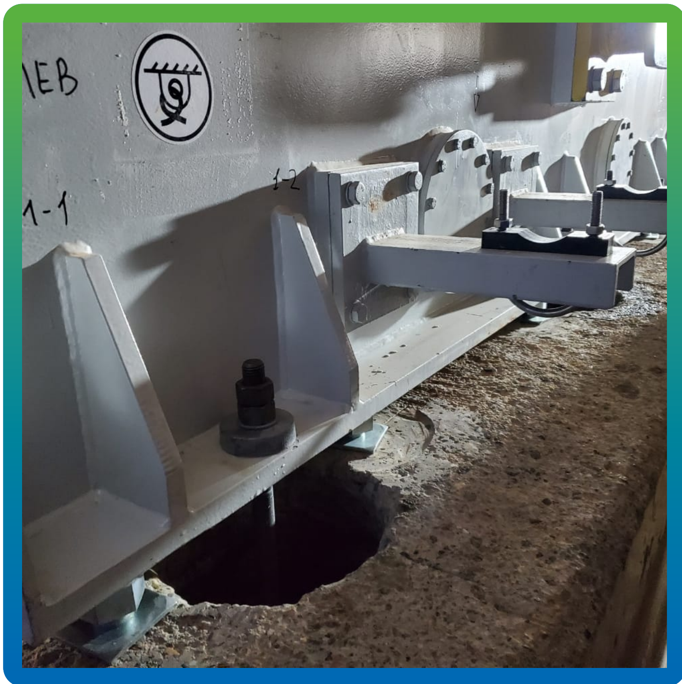
Анкерные колодцы под заливку