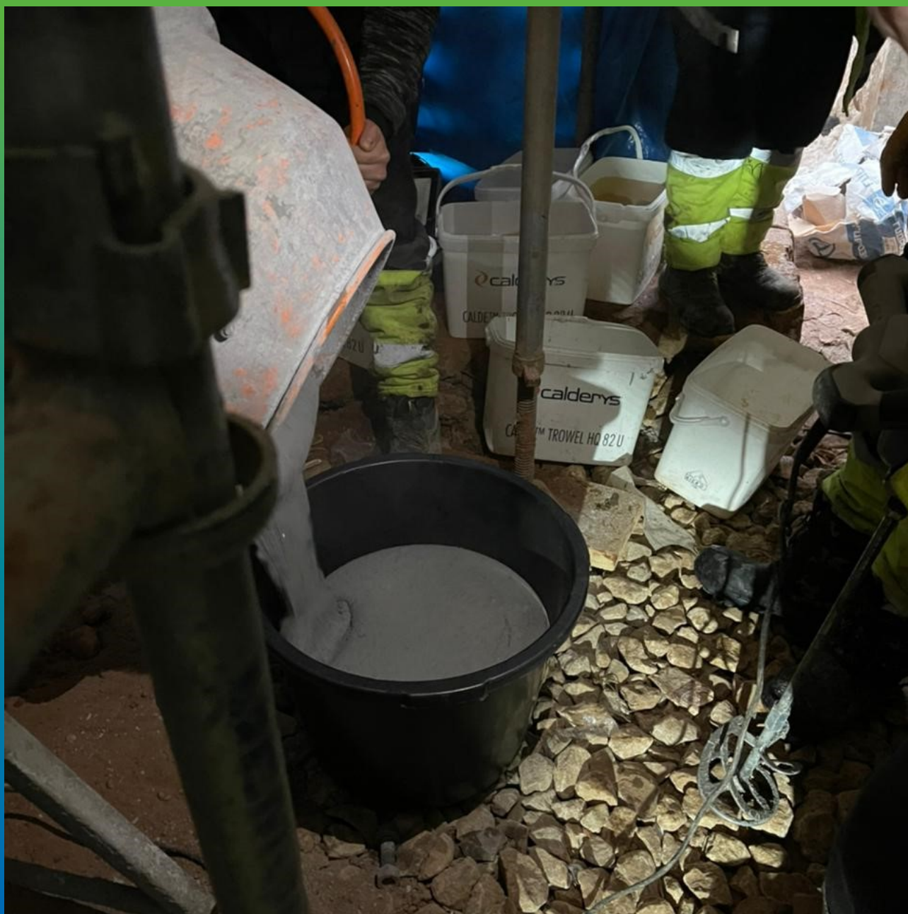
Дополнительное promeshivaniye ruchnym dvukhlopastnym mikserom.