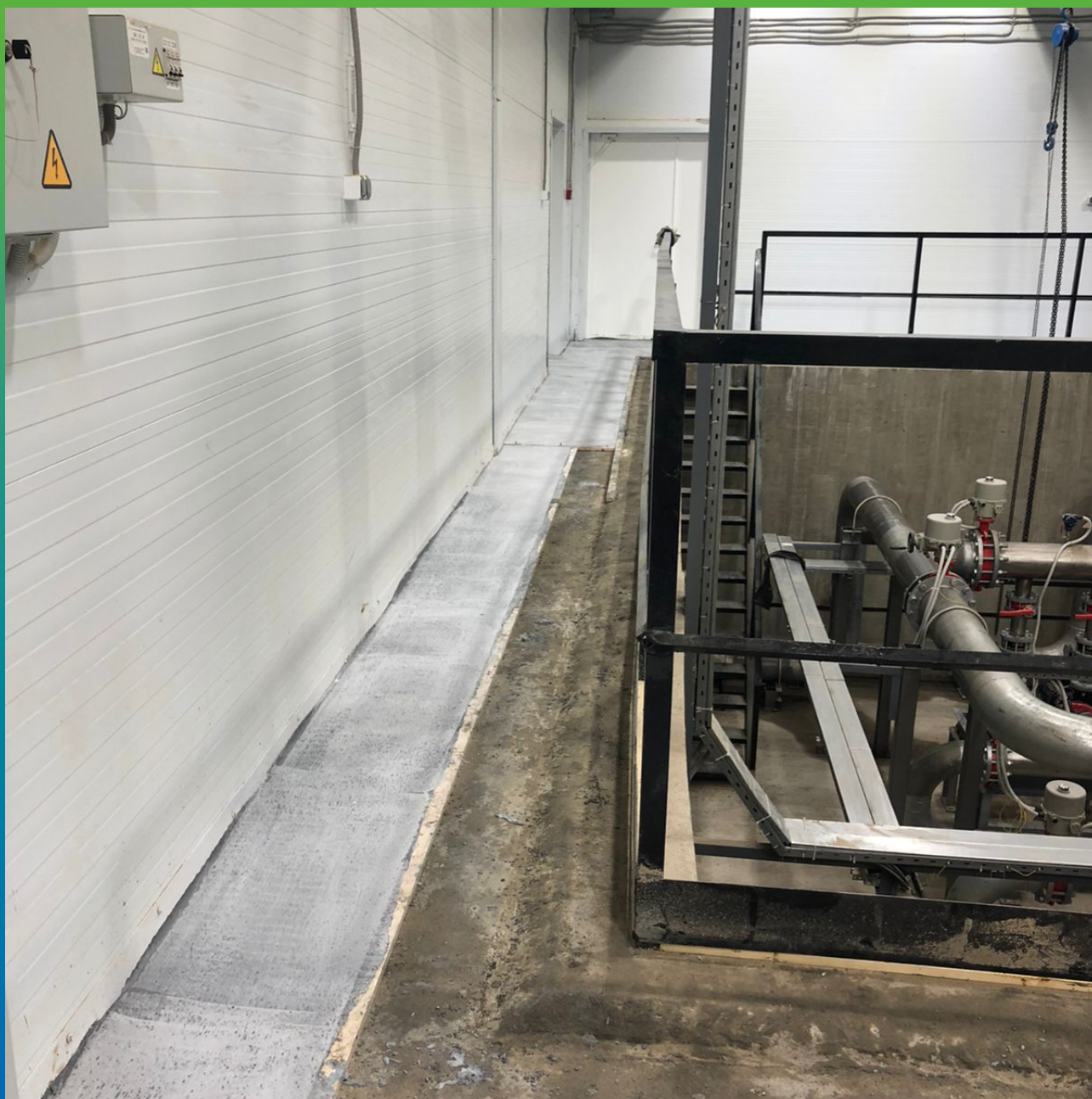
Выравнивание плиты пола литьевым Составом Стармекс ФМ7