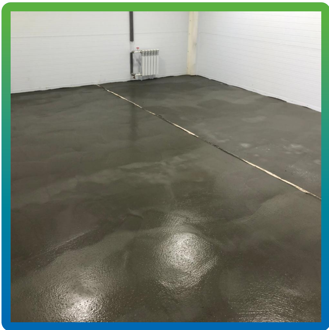
Внешний вид объекта, после завершения работ