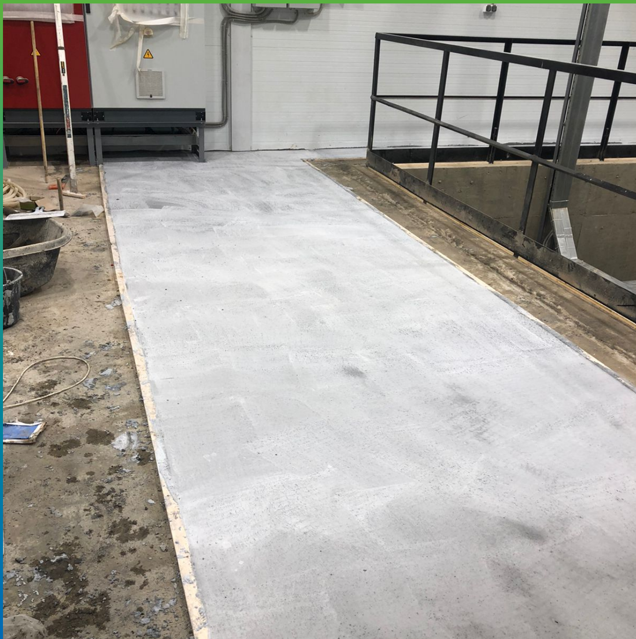
Выравнивание плиты пола литьевым Составом Стармекс ФМ7