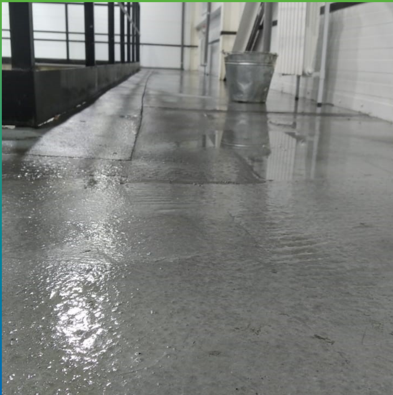
Выравнивание плиты пола литьевым Составом Стармекс ФМ7