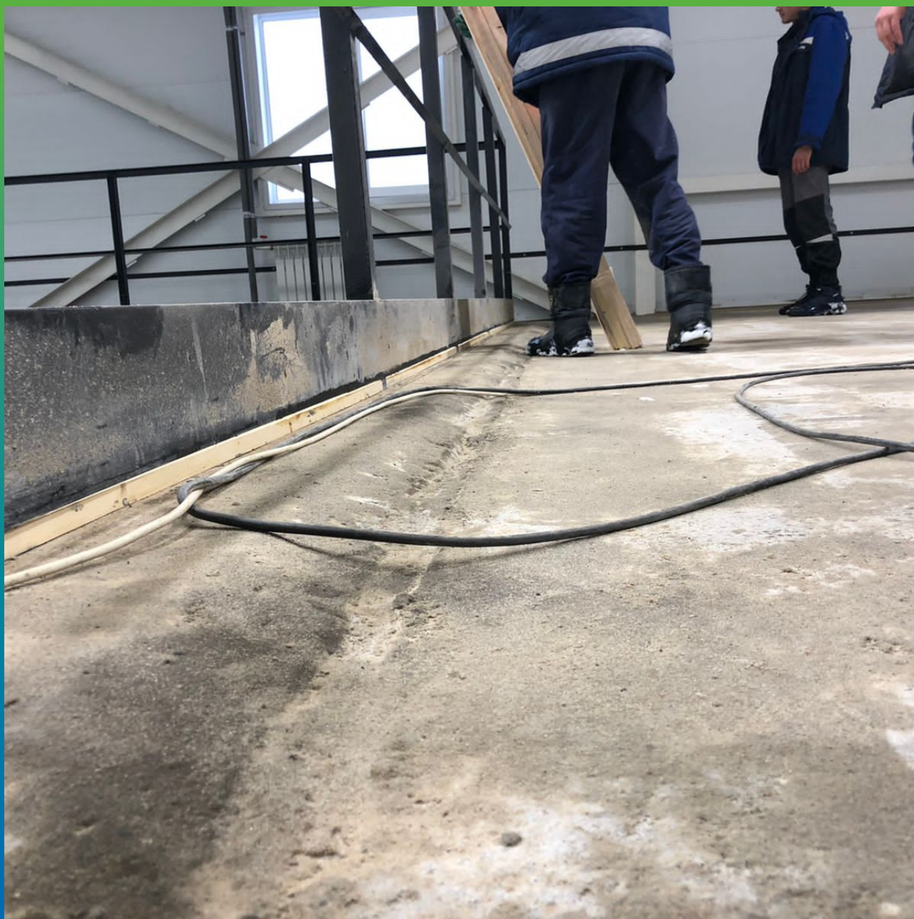
Плита пола, загрунтованная эпоксидным составом ДенсТоп ЭП100