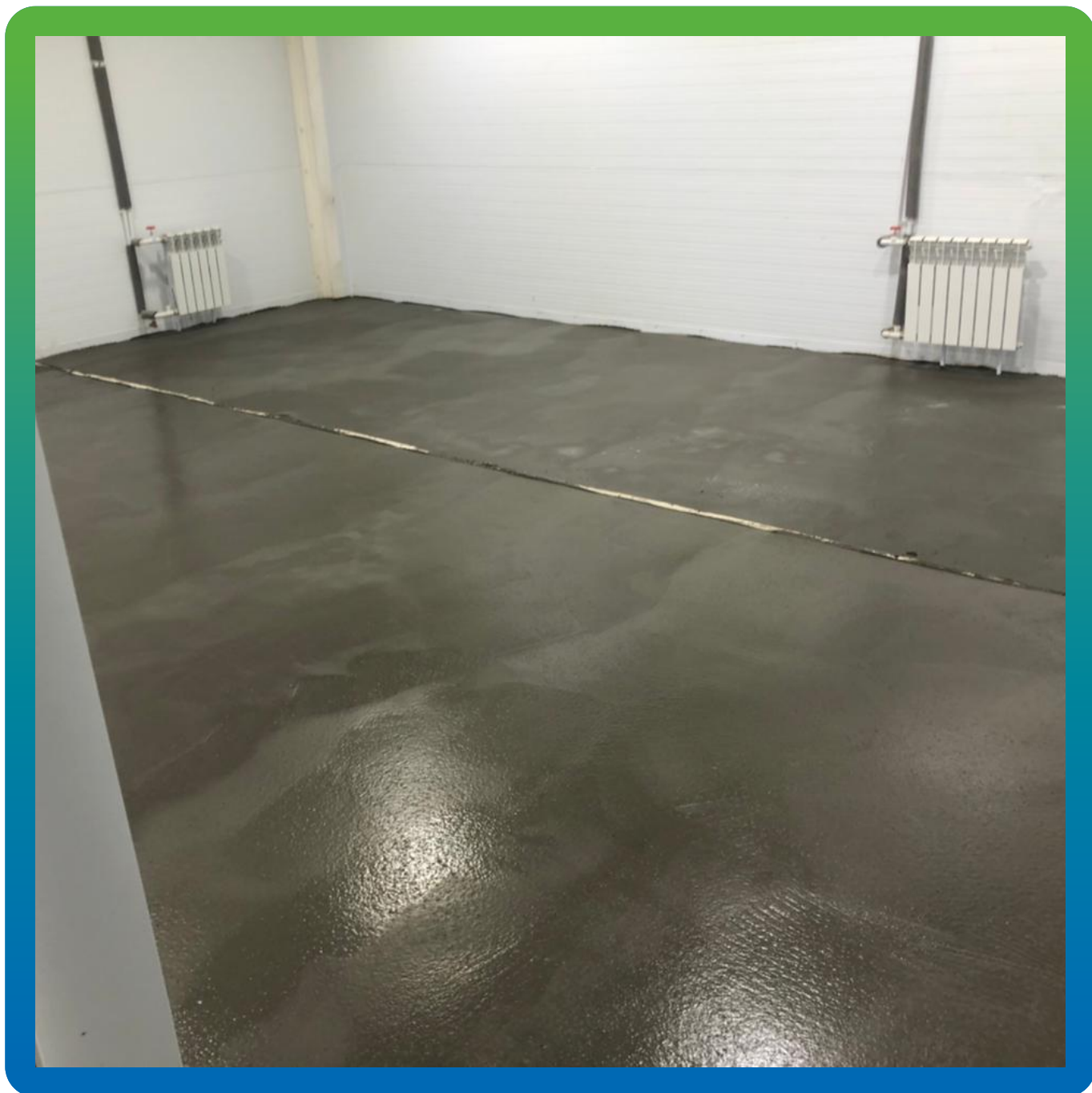
Внешний вид объекта, после завершения работ