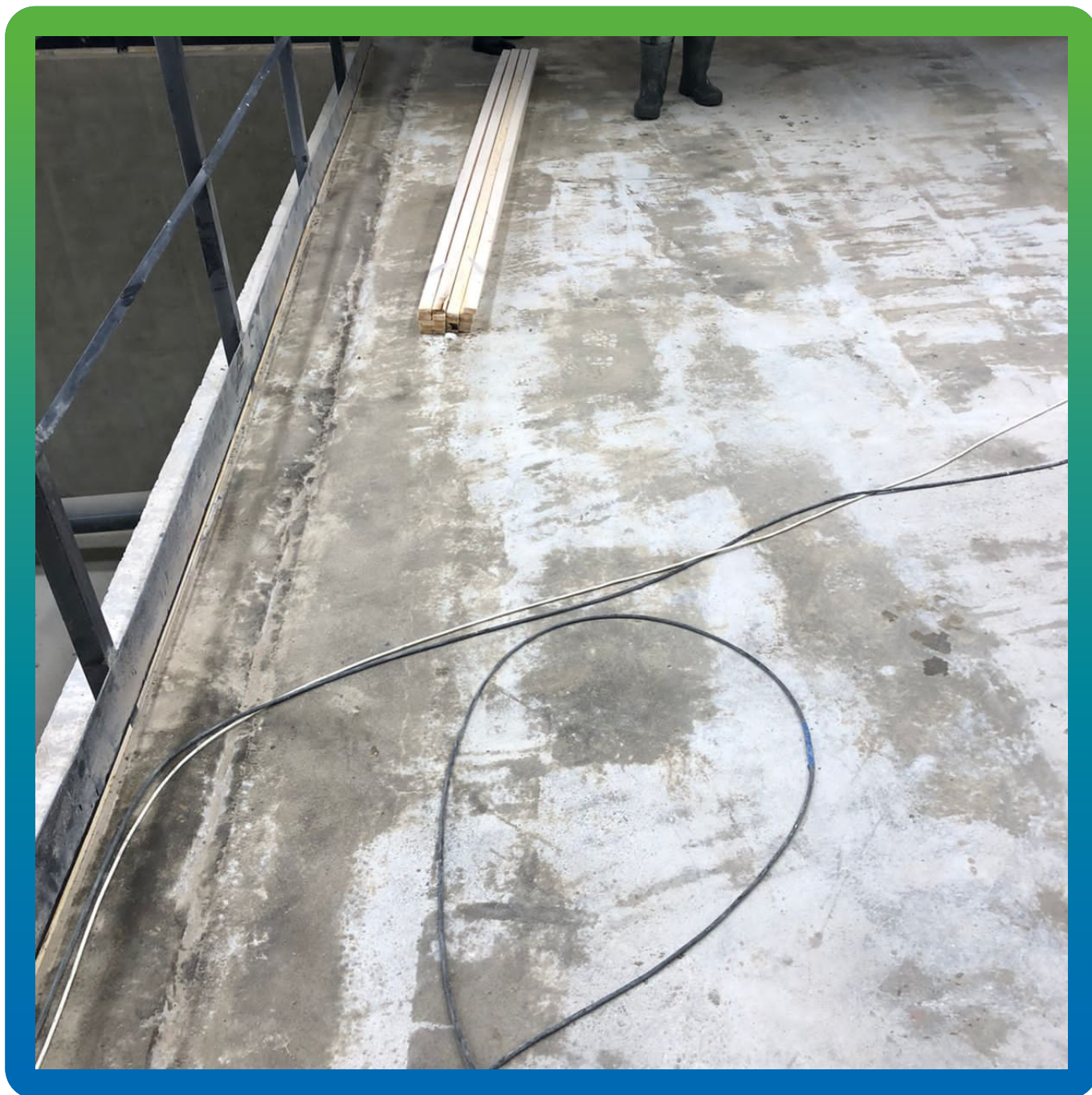
Плита пола, загрунтованная эпоксидным составом ДенсТоп ЭП100