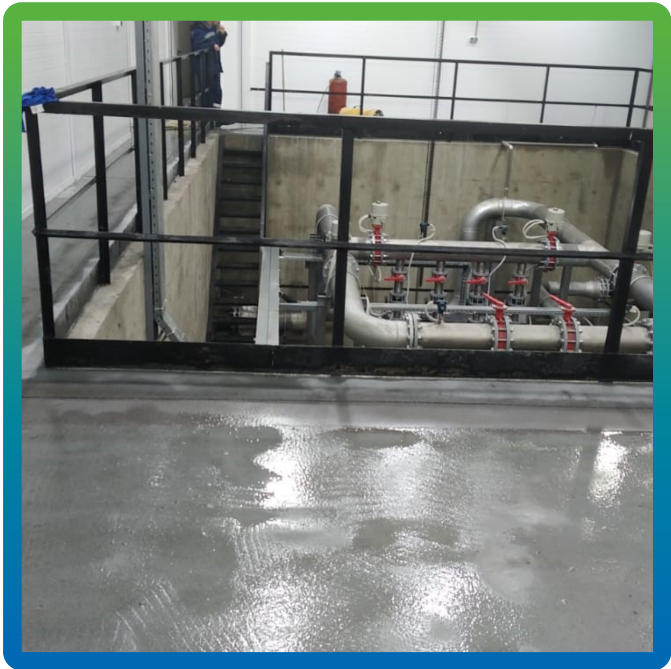
Внешний вид объекта, после завершения работ