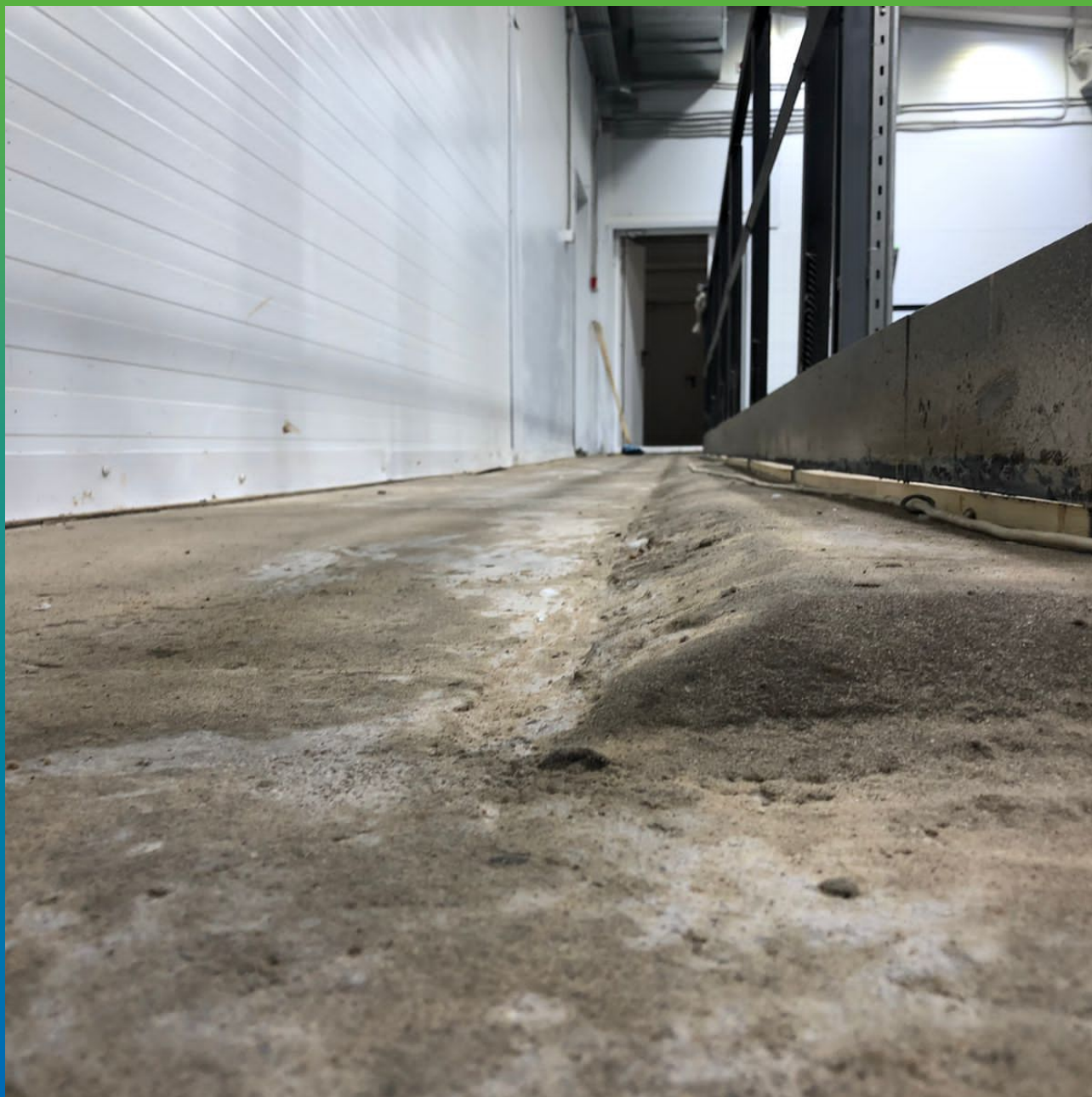
Плита пола, загрунтованная эпоксидным составом ДенсТоп ЭП100