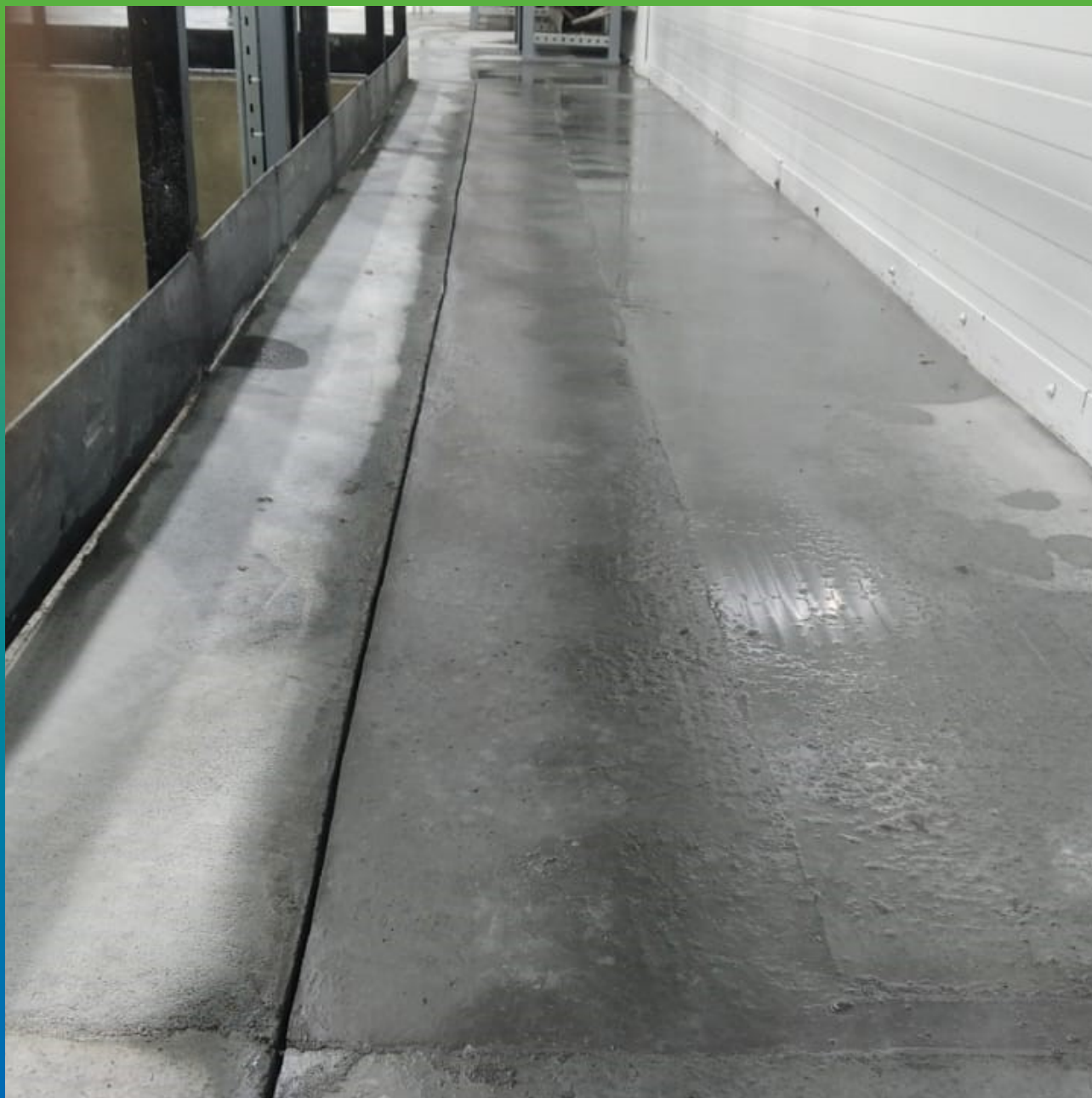
Выравнивание плиты пола литьевым Составом Стармекс ФМ7