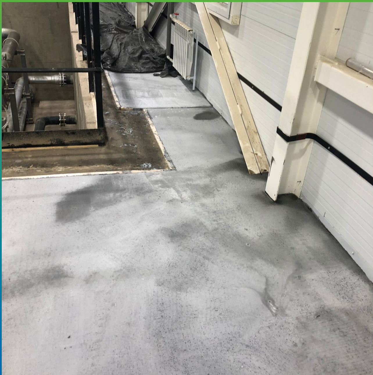
Выравнивание плиты пола литьевым Составом Стармекс ФМ7