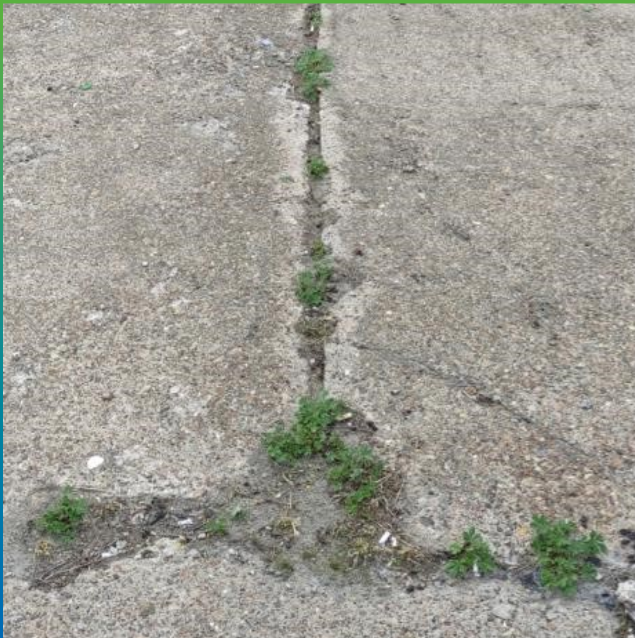
Внешний вид объекта до начала работ