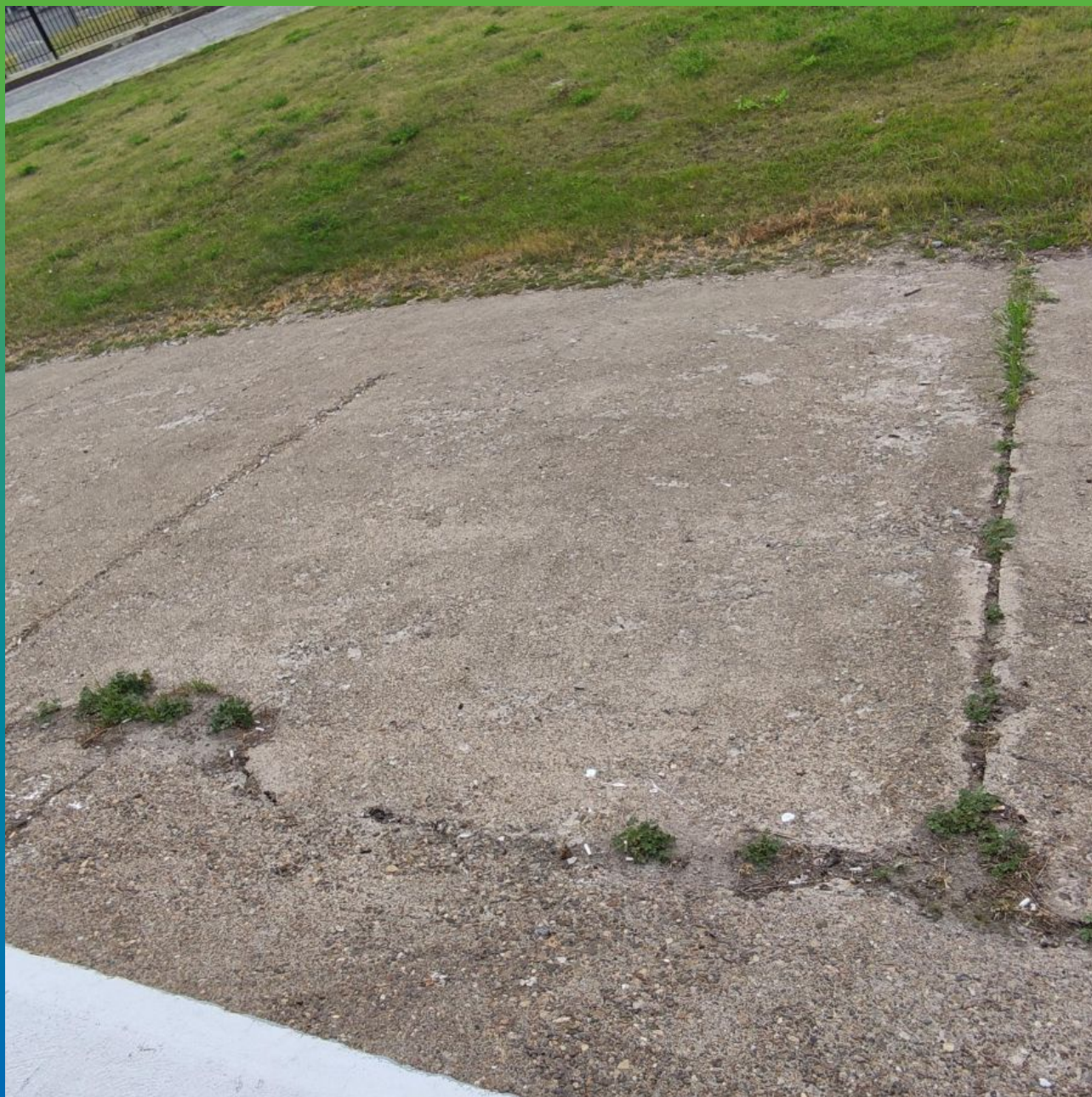
Внешний вид объекта до начала работ