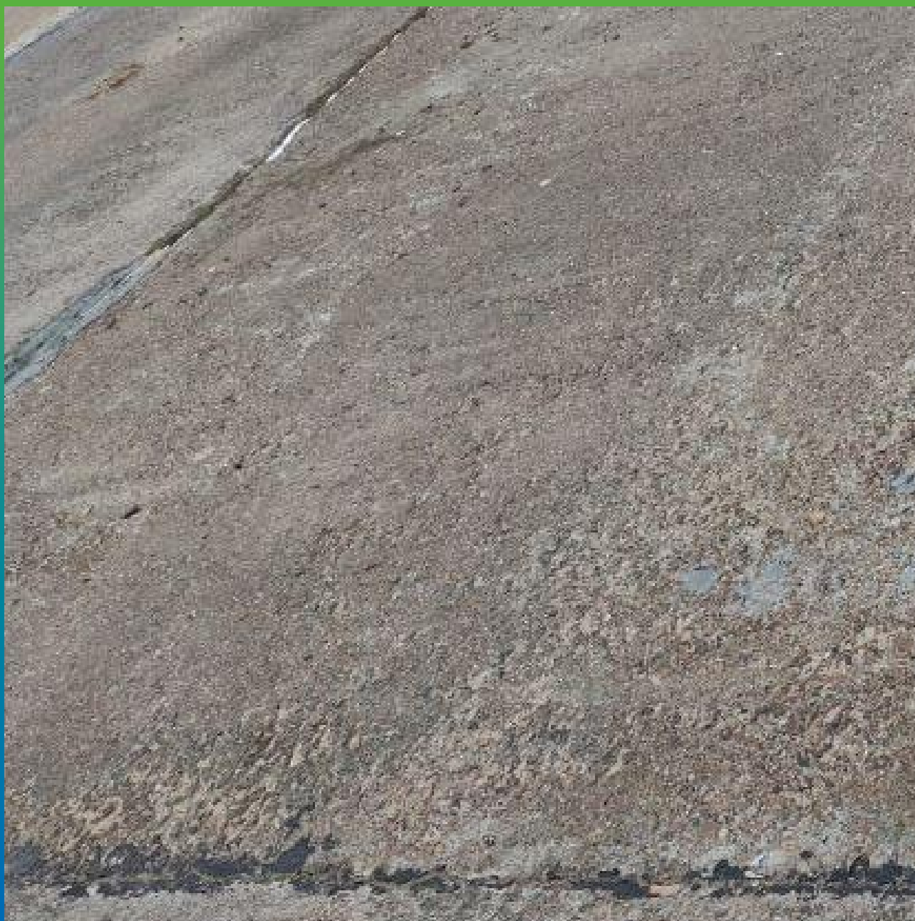
Внешний вид объекта до начала работ