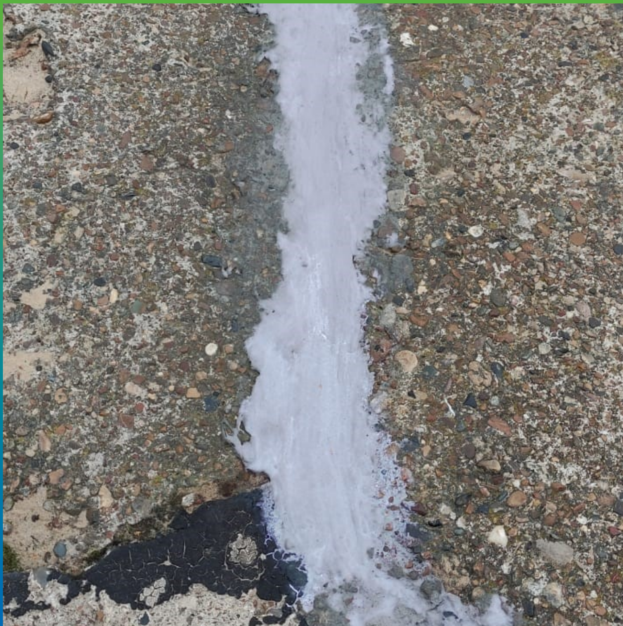
Швы, герметизированные составом Манодил Цем