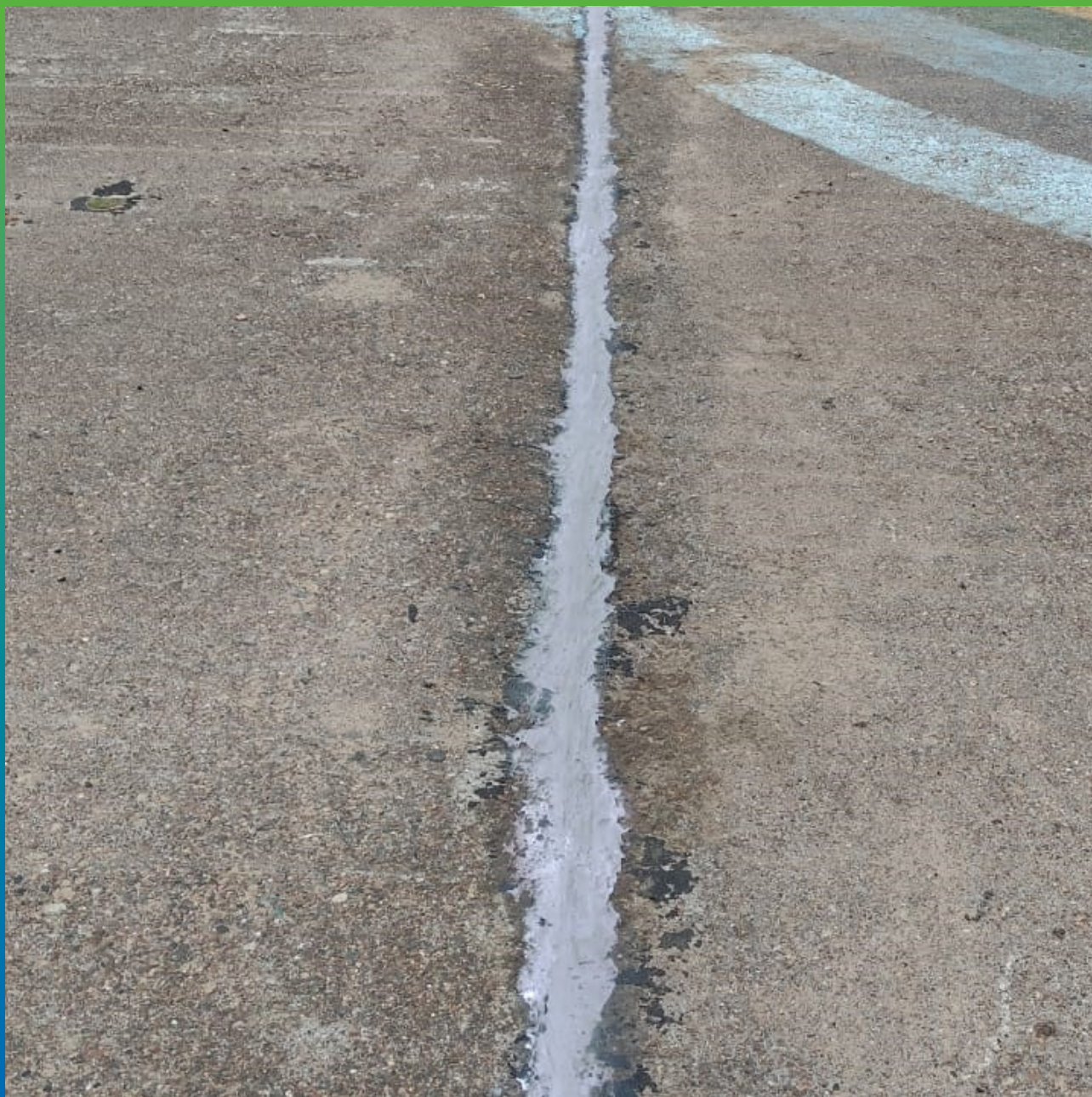
Швы, герметизированные составом Манодил Цем