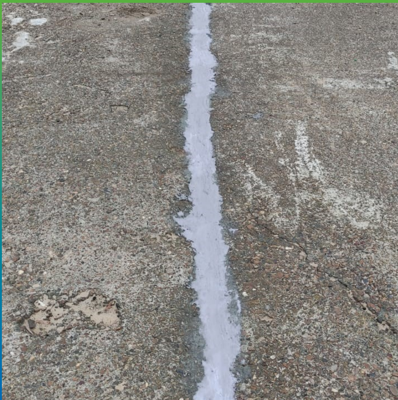
Швы, герметизированные составом Манодил Цем