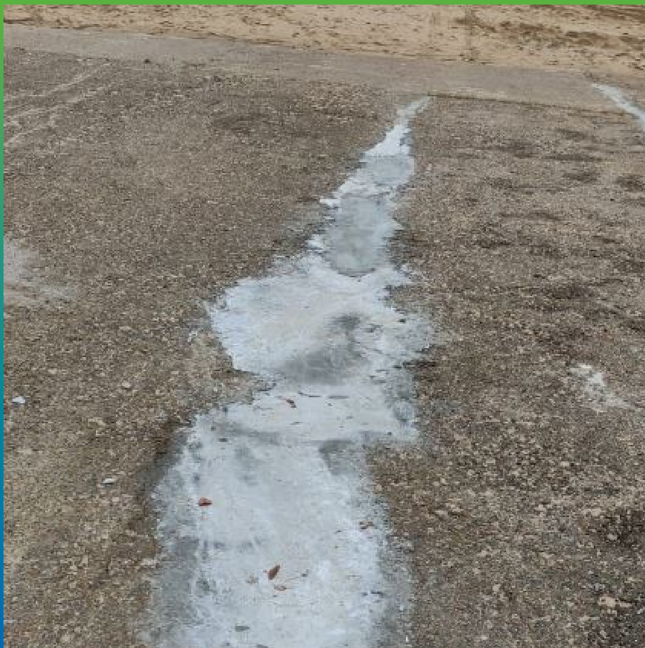
Швы, герметизированные составом Манодил Цем