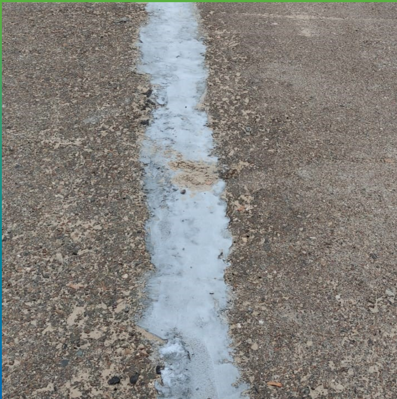
Швы, герметизированные составом Манодил Цем