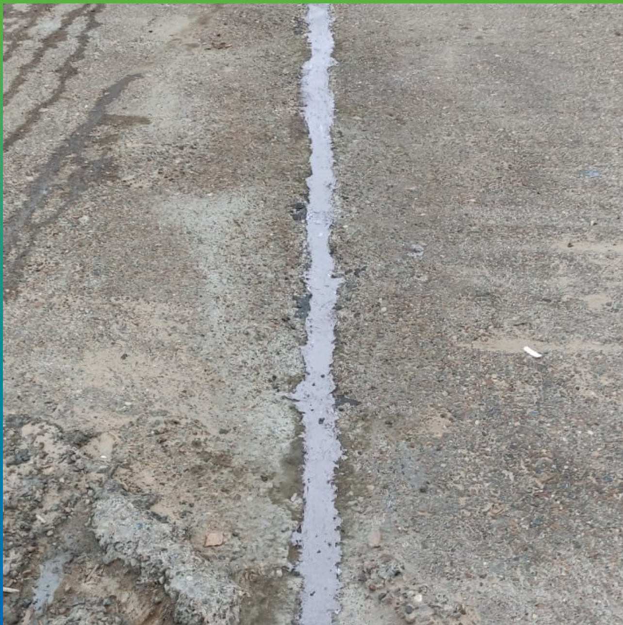
Швы, герметизированные составом Манодил Цем