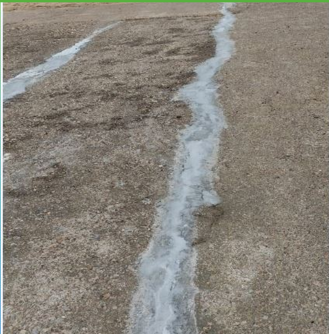
Швы, герметизированные составом Манодил Цем