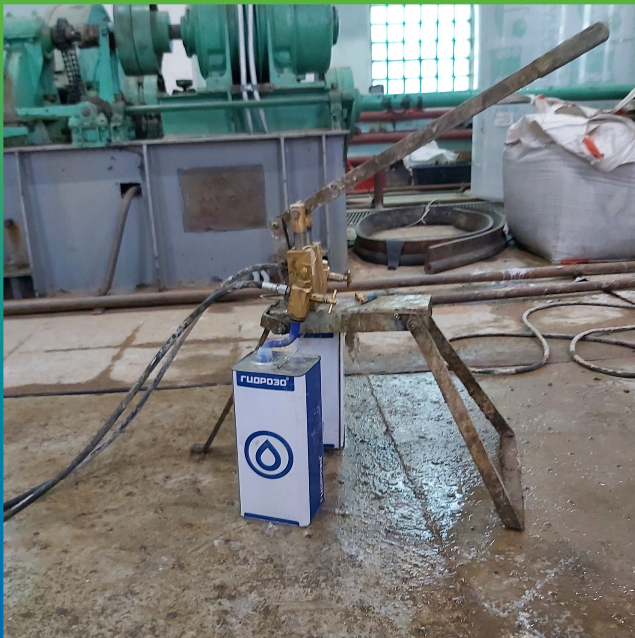
Двухкомпонетный ручной насос БМ 0305 и очиститель оборудования Манопур Клинер на объекте.