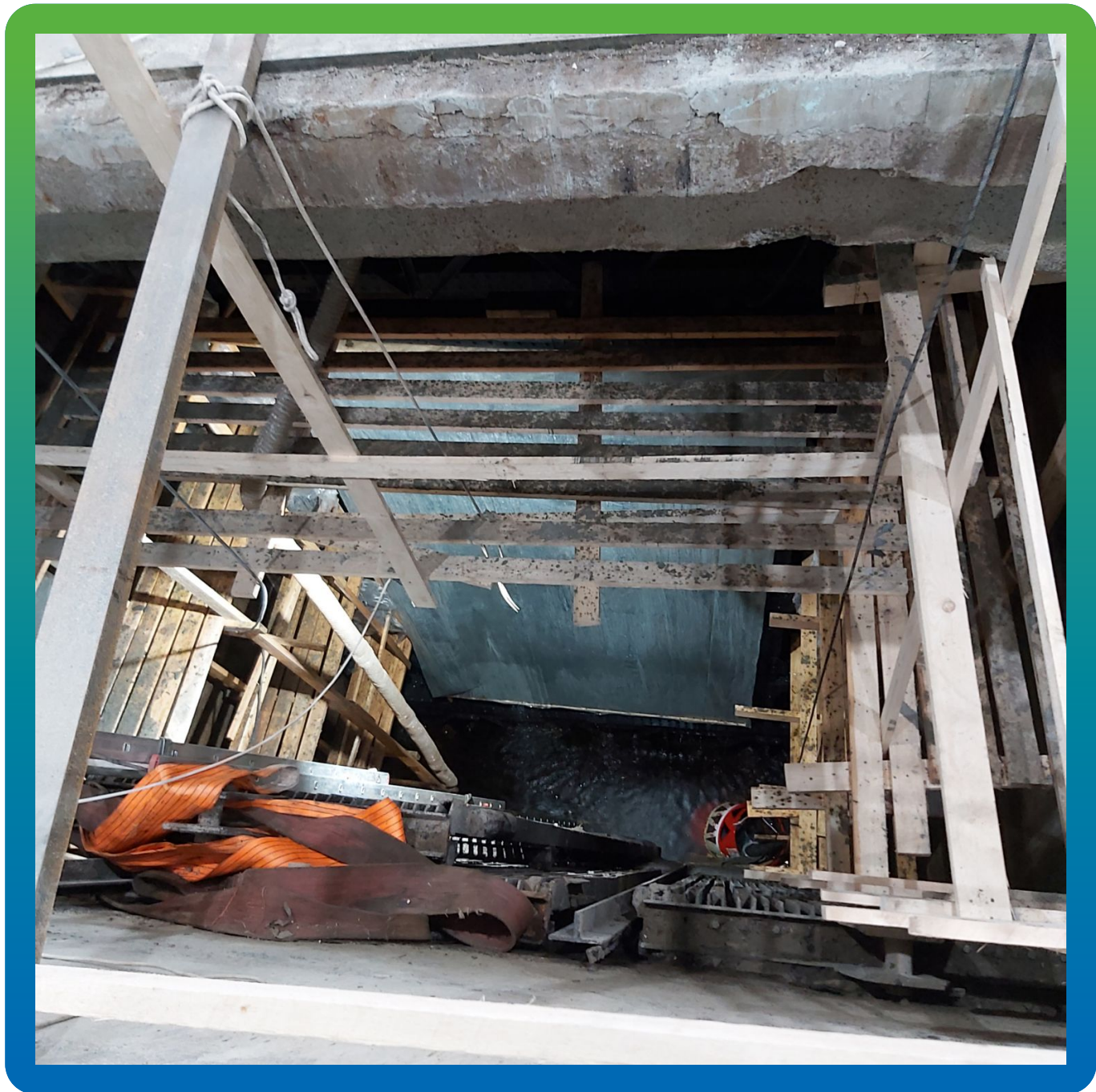
Вид на затворы где проводились ремонтные работы