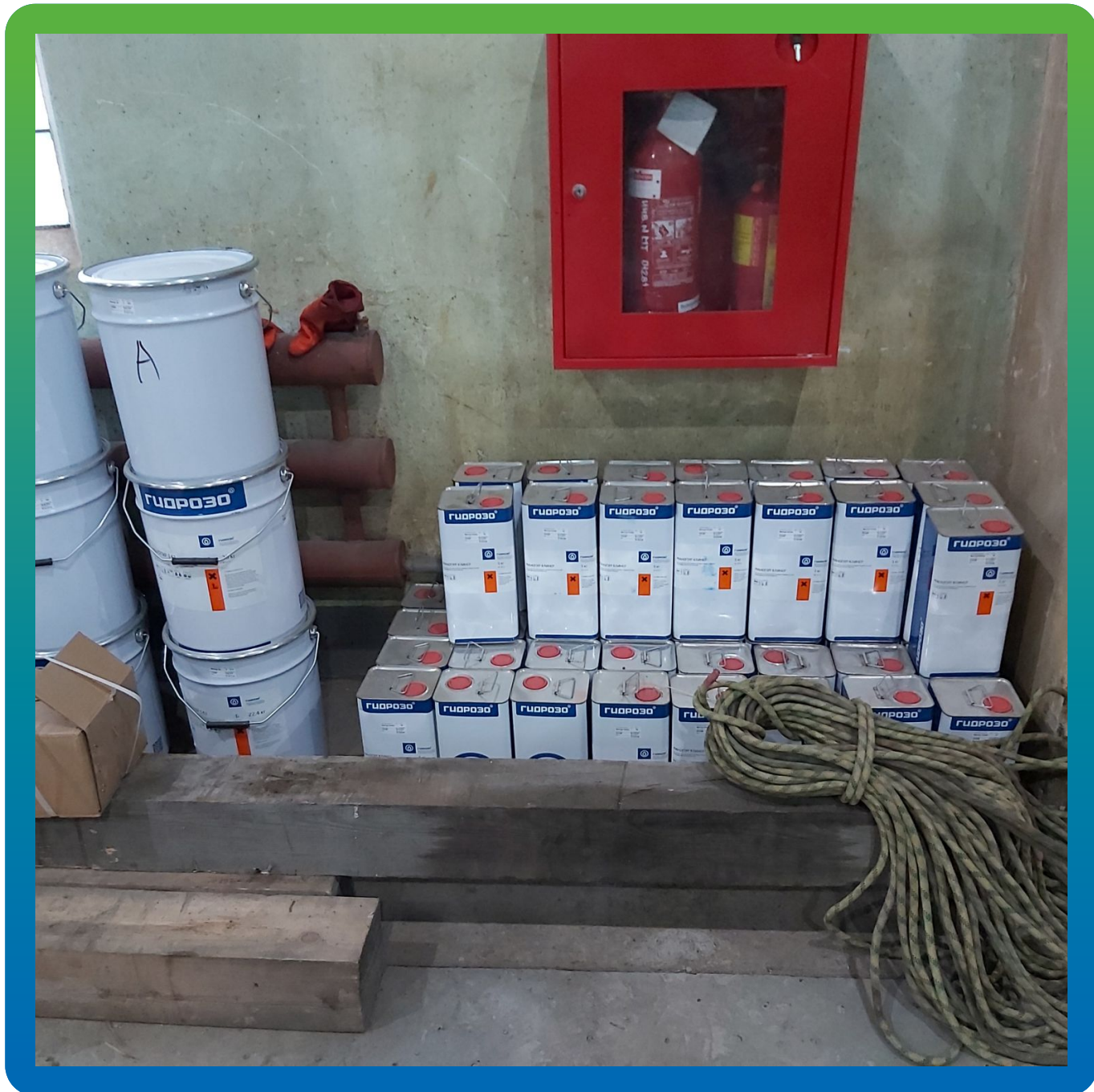
Материалы Манопур 143, Манопур Клинер на объекте.