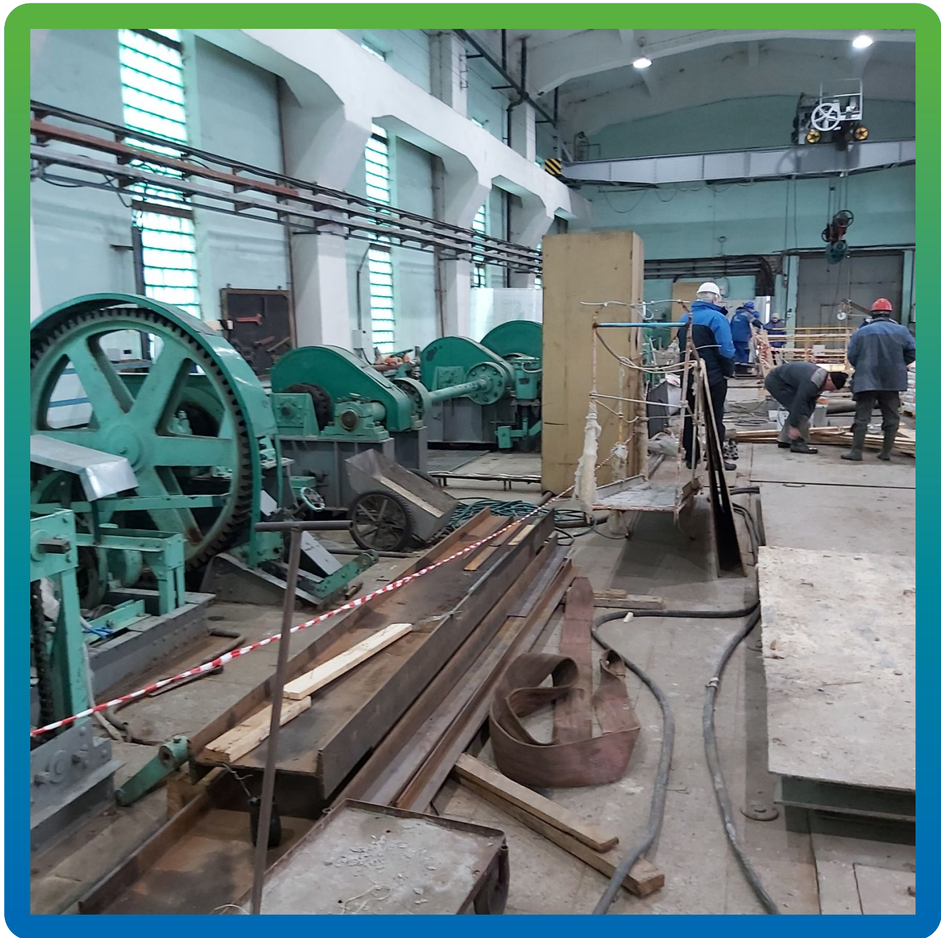
Вид изнутри на объекте