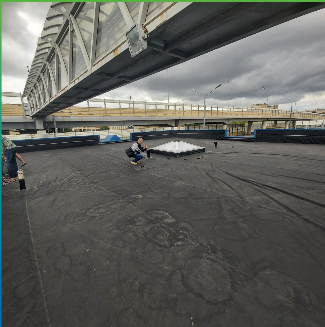
Пункт оплаты ЗСД