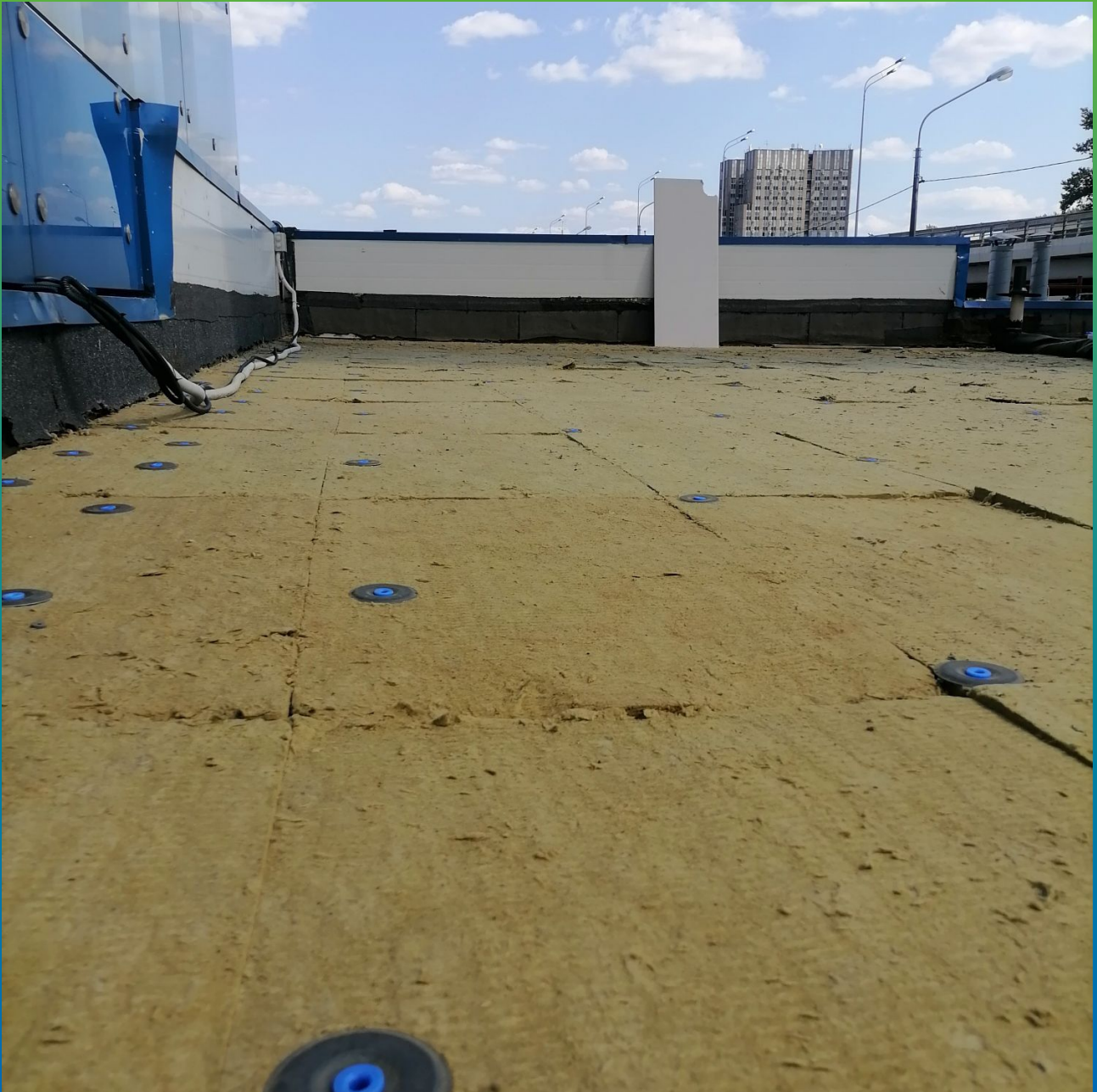
Установленные шайбы Центрикс через утеплитель к профилированному листу.