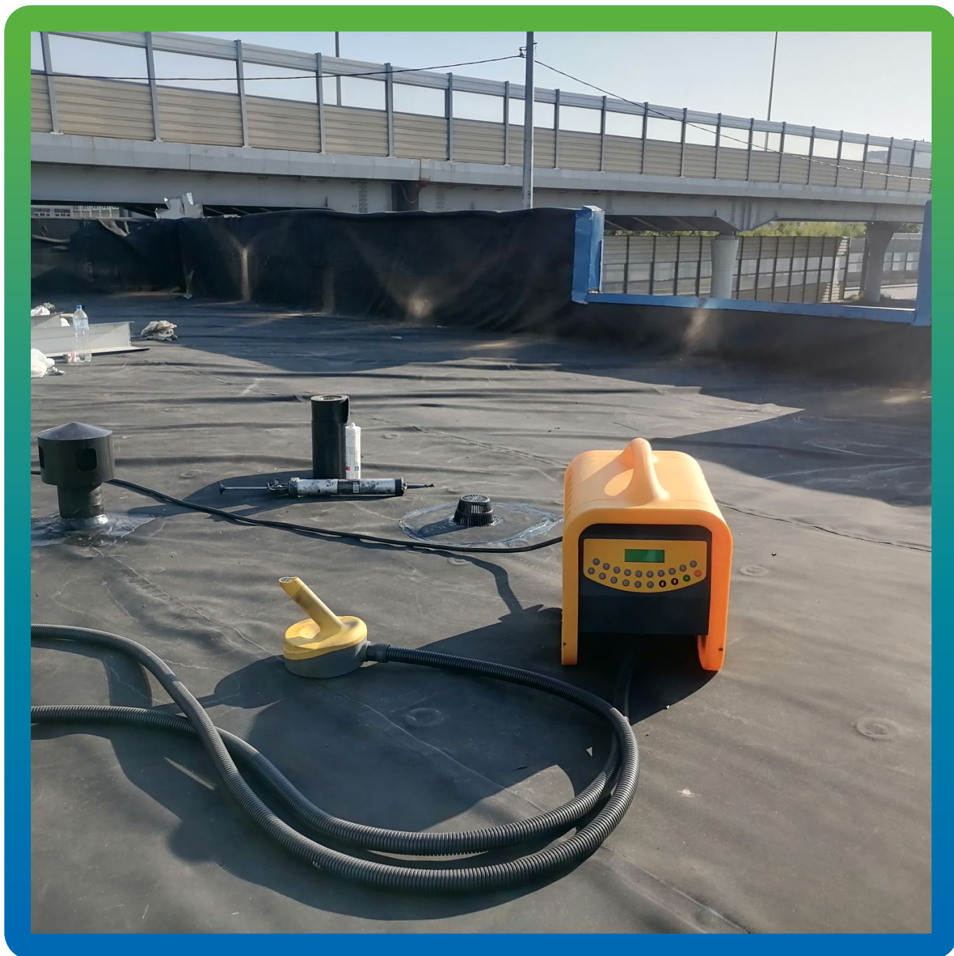
Оборудование Центрикс на объекте

Пункт оплаты ЗСД , Трамвайный проспект 22 к.6