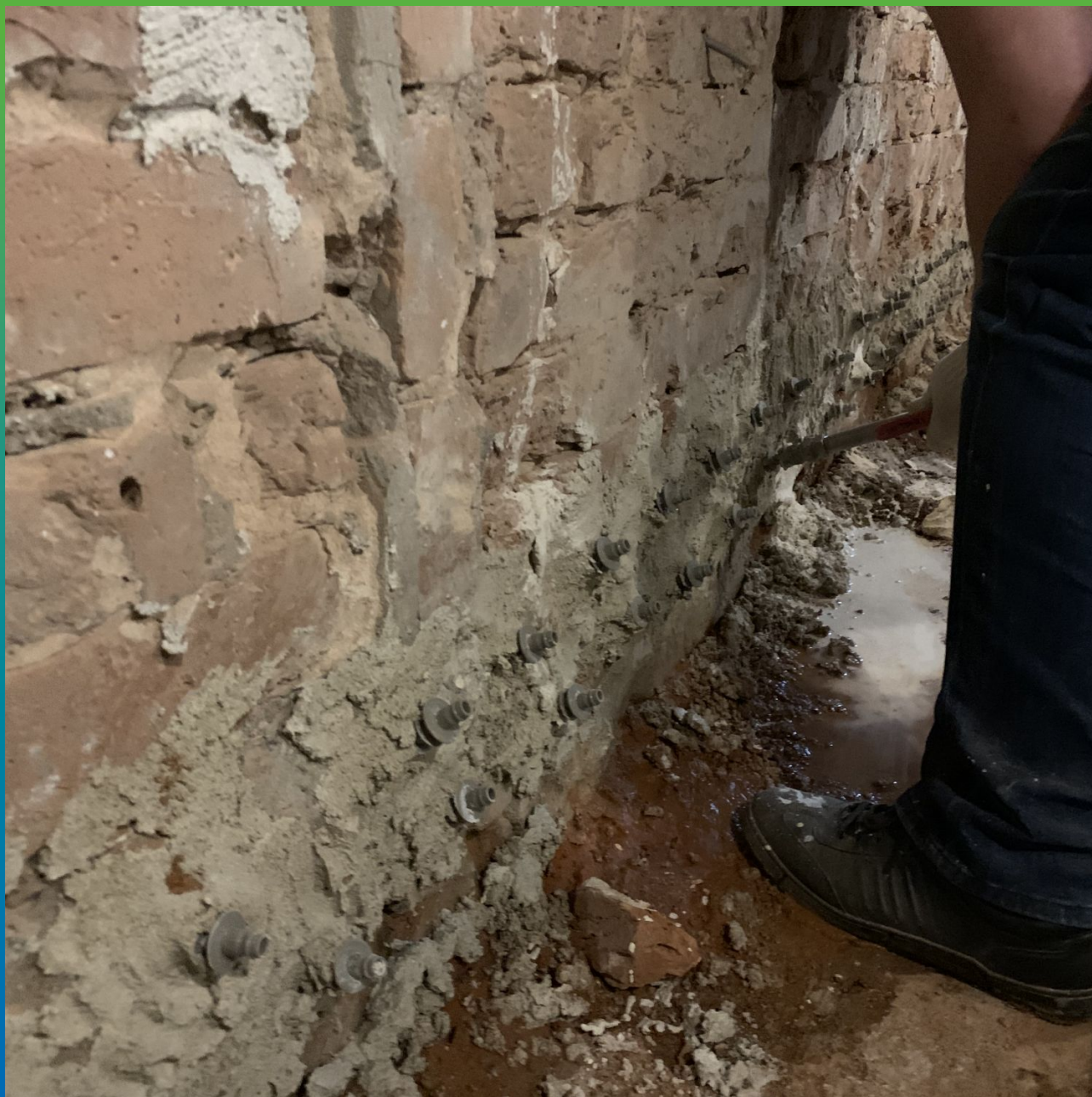
Последовательный переход от пакера к пакеру