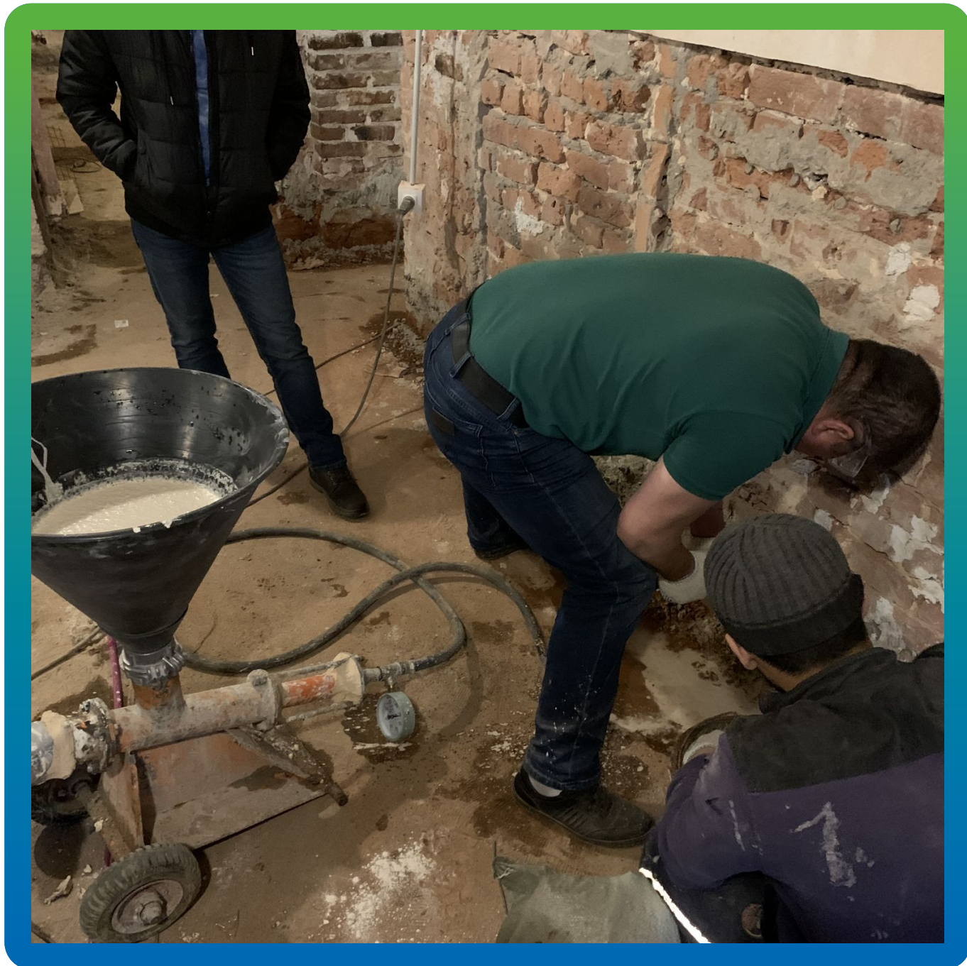
Прокачка Маноцем Лайм в конструкцию