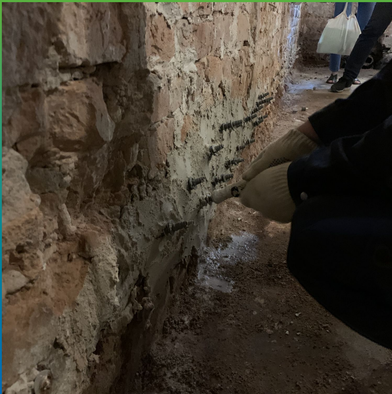
Инъектирование Маноксан 149 Эко в конструкцию для создания отсечной гидроизоляции