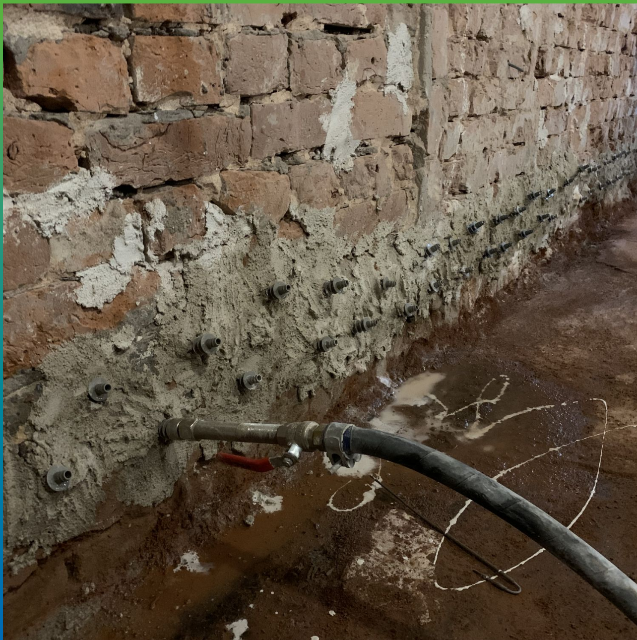
Прокачка Маноцем Лайм в конструкцию