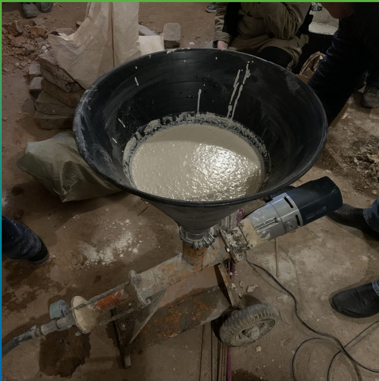
Подготовка материала к работе