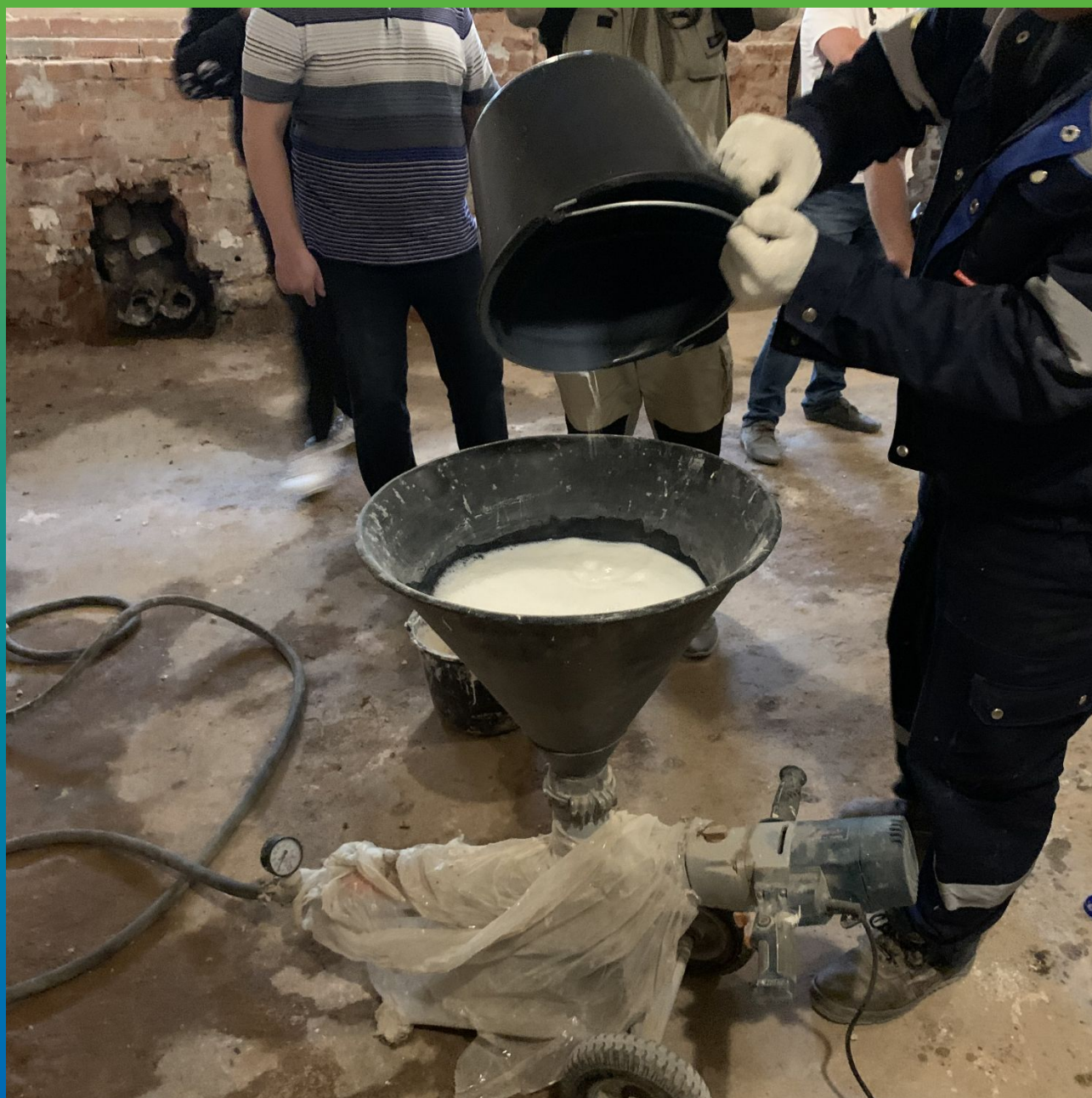
Подготовка микроэмульсии для инъектирования