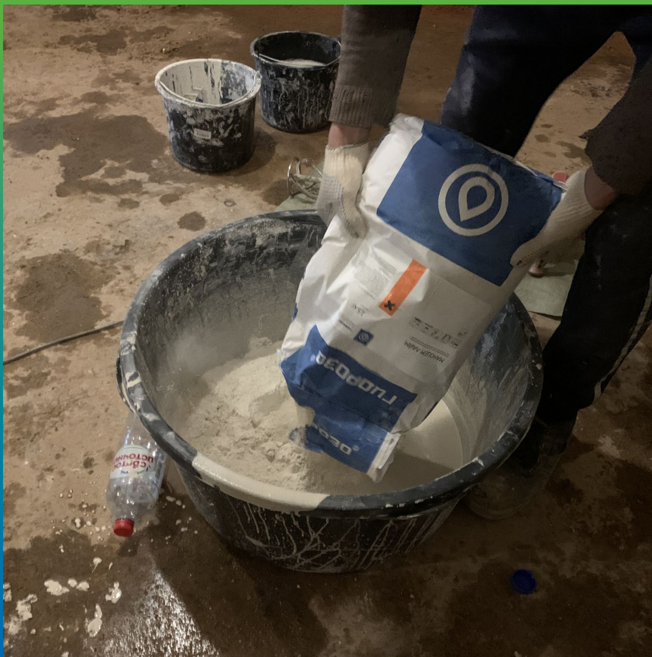
Подготовка материала к работе