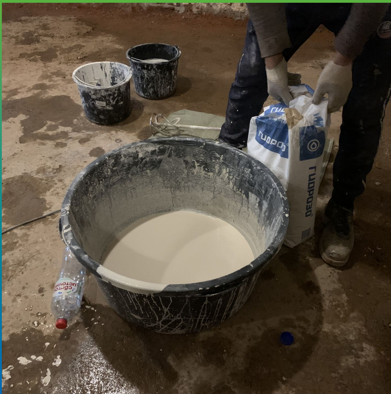
Подготовка материала к работе