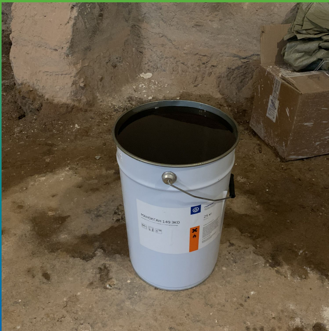
Подготовка материала Маноксан 149 Эко к работе