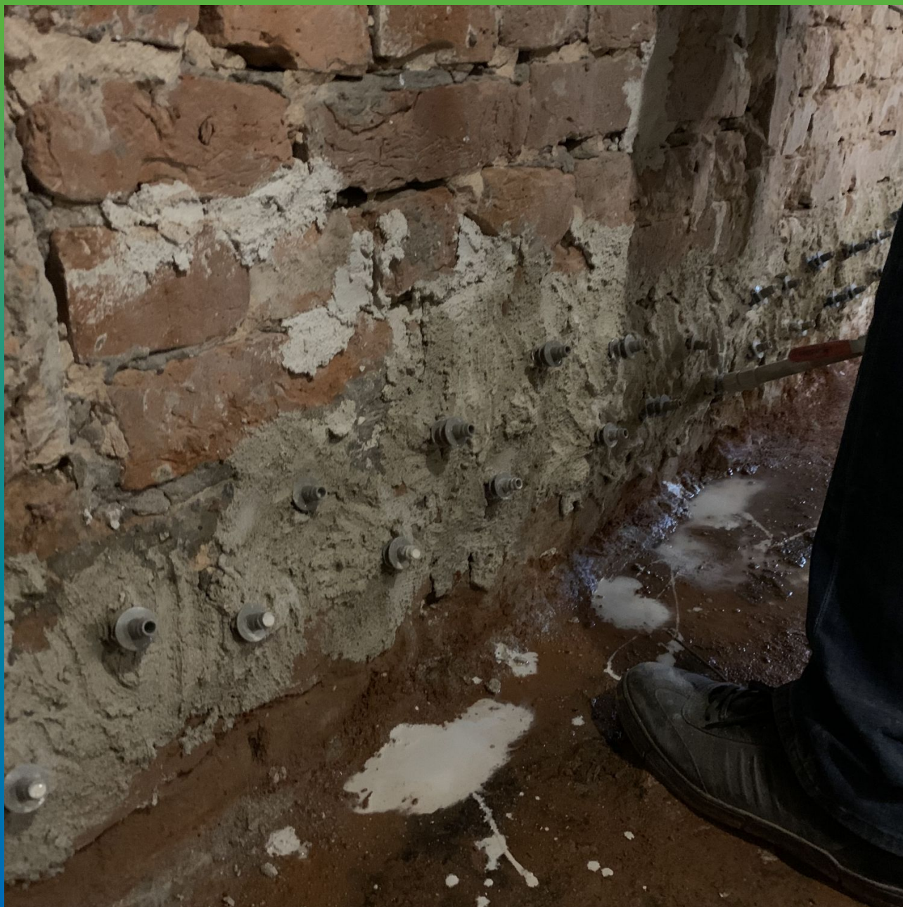
Прокачка Маноцем Лайм в конструкцию