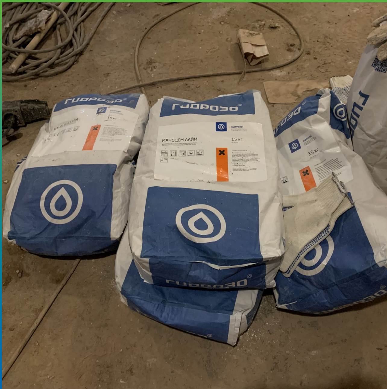
Инъекционный материал на известковом вяжущем Маноцем Лайм