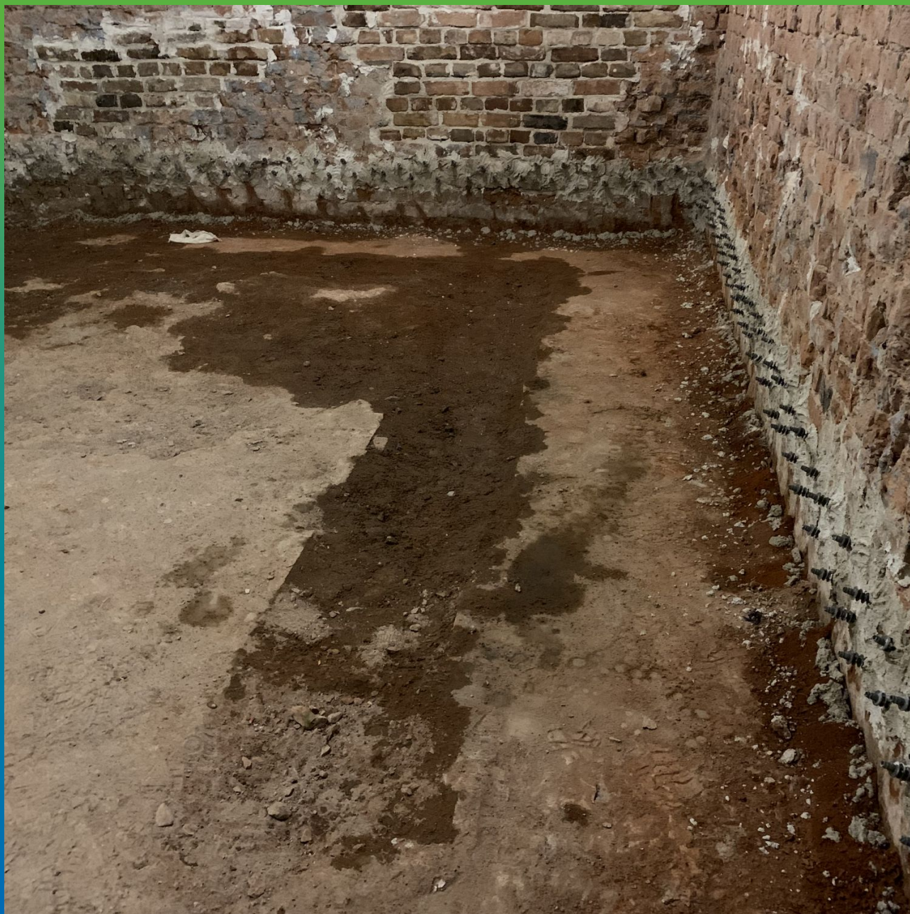
Два ряда инъекционных пакеров для прокачки материалов Маноцем Лайм и Маноксан 149 Эко