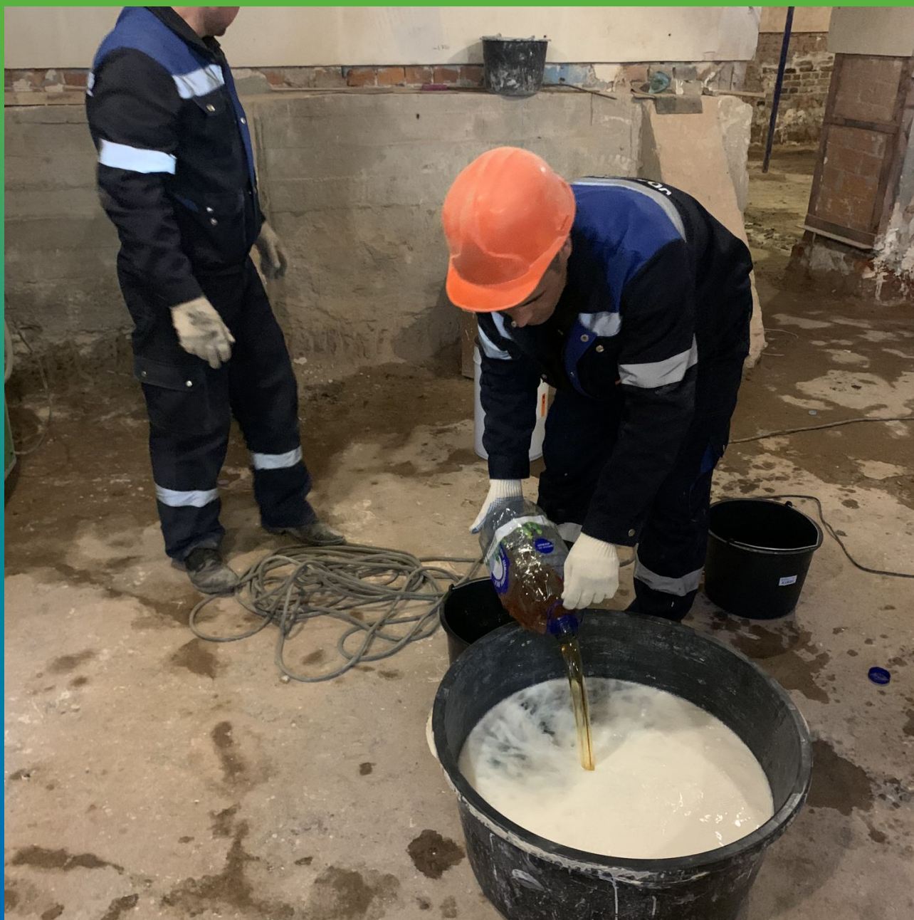
Подготовка микроэмульсии для инъектирования