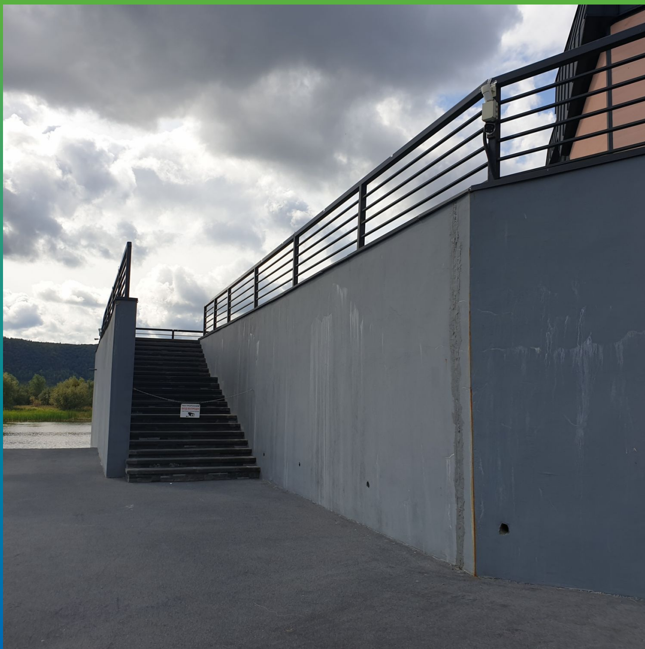
Фильтрация воды через толщу бетона