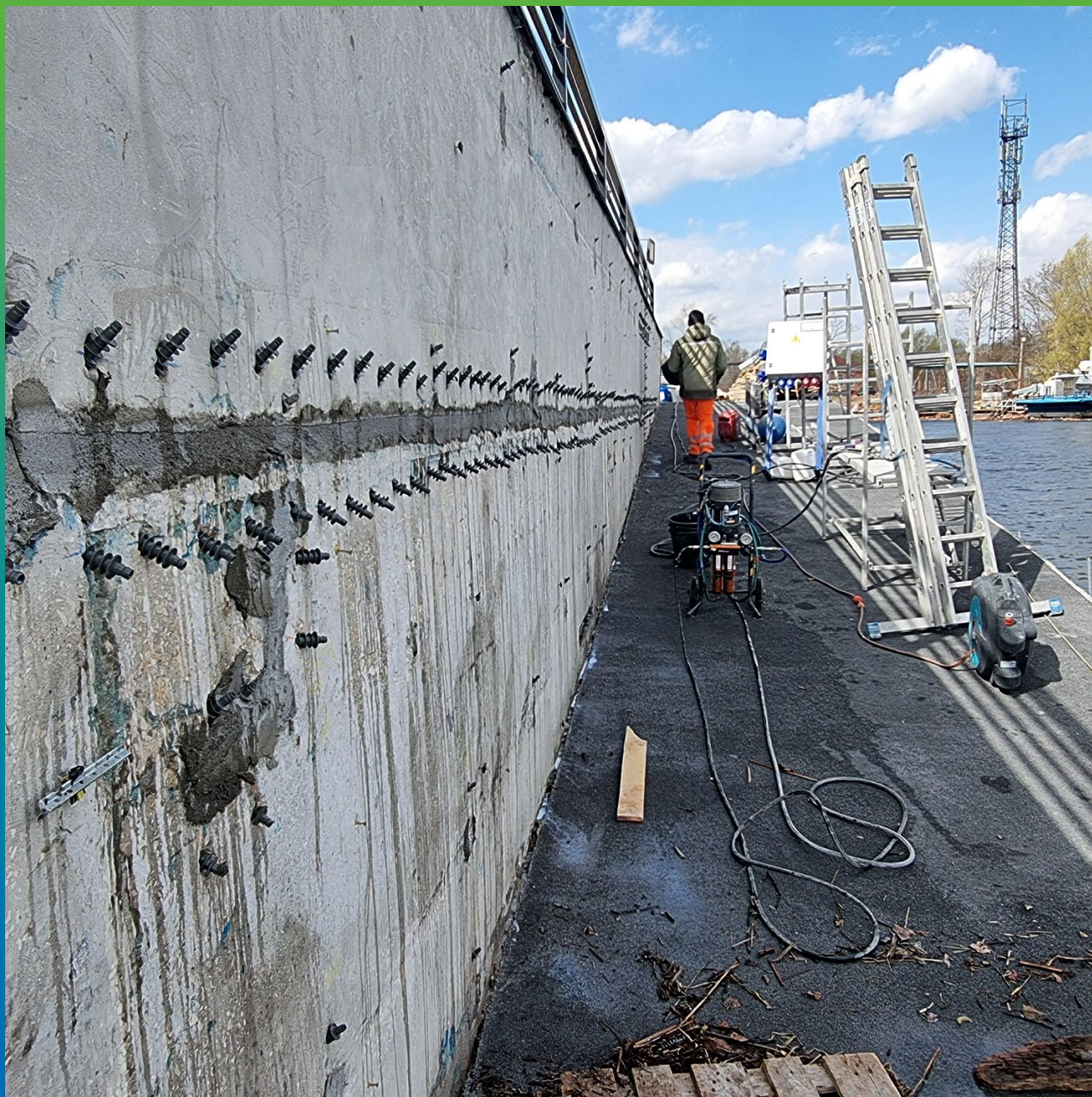
Компрессионно-герметизирующее замыкание холодных швов составом Манокрил Гель Р + Манокрил Флекс при помощи 2к насоса БМ1425