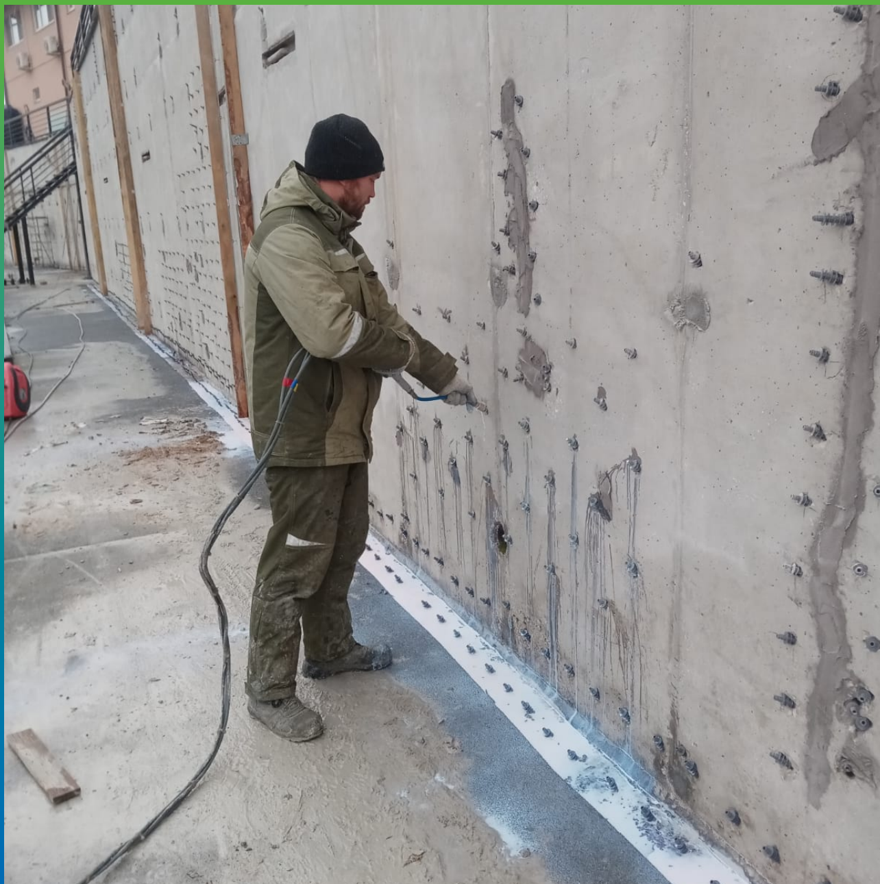
Заполнение пустот в теле железобетонной конструкции акрилатным гелем Манокрил Гель Р