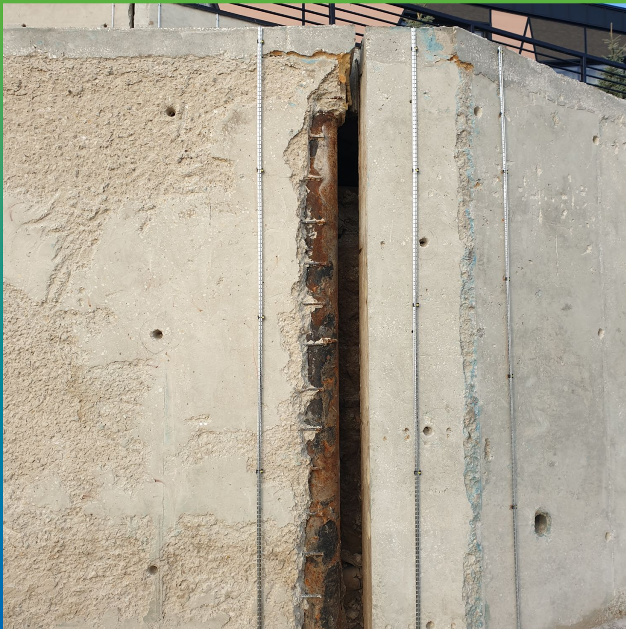
Внешний вид до проведения работ