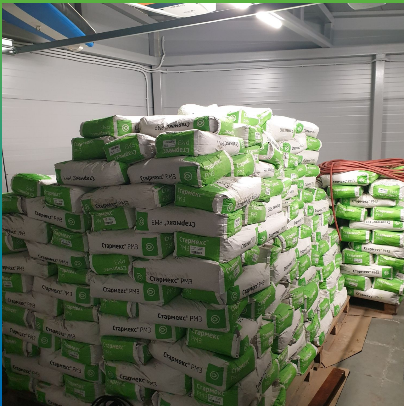
Материал на объекте