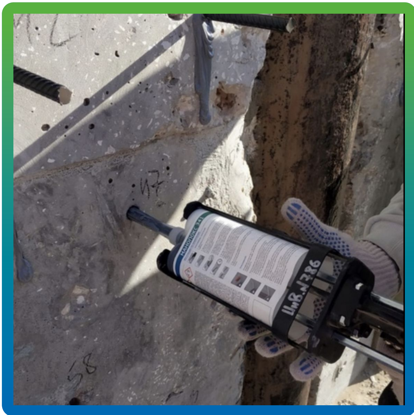
Установка анкеров на химический анкер Манопокс 341