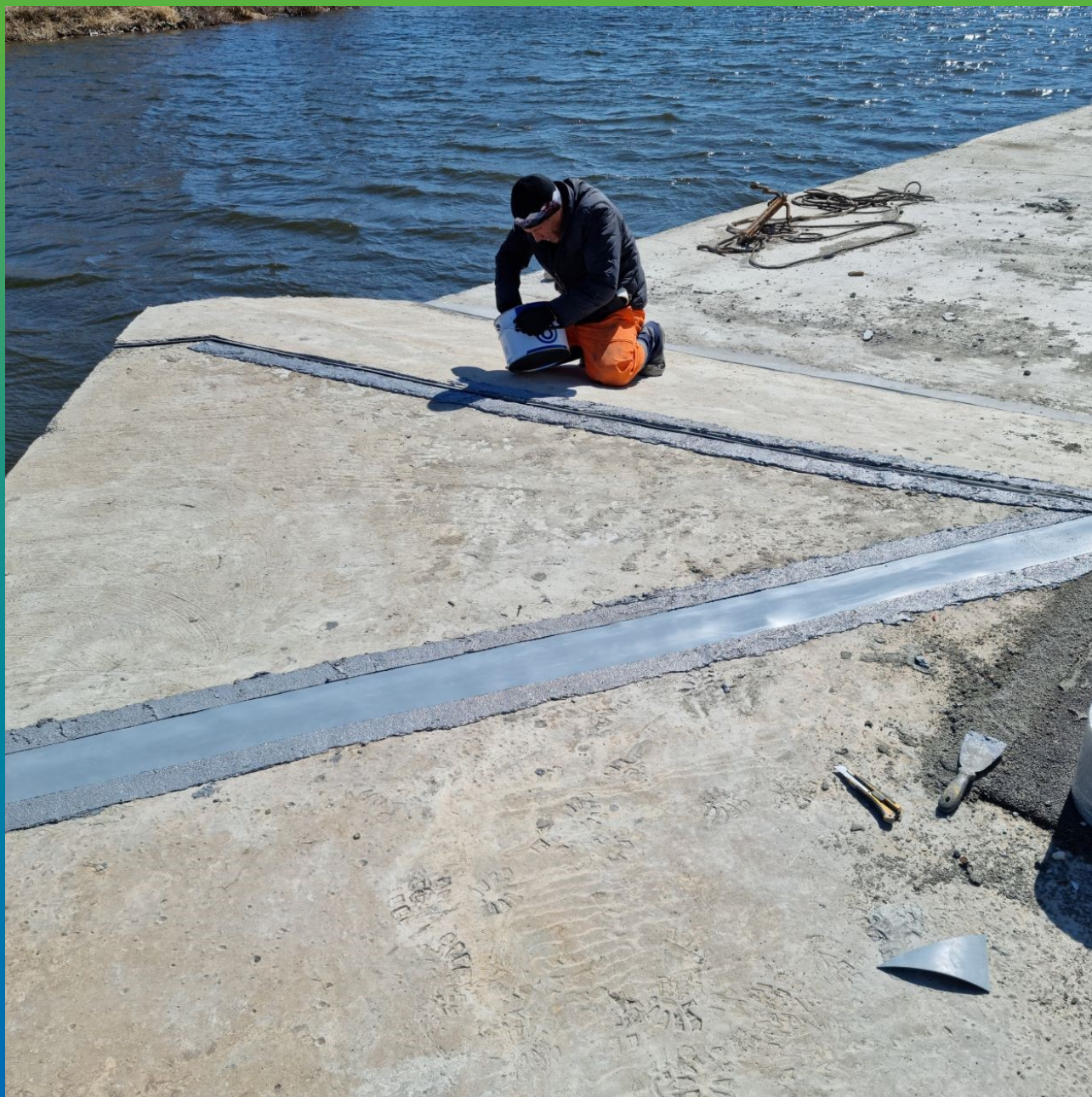
Монтаж ленты Манодил Про на эпоксидный клей Манопокс 331