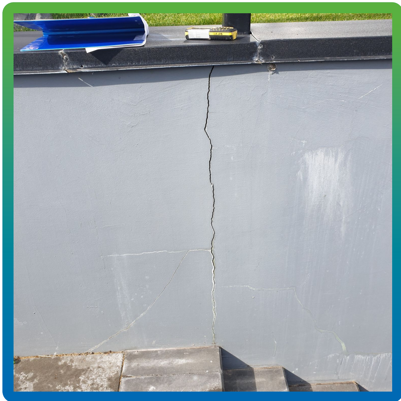
Трещины в ж/б конструкции