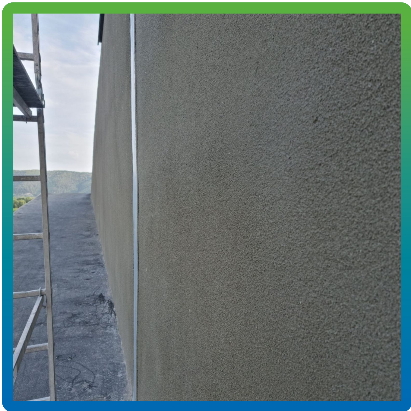
Вид после нанесения полимерцементной гидроизоляции Стармекс Сил Флекс