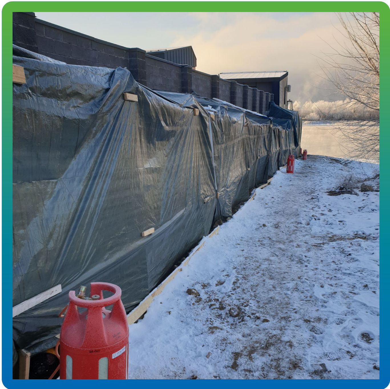
Устройство теплового контура