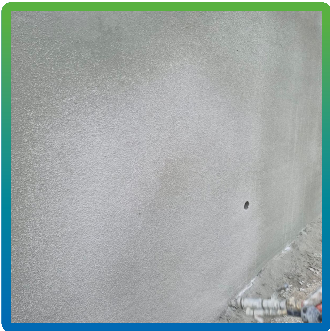
Нанесение полимерцементной гидроизоляции Стармекс Сил Флекс механизированным способом