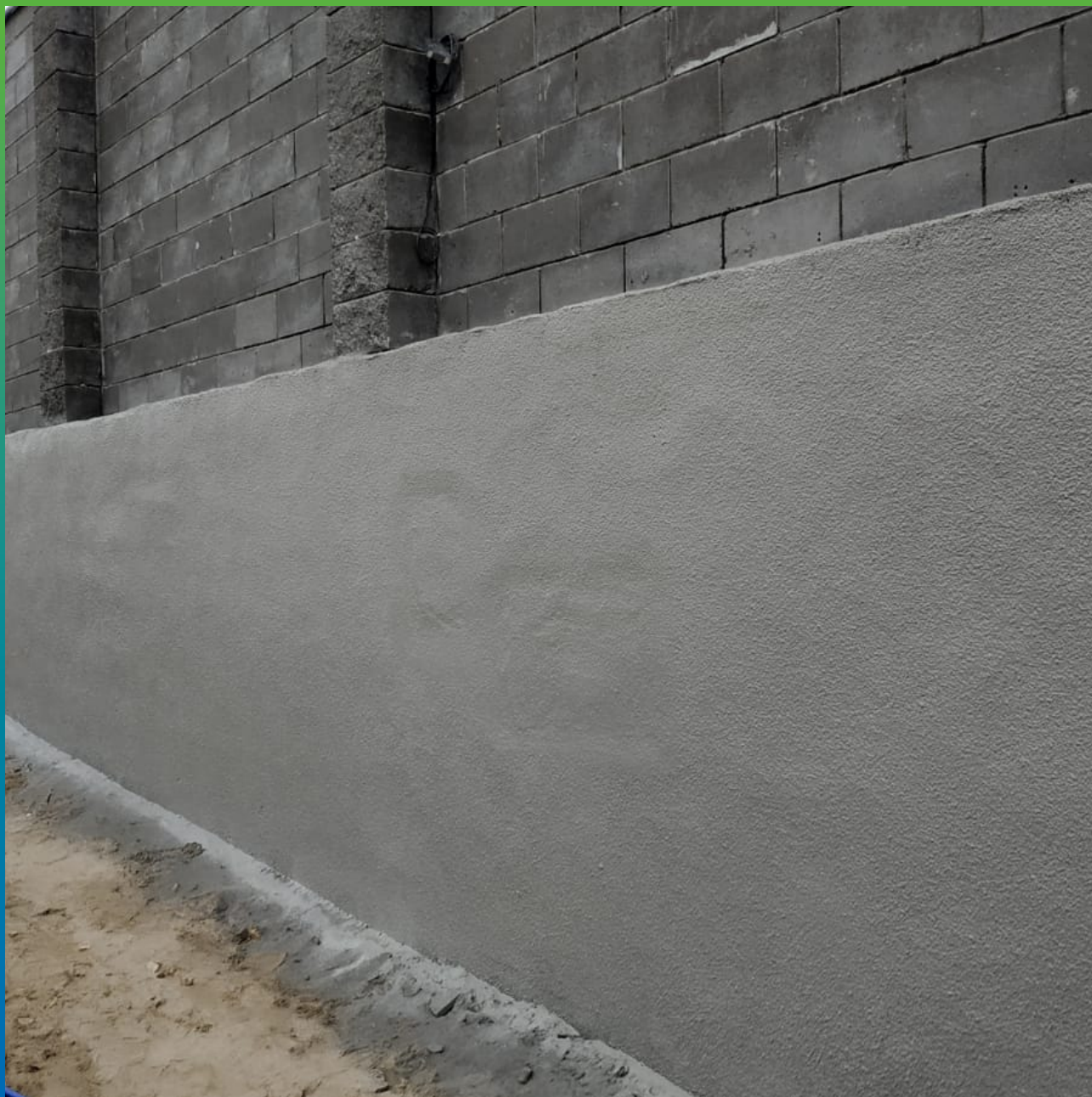
Общий вид после окрашивания