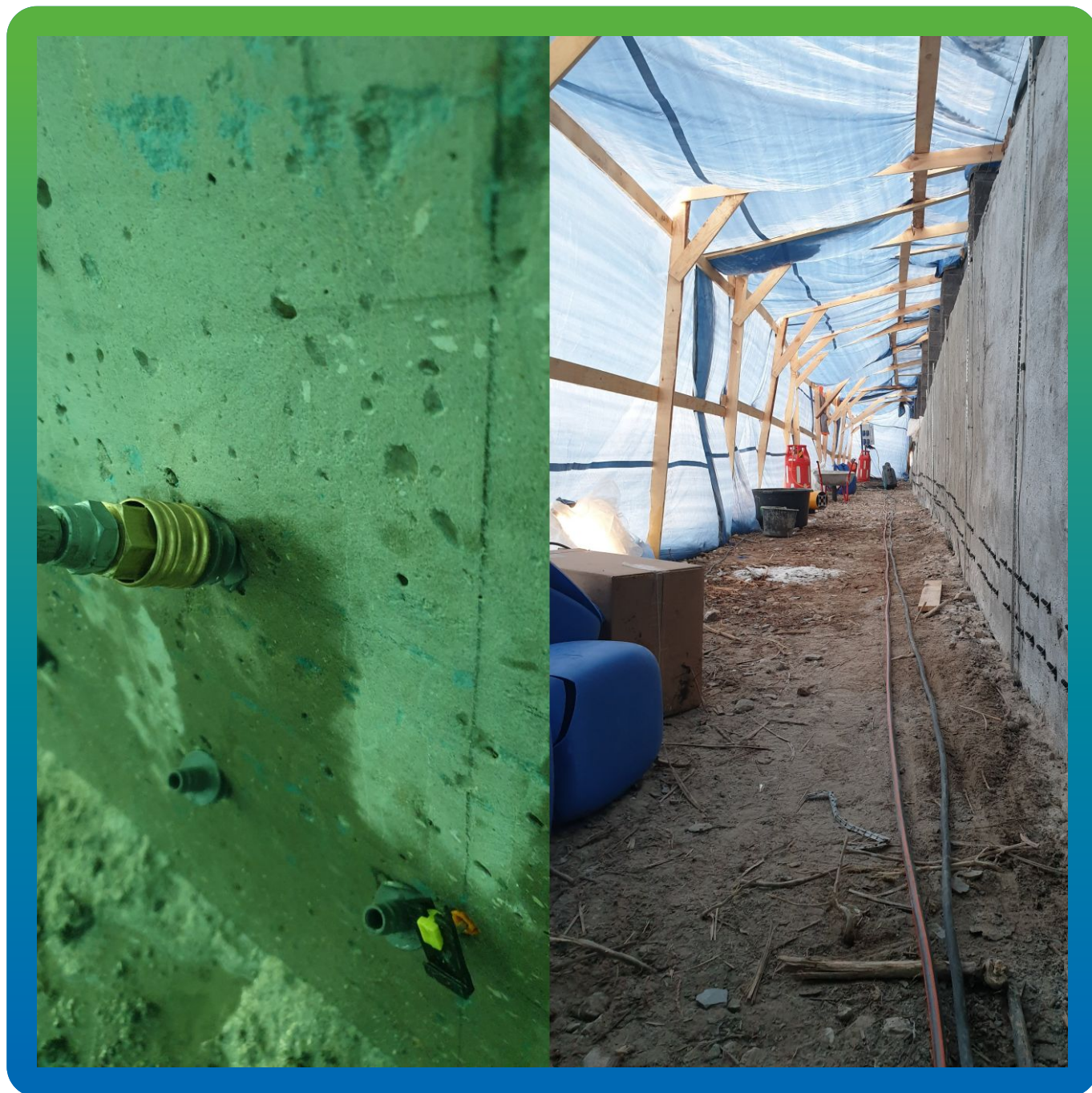
Инъектирование зоны примыкания грунт-подпорная стена акрилатным гелем Манокрил Гель Р