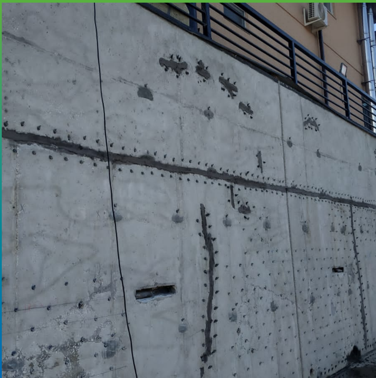
Подготовка к заполнению пустот в теле железобетонной конструкции