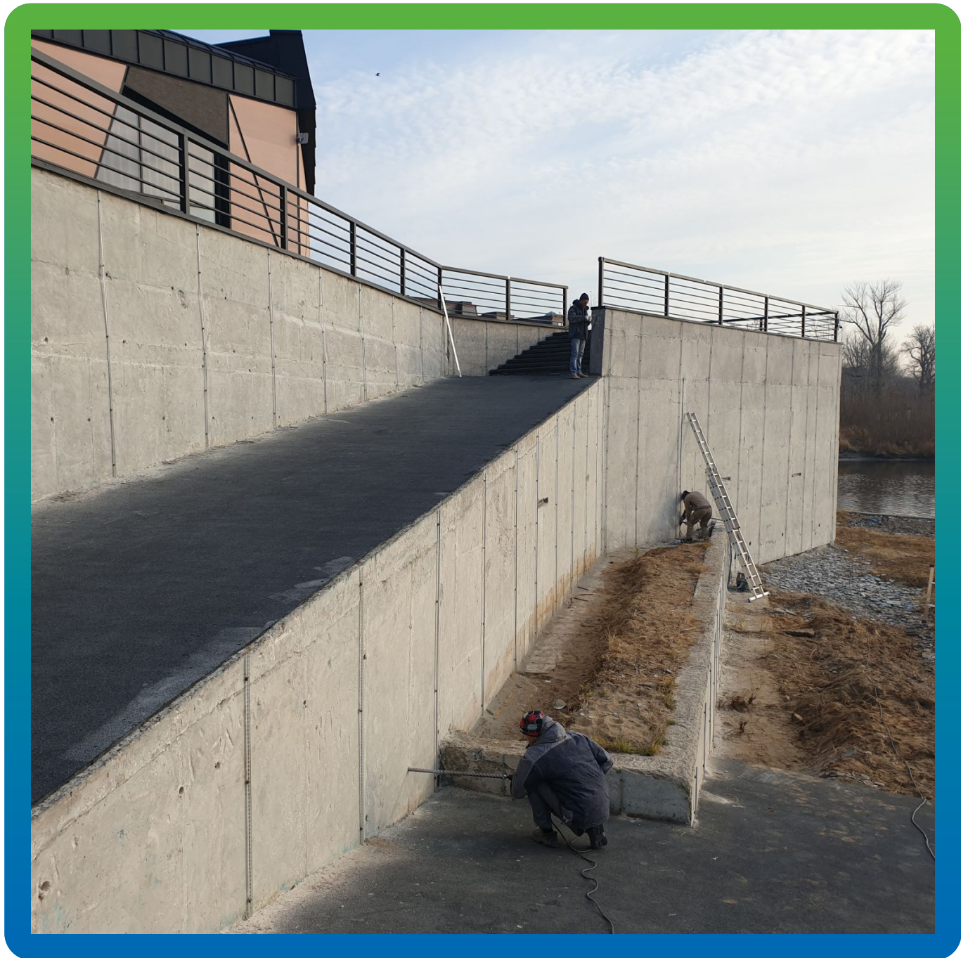
Высверливание ПВХ трубок для фиксации арматуры