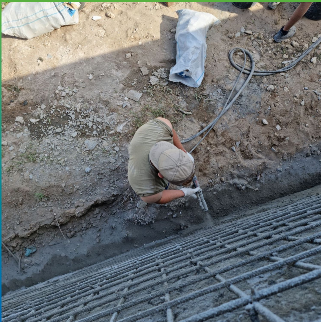
Нанесение ремонтного состава Стармекс ТМ6 методом мокрого торкретирования