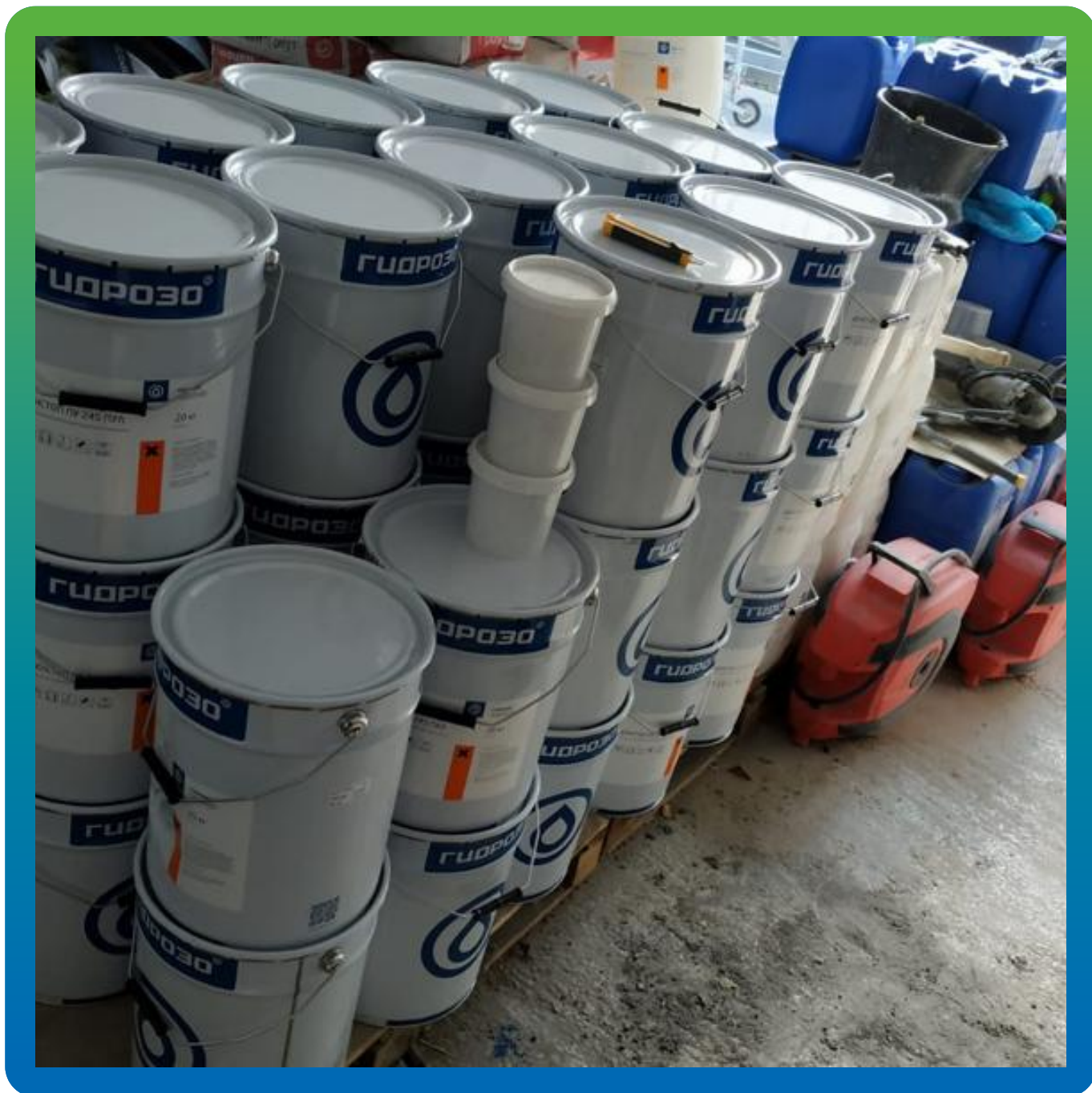
Денстоп ПУ 245 Пул на объекте