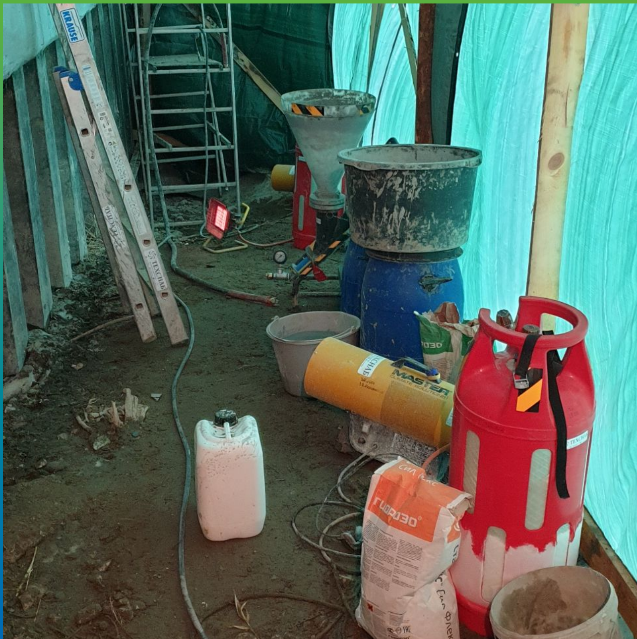
Подготовка к нанесению полимерцементной гидроизоляции Стармекс Сил Флекс