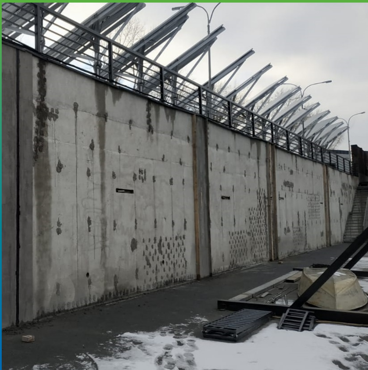
Вид стен после проведения работ