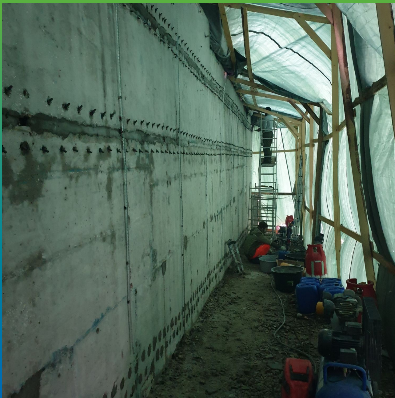
Зачеканка холодных швов бетонирования ремонтным составом Стармекс РМЗ