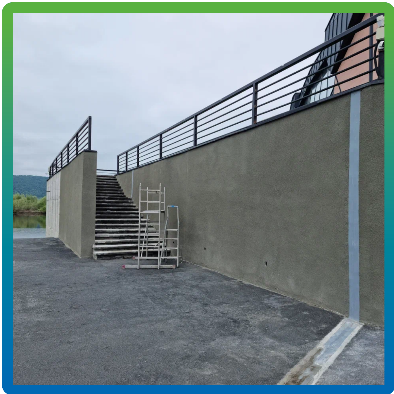
Финальный вид отремонтируемого участка