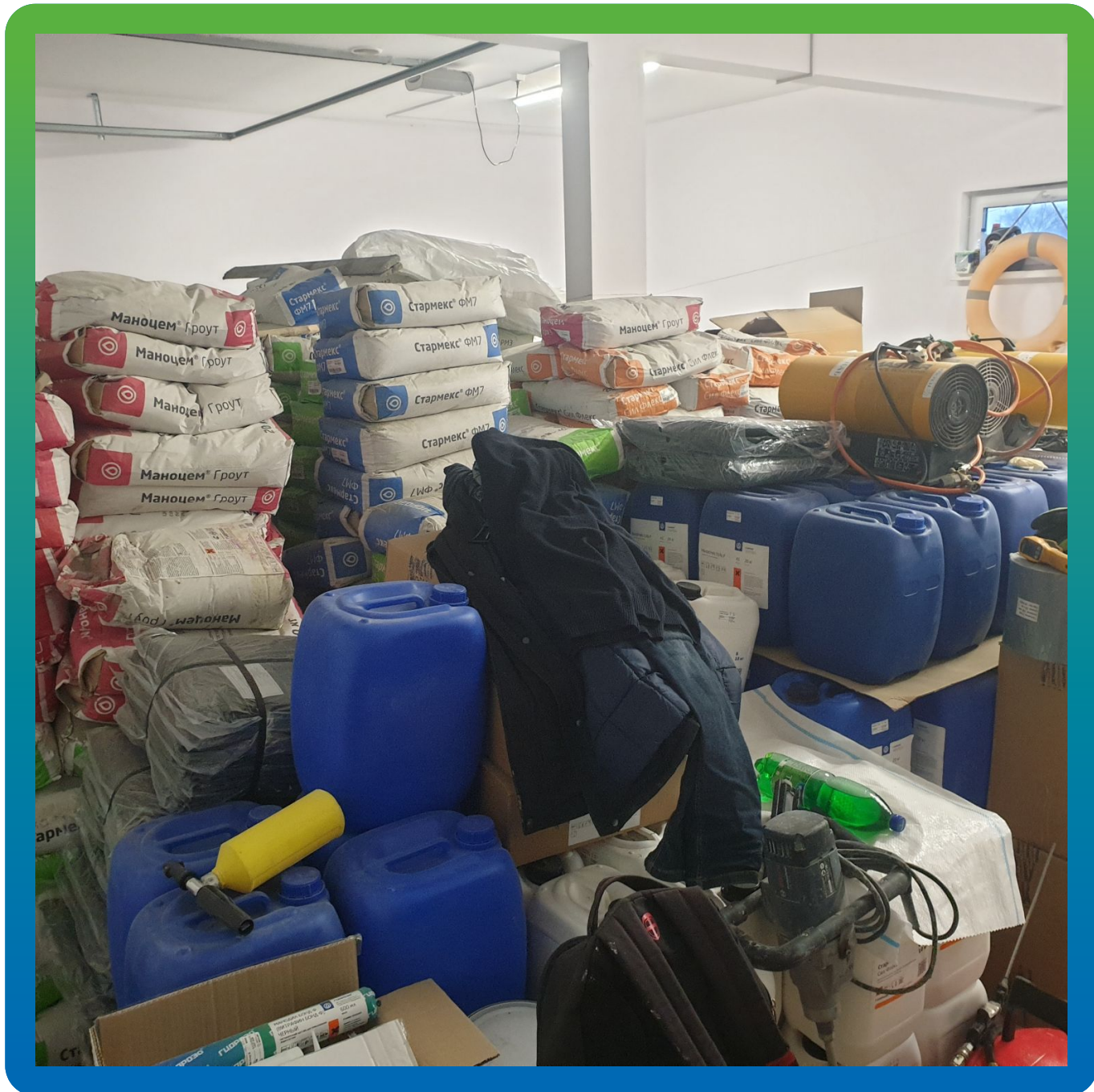
Материал на объекте