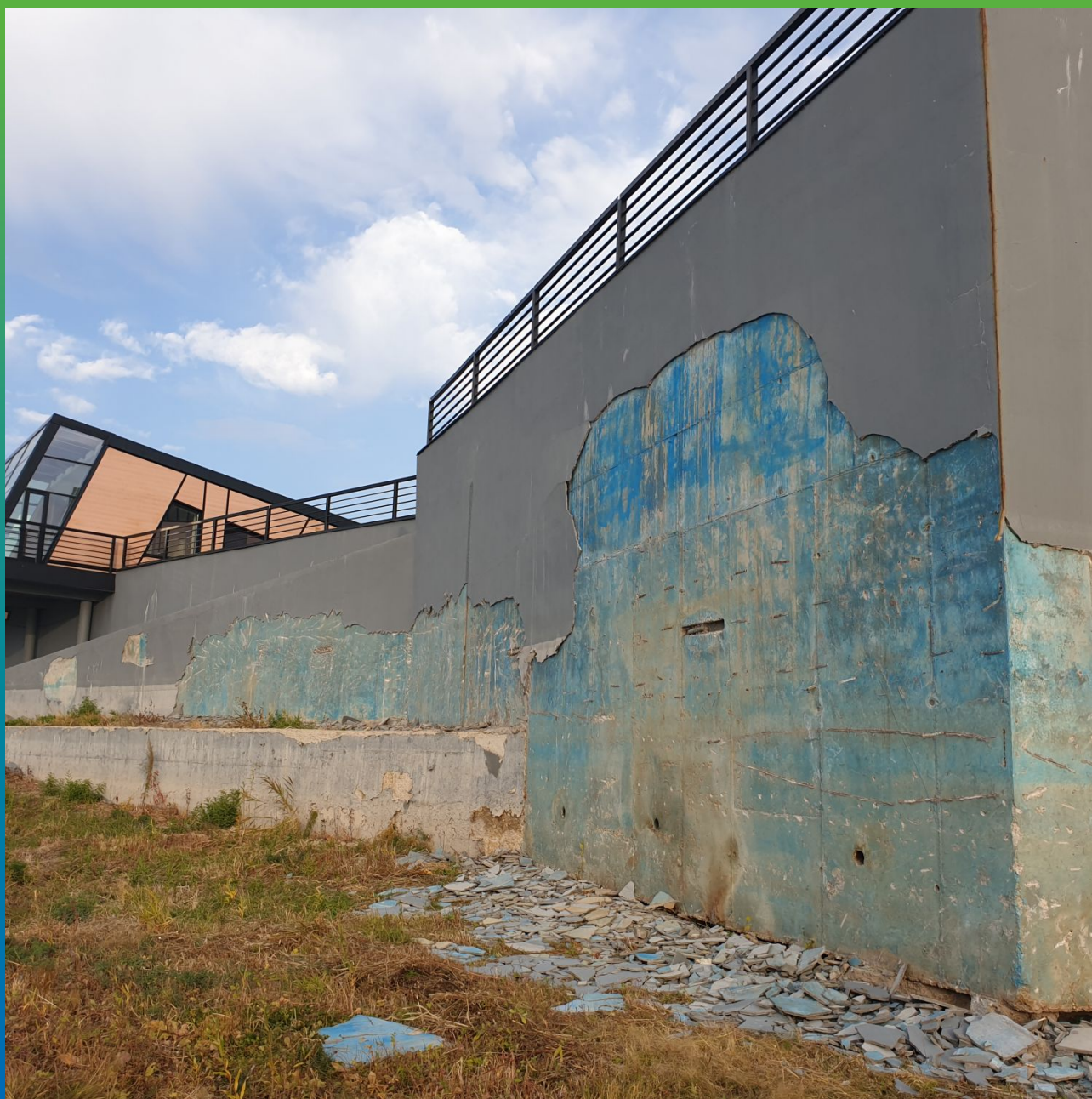
Демонтаж штукатурного слоя