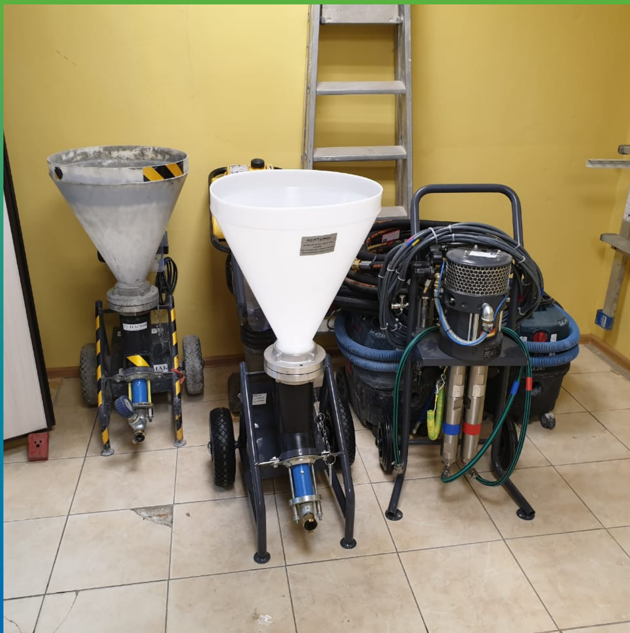
Примененное оборудование на объекте . Шнековый насос БМ 2697, 2к насос БМ1425