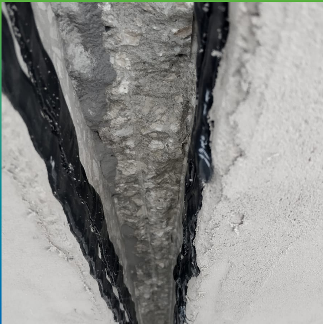
Нанесение Манодил Бонд Ф