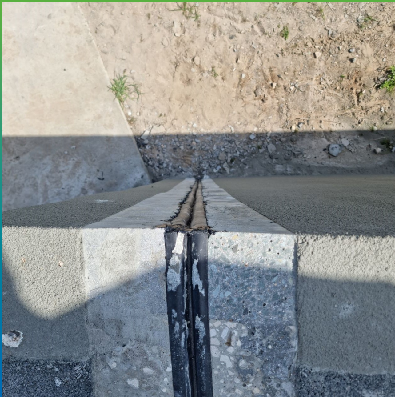
Монтаж ЭПДМ Шпонки Витраджоинт Деф