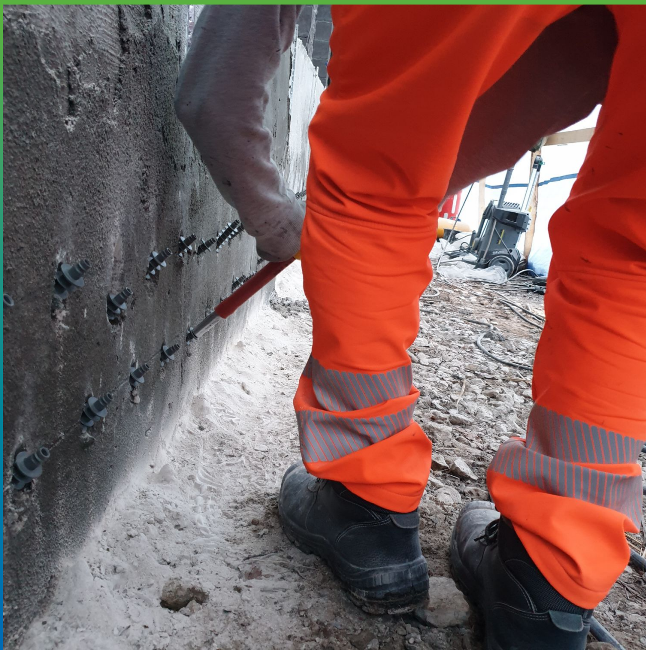
Монтаж пластиковых пакеров БМ 2830