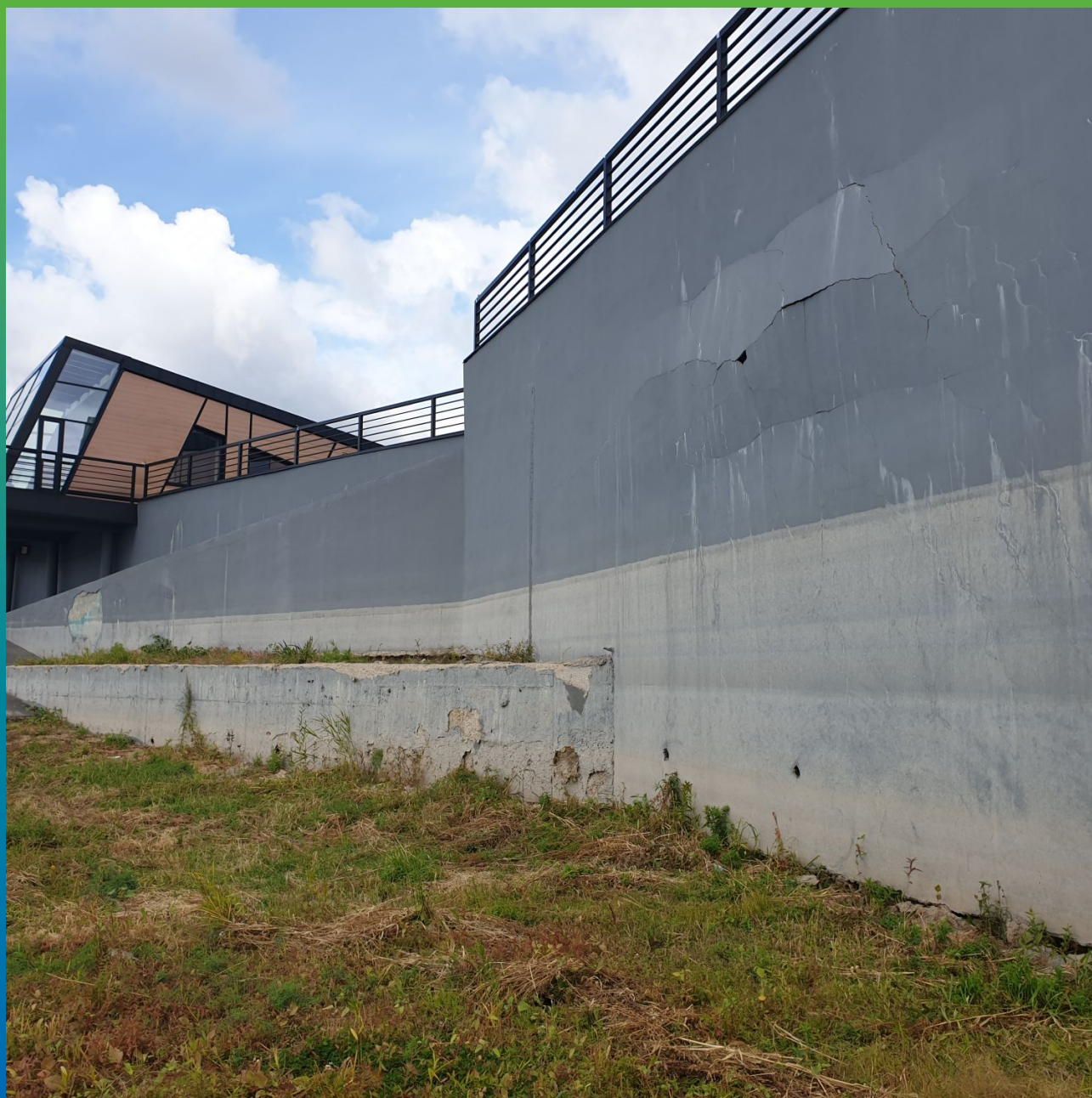
Дефекты до ремонта . Отслоение штукатурного состава