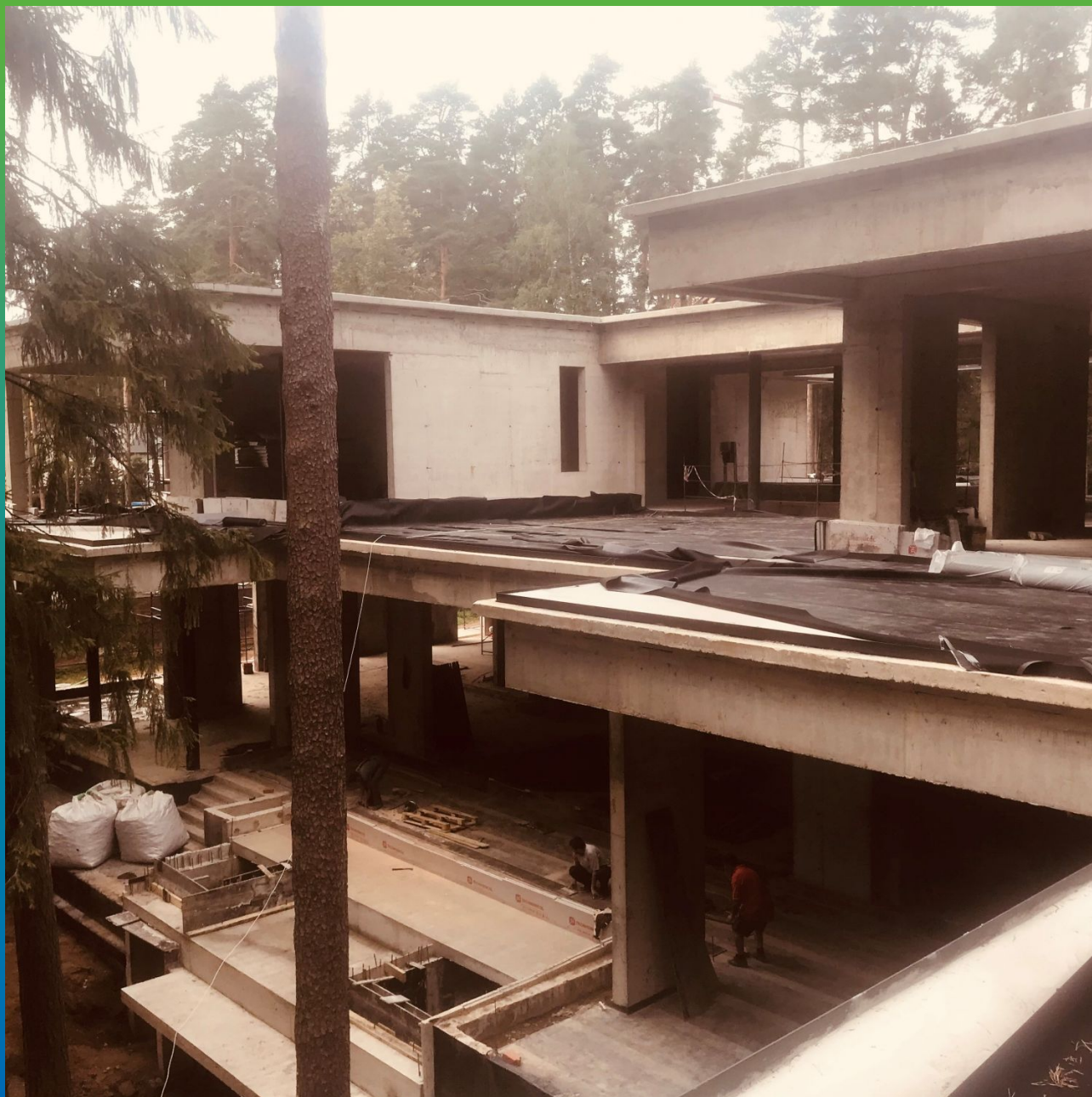
Общий план перекрытия материалом Суперсил СТ горизонта террас трех этажей виллы