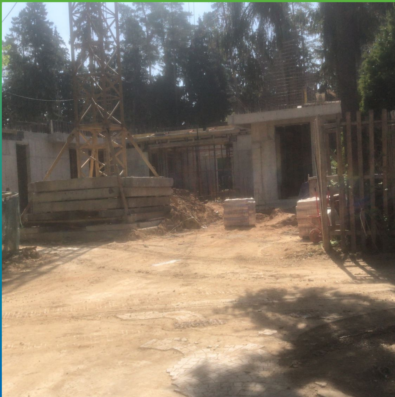
Стадия строительства Виллы №2 Кантри Про