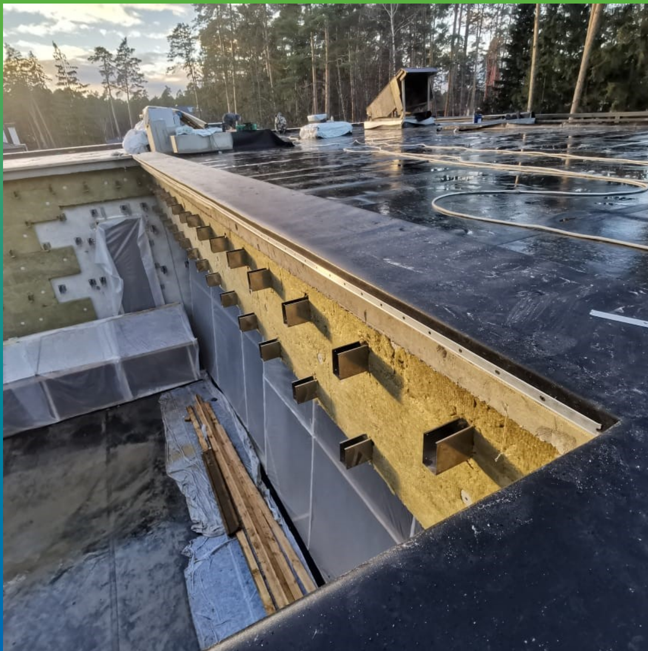
Итоговая картина по укрытию террас и кровли Виллы №2 материалом Суперсил СТ