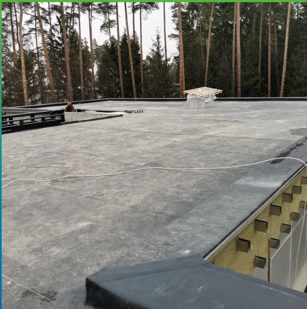
Закрытие кровли материалом Суперсил СТ