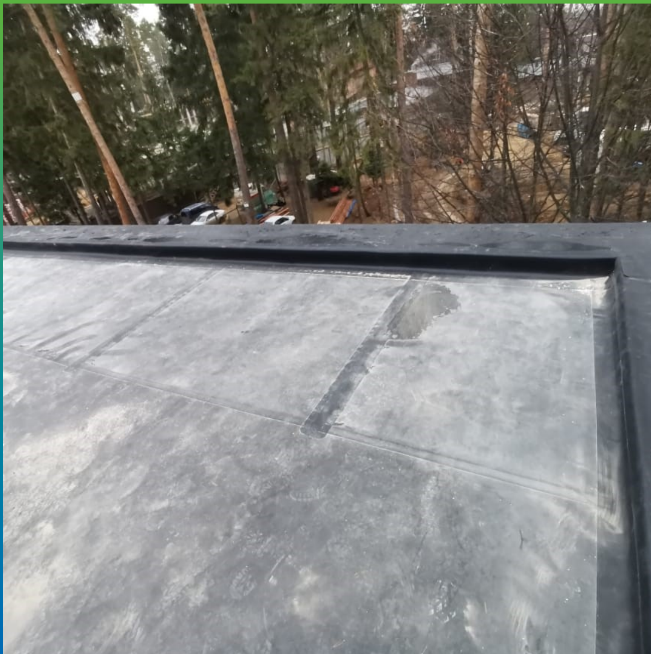
Устройство примыканий парапетов террас второго этажа