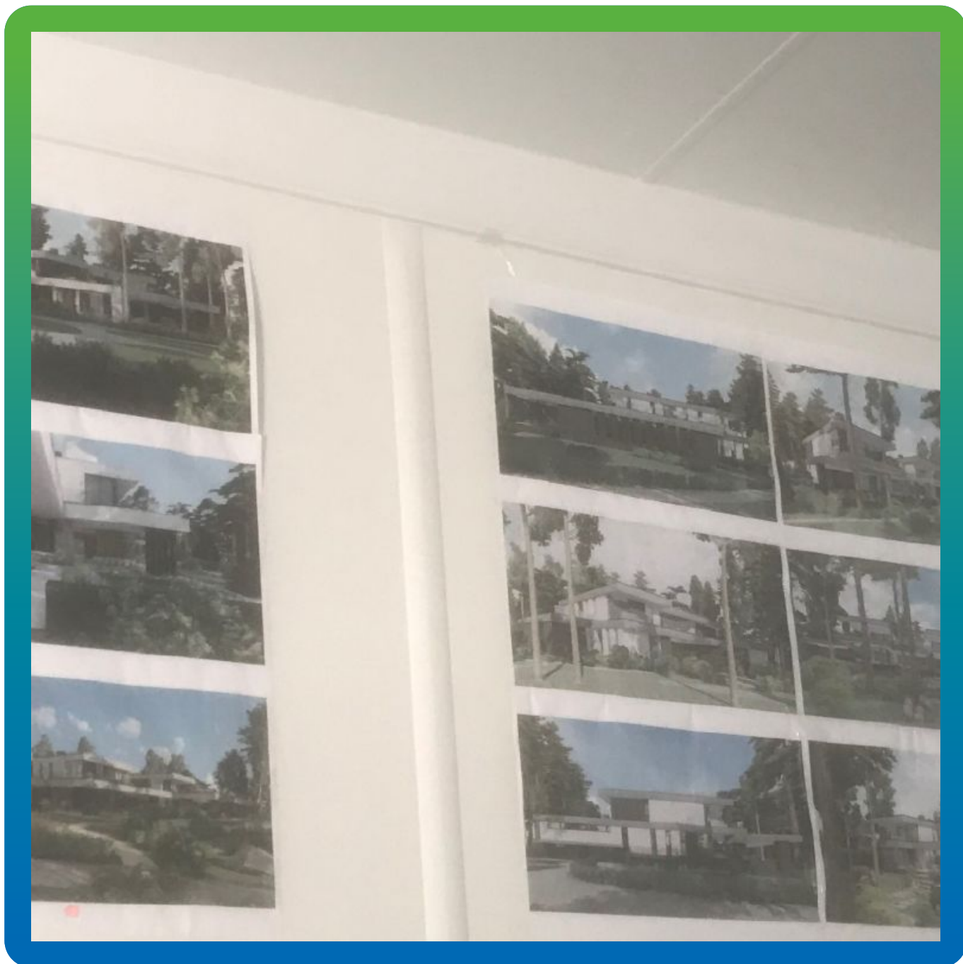
Проекты трех вилл