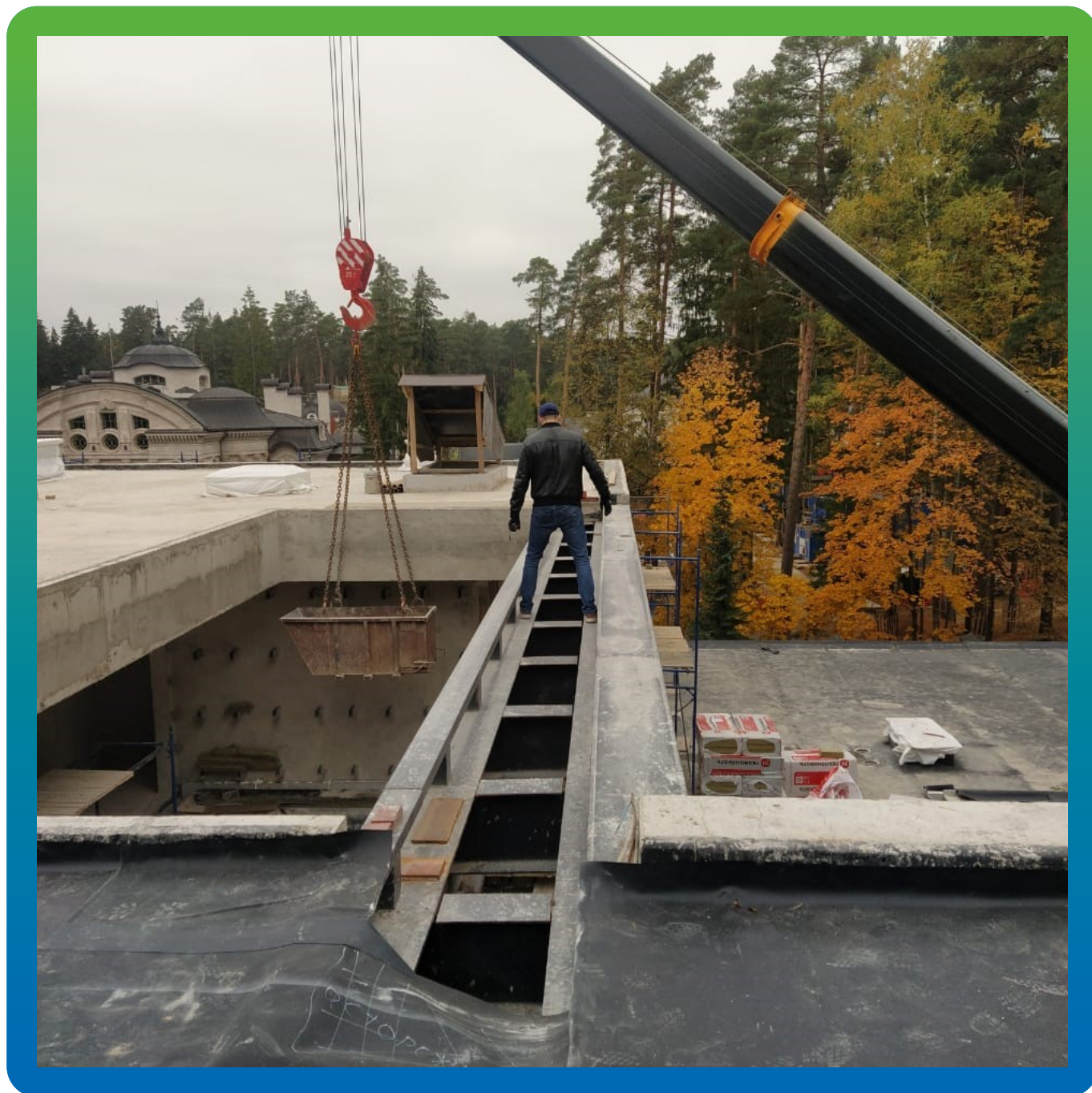
Подъем материала Суперсил СТ на кровлю