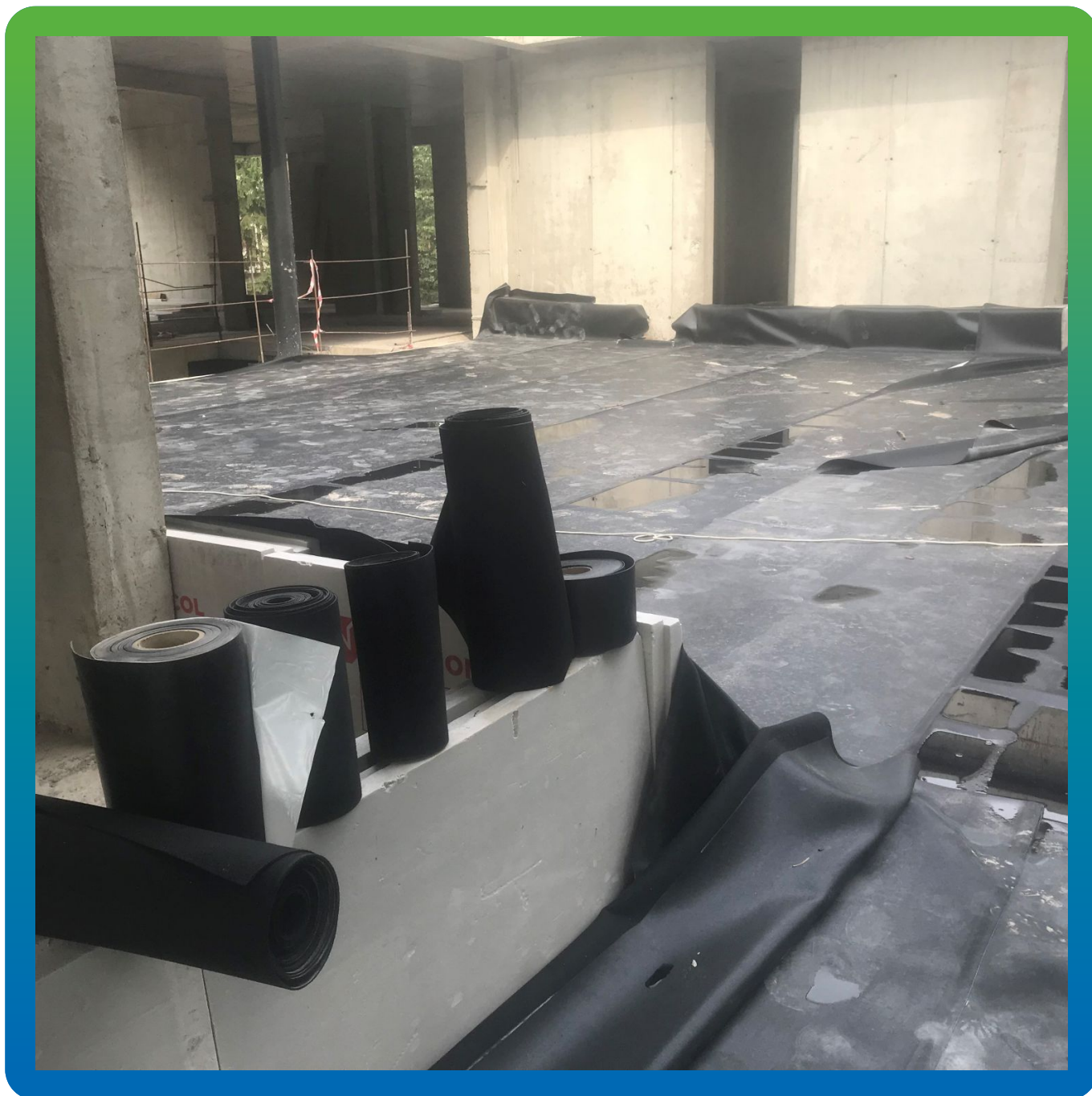
Материал на объекте