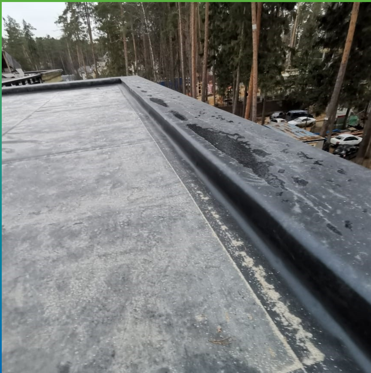
Устройство примыканий парапетов террас второго этажа