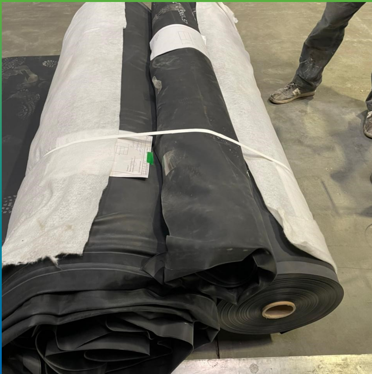
Отгрузка материала Прелести СТ