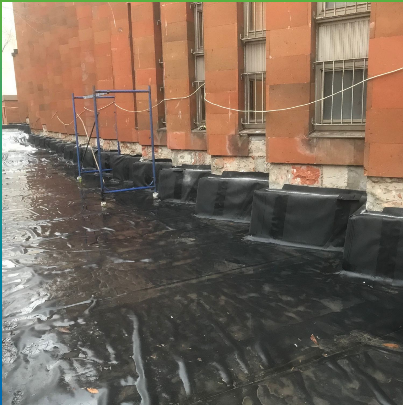
Итоговый вид гидроизоляции стилобата материалом ЭПДМ Преласты СТ 1.2