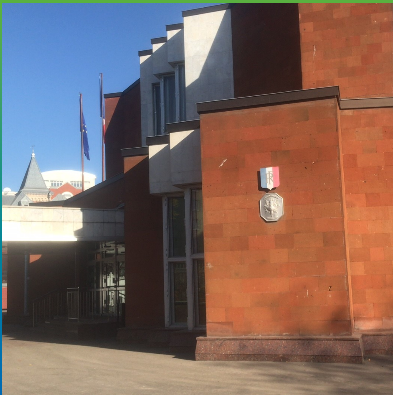
Здание генерального консульства FR Москва