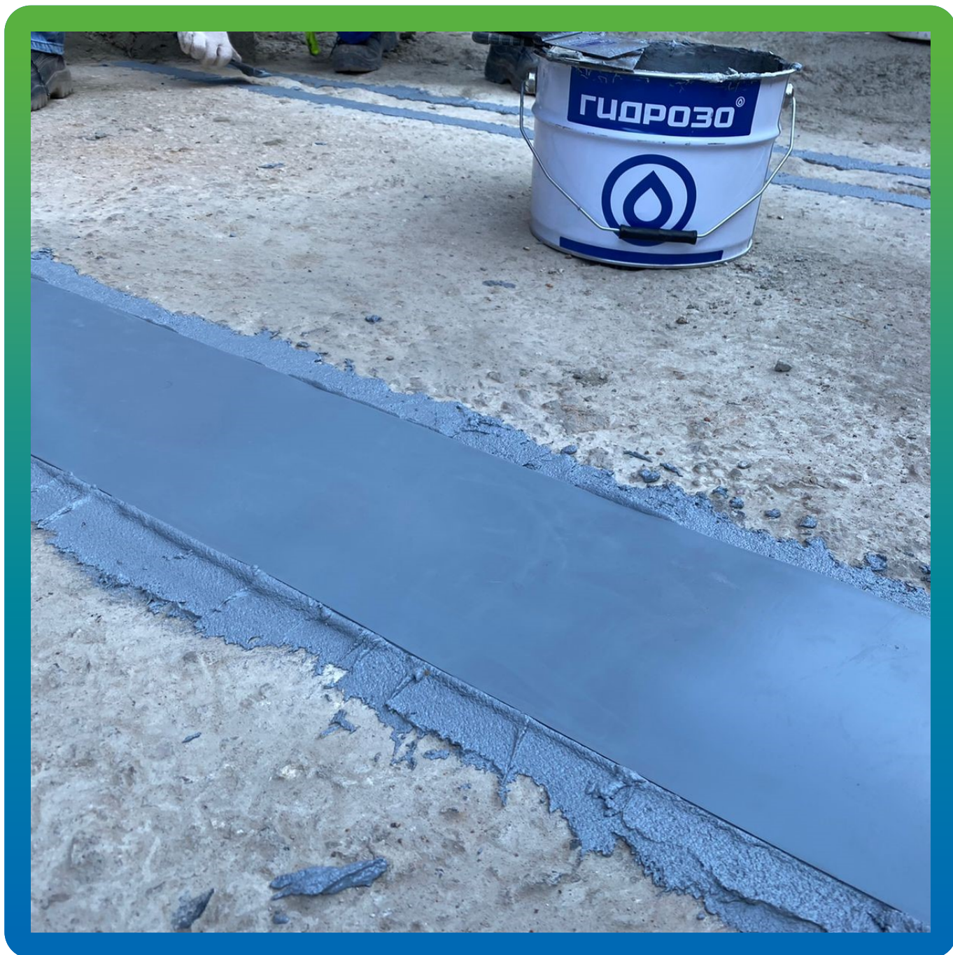
Смонтированный участок с Манопокс 331 и Манодил Про