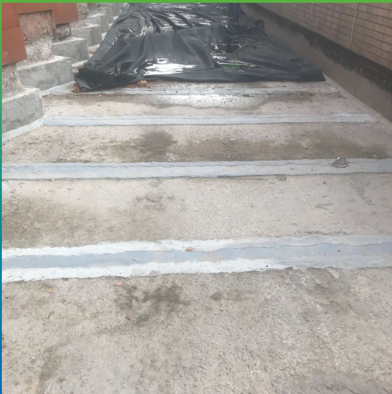
Начало работ по укладке ЭПДМ