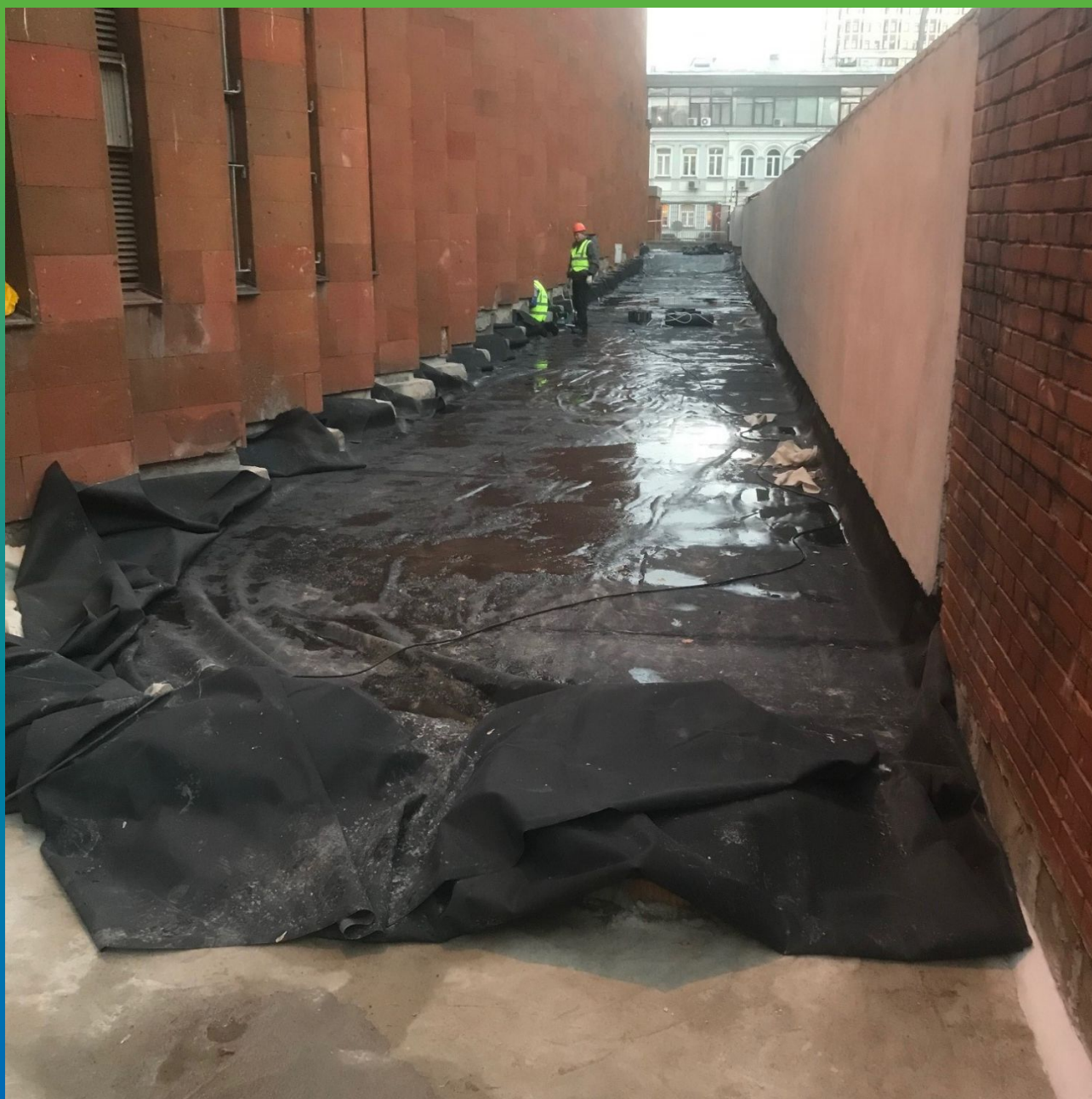
Раскладка ЭПДМ Прелести СТ