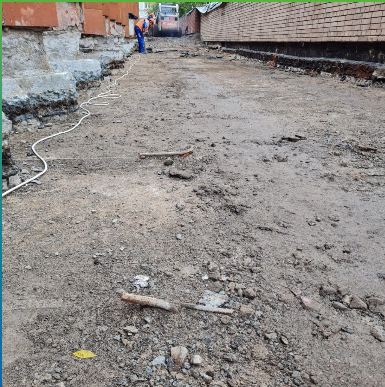
Подготовка площадки под дальнейшие работы