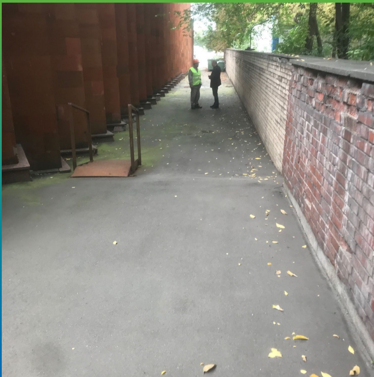
Вид стилобатной части до выполнения ремонтных работ