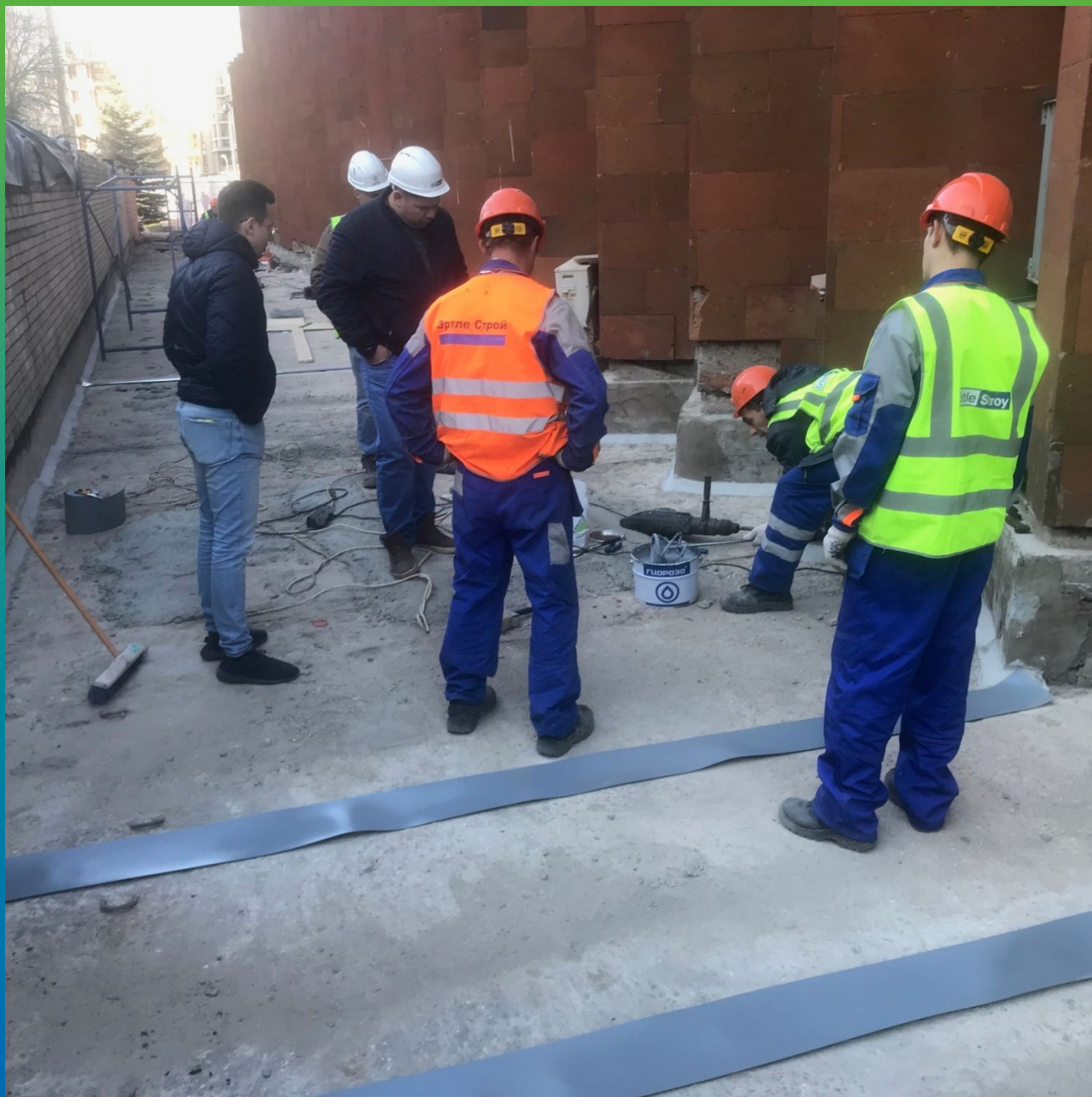
Обучение монтажа ленты Манодил Про и Манопокс 331