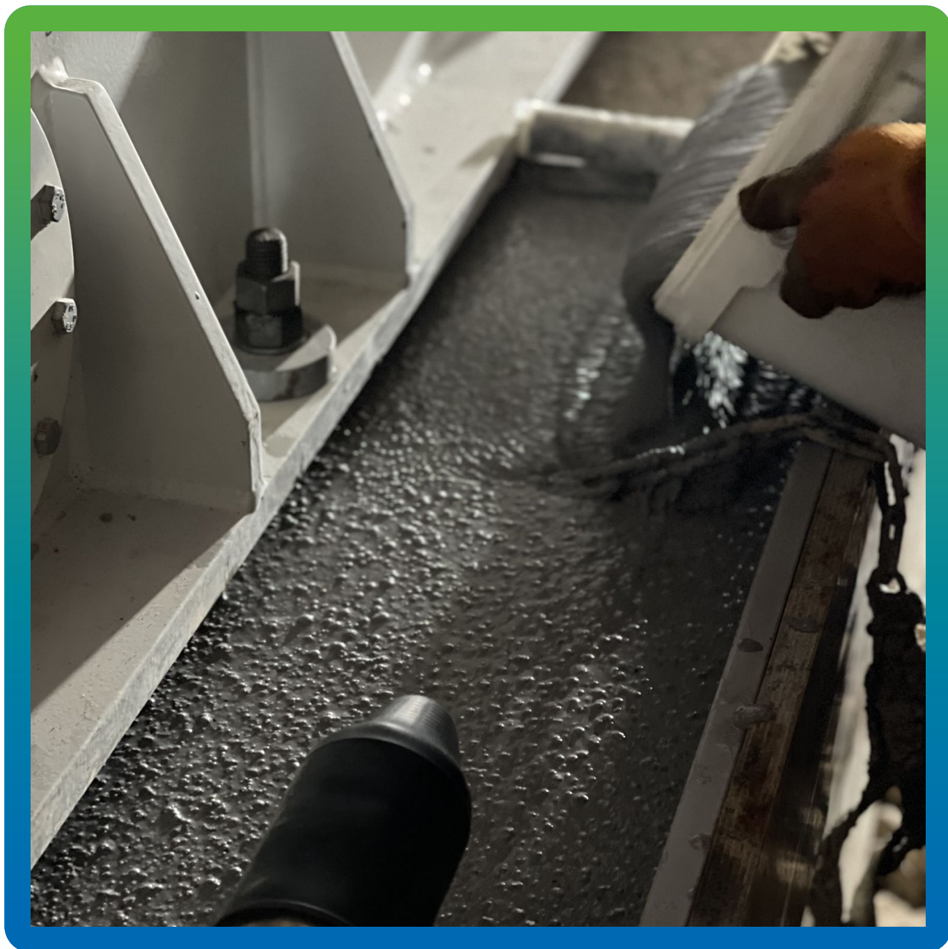
Заливка состава Стармекс ФМ 100 под компрессор