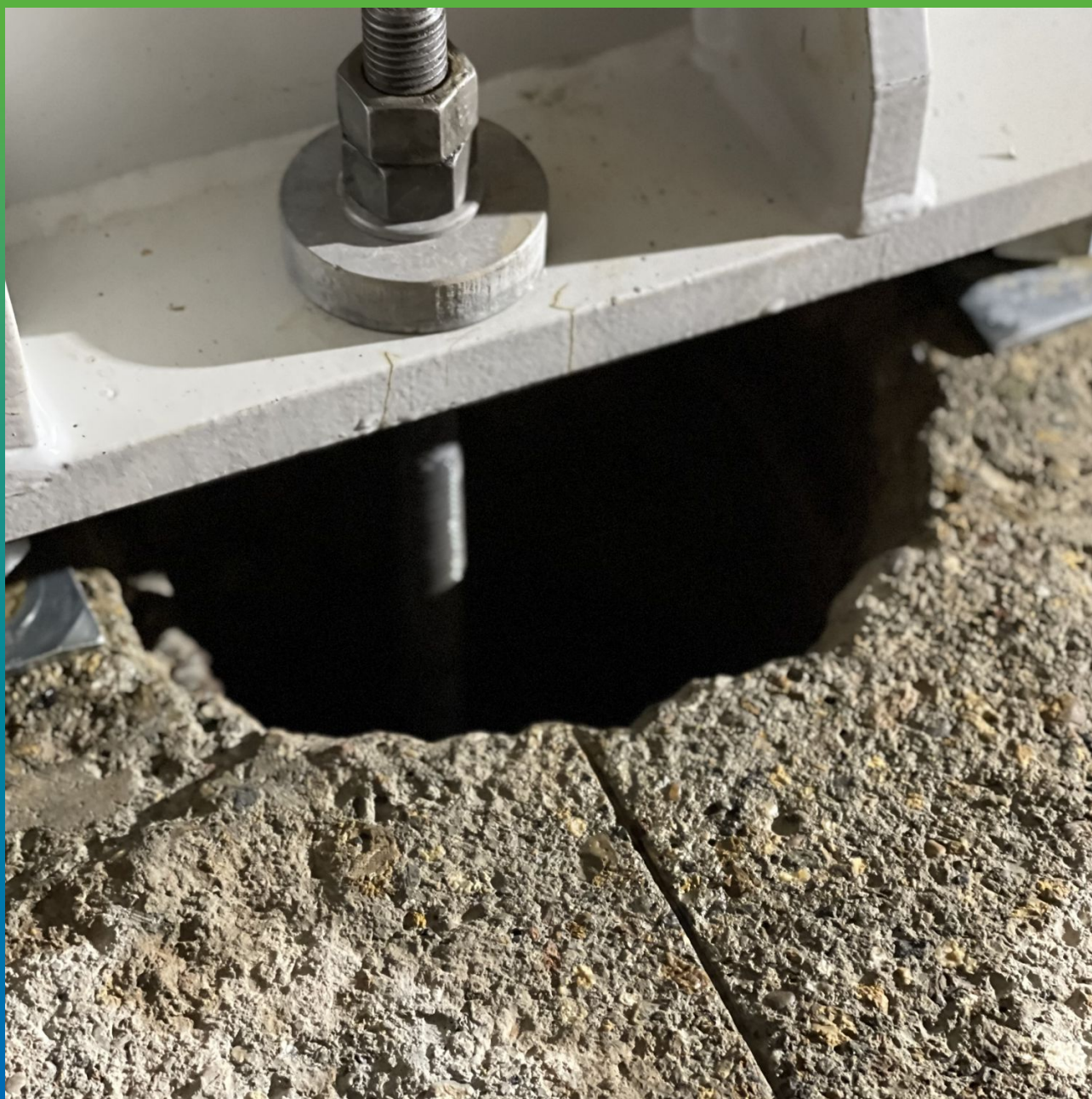
Увлажненный анкерный цилиндр