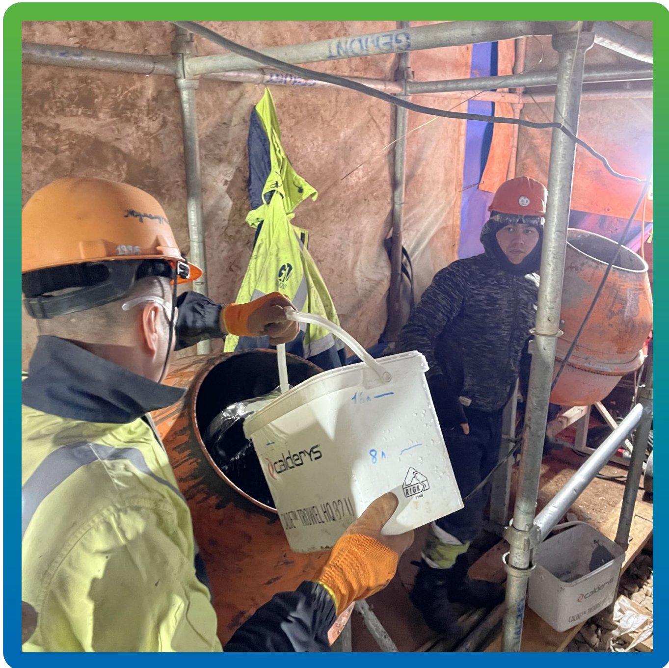
Добавление воды в электромешалку