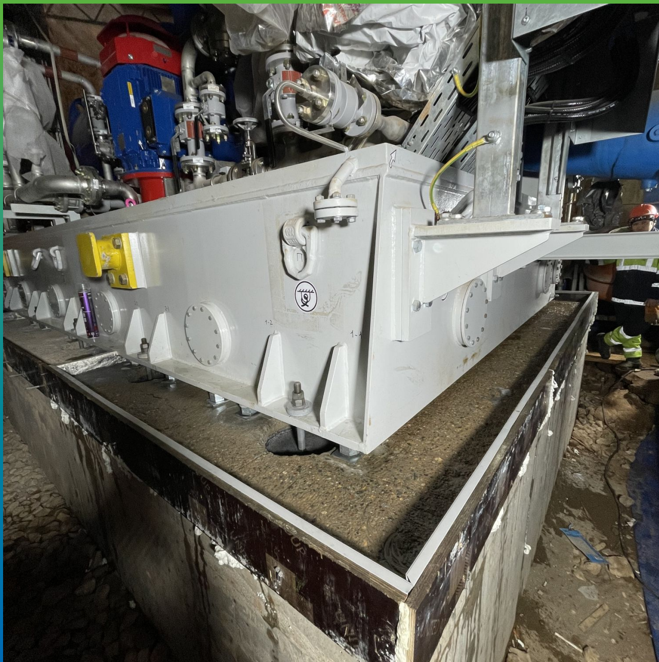
Увлажнение основной площади под компрессором