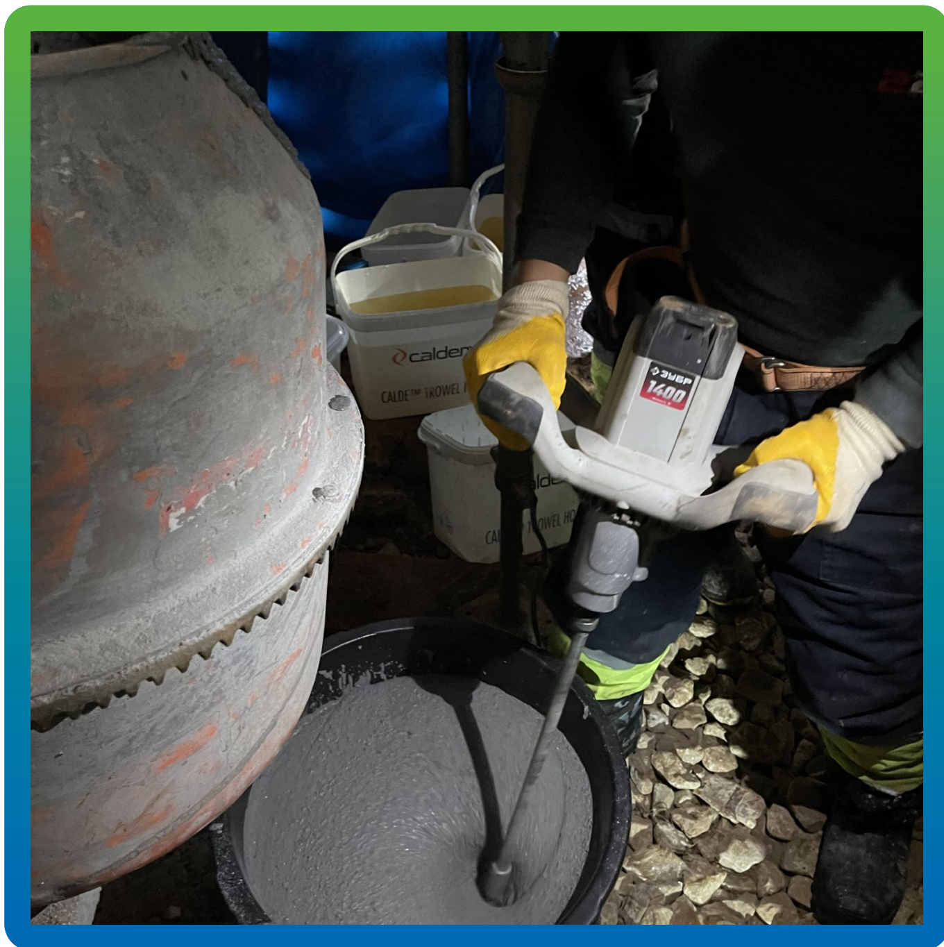
Дополнительное перемешивание состава