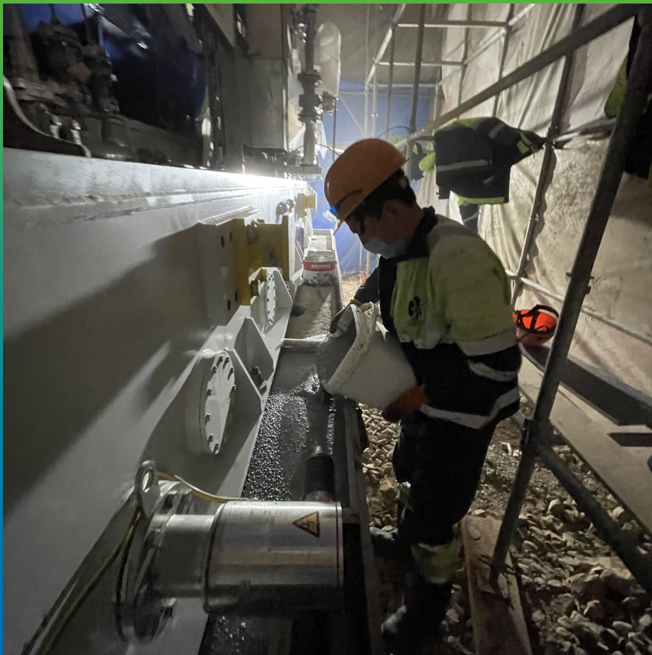
Заливка состава Стармекс ФМ 100 под компрессор