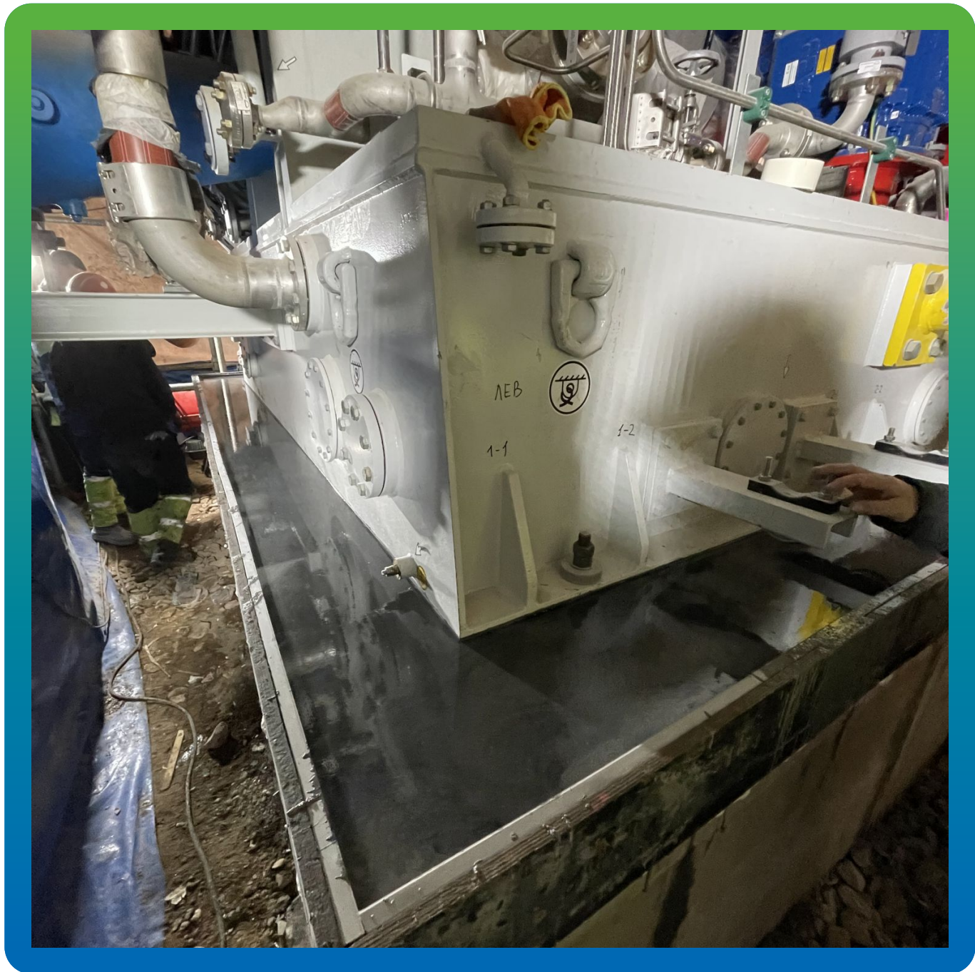
Финишный вид Стармекс ФМ 100