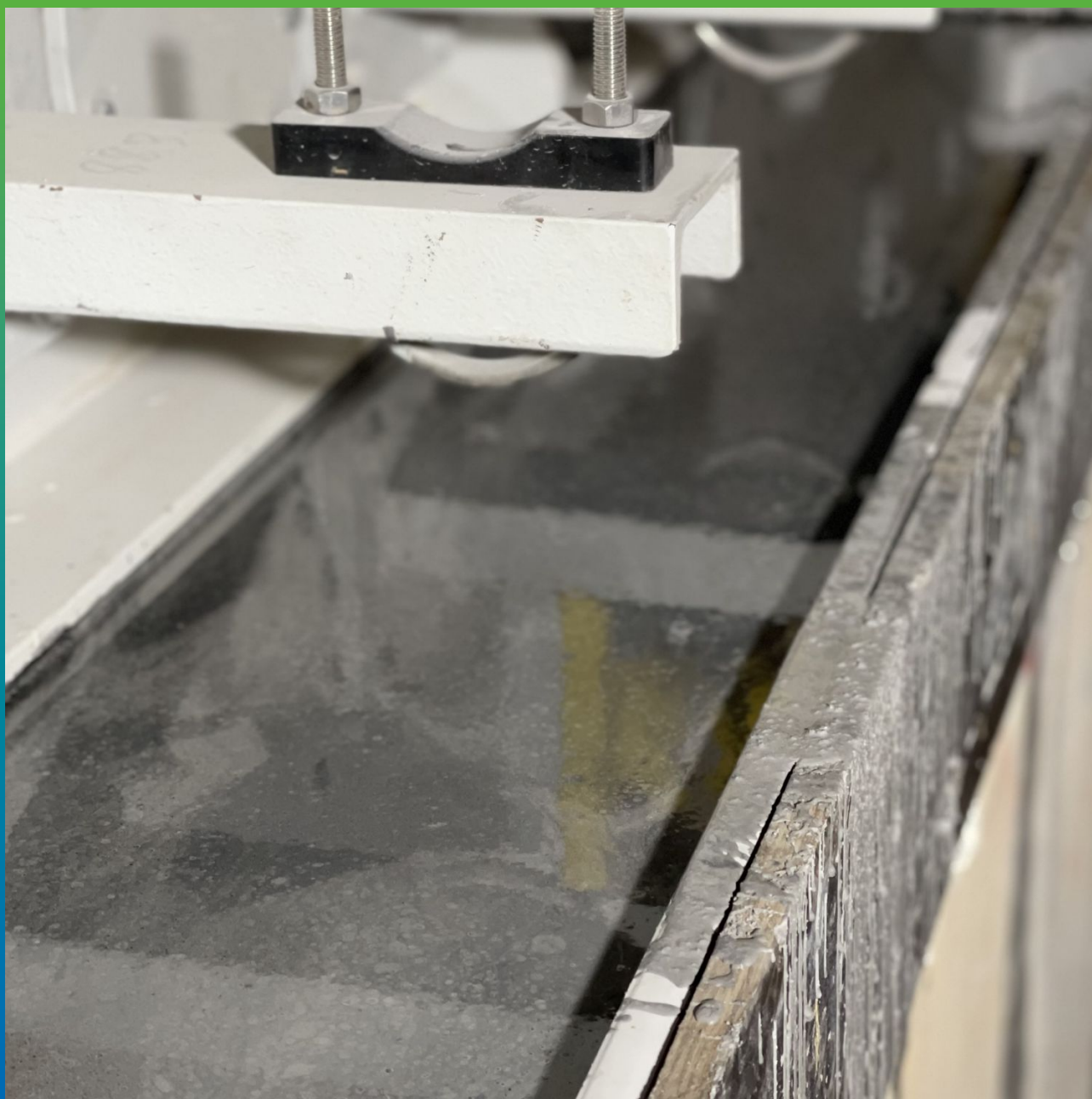
Финишный вид Стармекс ФМ 100