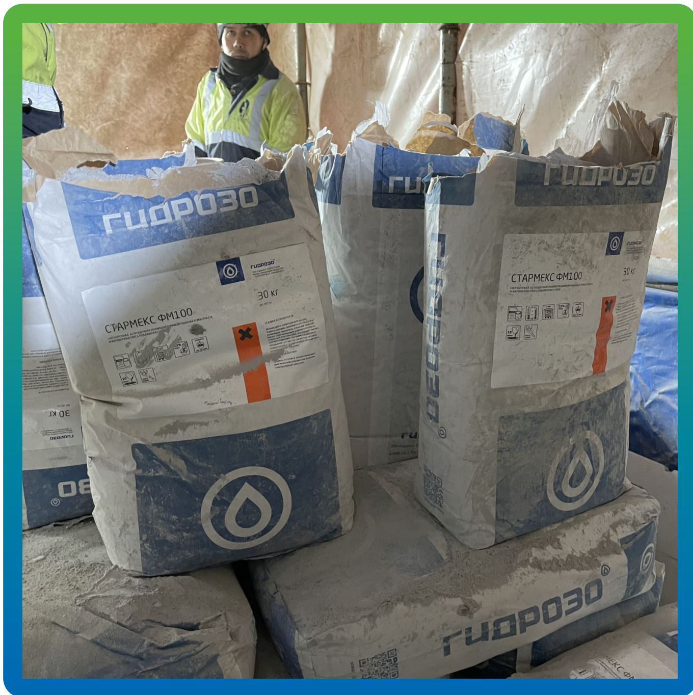
Материал на объекте