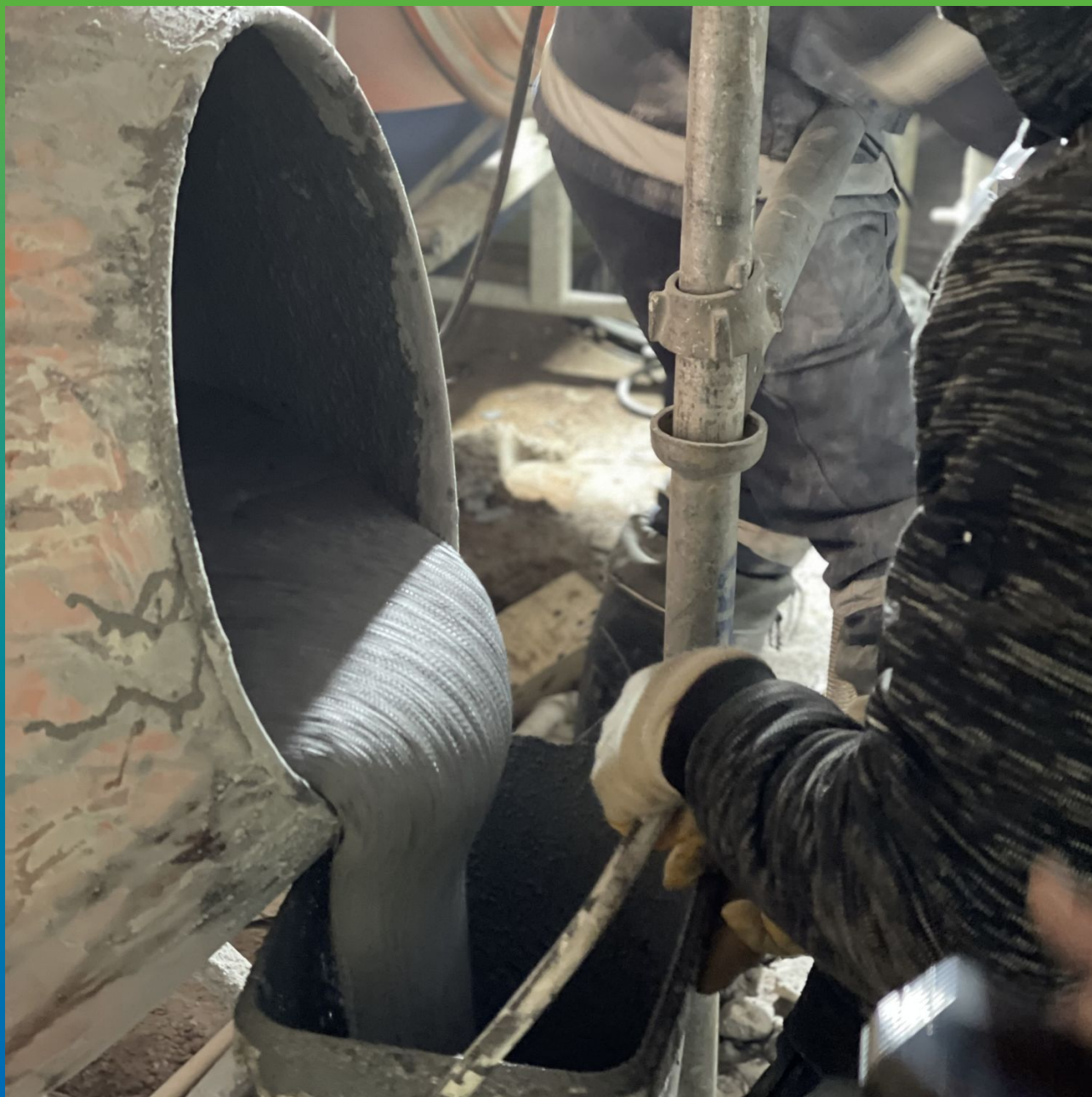
Распределение состава Стармекс ФМ 100 по ведрам для дальнейшего перемешивания