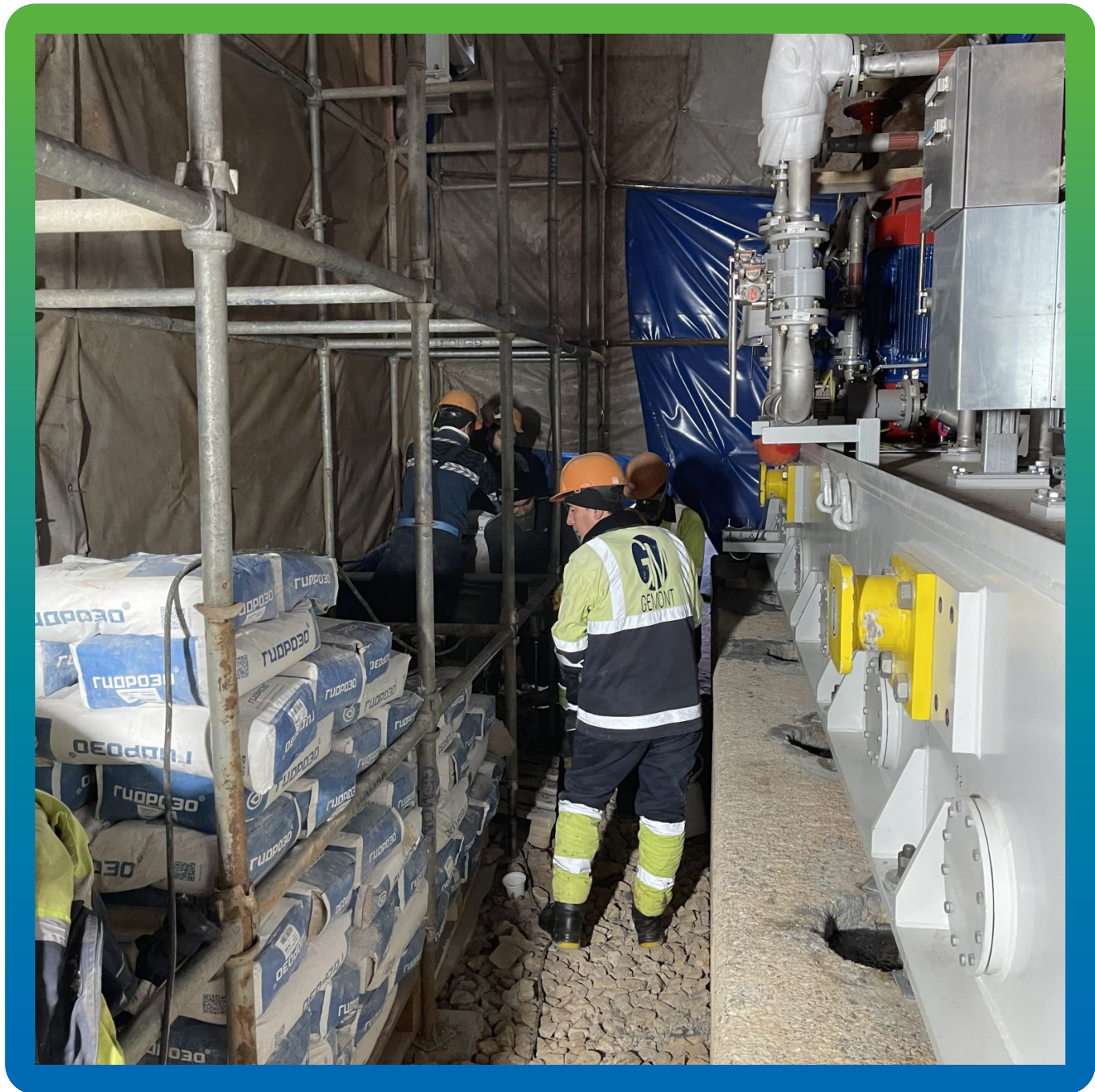
Материал на объекте и анкерные каналы