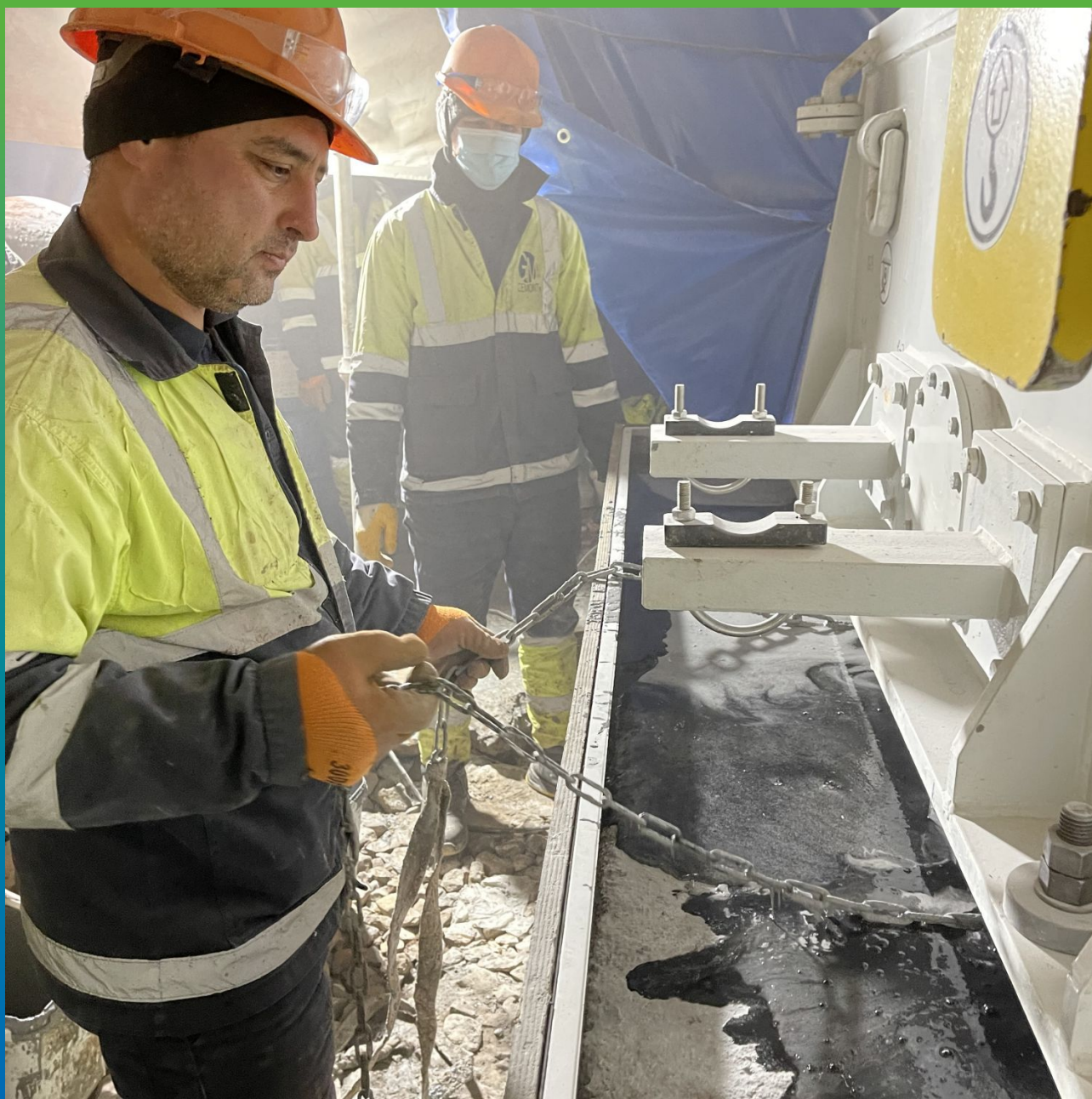
Вытягивание и распределение состава цепями