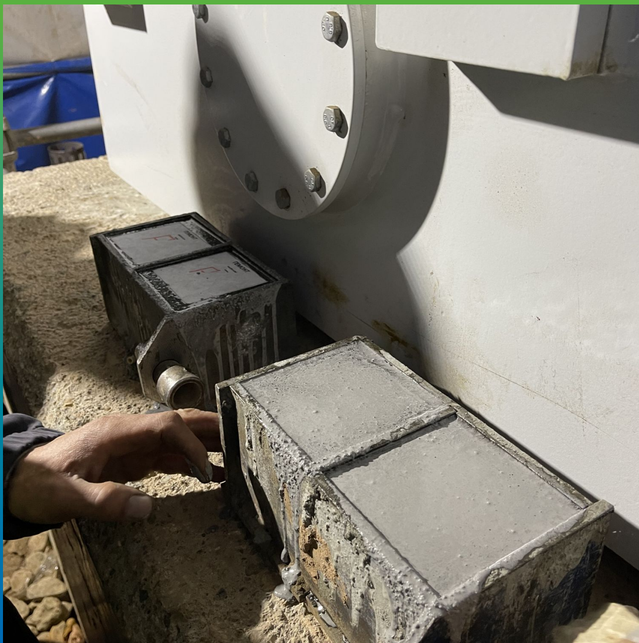
Заливка контрольных образцов для лаборатории