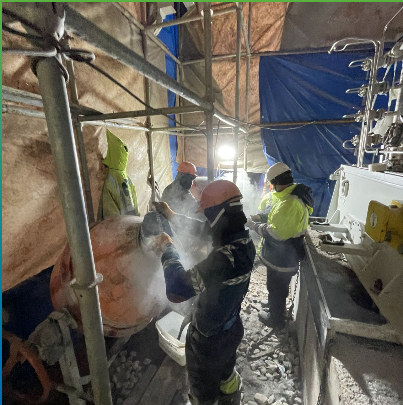
Смешивание состава Стармекс ФМ 100