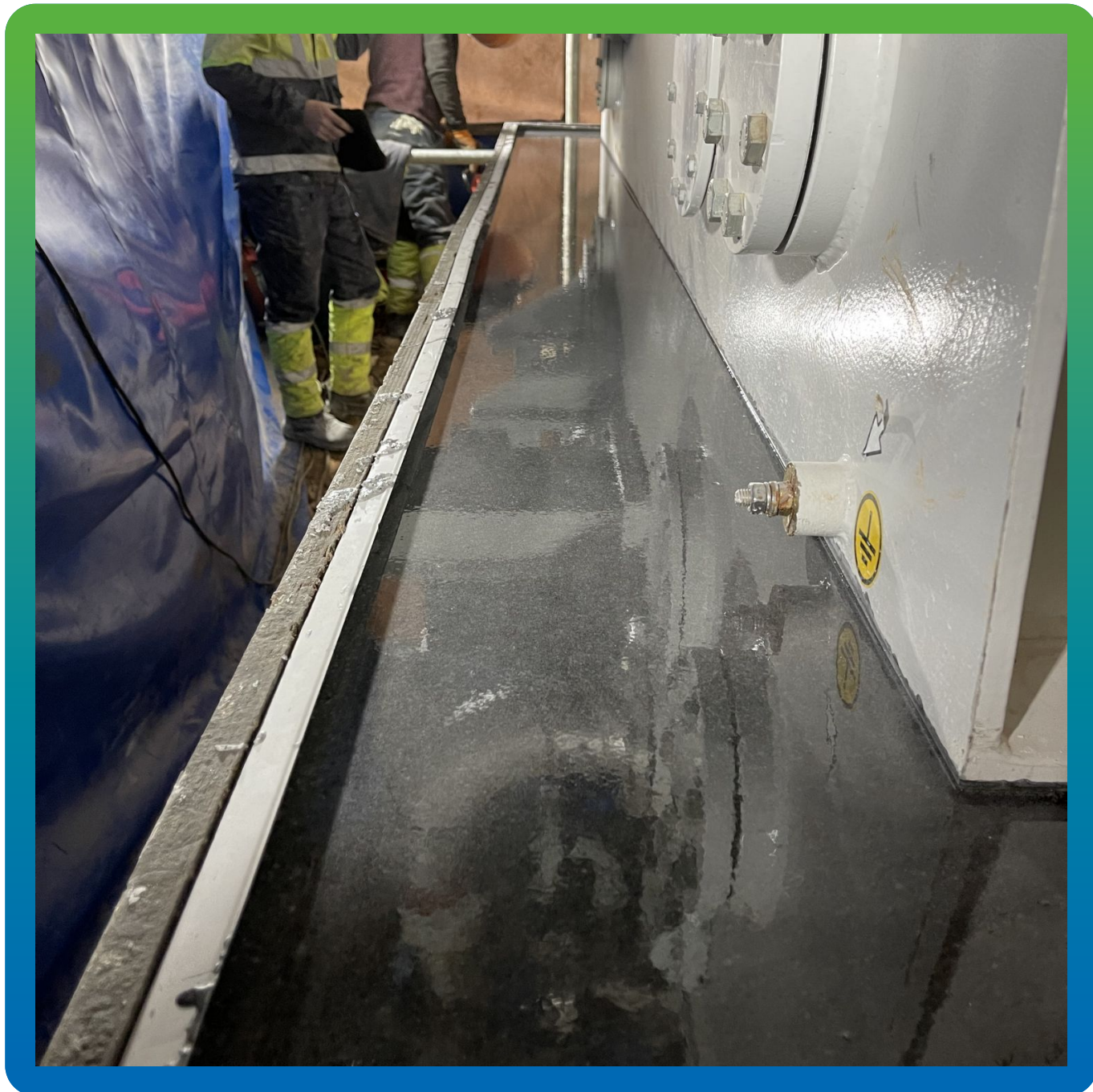
Финишный вид Стармекс ФМ 100