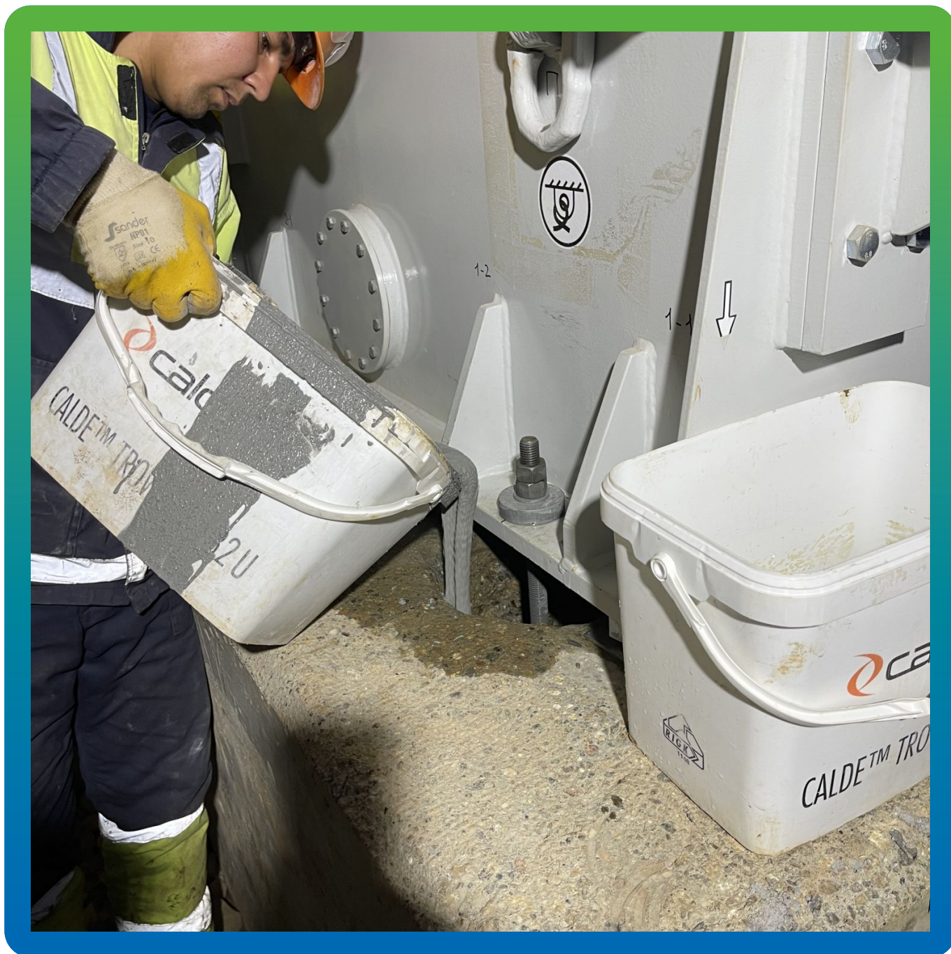
Заливка анкерных каналов на 2/3 высоты