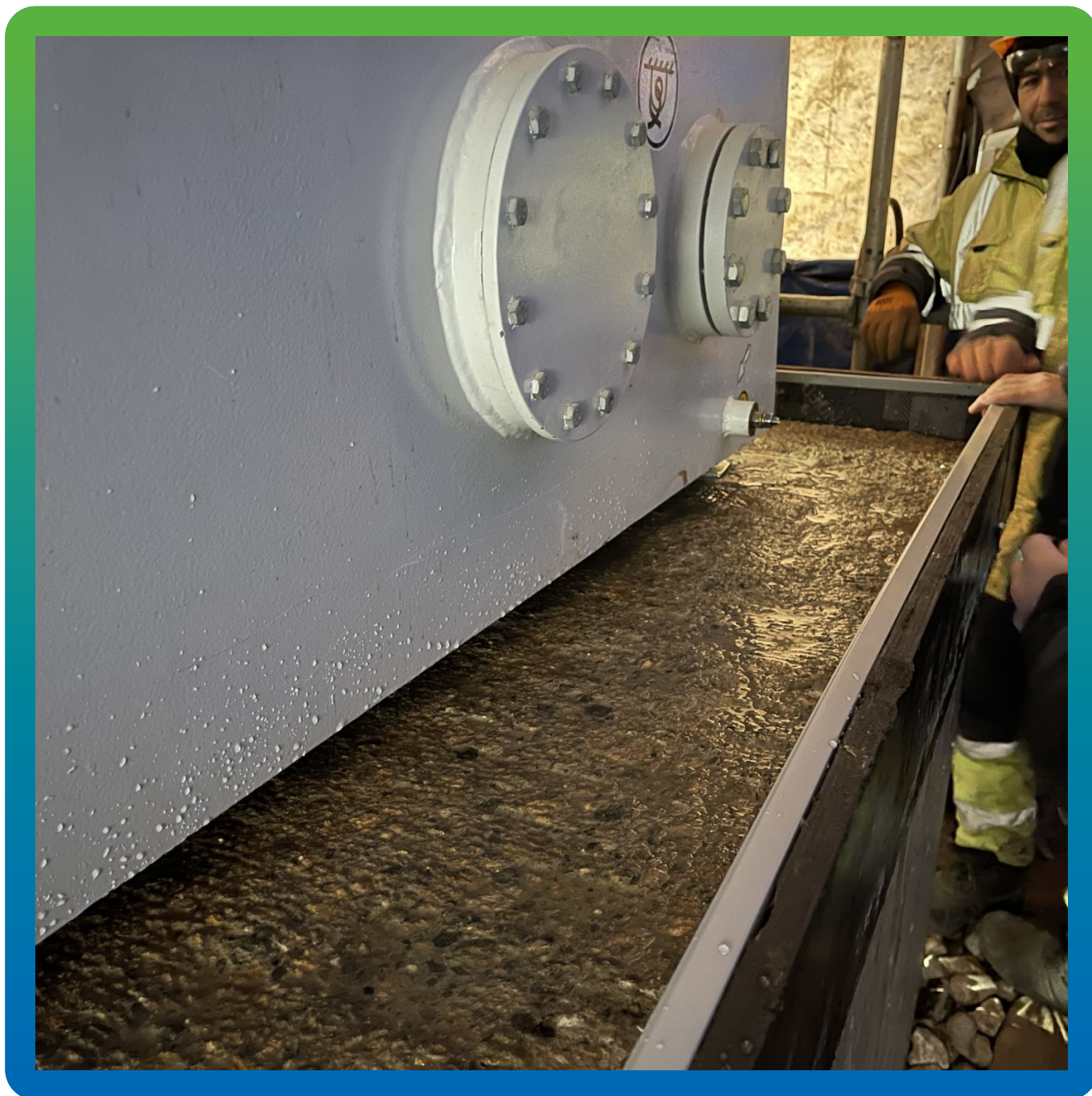
Увлажнение основной площади под компрессором