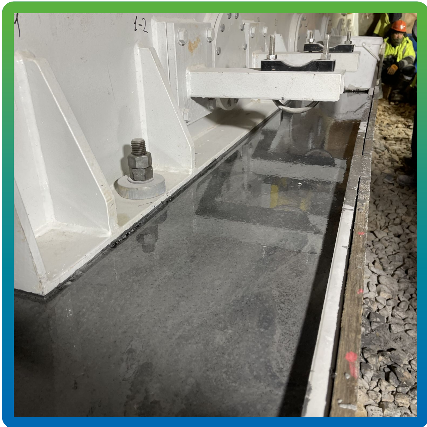
Финишный вид Стармакс ФМ 100