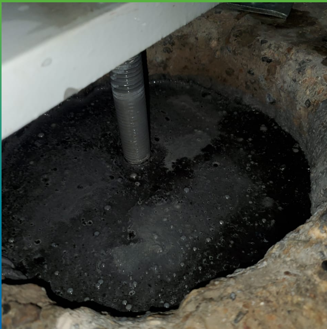
Затвердевший состав Стармекс ФМ 100