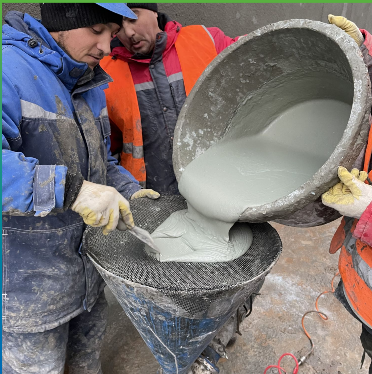
Заливка состава в оборудование для нанесения