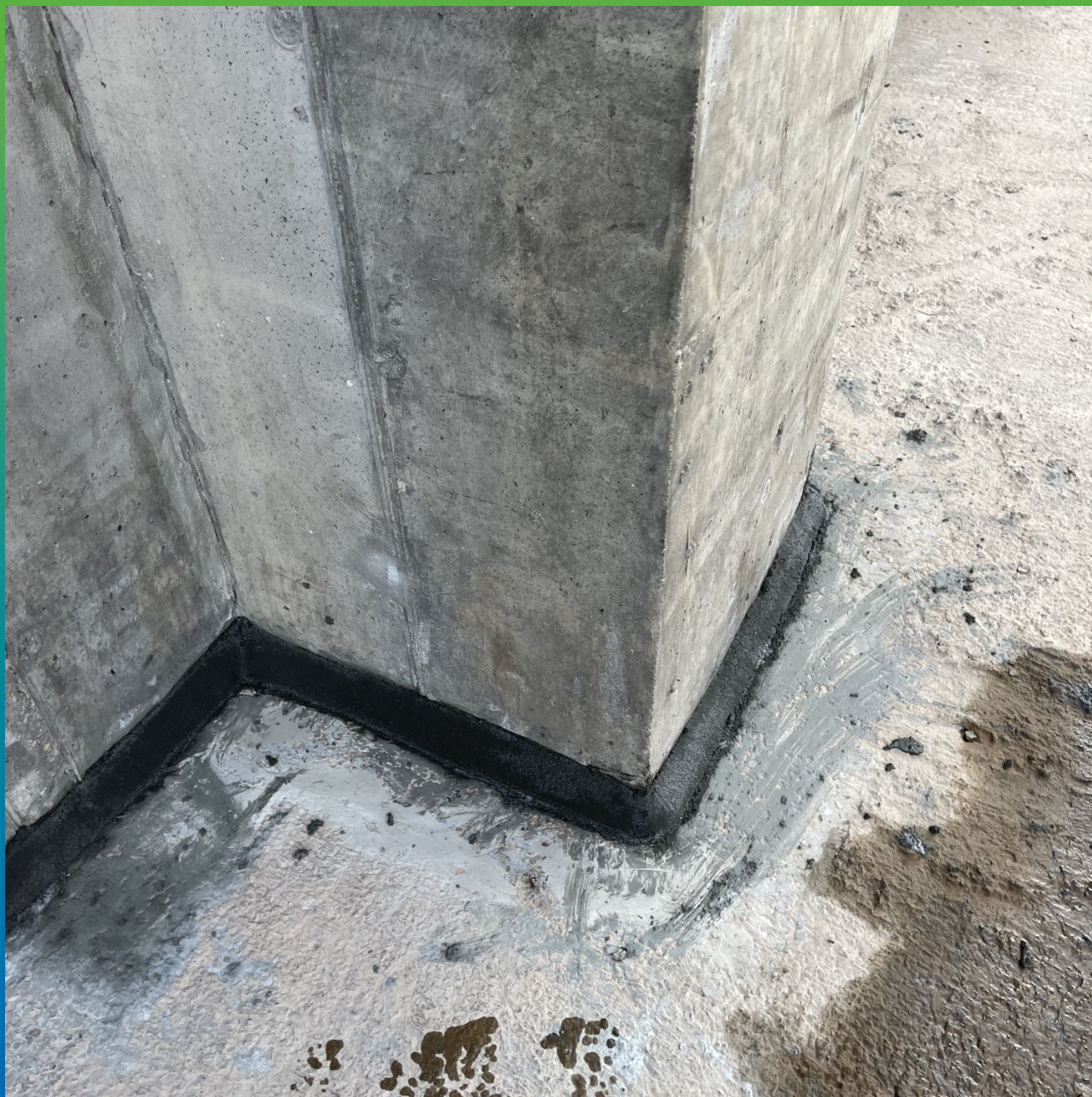
Заполнение штробы составом Стармекс РМ4