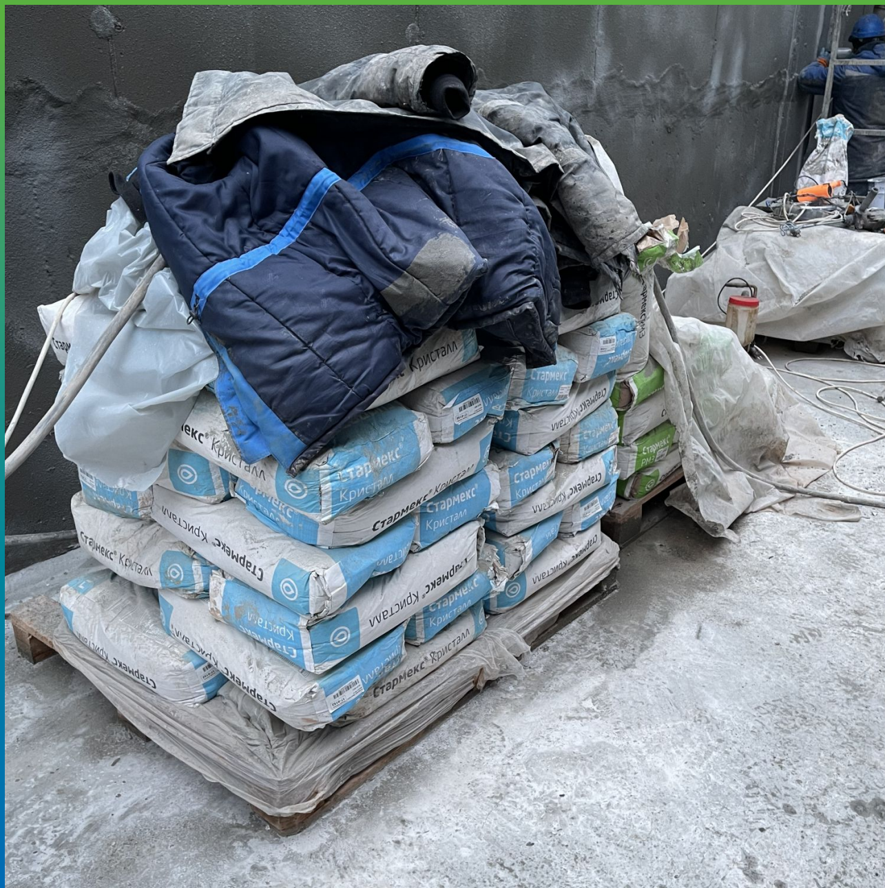
Материал Стармекс Кристалл на объекте