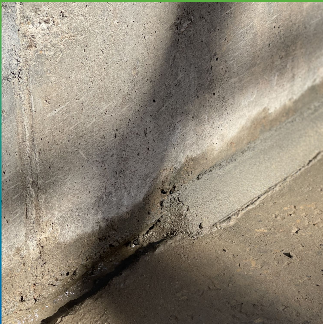
Заполнение штробы составом Стармекс РМ4