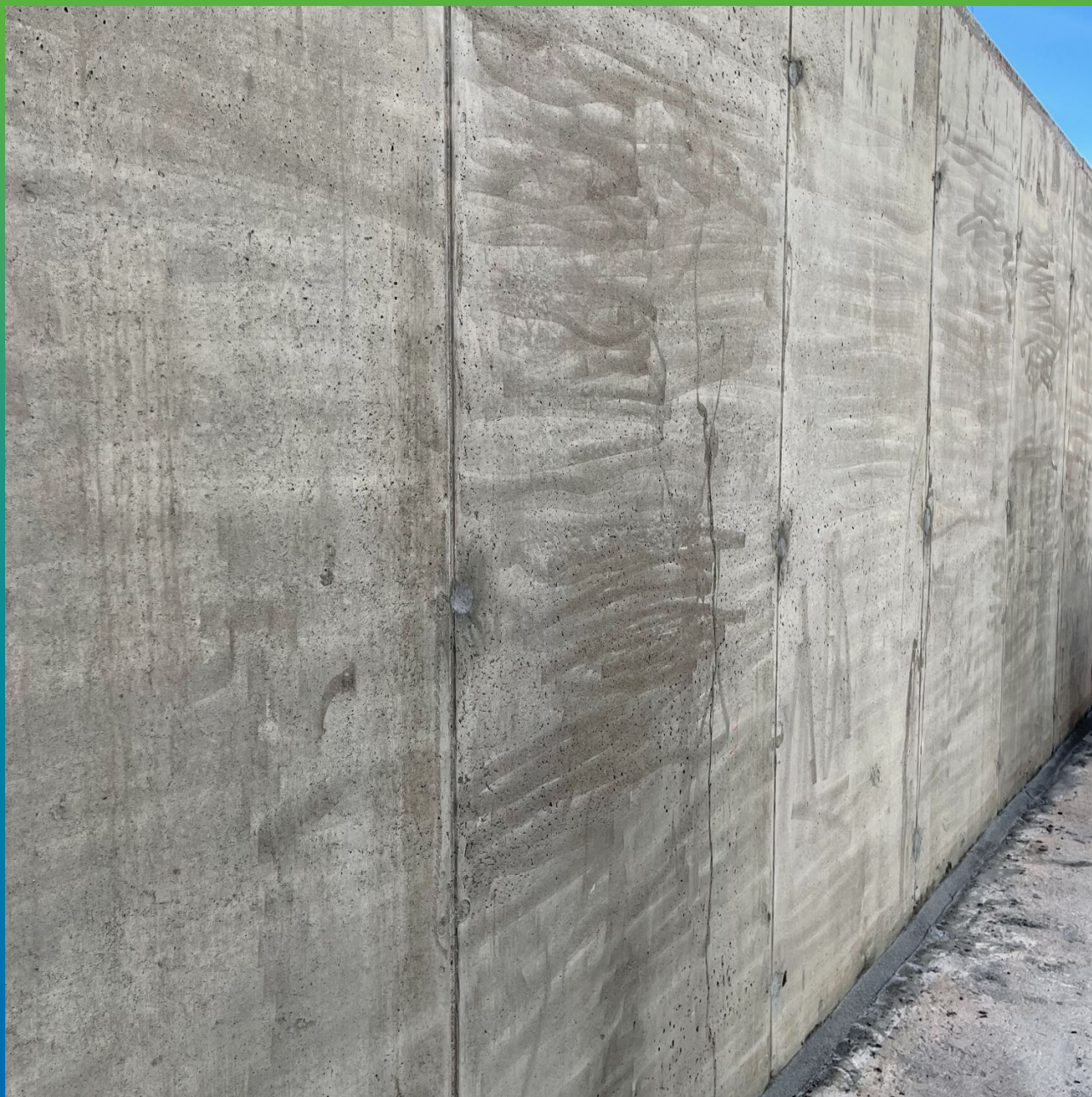
Штроба, заполненная составом Стармакс РМ4 и стена после гидроструйной очистки