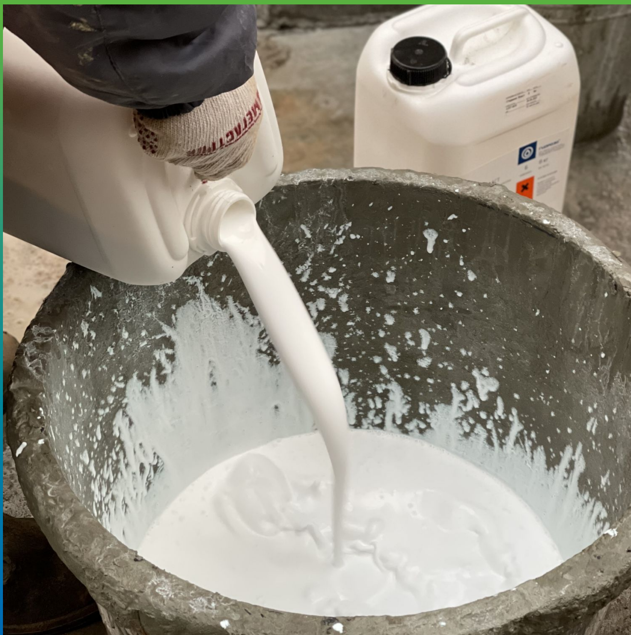
Приготовление состава Стармекс Эласт