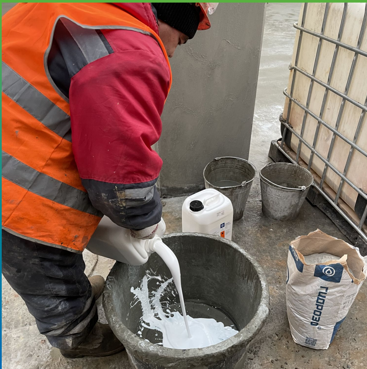
Приготовление состава Стармекс Эласт