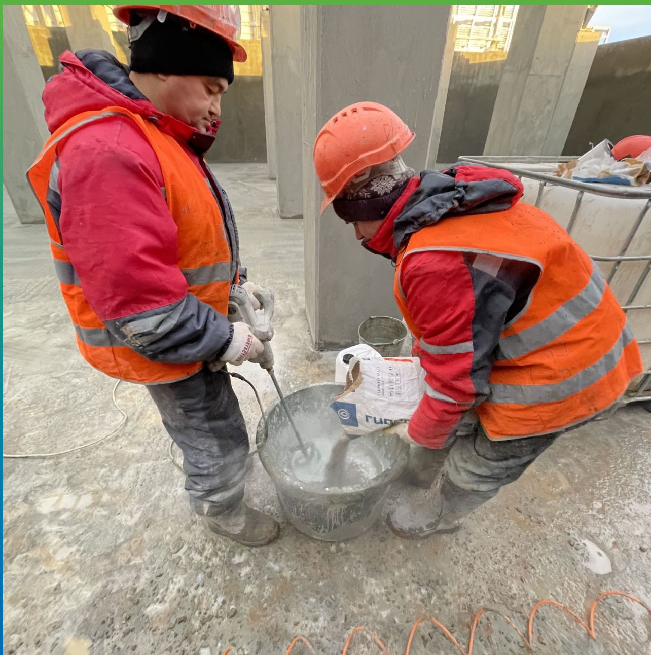
Приготовление состава Стармекс Эласт