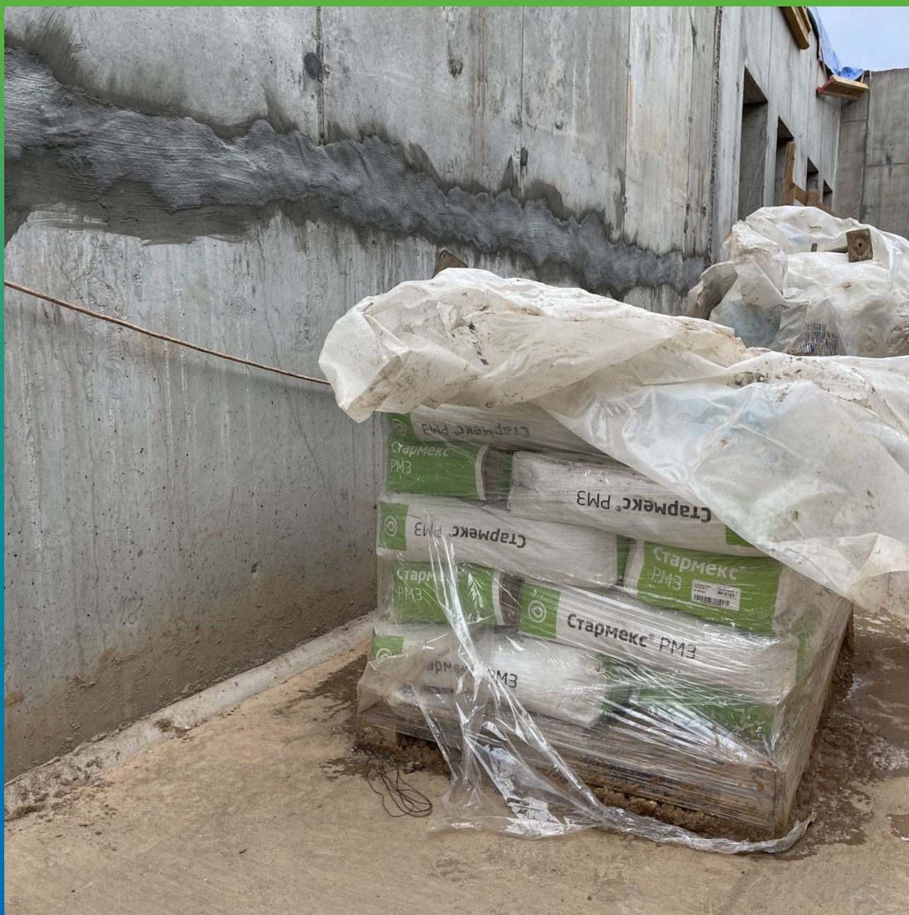
Материал Стармекс РМЗ на объекте