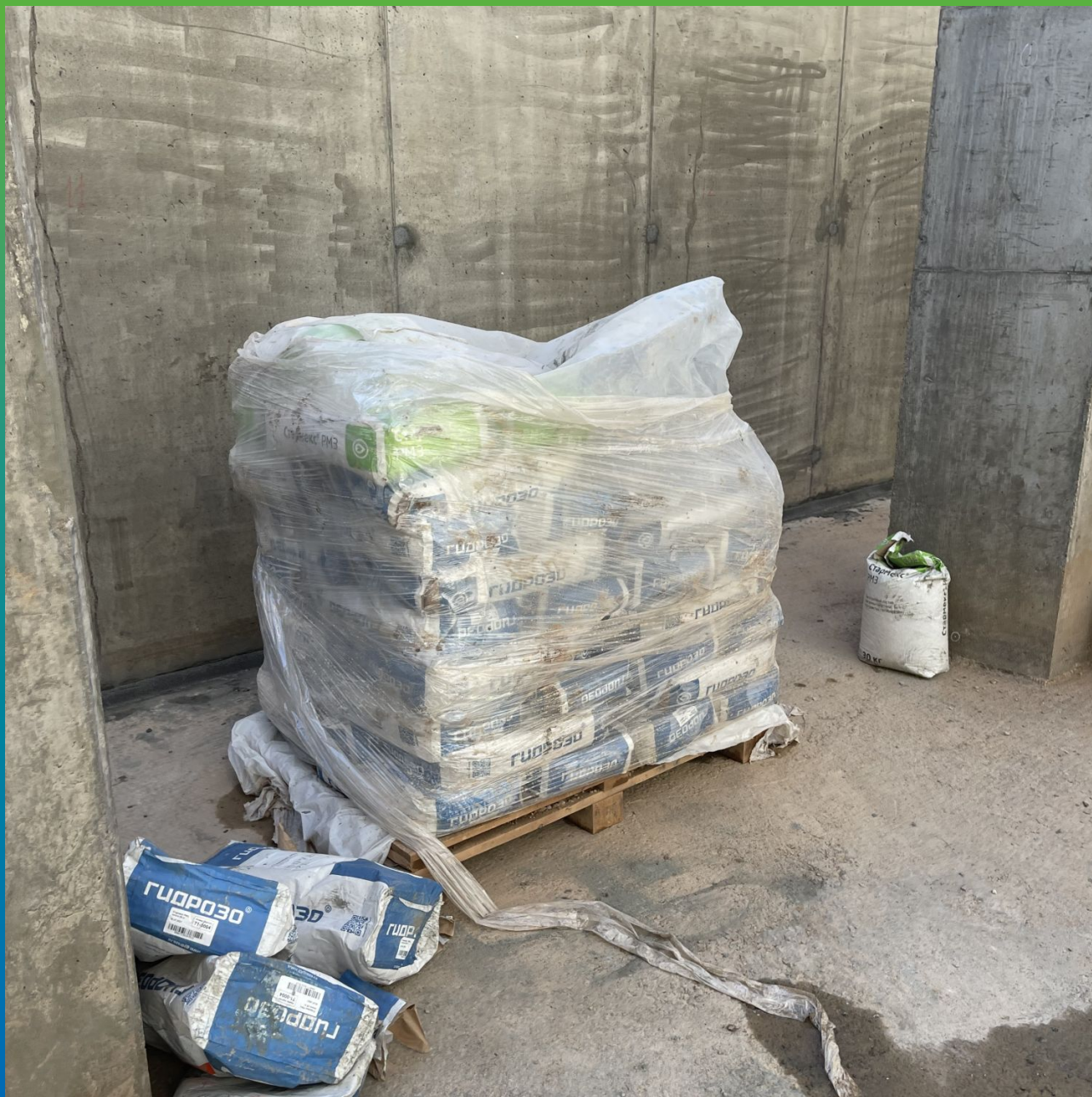
Материал Стармекс Эласт на объекте