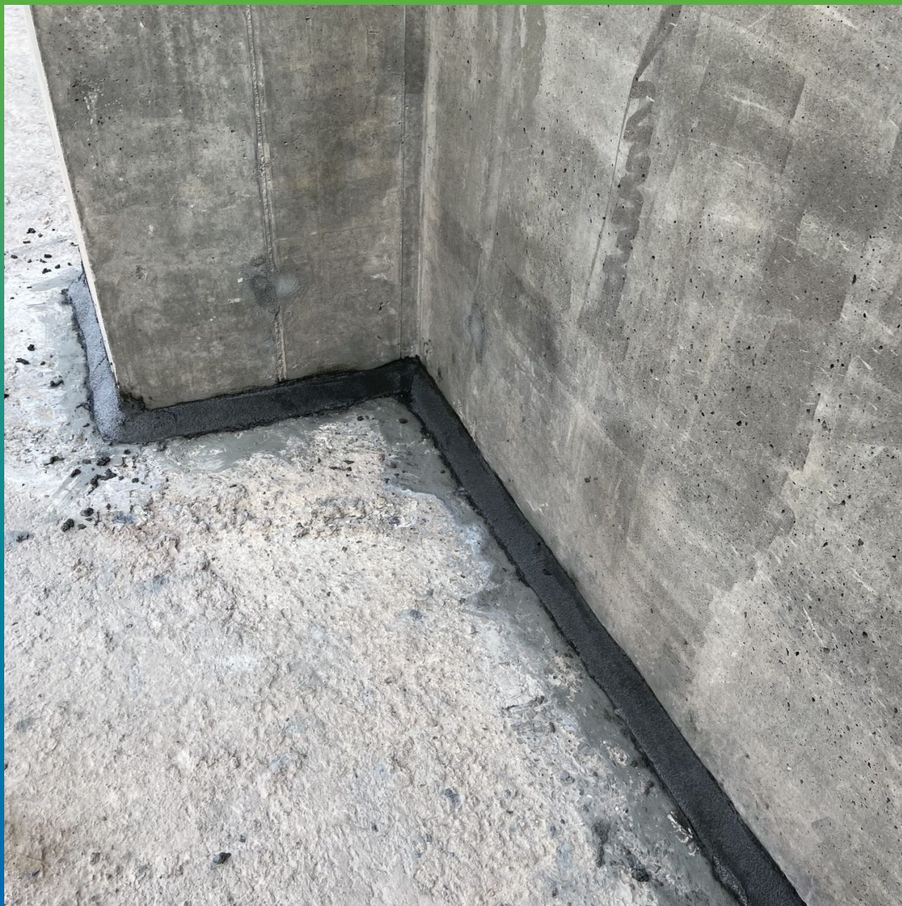
Заполнение штробы составом Стармекс РМ4