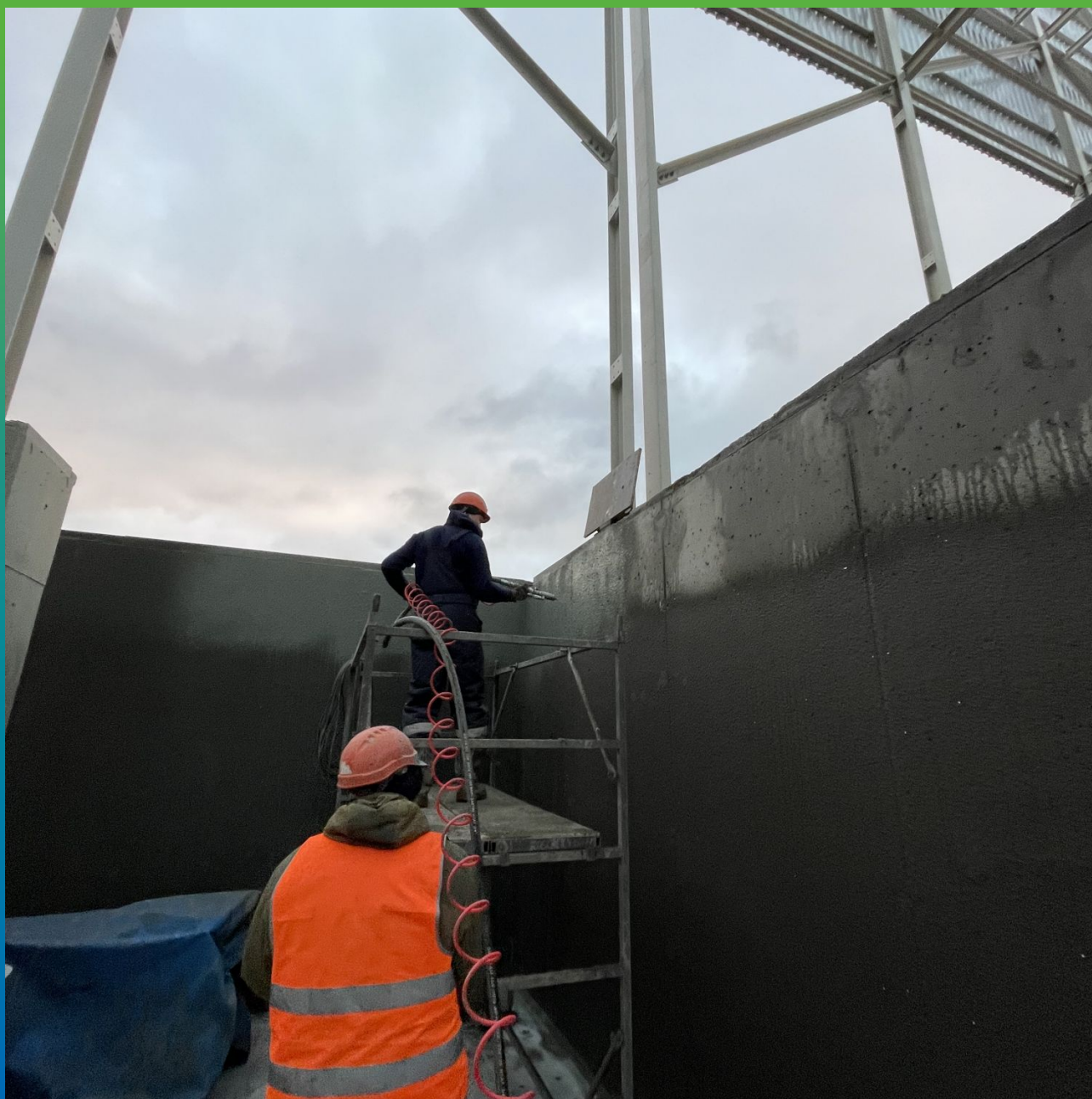
Механизированное нанесение материала Стармекс Эласт