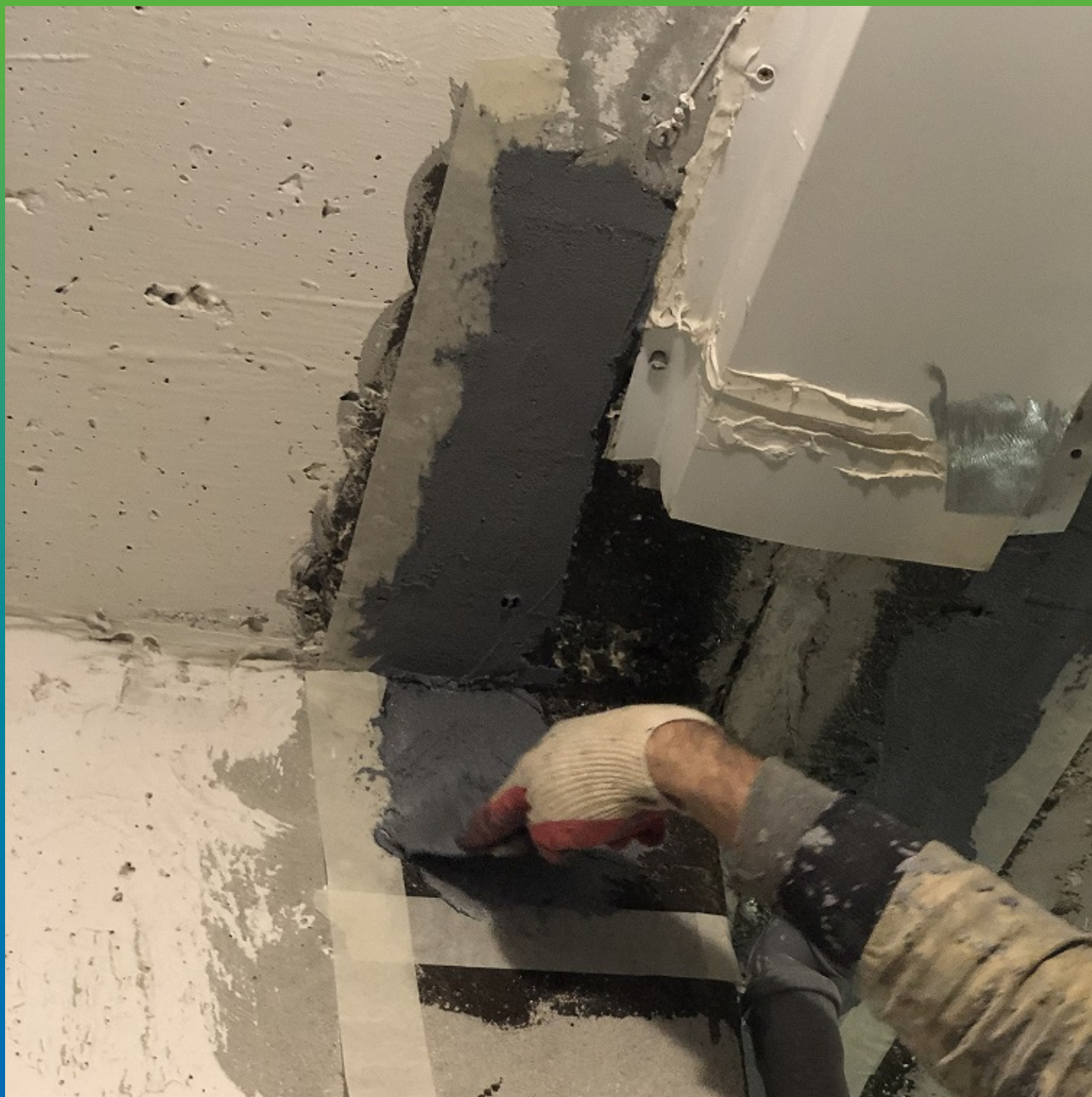
Укладка клея Манопокс 331 на загрунтованную поверхность