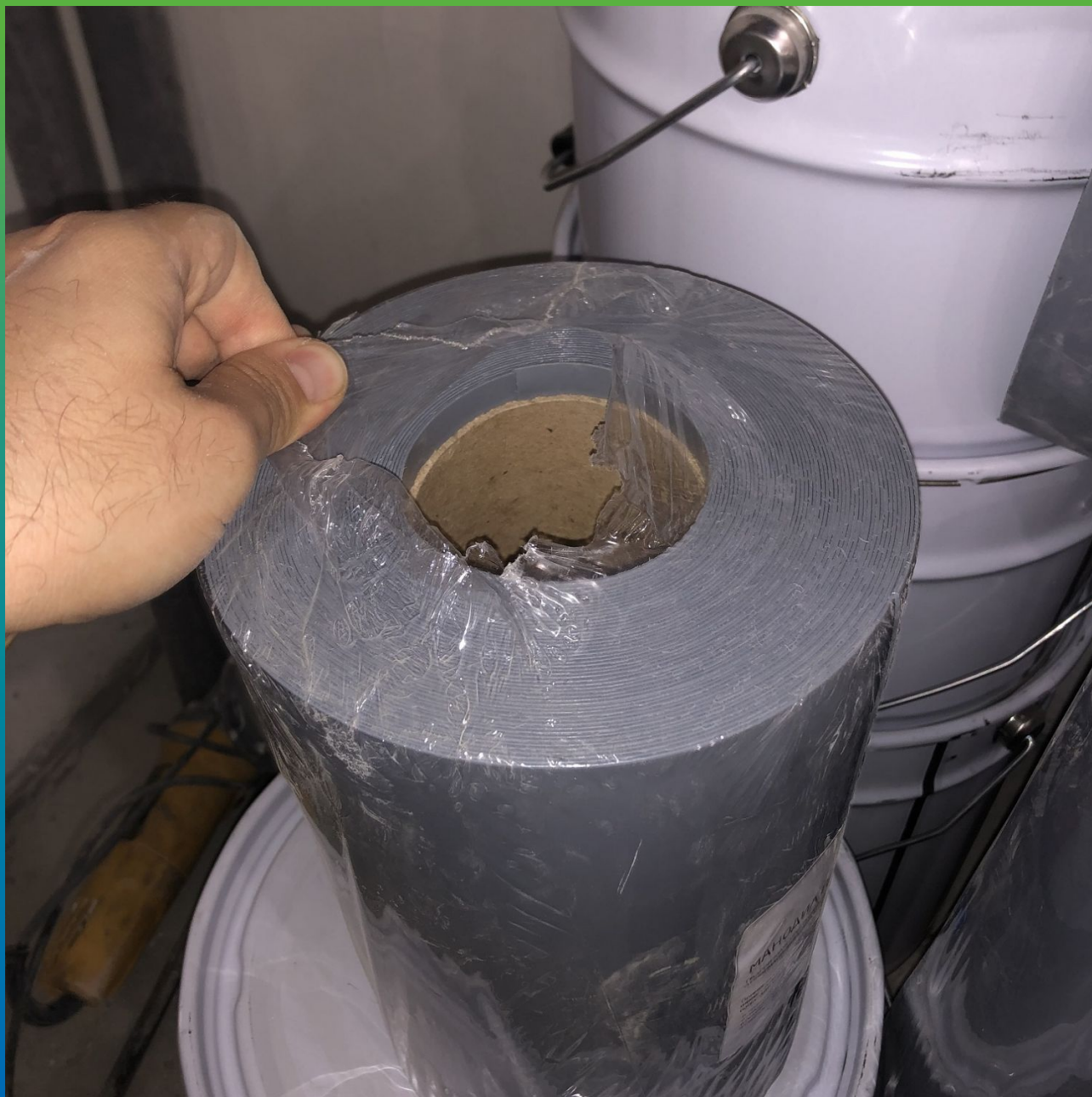
Материалы ГИДРОЗО на участке - лента Манодил Про