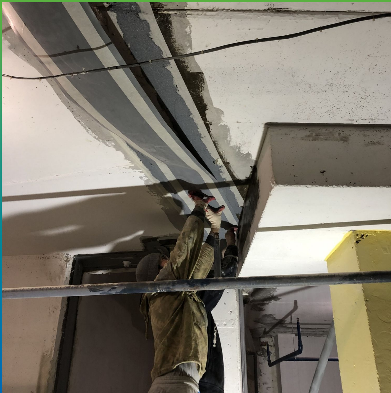
Укладка ленты Мандил Про на участок