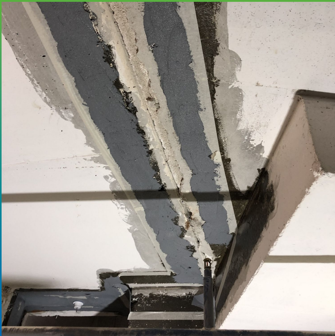
Общий вид готового участка для монтажа лент