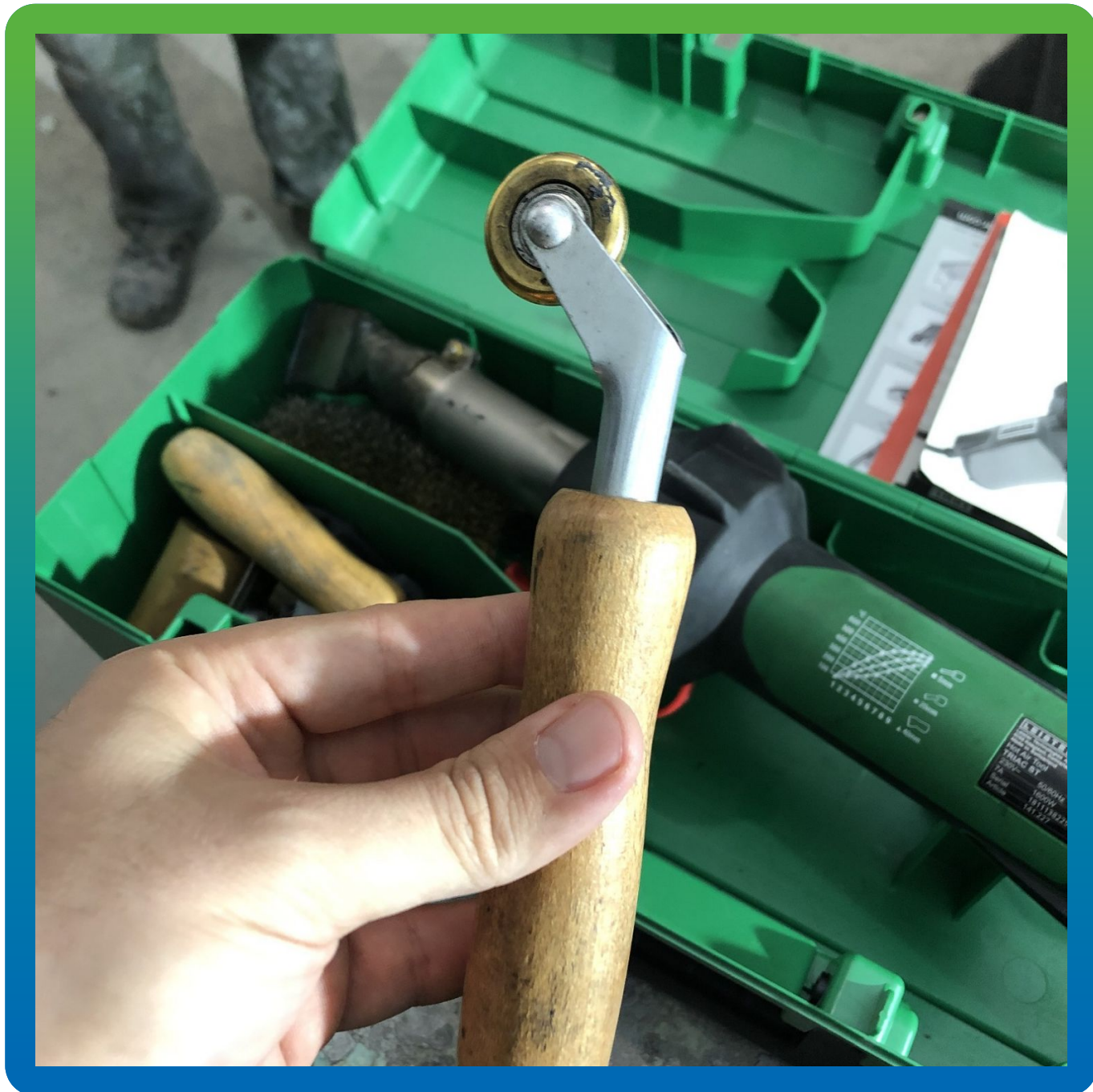
Оборудование для сварки на учатске - фен и прикаточные ролики