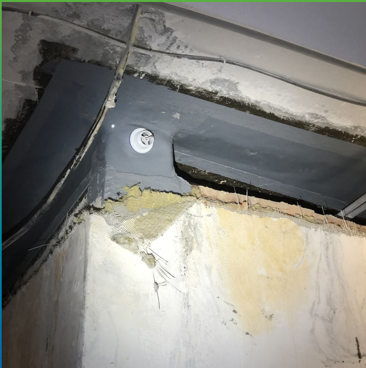
Вид смонтированной ленты на геометрически сложном участке с вмонтированной воронкой водосброса