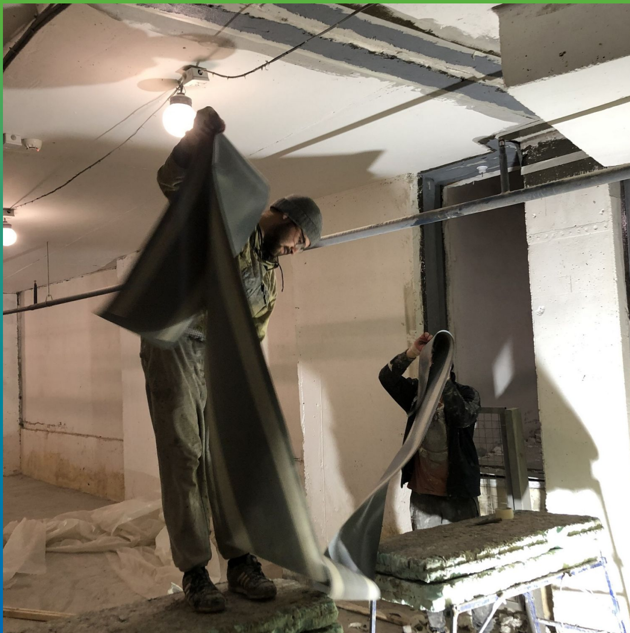
Расправка и подгонка подготовленной ленты Манодил Про