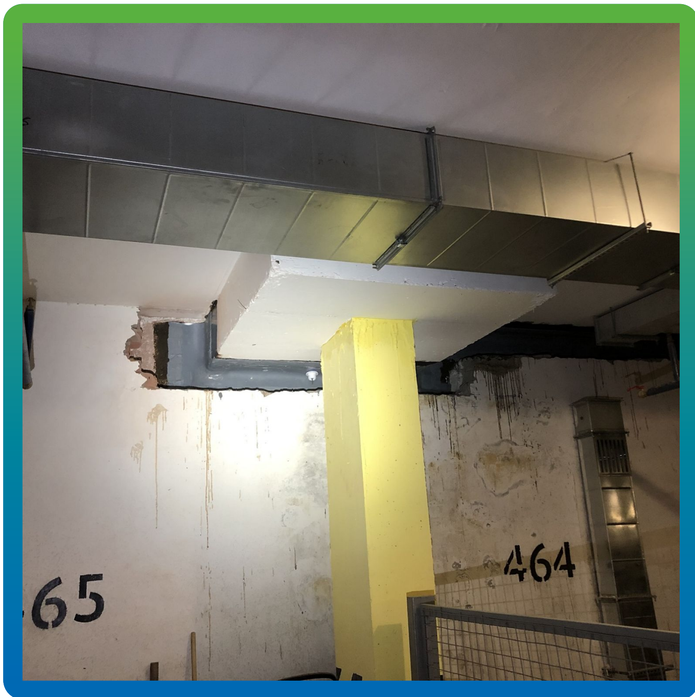
Общий вид смонтированной ленты Манодил Про на участке