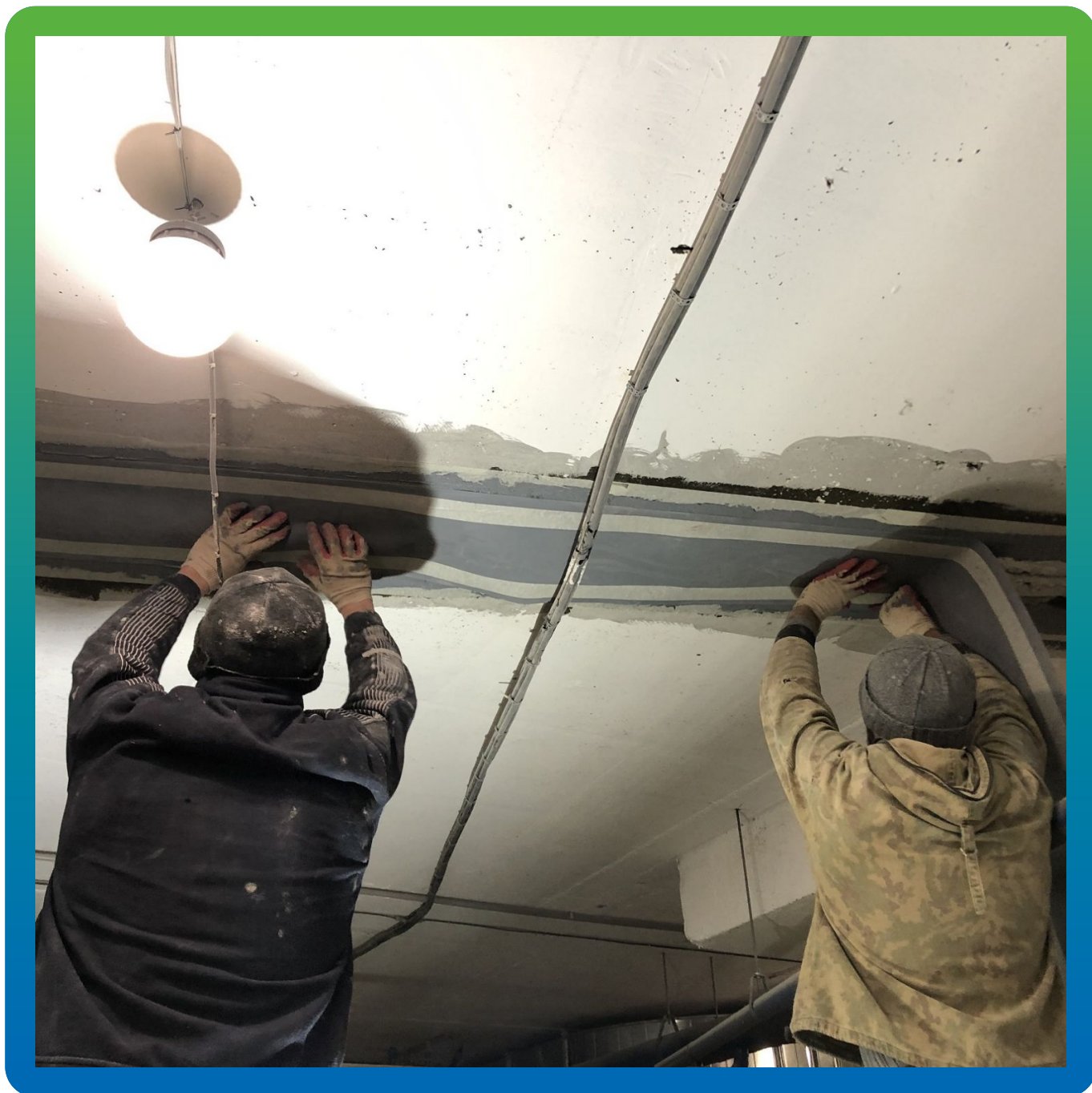
Подгонка ленты и правка монтажа