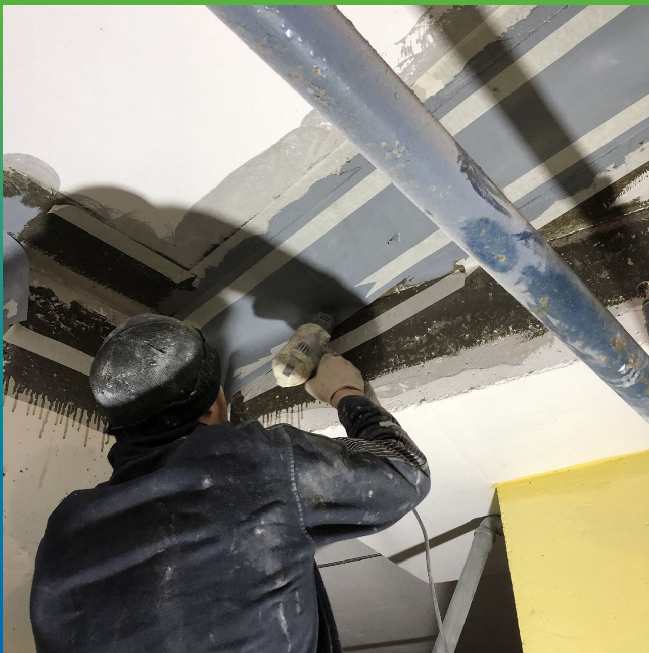
Размягчение ленты строительным феном для формовки под углы и споряжения