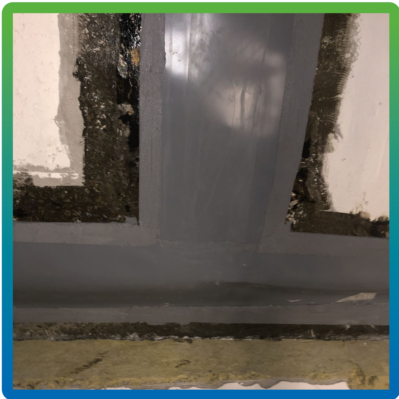
Вид смонтированной ленты на пересечении Т образного шва