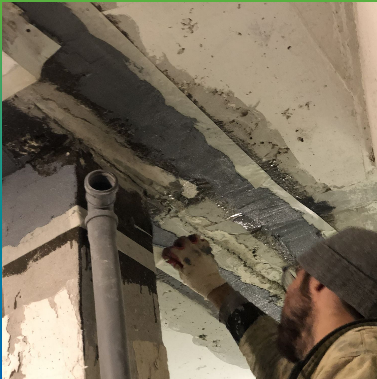
Укладка клея Манопокс 331 на загрунтованную поверхность