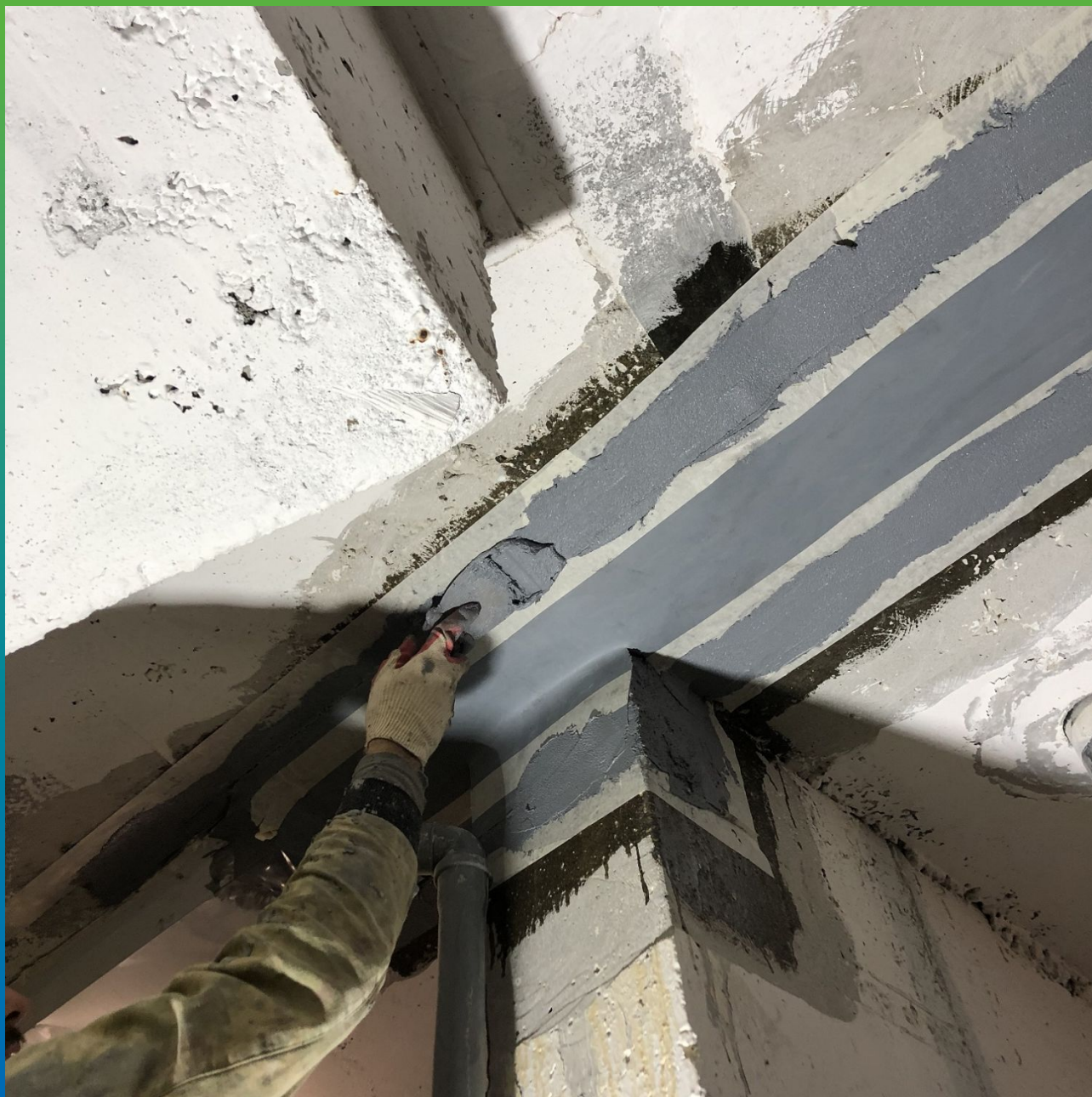
Запечатывание верхней кромки составом Манопокс 331