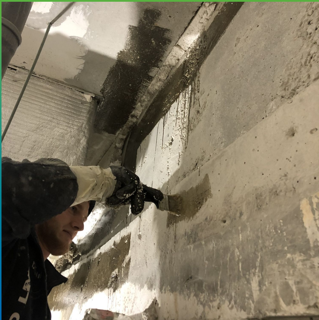
Грунтование участков грунтовко Денстоп ЭП 106