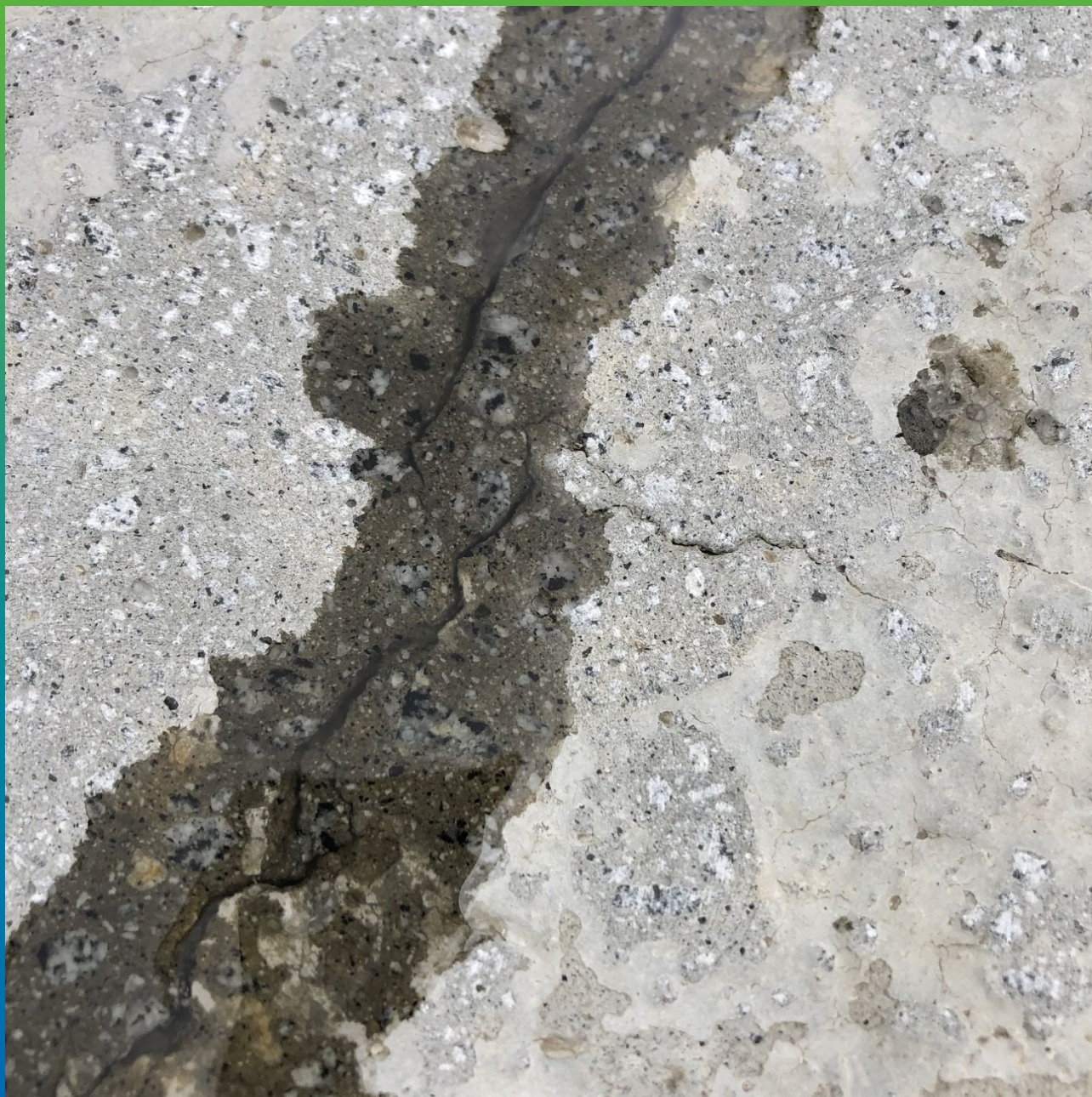
Устье трещины напитанной составом Манопокс 352