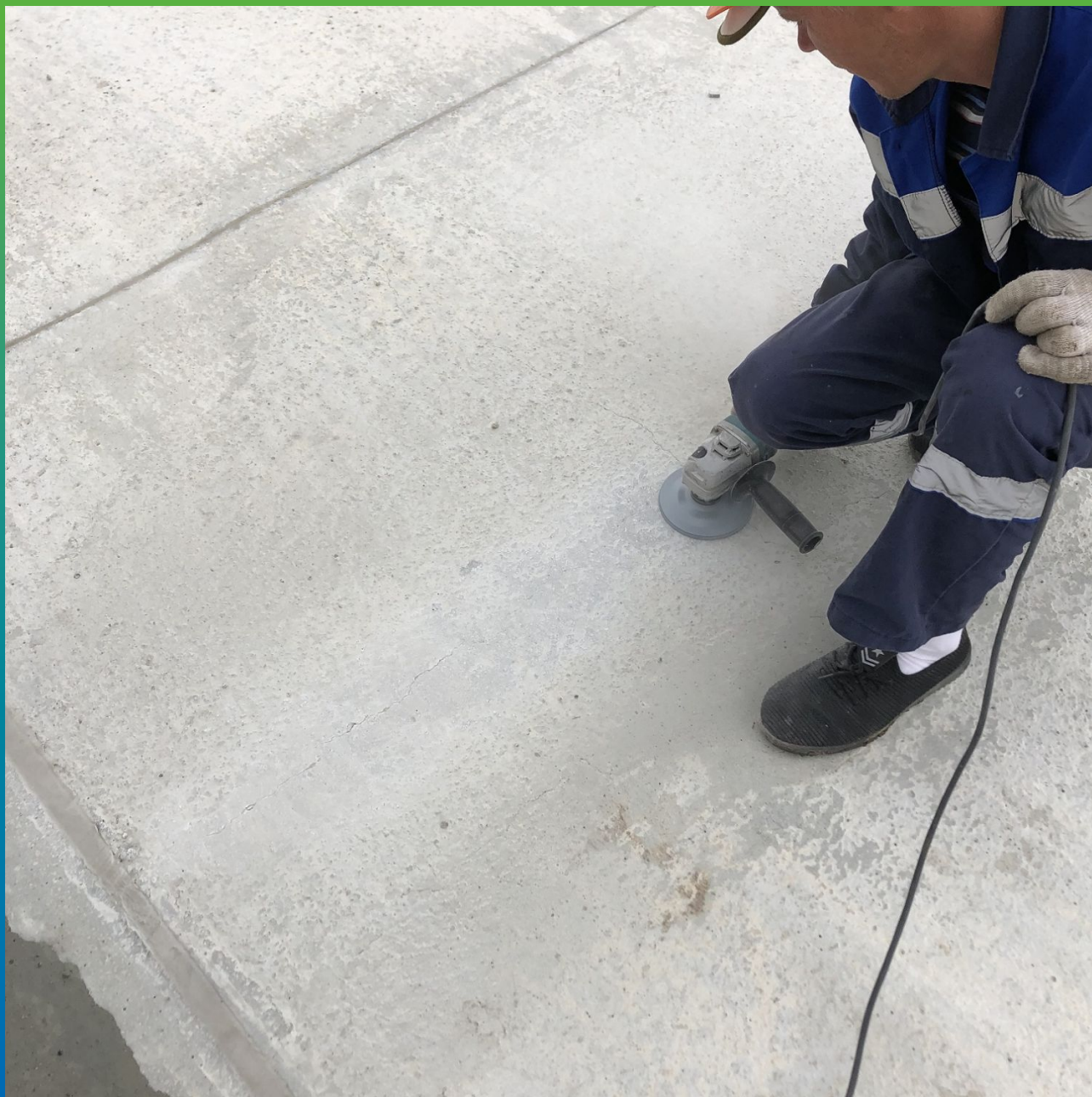
Подготовка участка путём шлифовки трещины