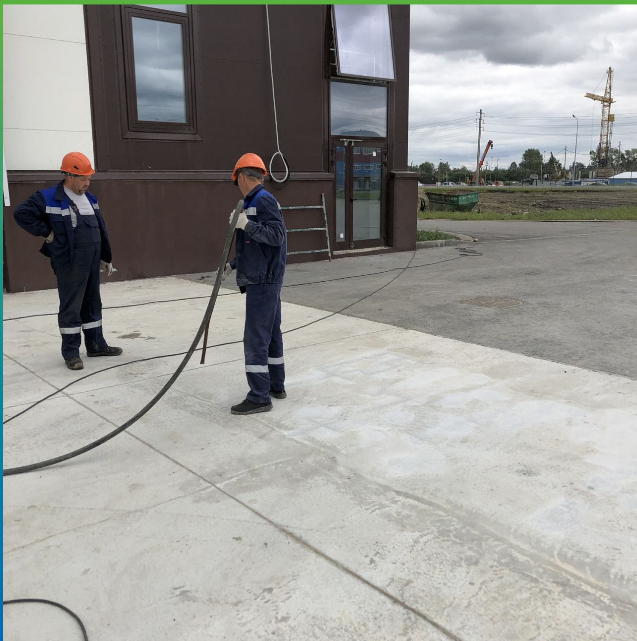
Подготовка и обеспыливание трещины сжатым воздухом