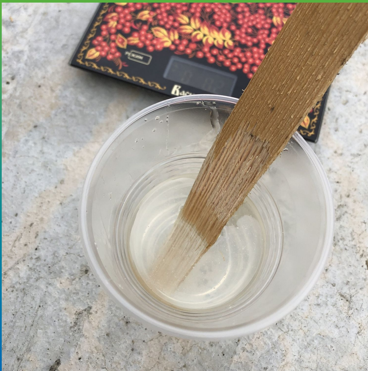
Замешивание компонентов А и Б состава Манпоокс 352