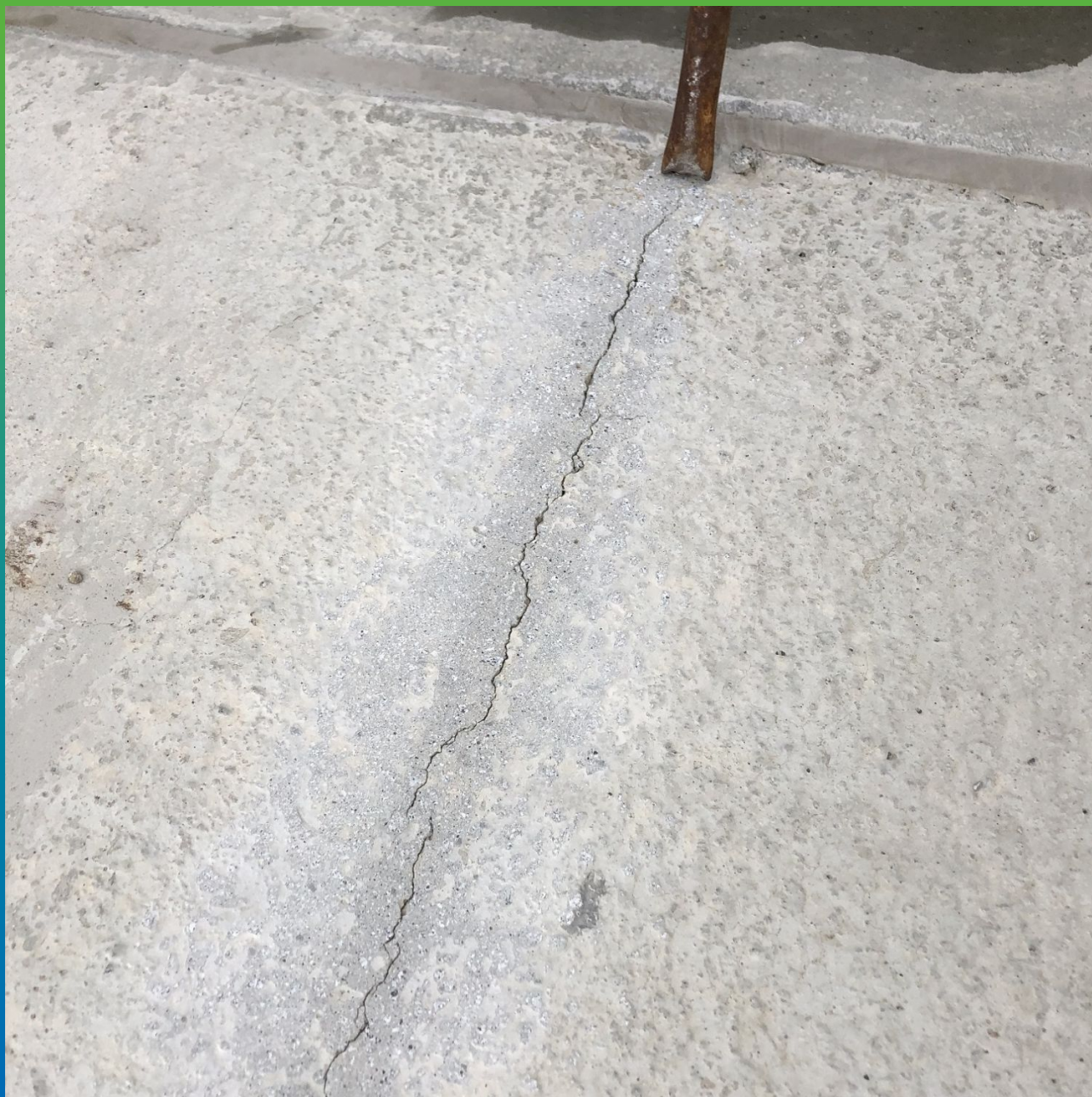
Вид раскрытой трещины