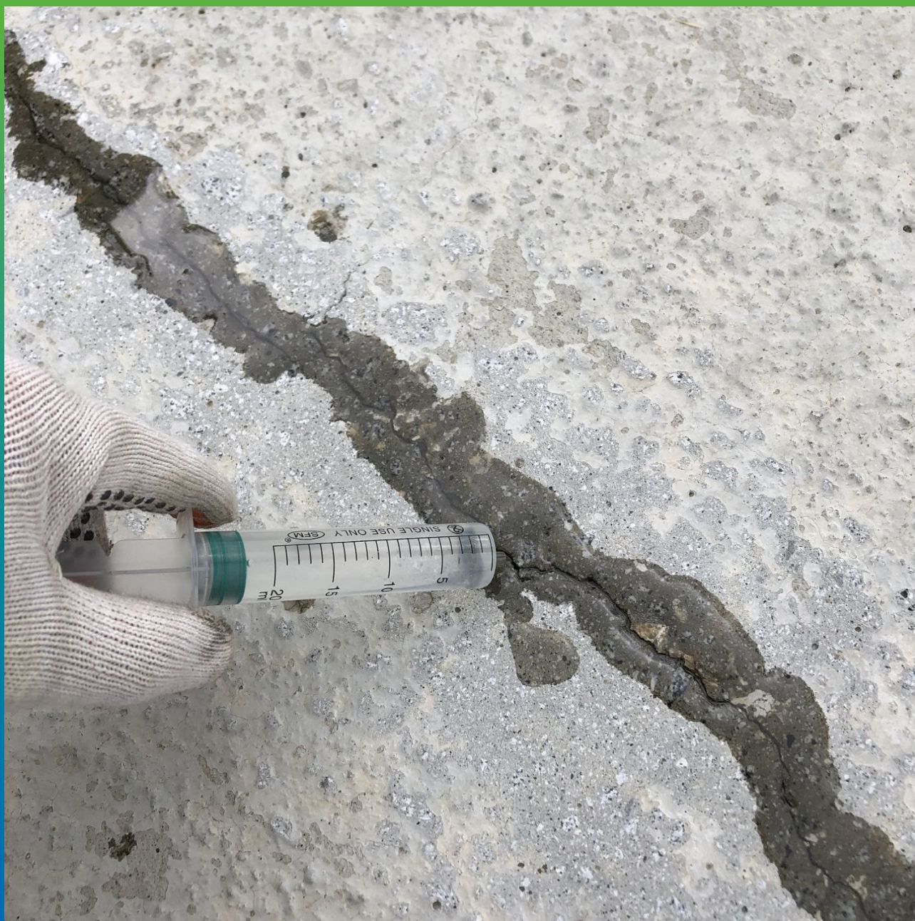
Процесс напительвания трещины составом Манопокс 352