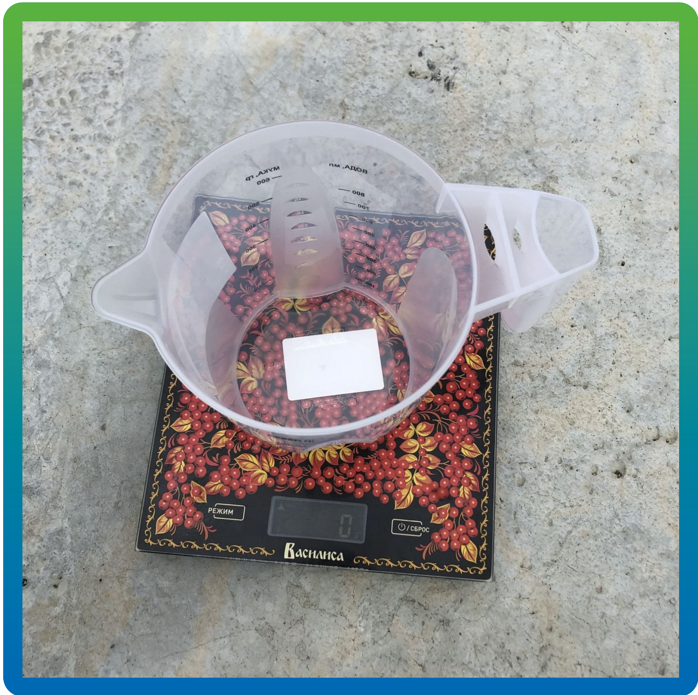
Весы и мерные стаканы на объекте