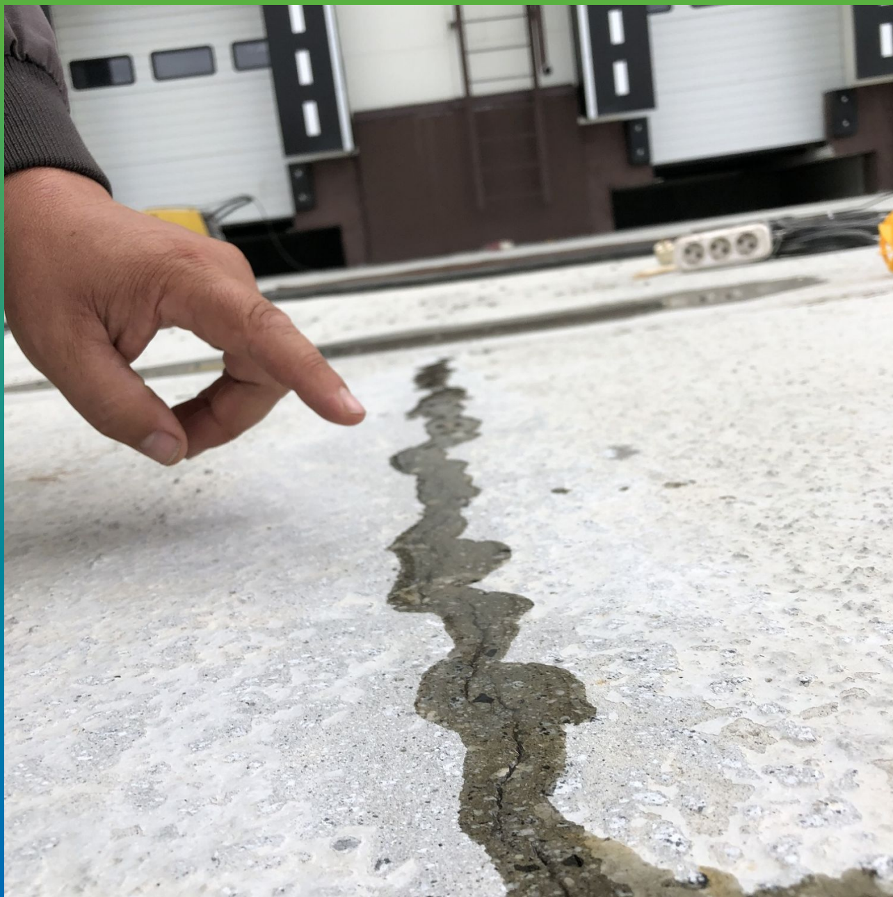
Общий вид напитанной трещины