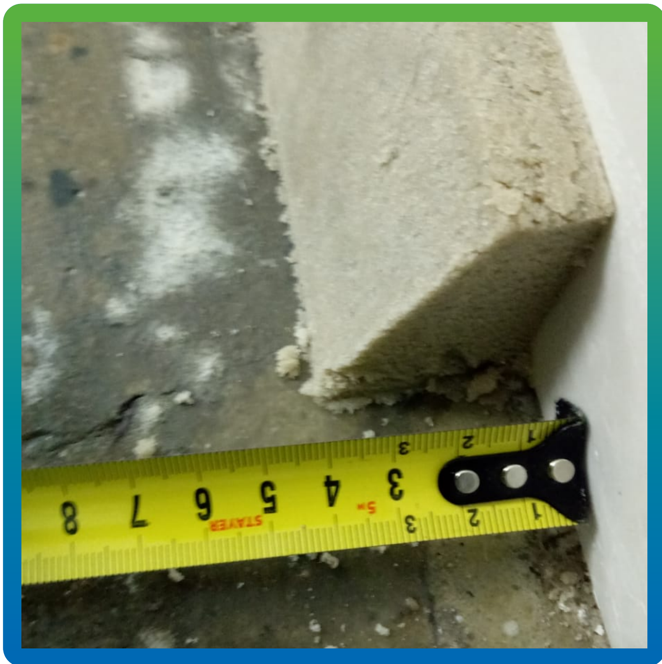
Выполненный эпоксидный плинтус из грунтовки ДенТоп ЭП 104 и песка ДенТоп Филлер 004