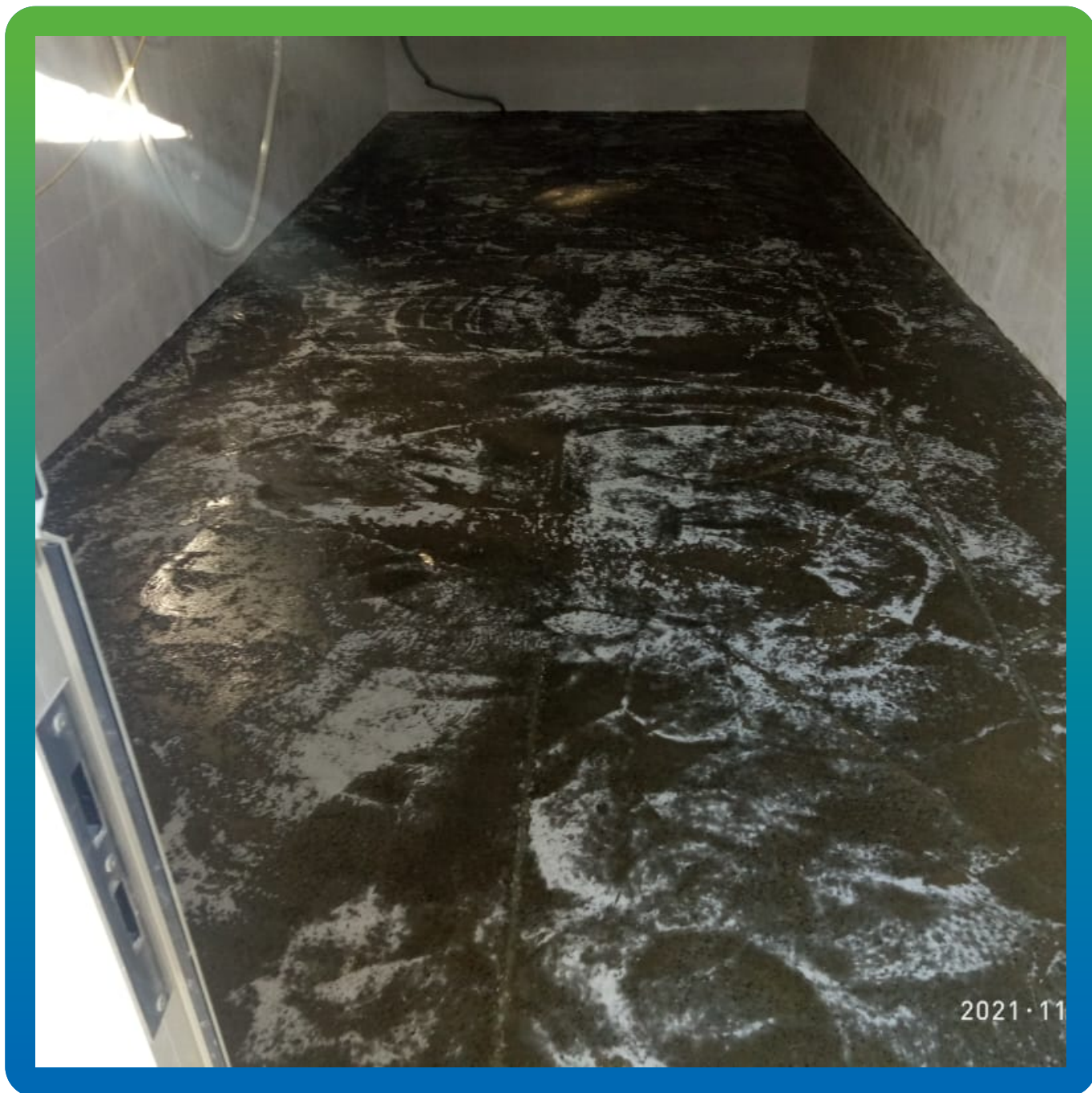
Загрунтованная поверхность составом ДенсТоп ЭП 104