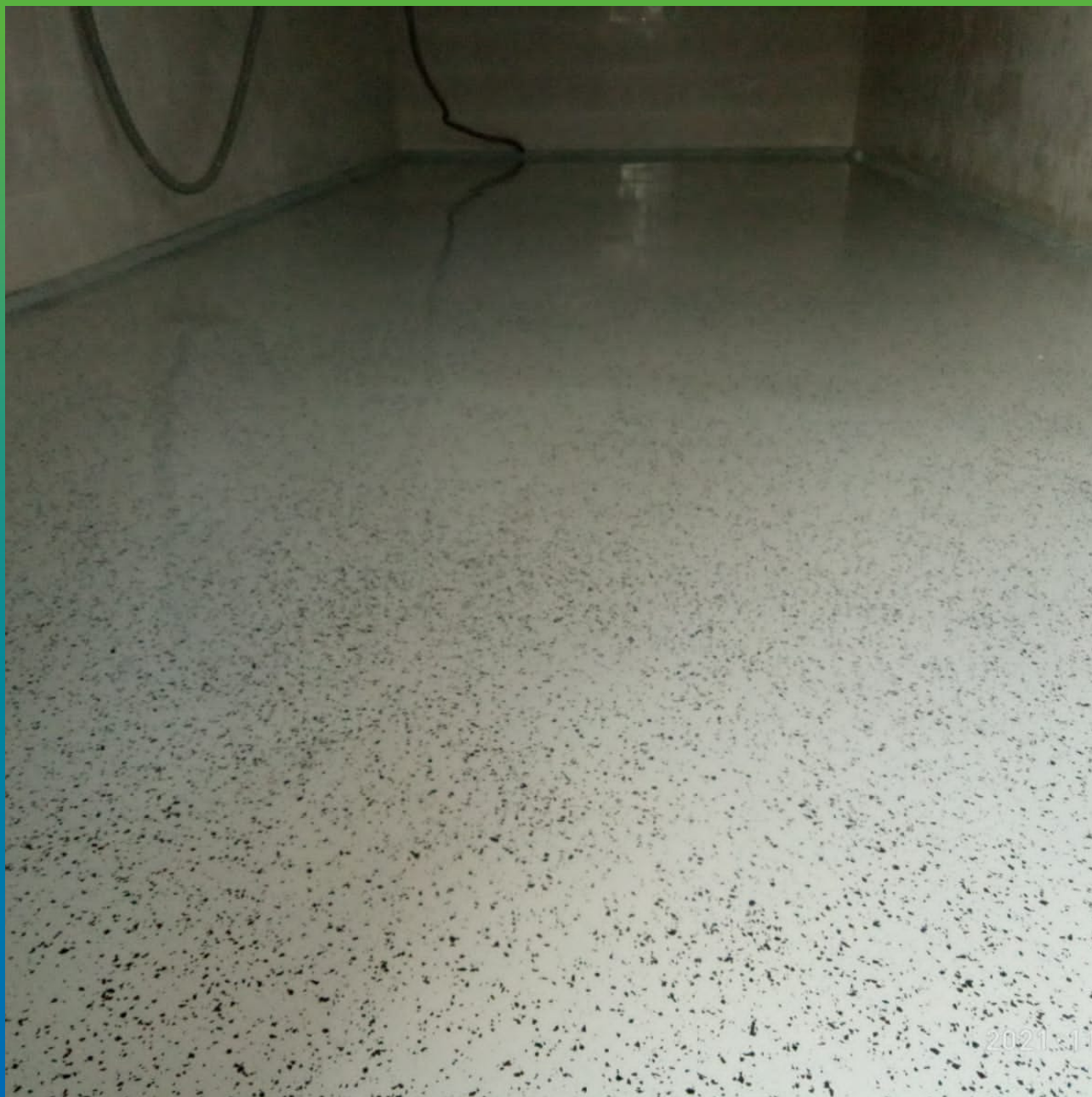
Финишный вид пола, выполненного из ДенСтол ЭП 501 с чипсами