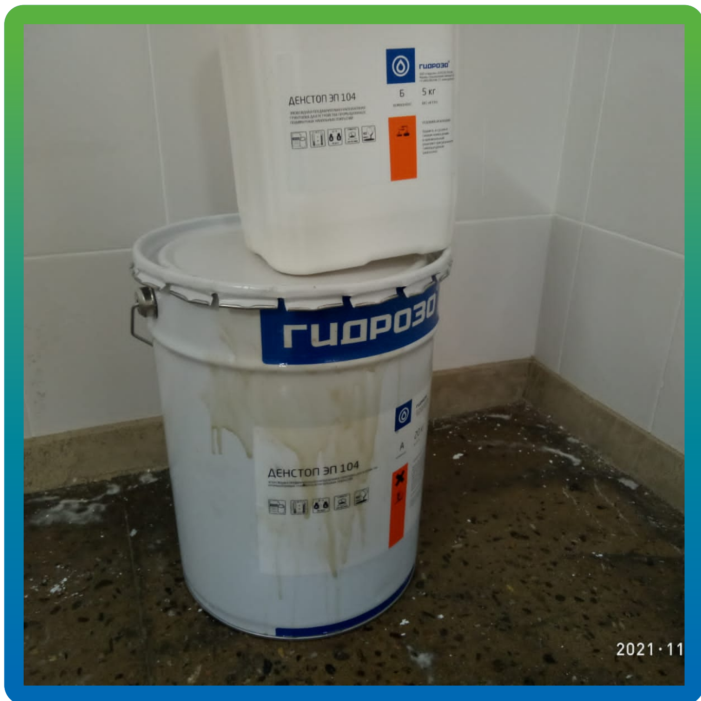
Грунтовка ДенТоп ЭП 104 для плитуса