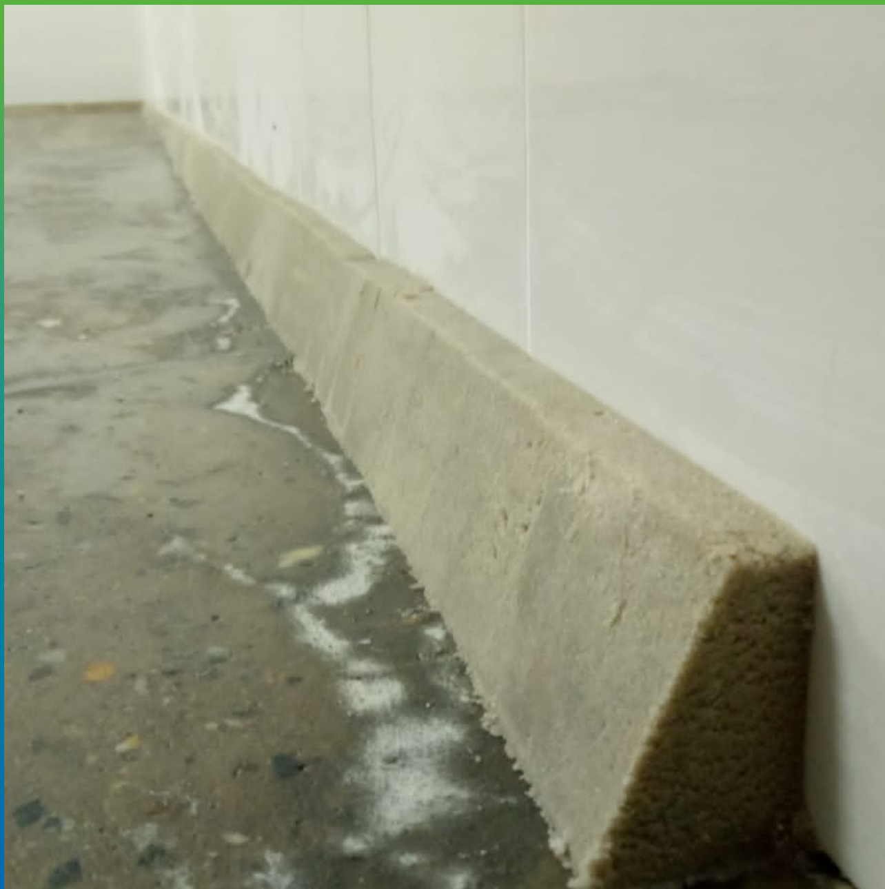
Плинтус эпоксидный с песком