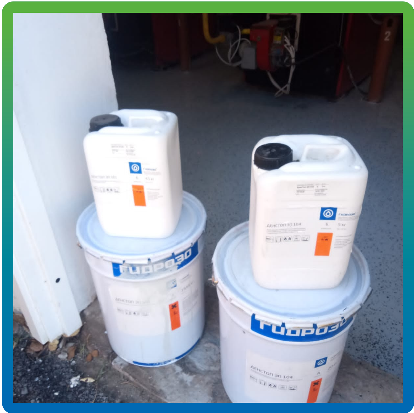
Материалы Гидрозо на объекте