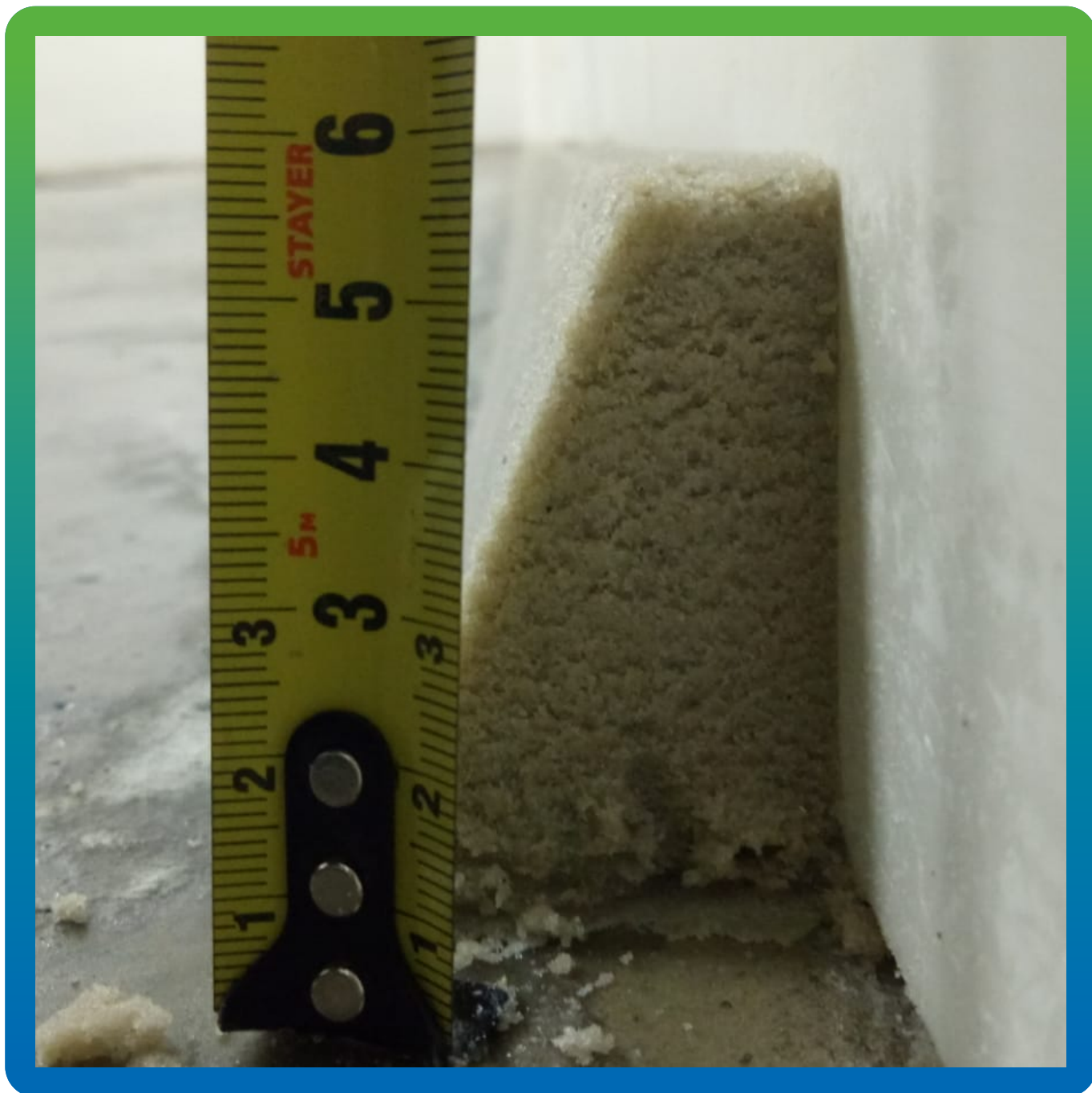
Плнтус полимерный 4 x 6 см из эпоксида с песком