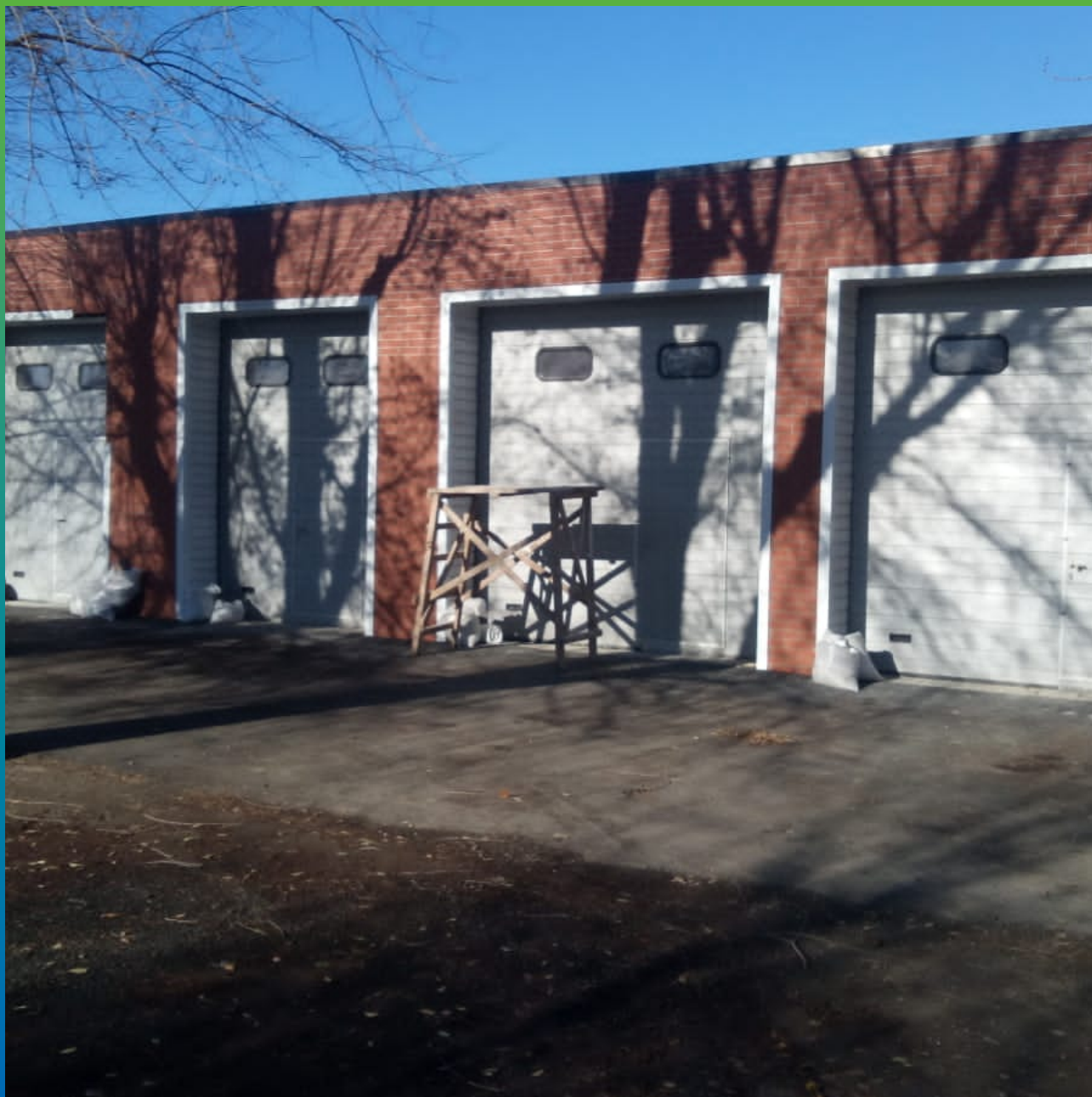
ГАРАЖ ШКОЛЫ №4