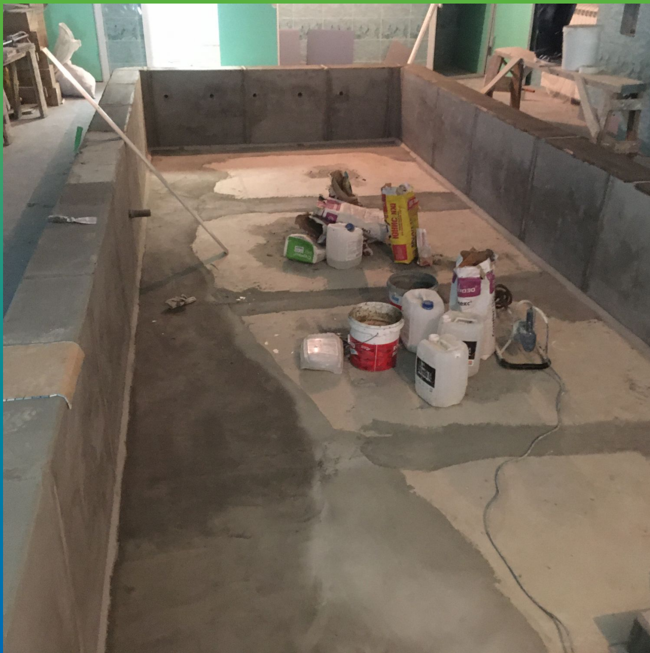
Подготовка поверхности, создание галтелей