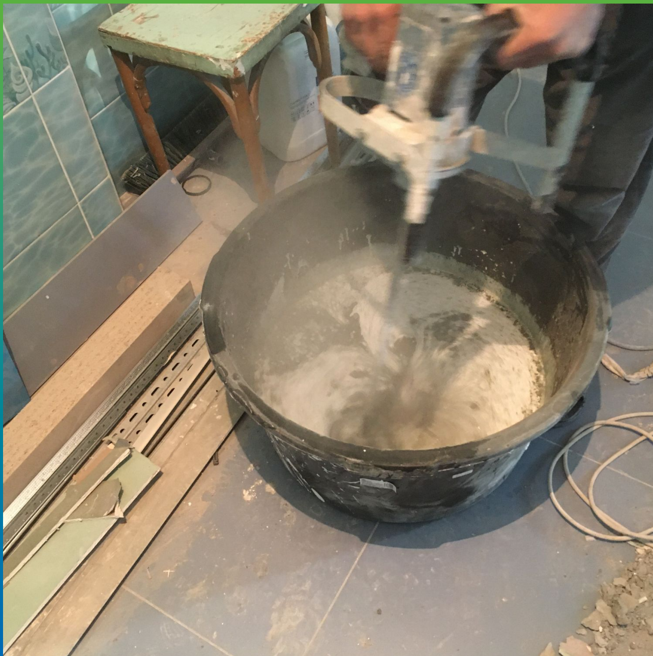
Затворение эластичной гидроизоляции Стармекс Эласт