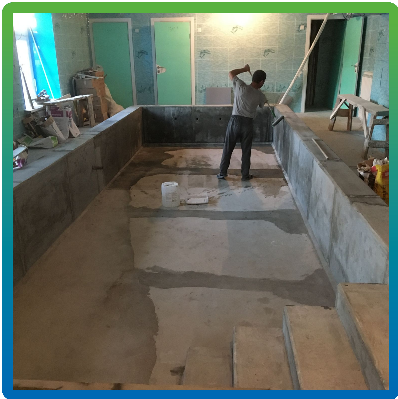
Увлажнение основания перед нанесением гидроизоляции