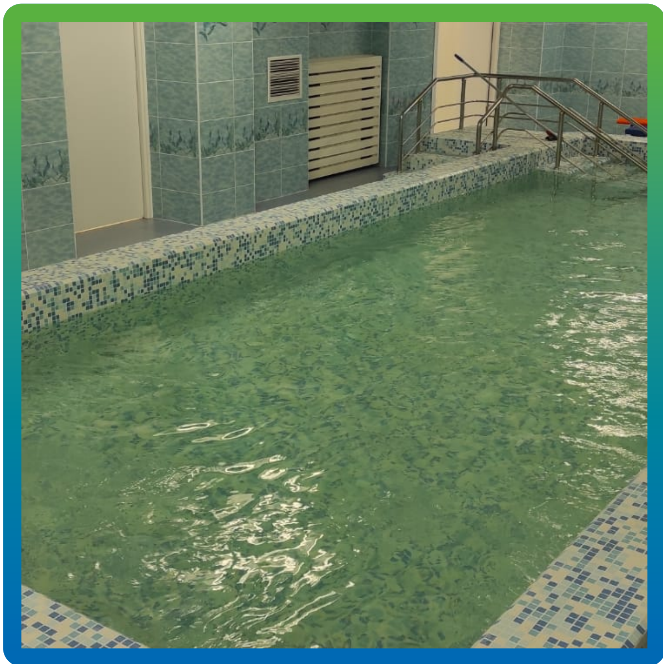
Итоговый вид объекта