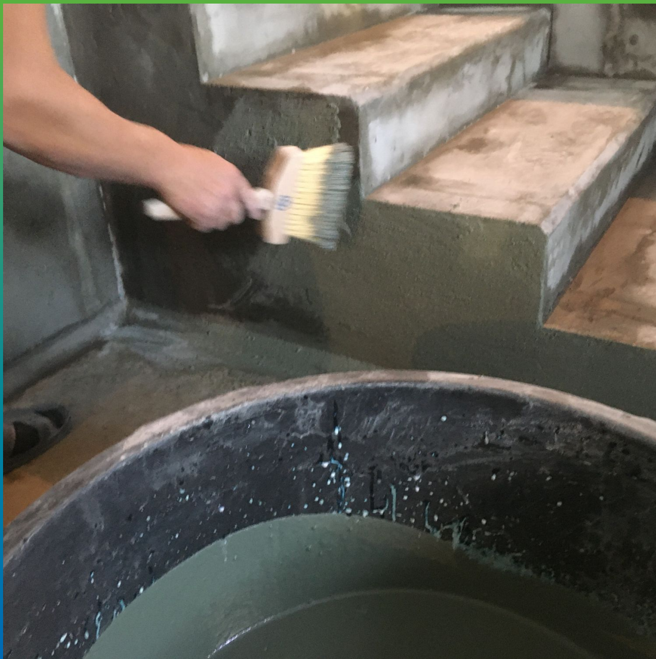
Нанесение гидризоляции Стармекс Эласт