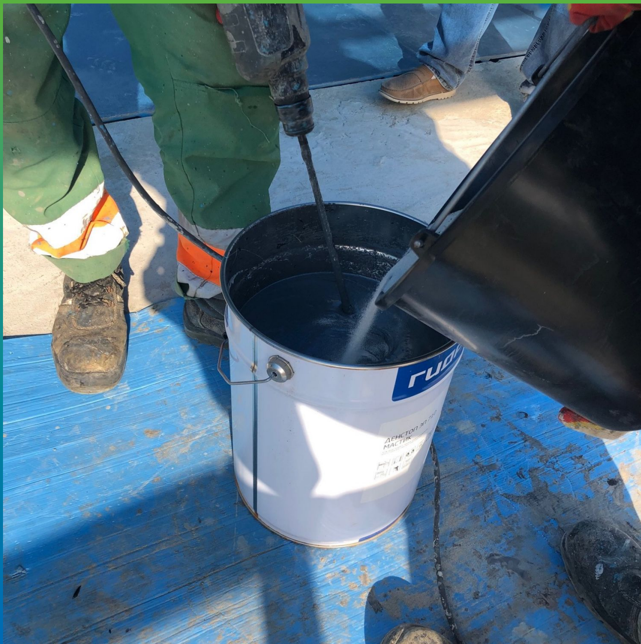
Добавление заполнителя в ДенсТоп ЭП 710 Мастик