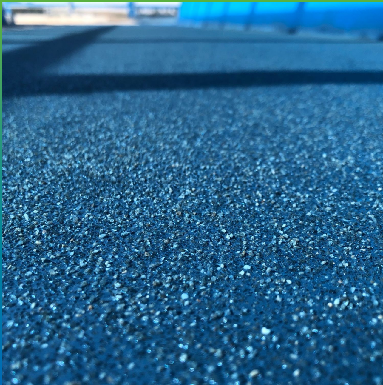
Вид покрытия после присыпки ДенТоп Филлер 01