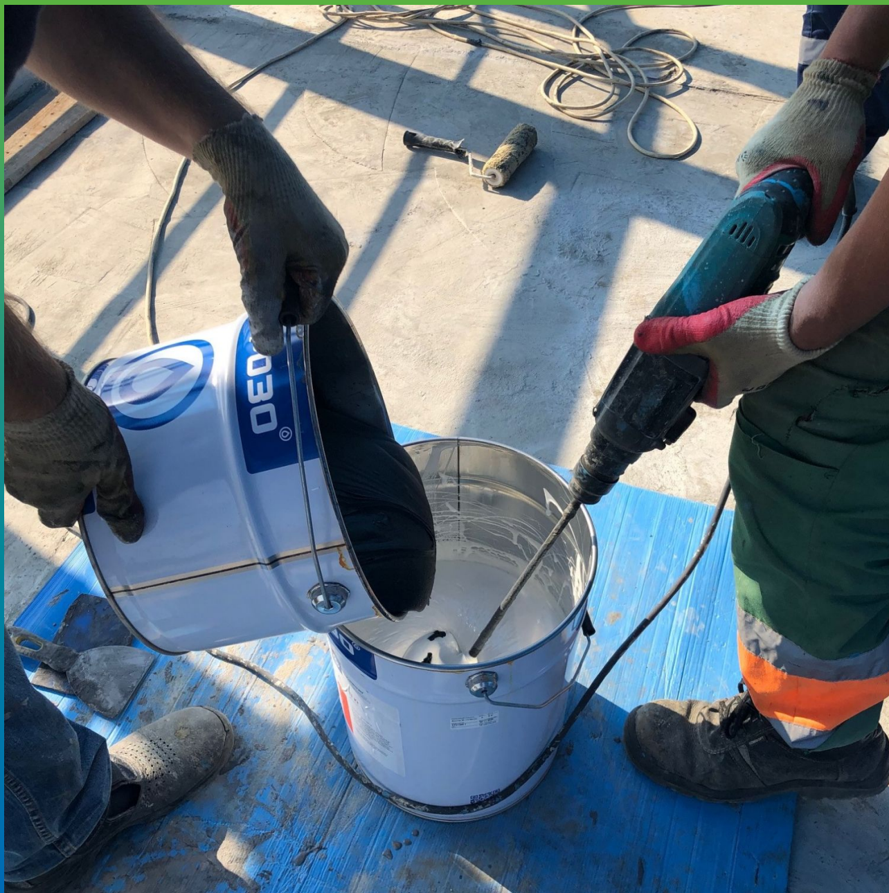
Смешивание двухкомпонентного состава ДенсТоп ЭП 710 Мастик