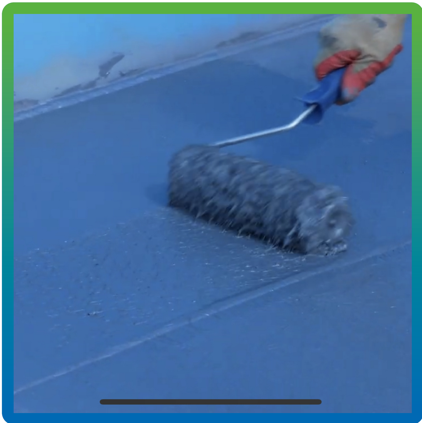
Нанесение грунтовочного состава ДенсТоп ЭП 116