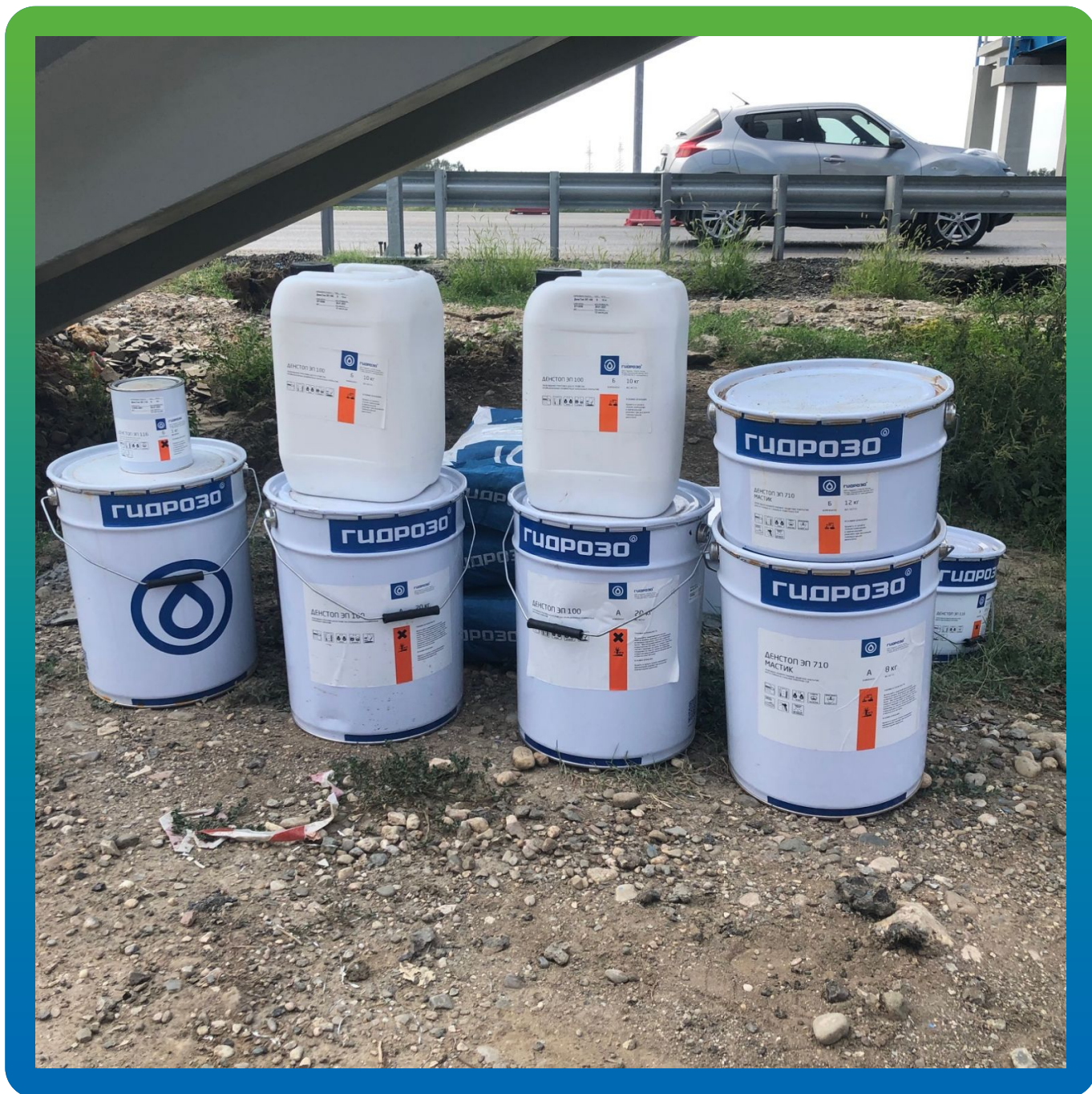
Материал на объекте