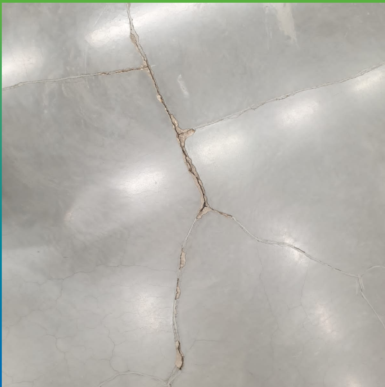
Внешний вид пола до начала работ