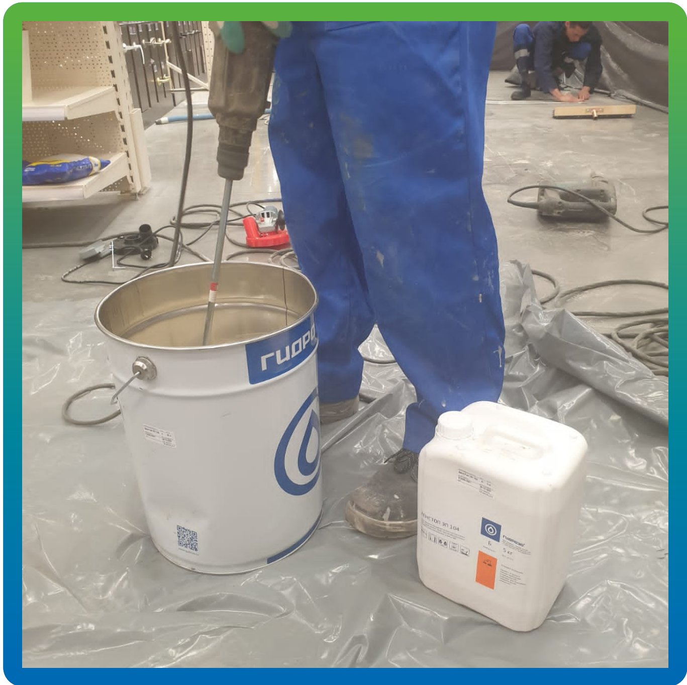
Приготовление ремонтного состава