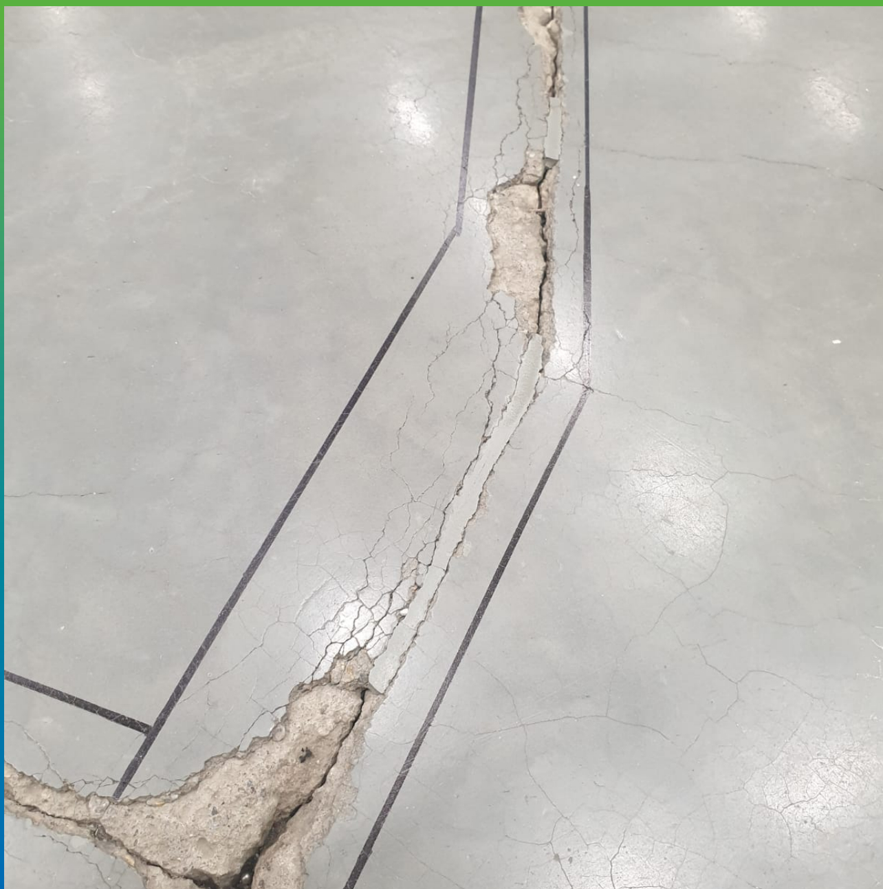
Расшивка трещин перед проливкой