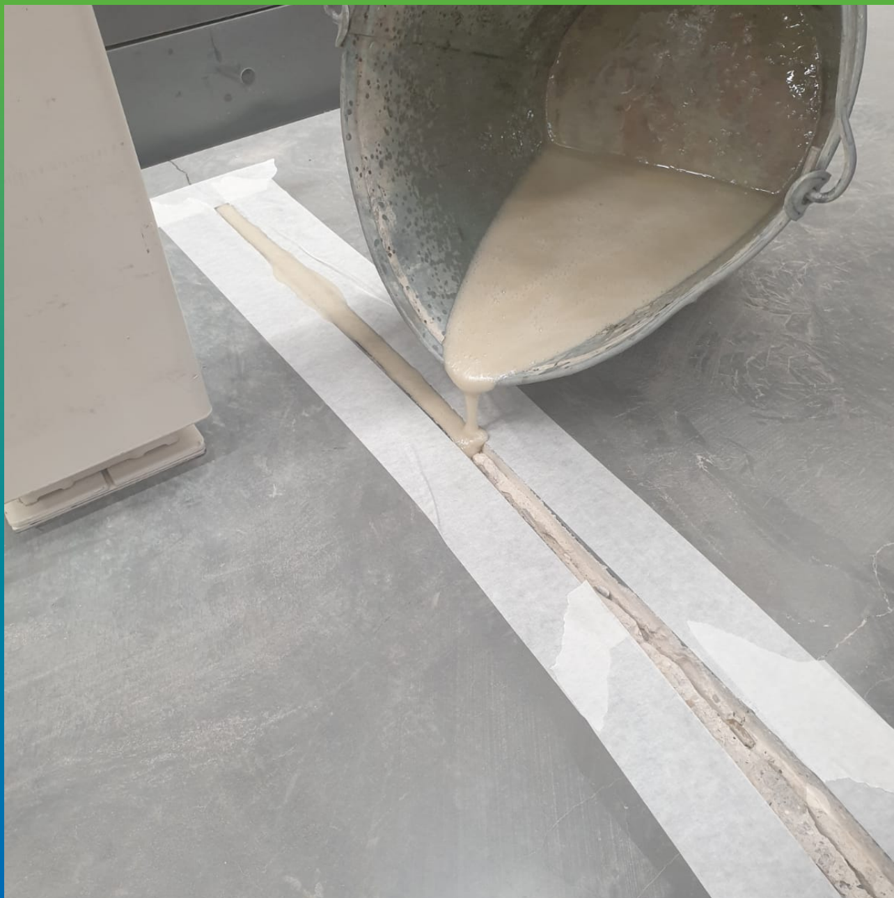
Подача ремонтного состава гравитационным методом