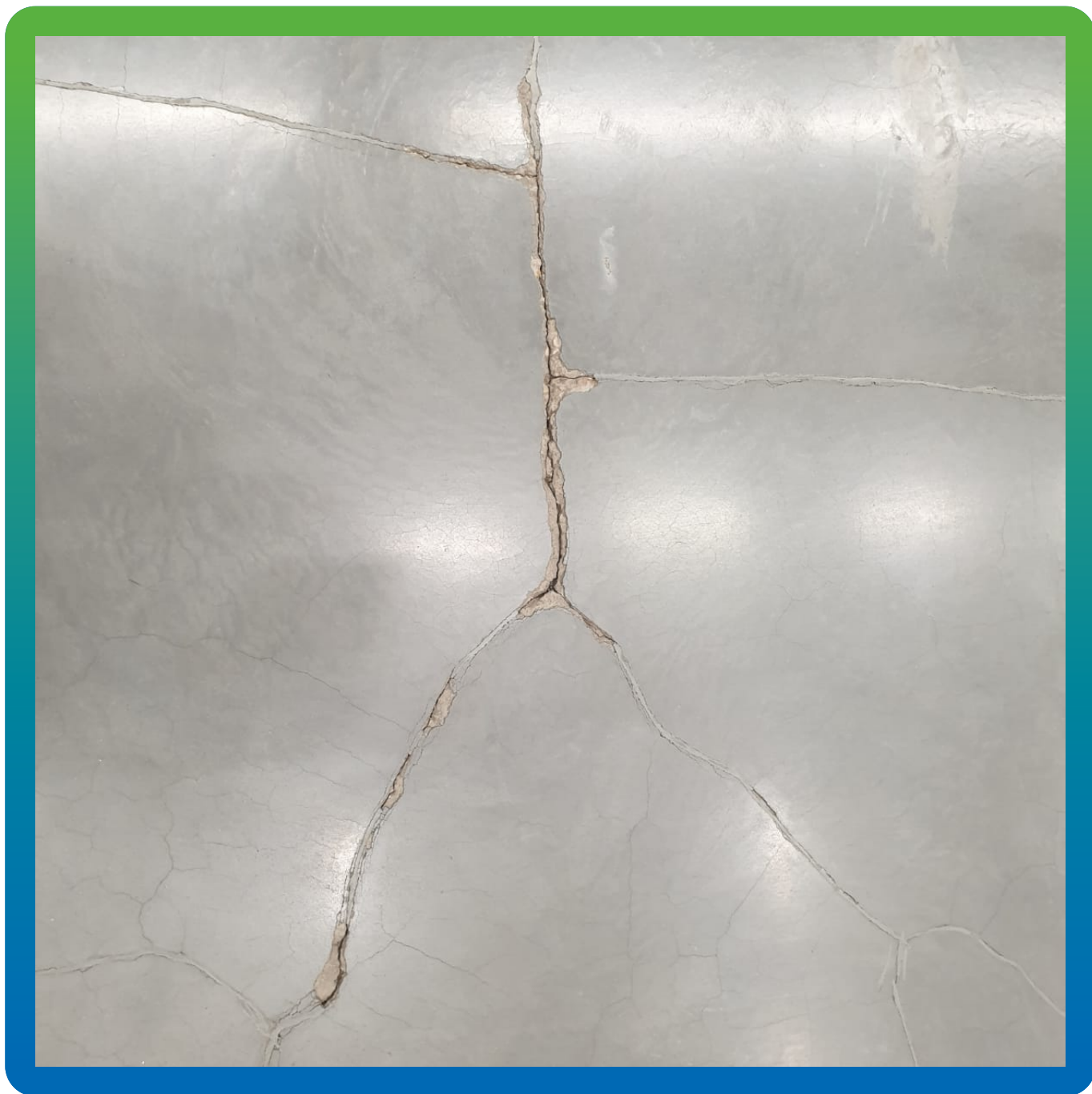
Внешний вид пола до начала работ