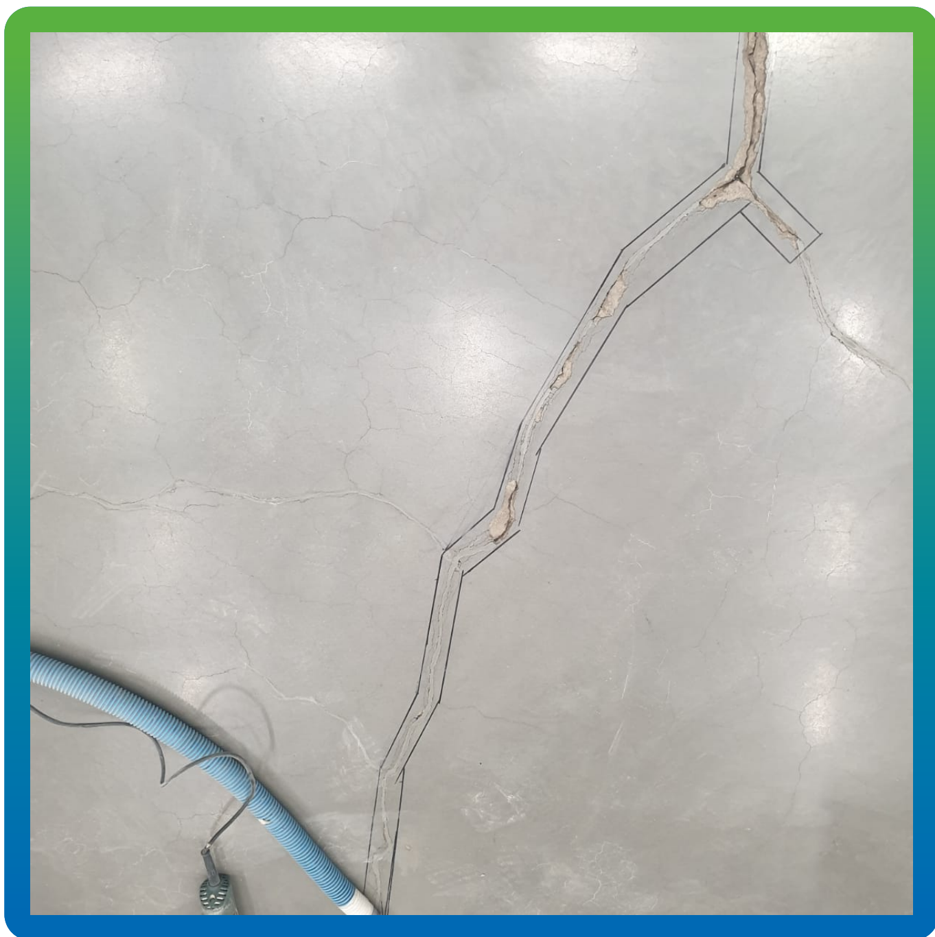
Подготовка трещин к заделке