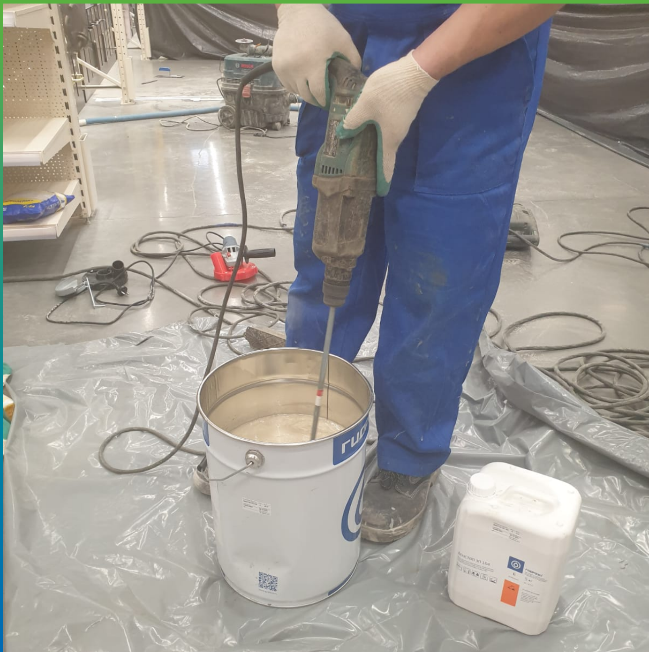
Смешивание ДенсТоп ЭП 100 с песком