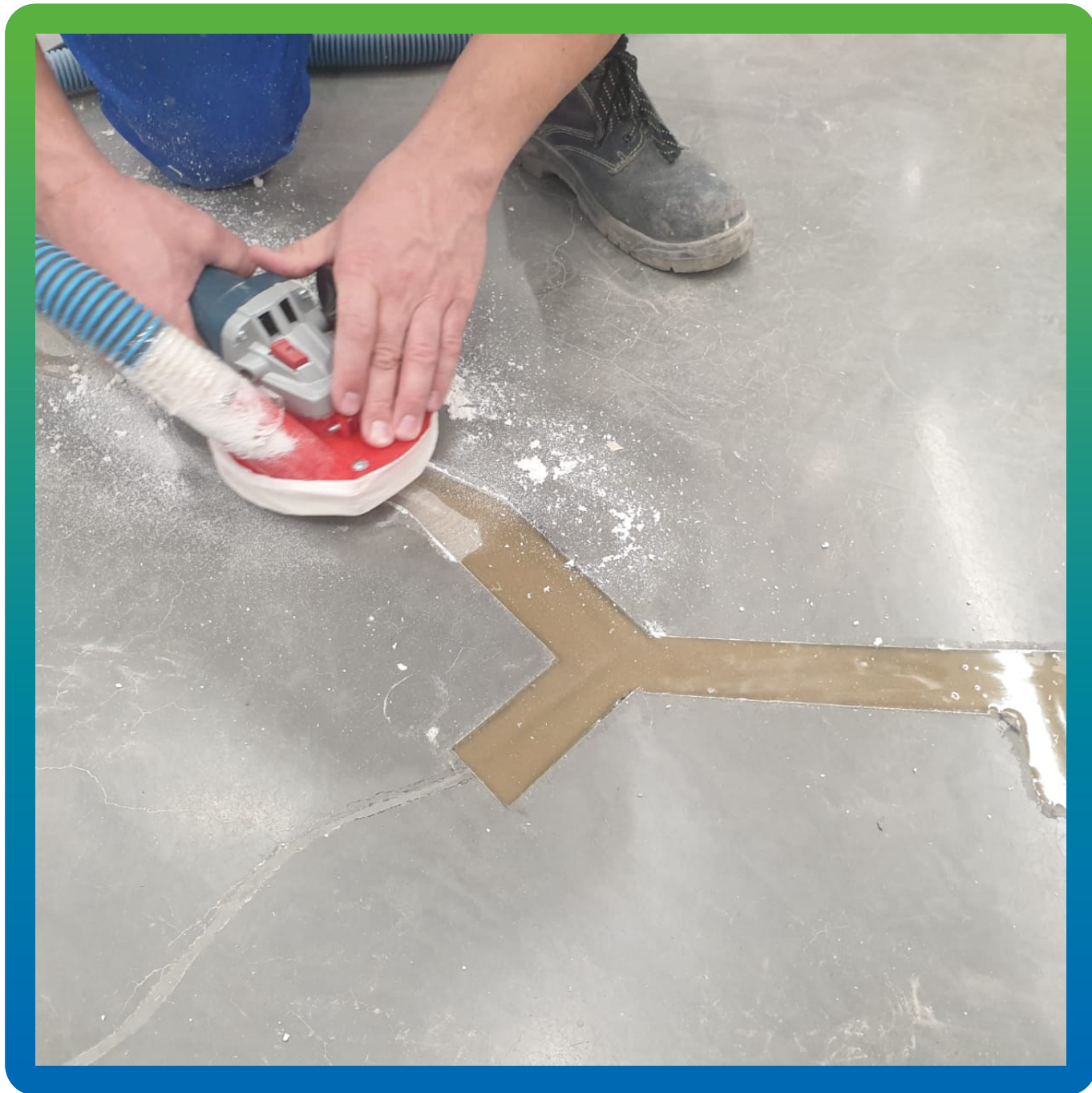
Шлифование отремонтированных участков