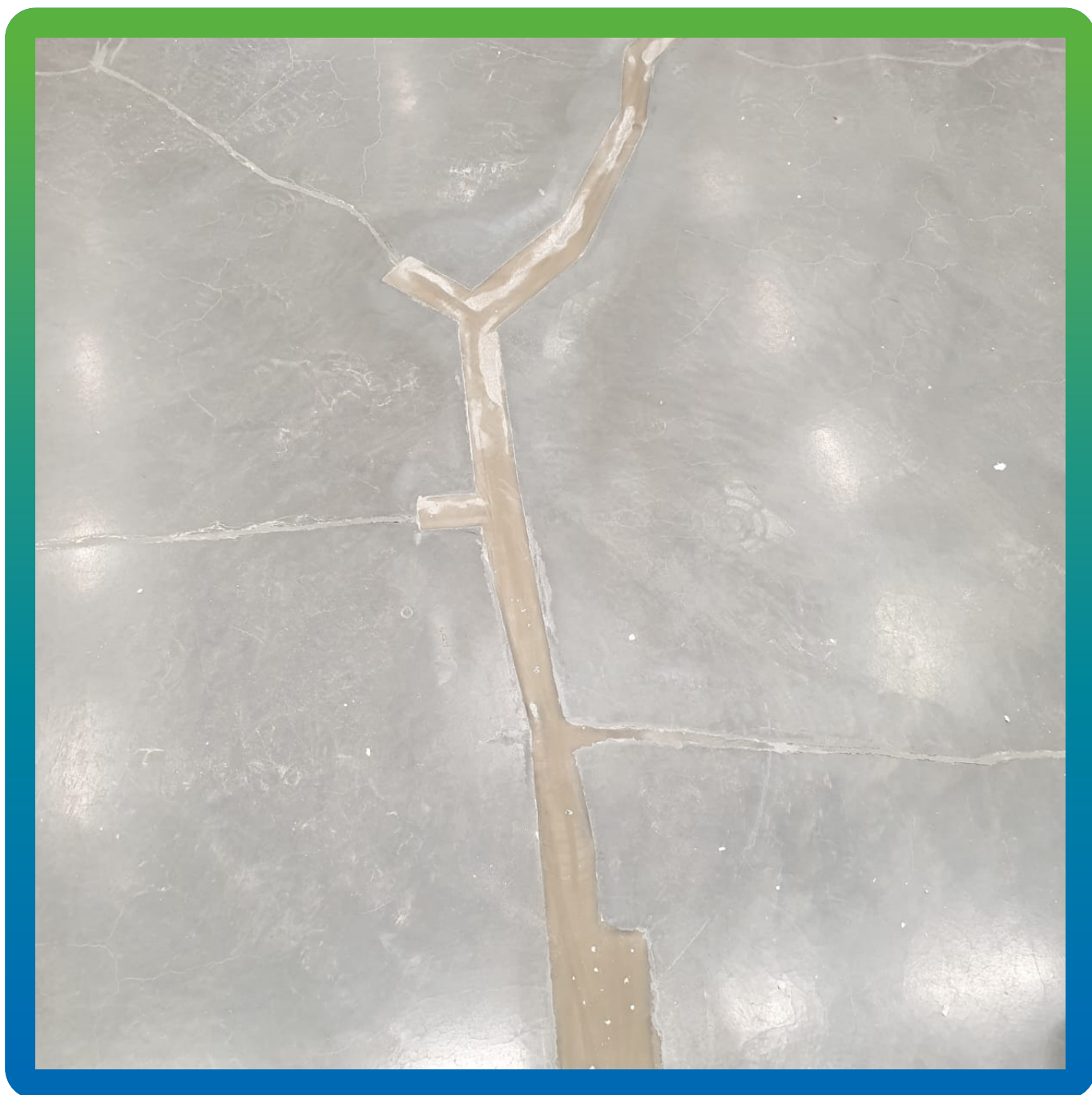
Внешний вид отремонтированной поверхности