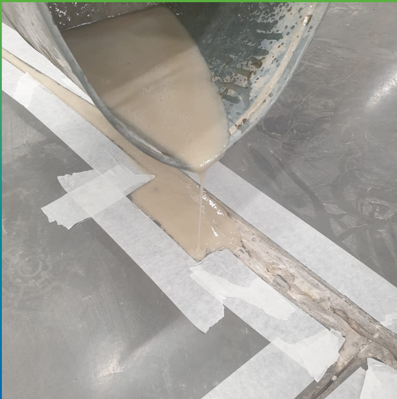
Подача ремонтного состава гравитационным методом