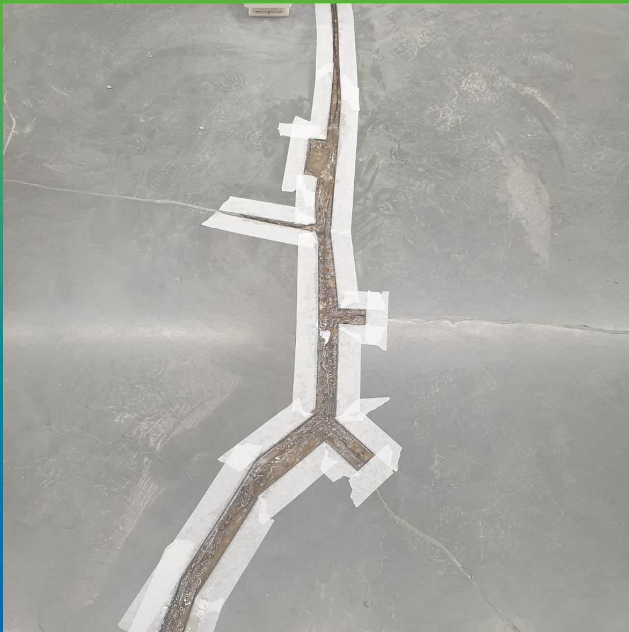
Грунтование ремонтируемых участков