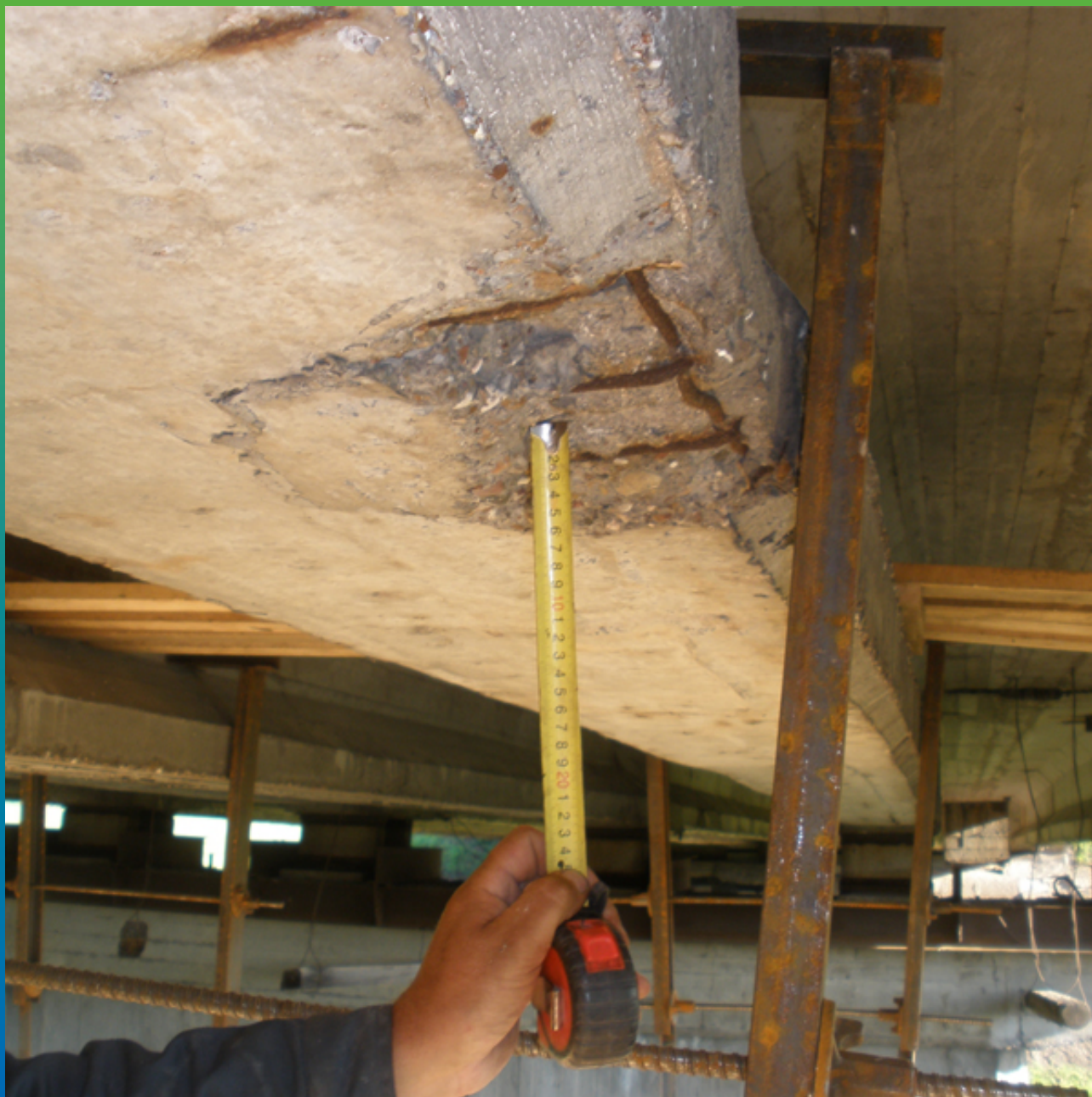
Инструментальная оценка глубины дефекта