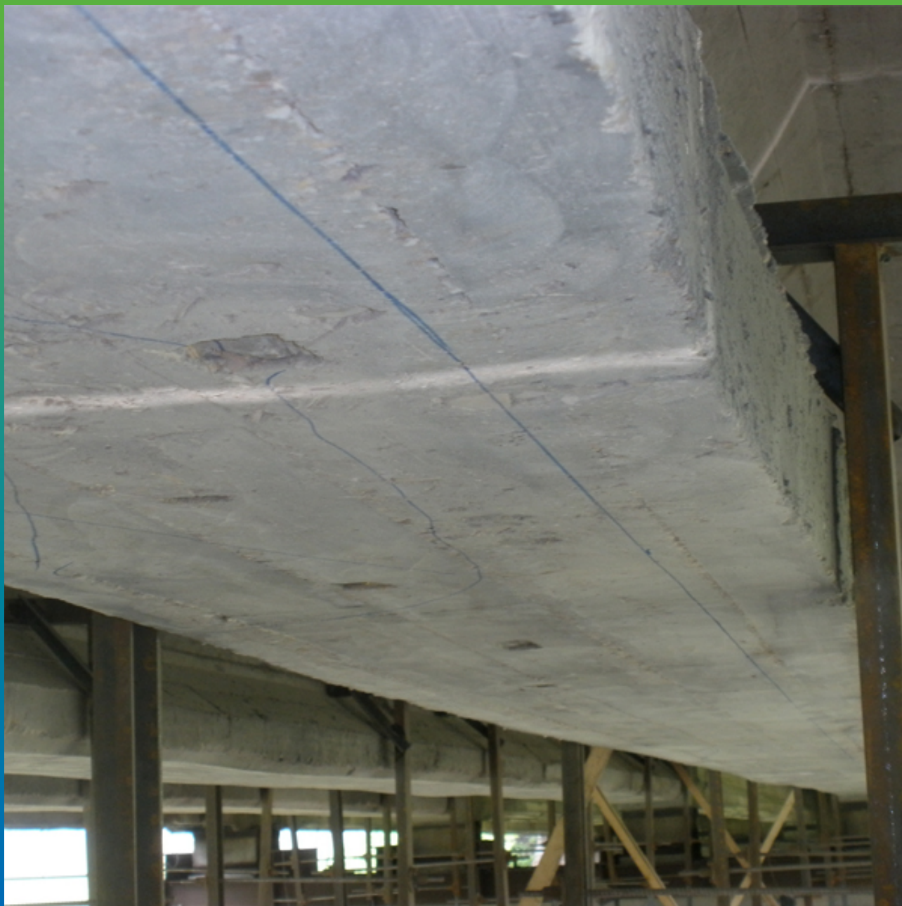
Разметка нижней грани балки