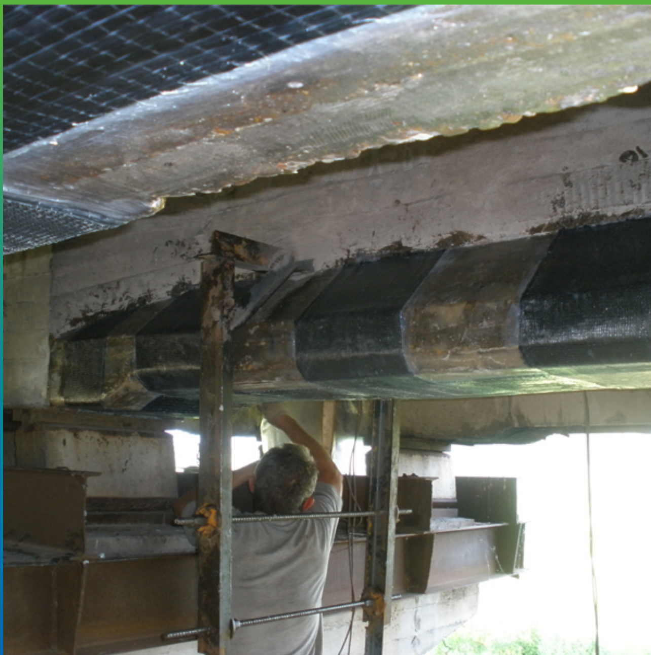
Поперечные полосы Тайфо в приопорной зоне