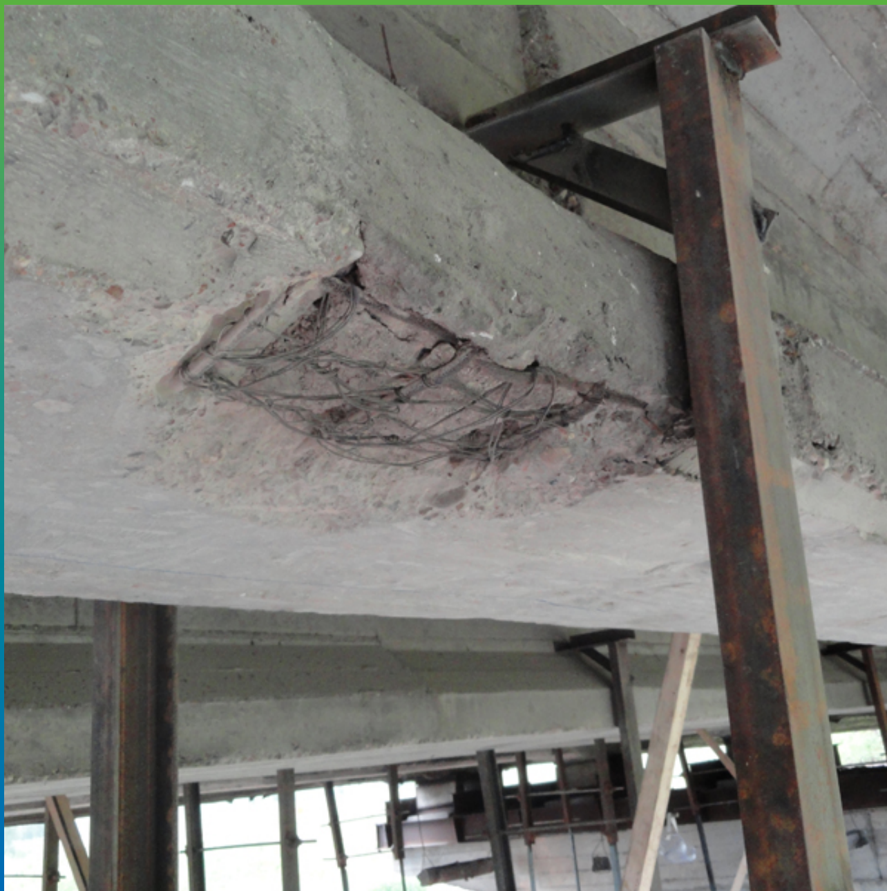
Дефект бетона балки