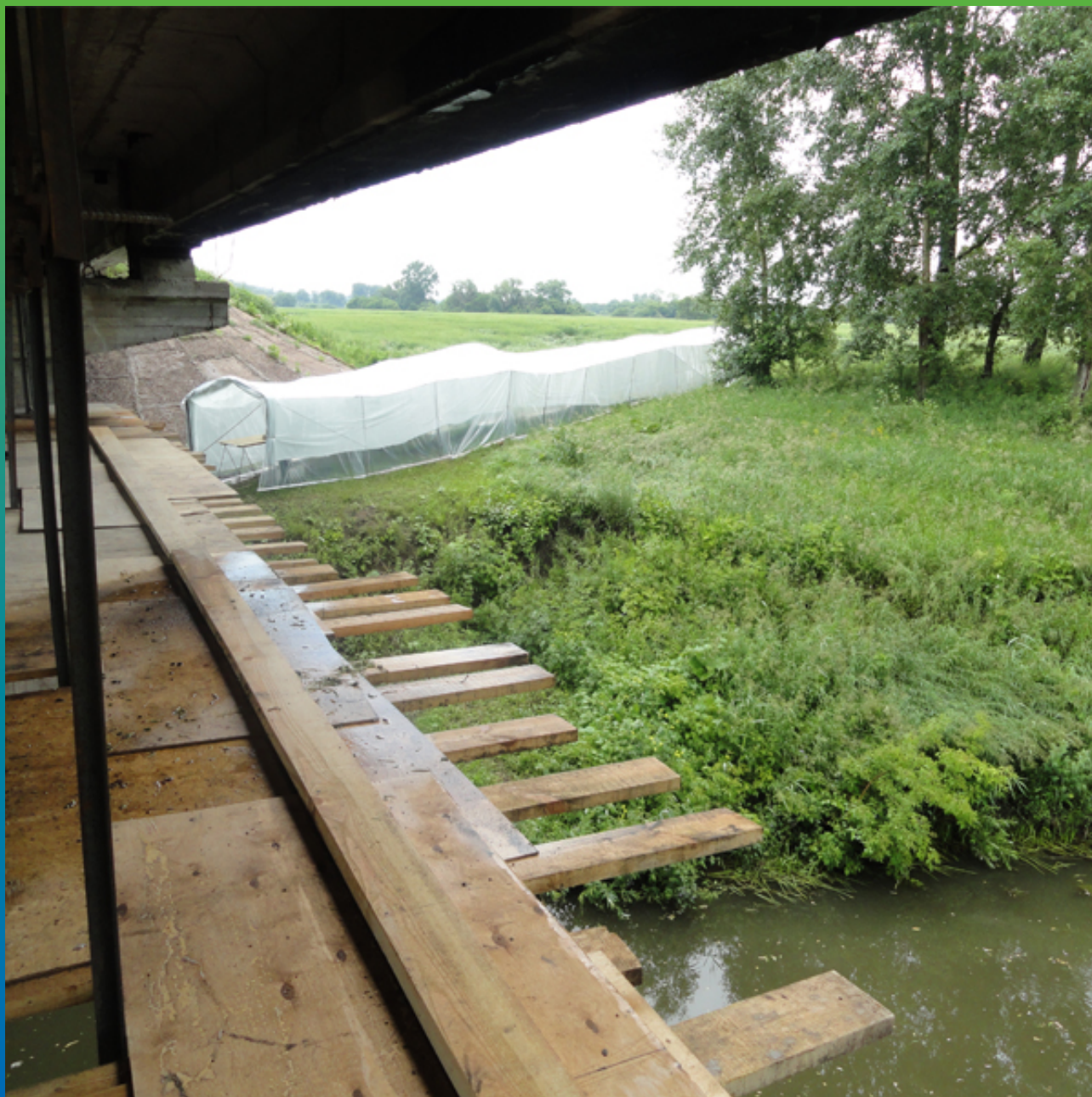
Вид с подмостей на пропиточный столик под навесом