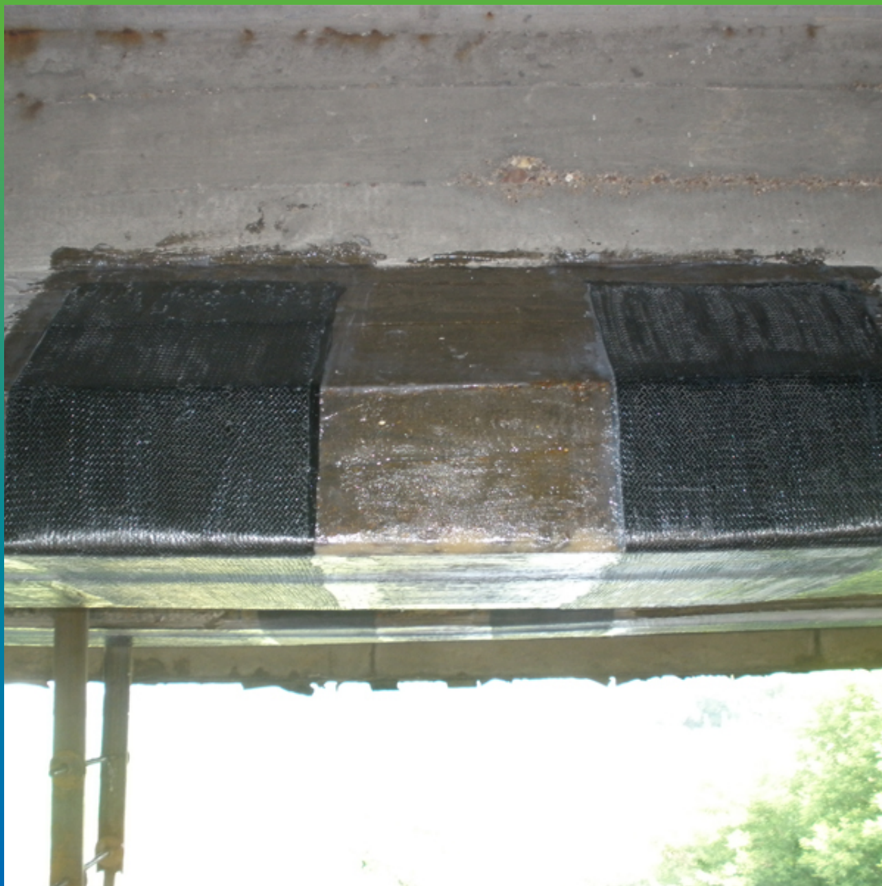
Поперечные полосы Тайфо в средней части пролета