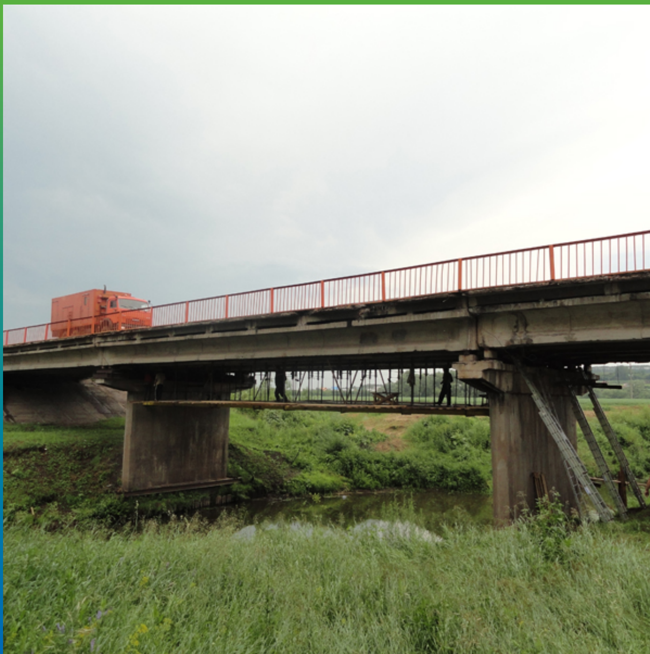
Общий вид объекта до начала работ