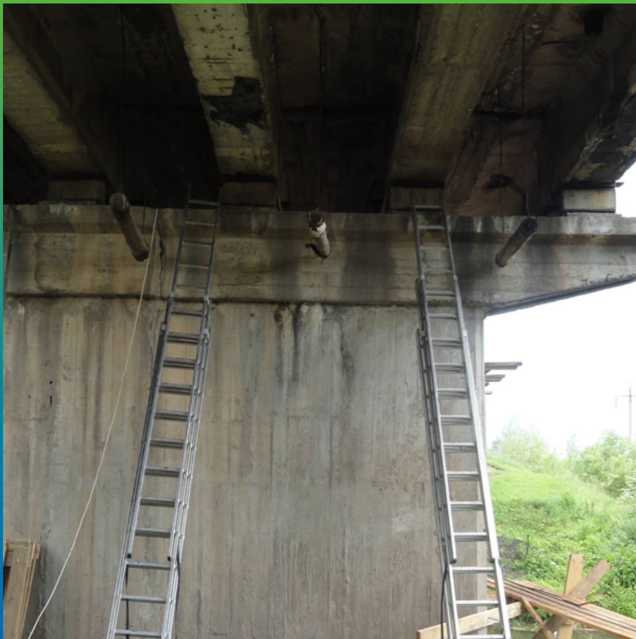
Смола Тайфо С на фоне опоры моста