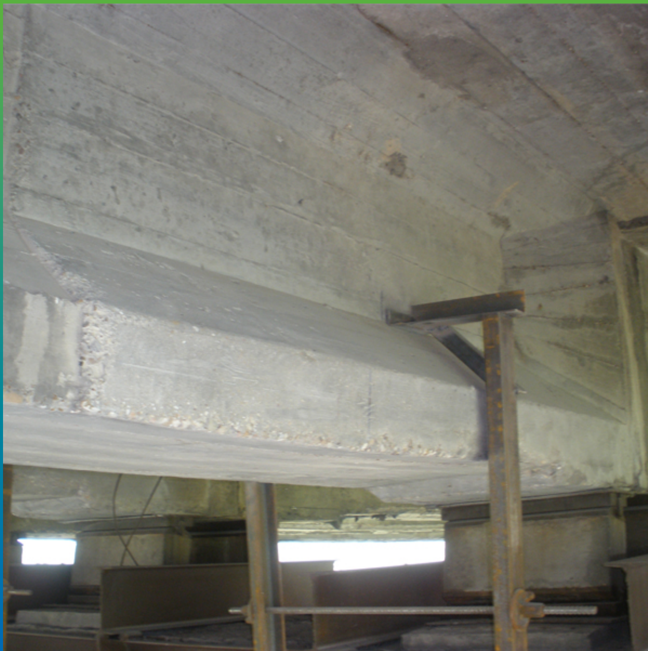
Отшлифованная поверхность балки