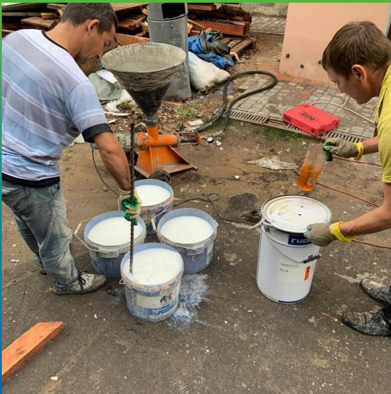
Приготовление рабочего состава для отсечной гидроизоляции