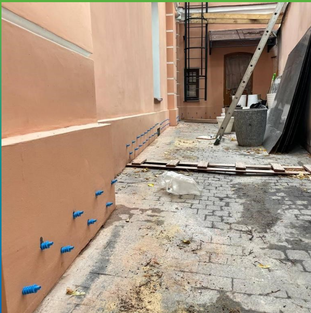
Установка пакеров в шпury для инъекции