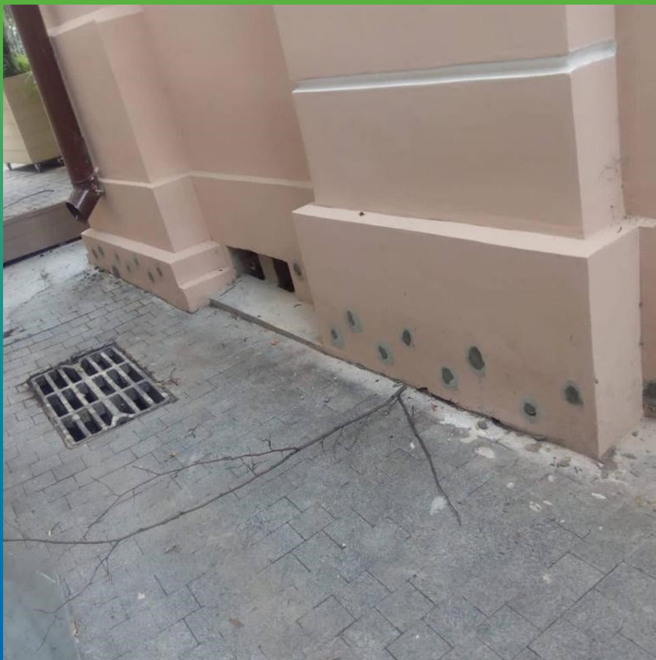
Зачеканка отверстий после прокачки ремонтным составом Стармекс РМЗ