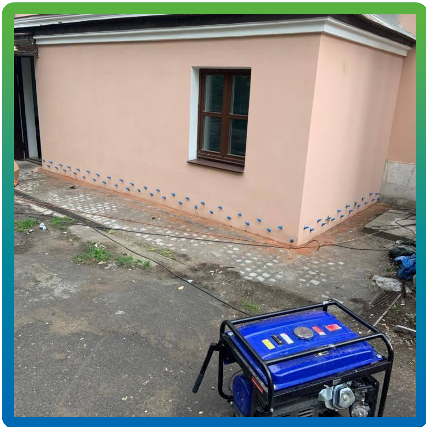
Установка пакеров в шпурь для инъекции