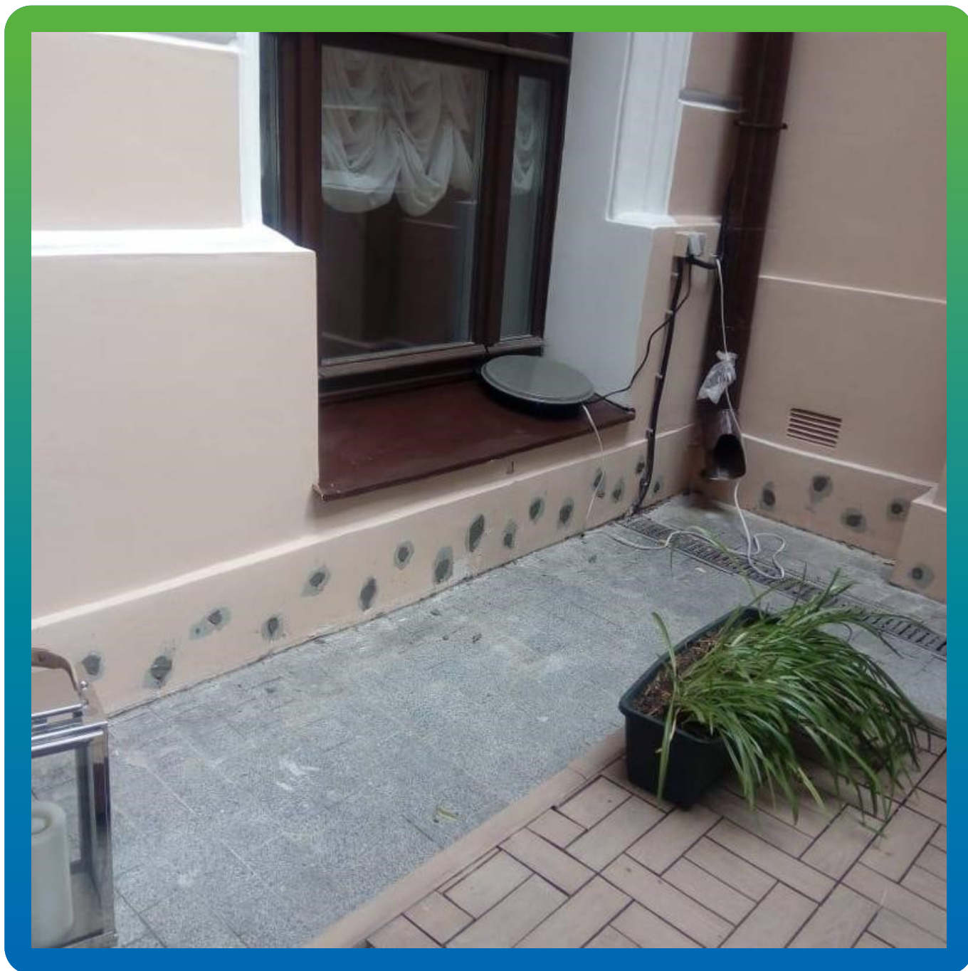
Зачеканка отверстий после прокачки ремонтным составом Стармекс РМЗ