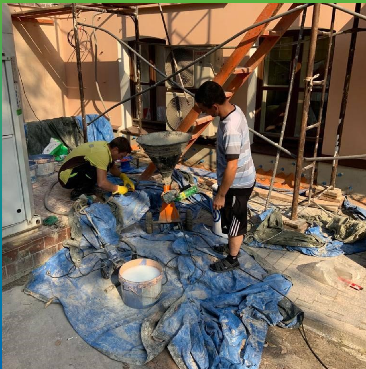
Инъектирование фундамента составом Маноксан 150