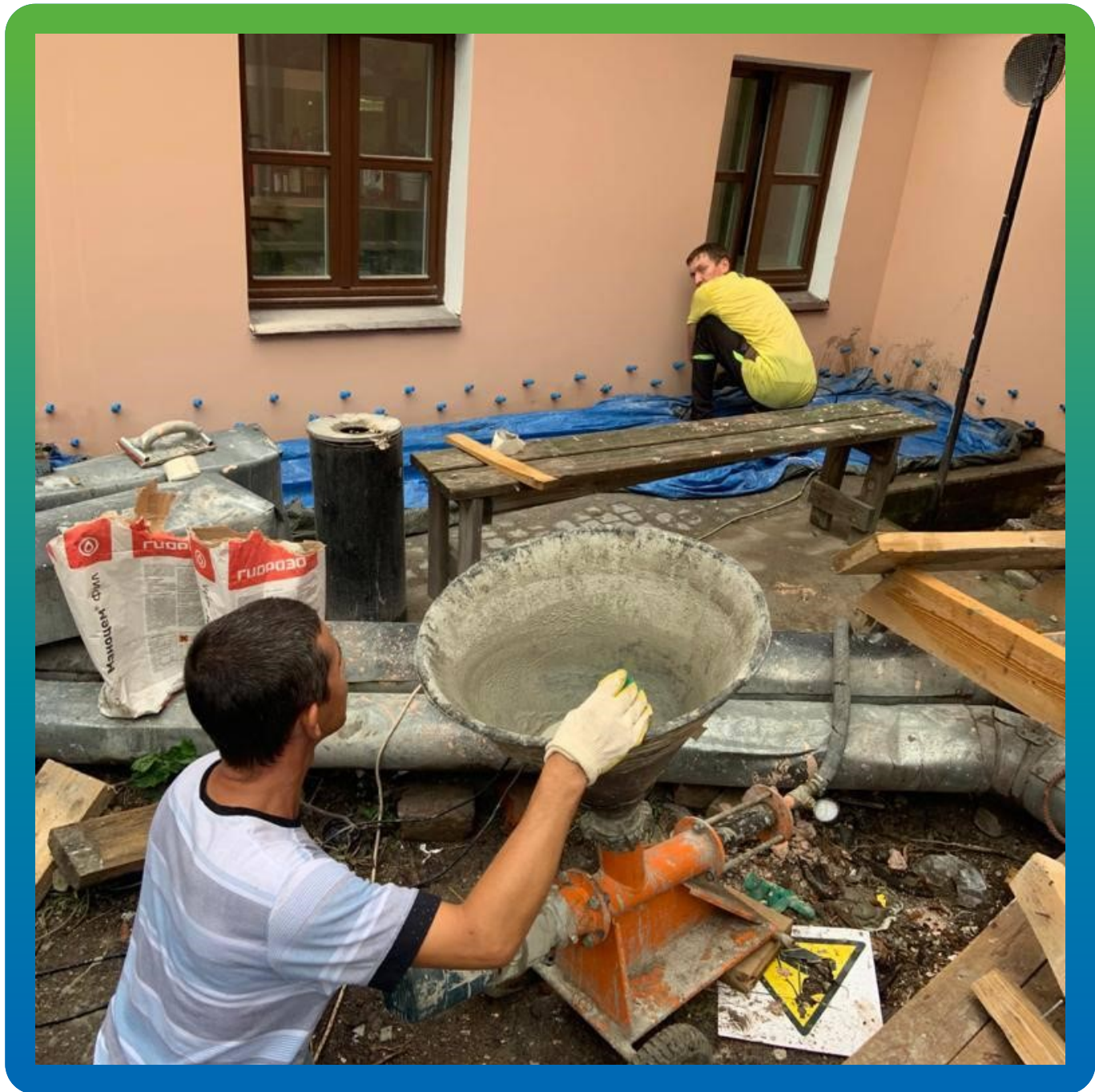
Прокачка фундамента микроцементом Маноцем Фил