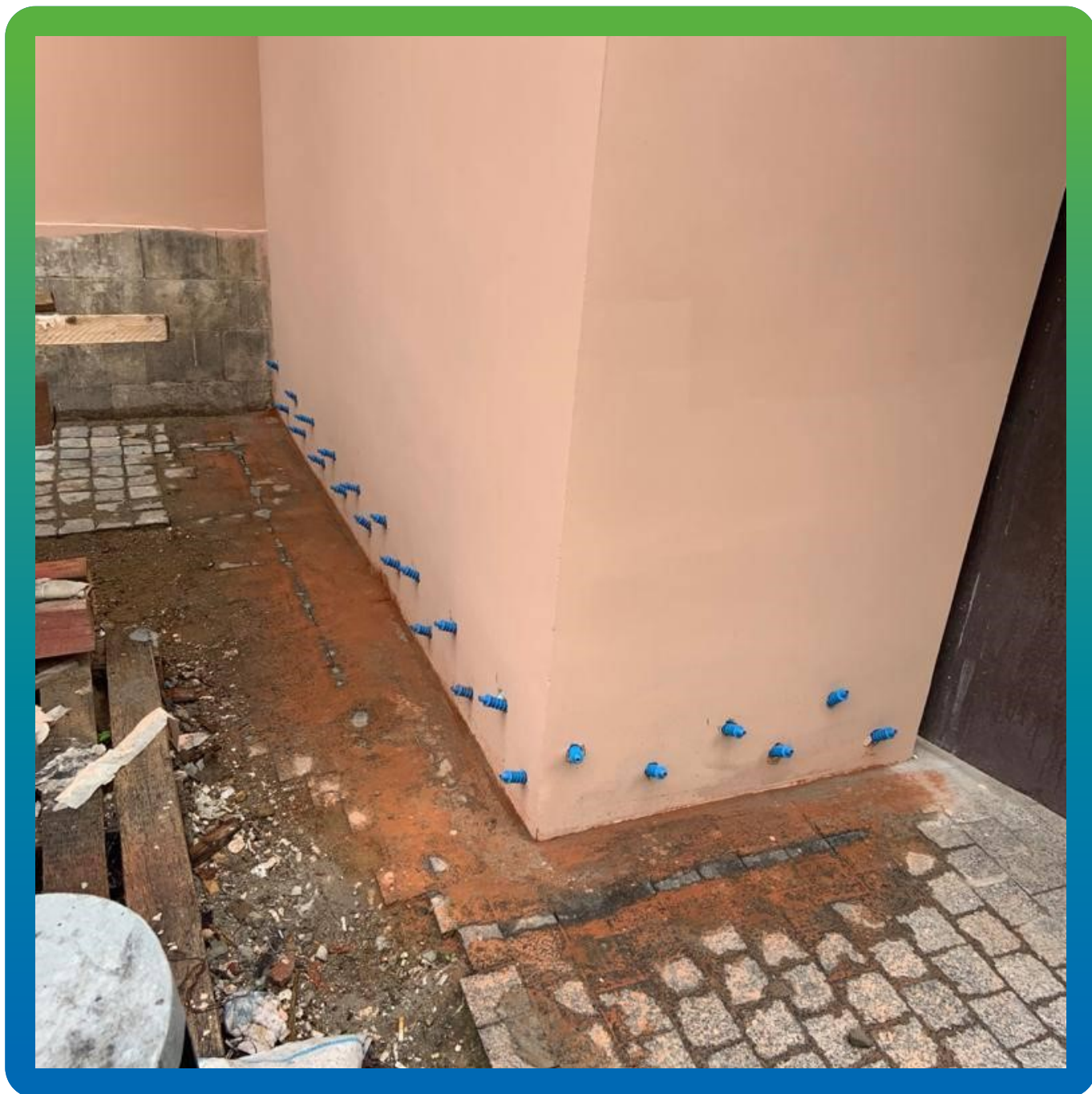
Инъектирование фундамента составом Маноксан 150