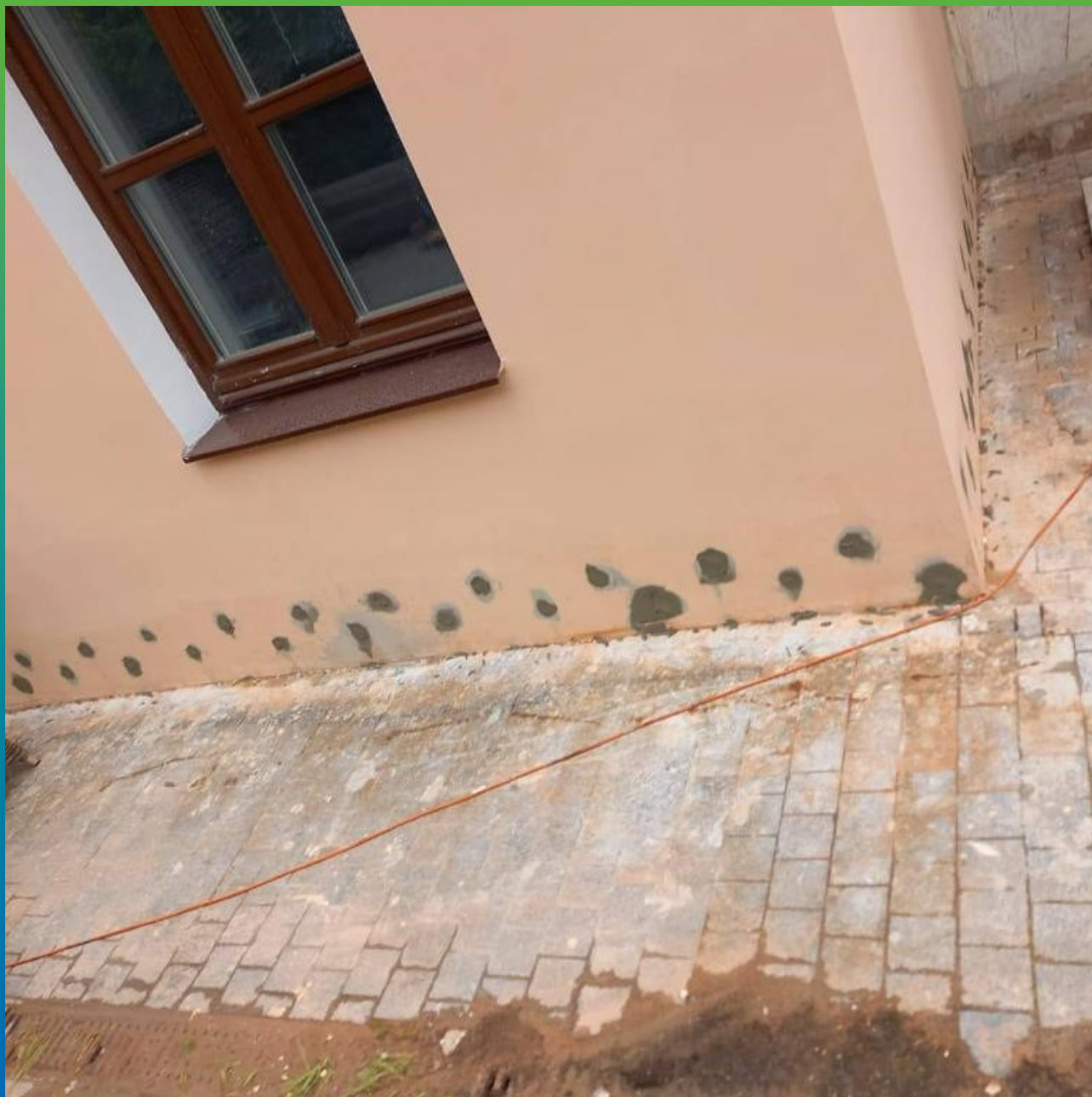
Зачеканка отверстий после прокачки ремонтным составом Стармекс РМЗ