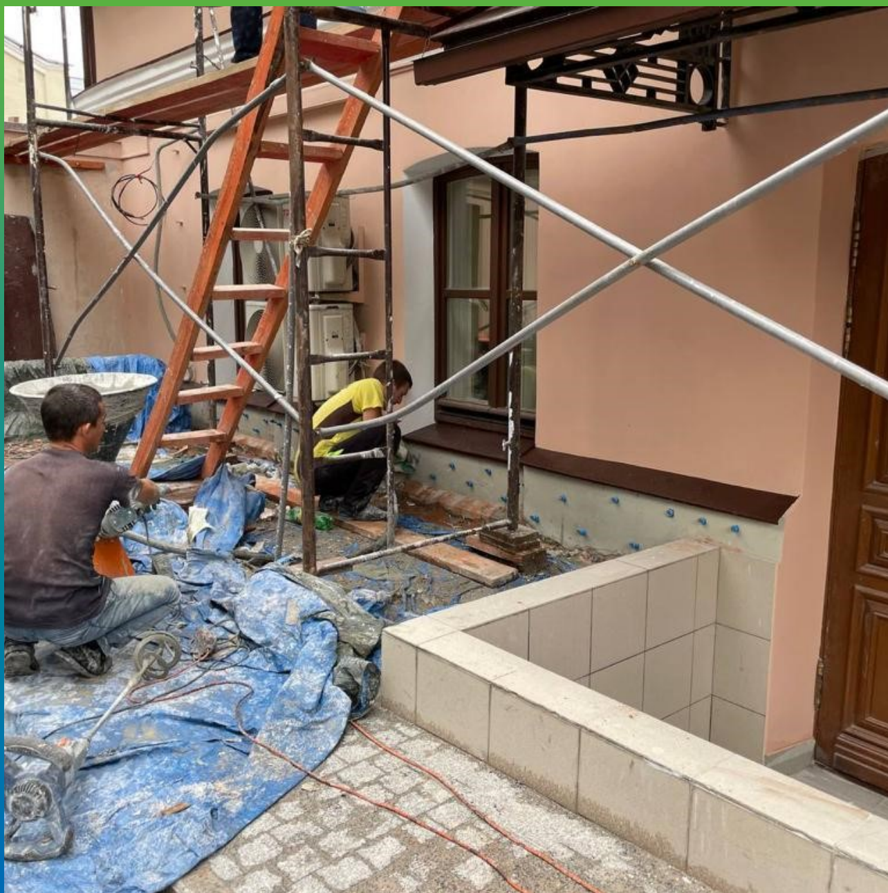
Прокачка фундамента микроцементом Маноцем Фил