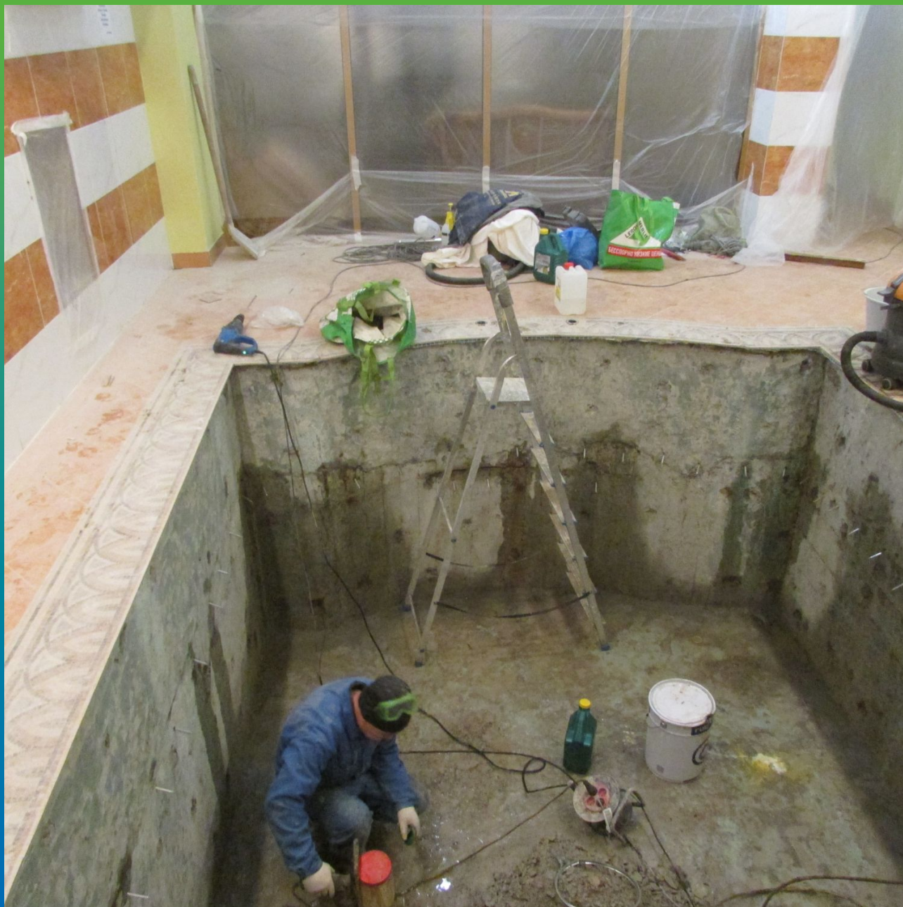
Горизонтальный холодный шов бассейна, подготовленный к инъектированию составом Манопур С