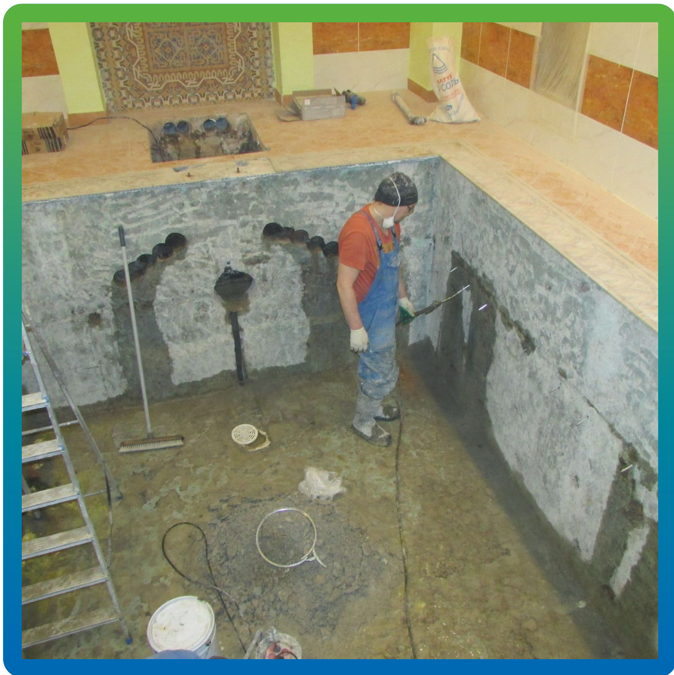
Подача состава манопур С через пакера БМ 1099