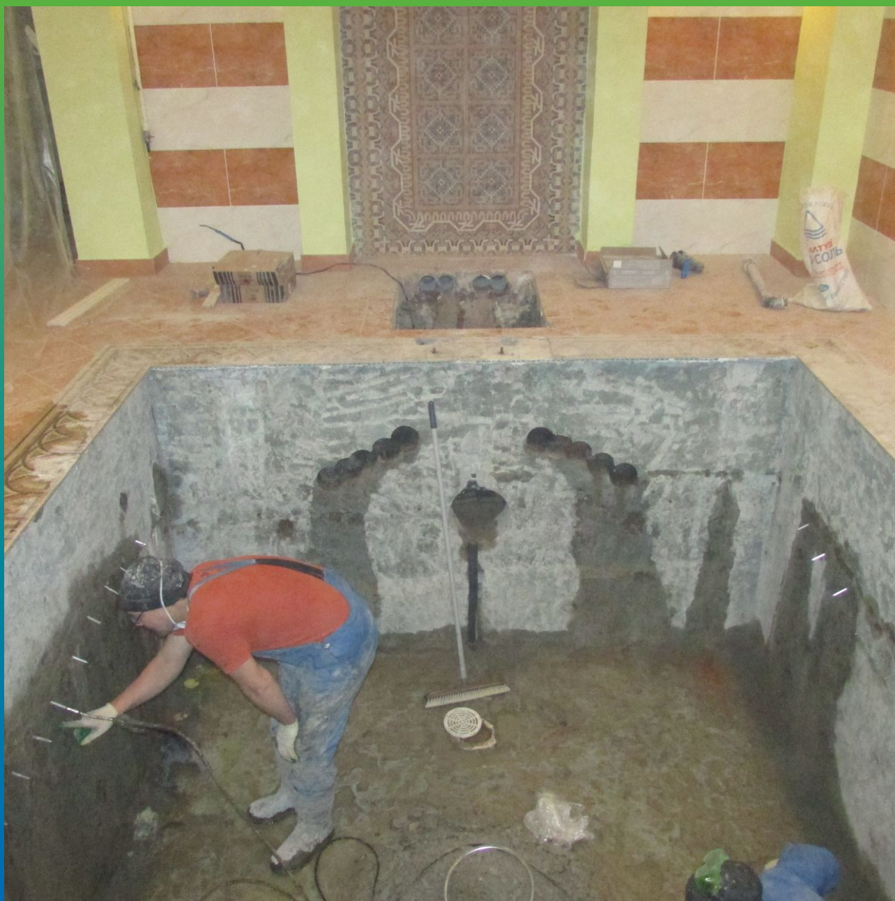
Подача состава манопур С через пакера БМ 1099