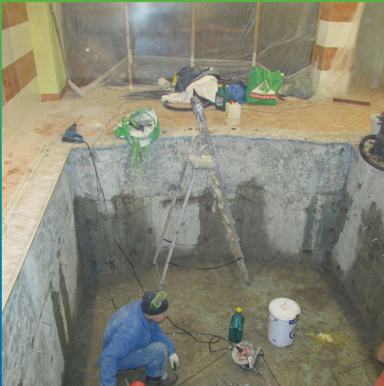
Подача состава манопур С через пакера БМ 1099