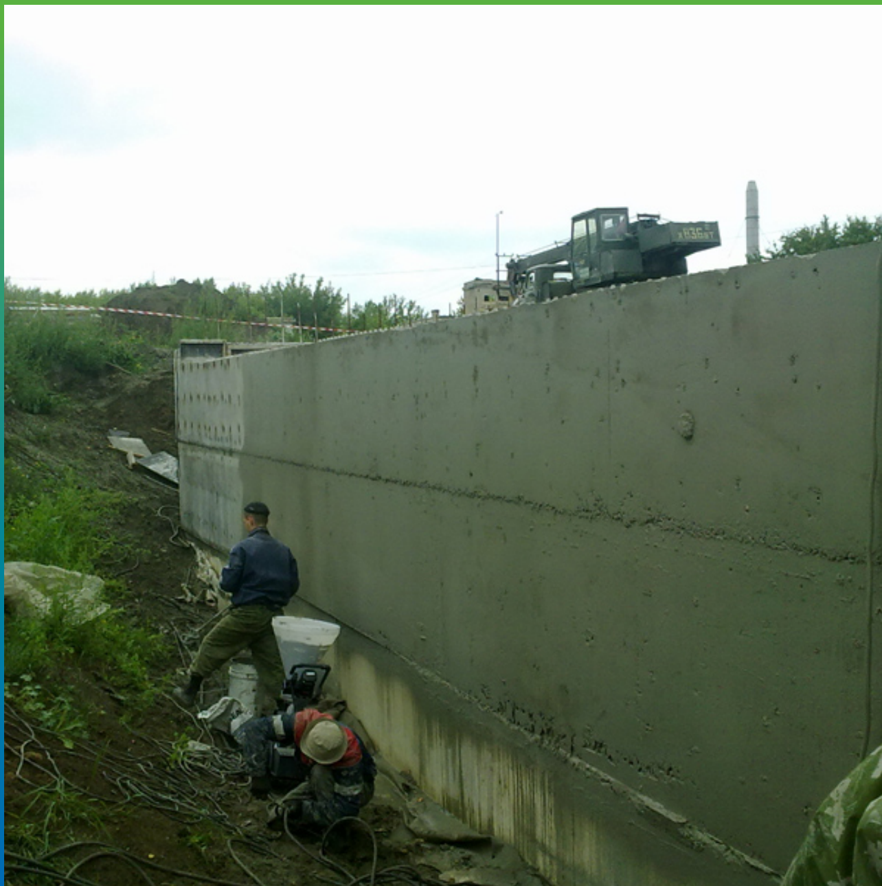
Механическое нанесение материала Максил Флекс насосом БМП 6