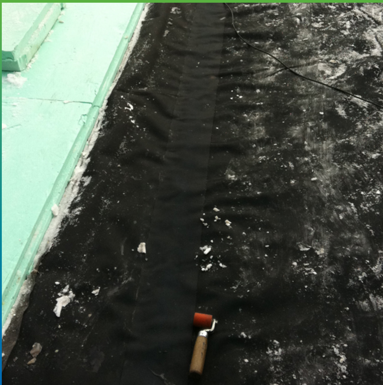
Сваривание карт из ЭПДМ мембраны Эластосил Т