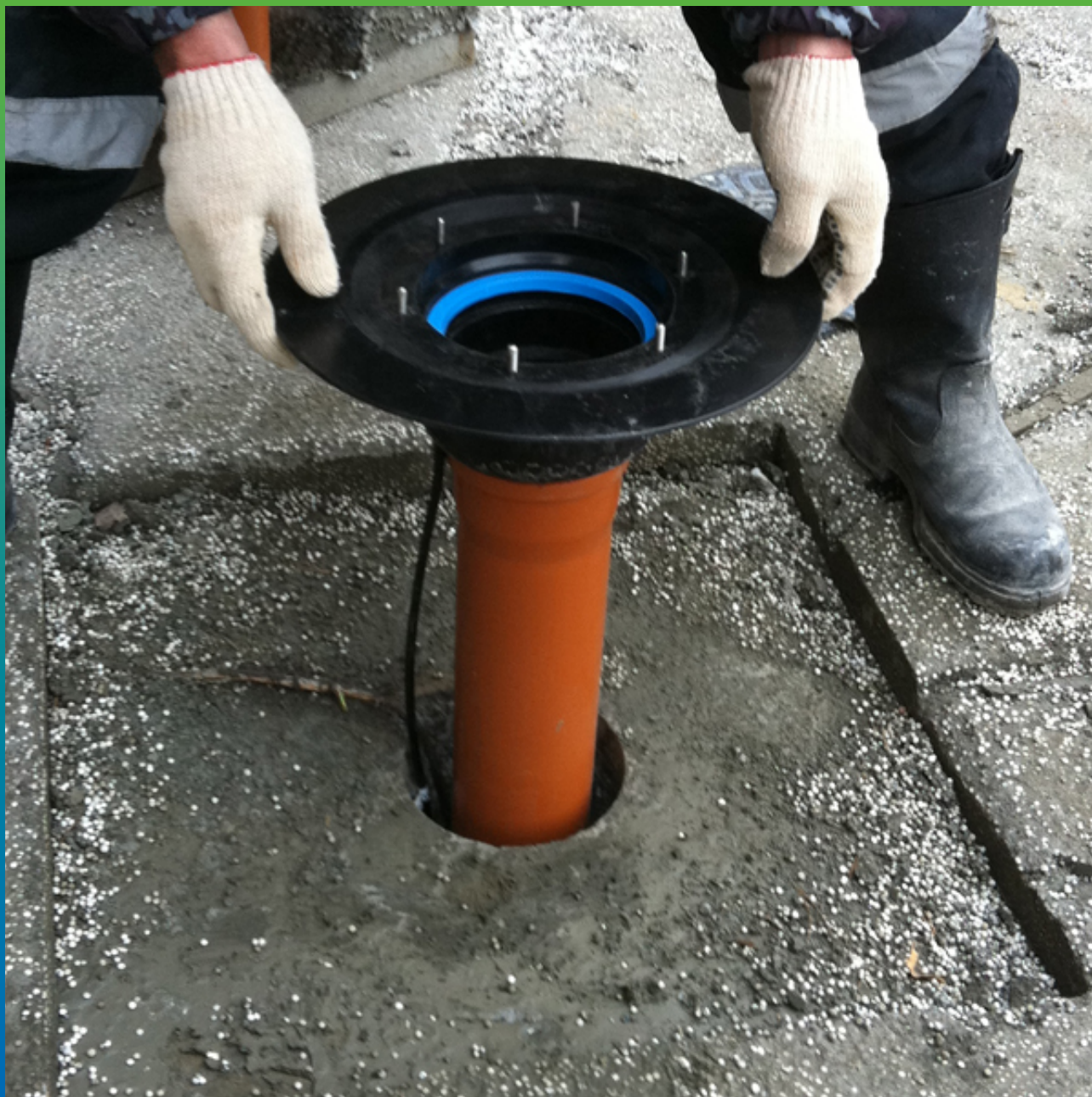
Устройство кровельной воронки