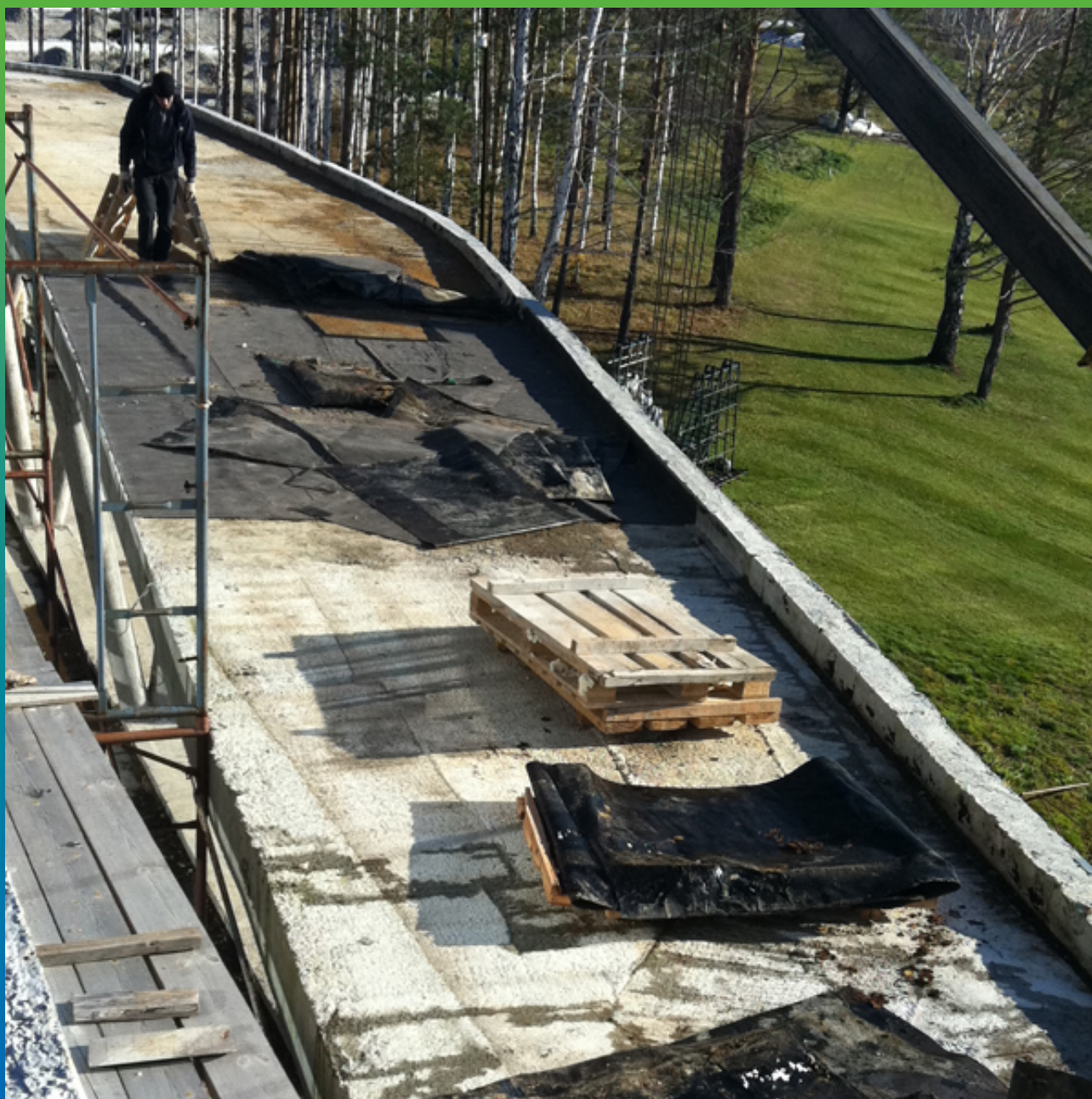
Удаление временного гидроизолирующего слоя