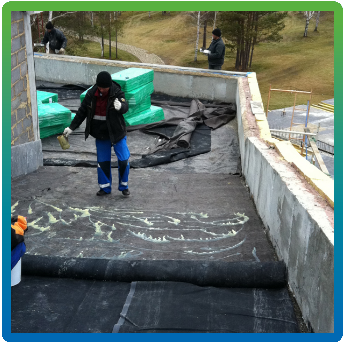
Укладка ЭПДМ мембраны Эластосил Т