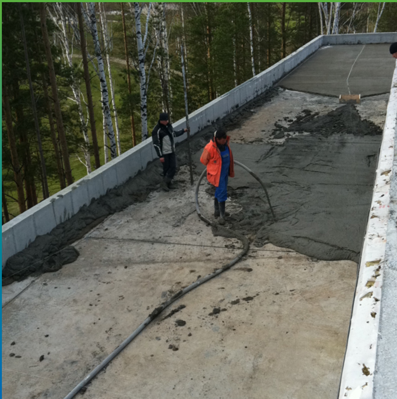
Устройство уклонообразующей стяжки из полистеролбетона