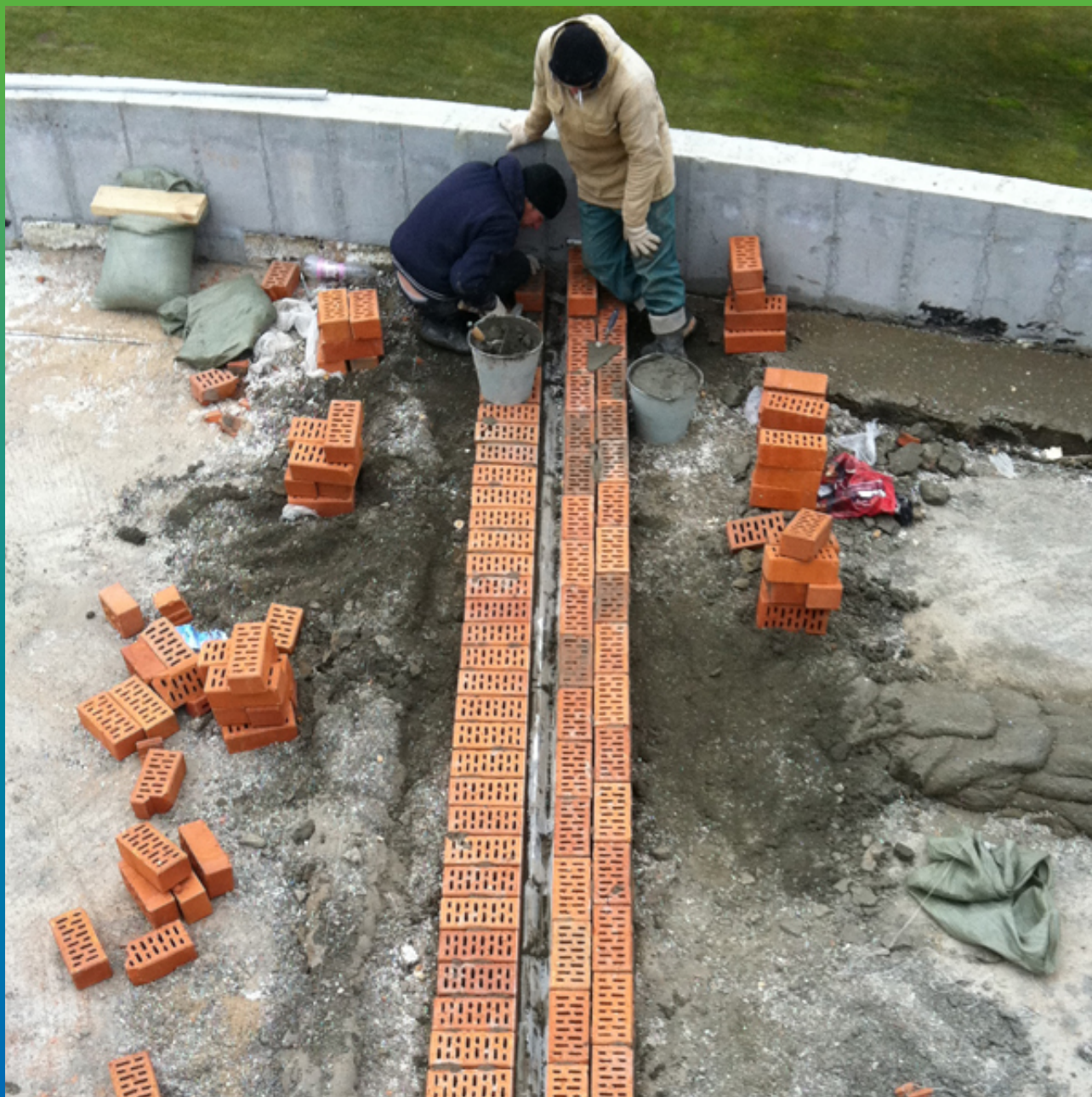
Устройство деформационного шва