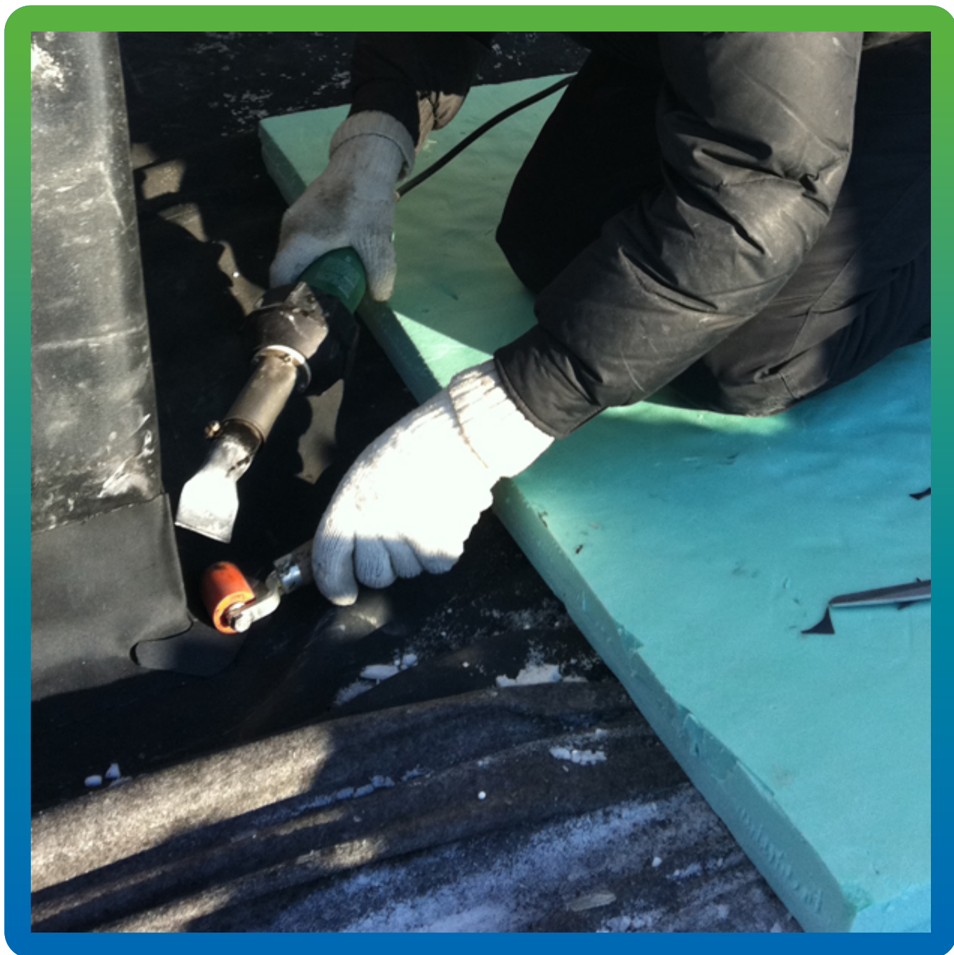
Гидроизоляция парапетов (сварка мембран ТПО - ЭПДМ))