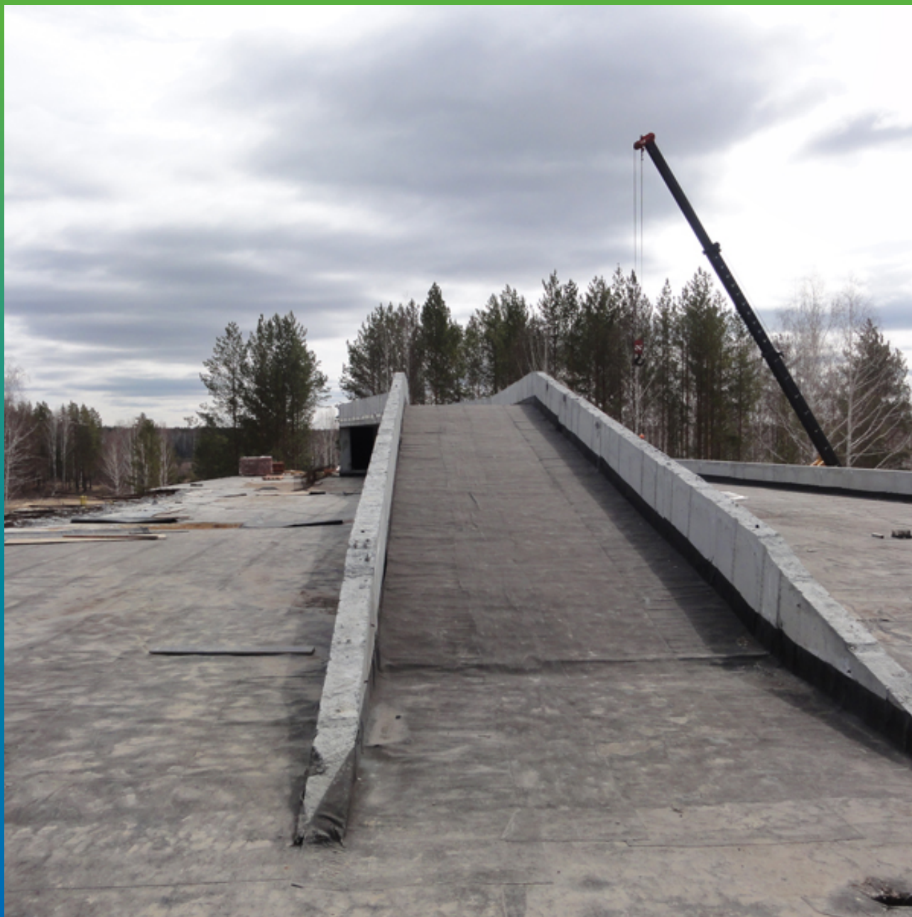
Вид кровли до устройства гидроизоляции