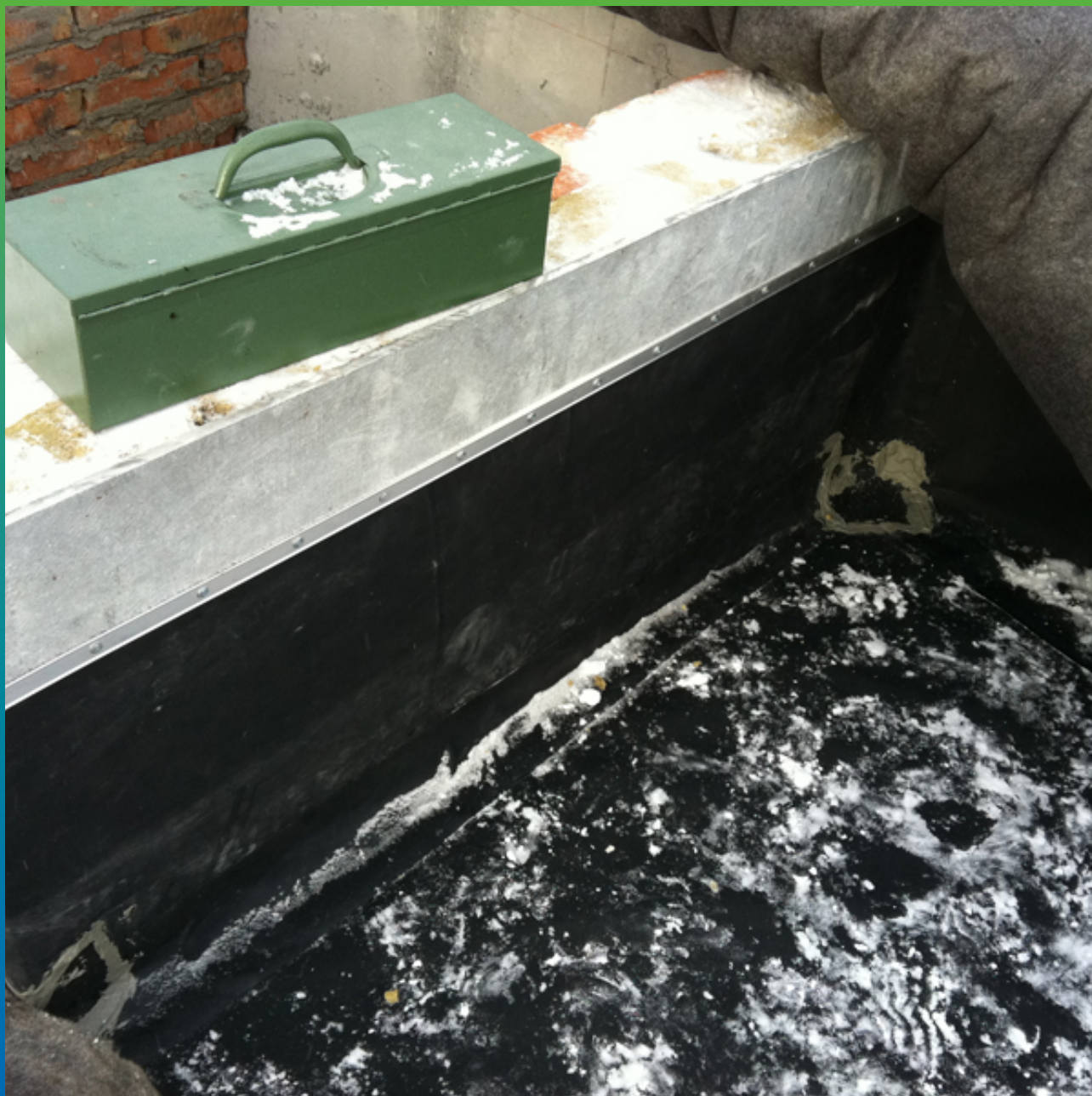
Крепление ЭПДМ мембраны Эластосил Т на планку