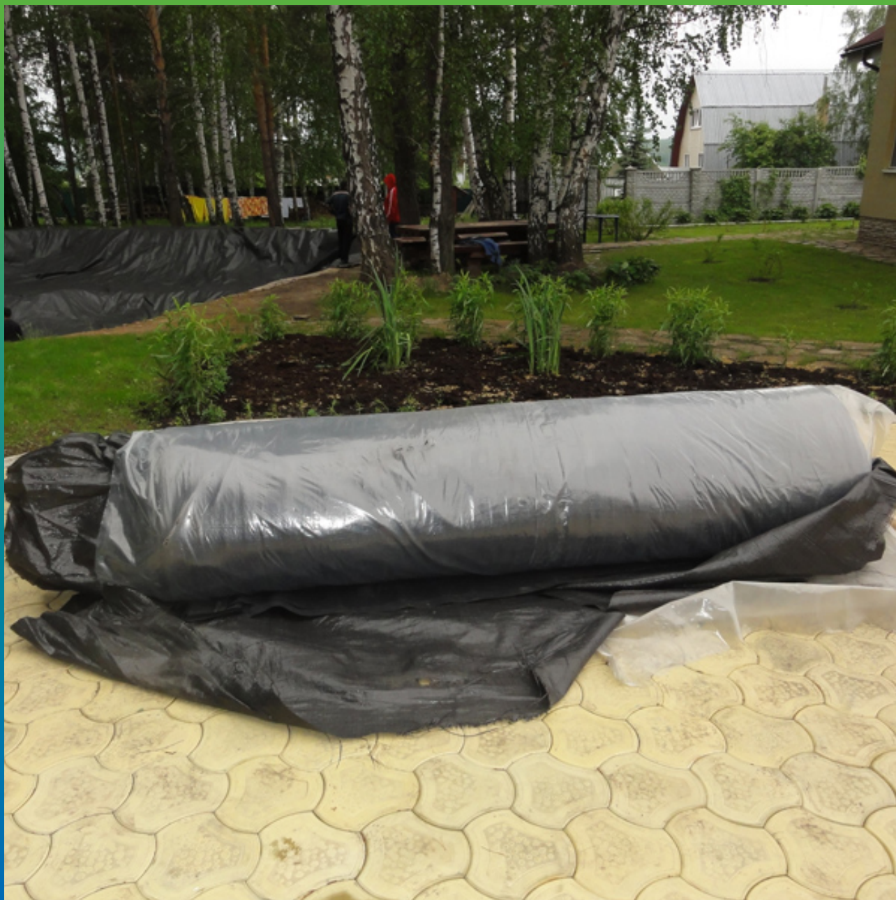
ЭПДМ мембрана Эластосил Т готовая карта