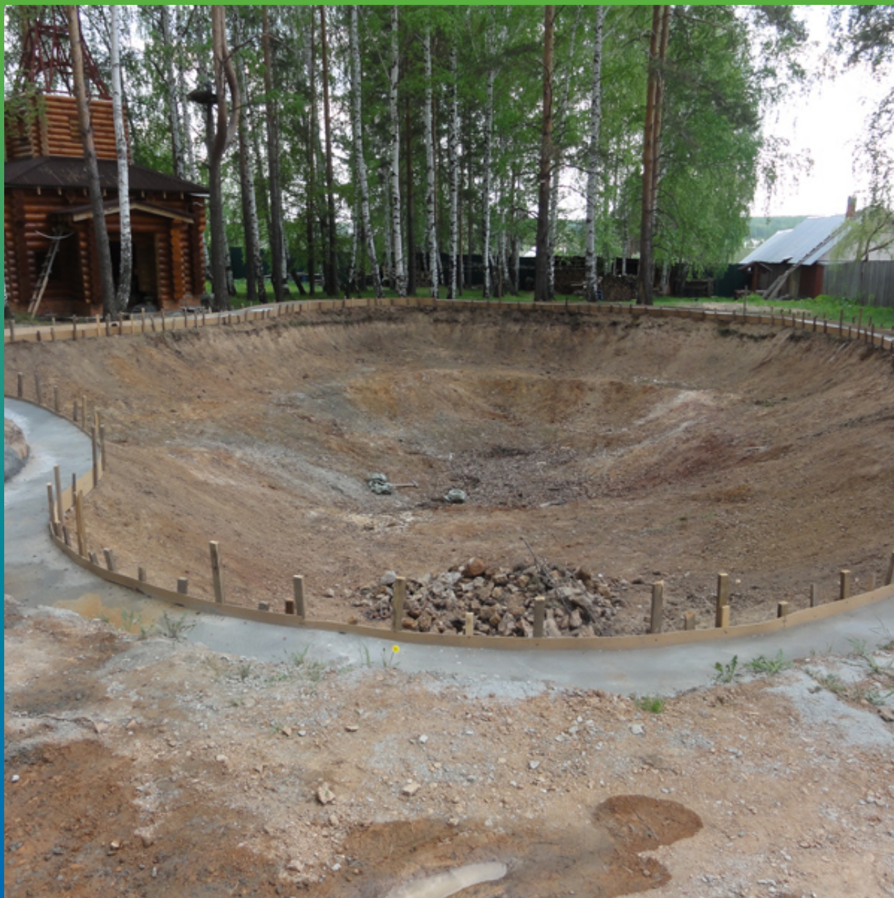
Подготовленный котлован для устройства искусственного водоема