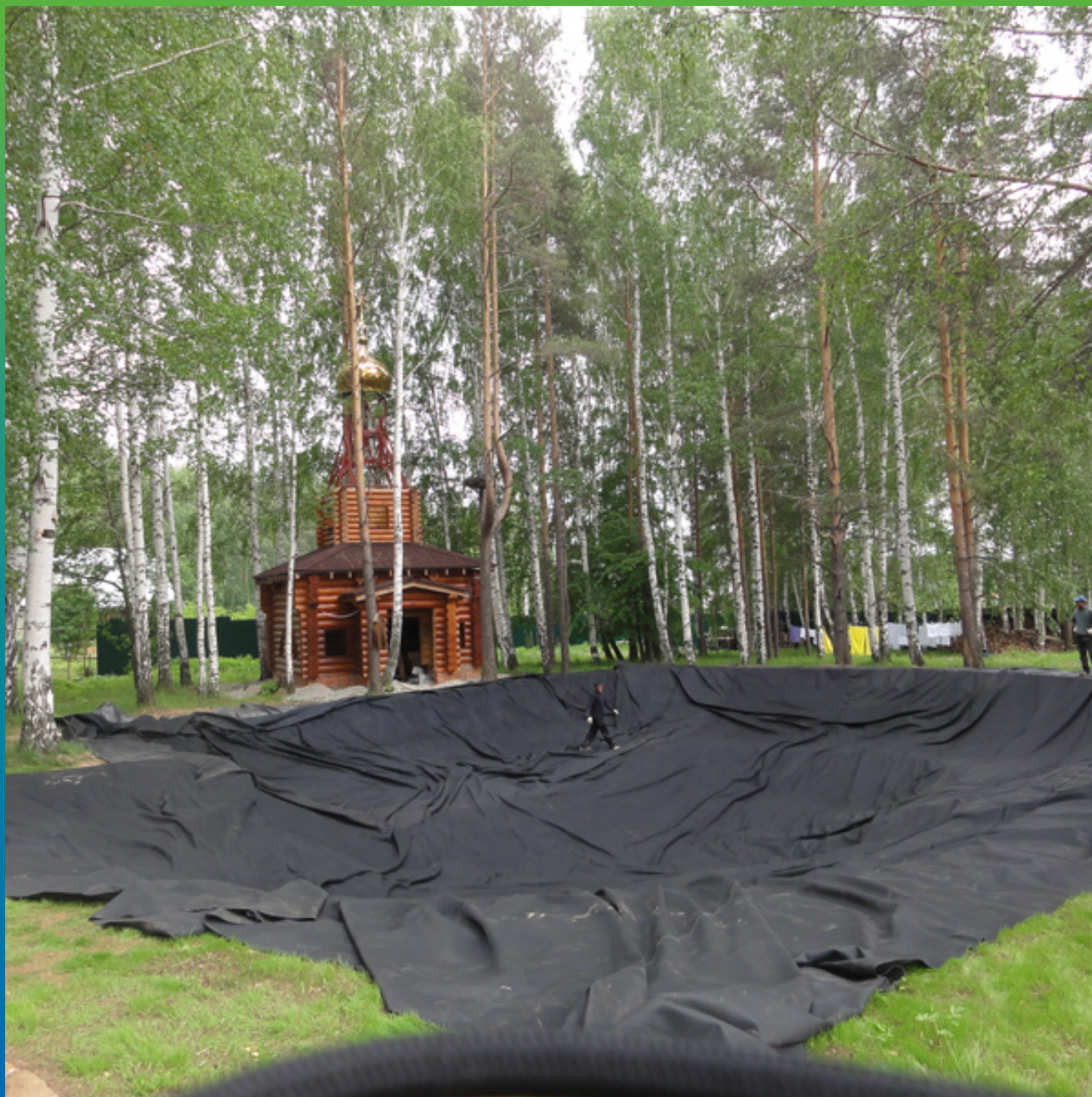
ЭПДМ мембрана готова к закреплению