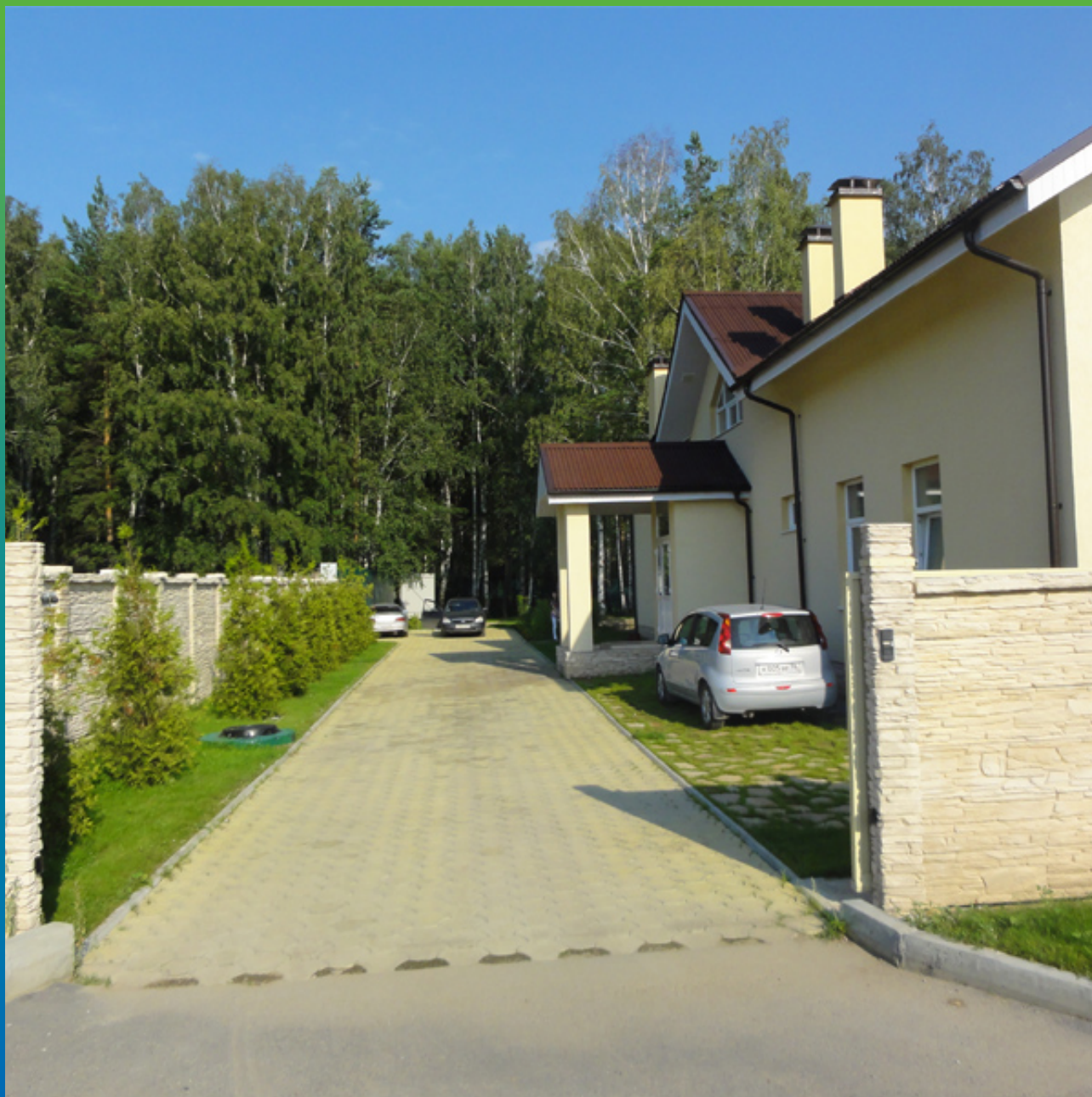
Общий вид объекта