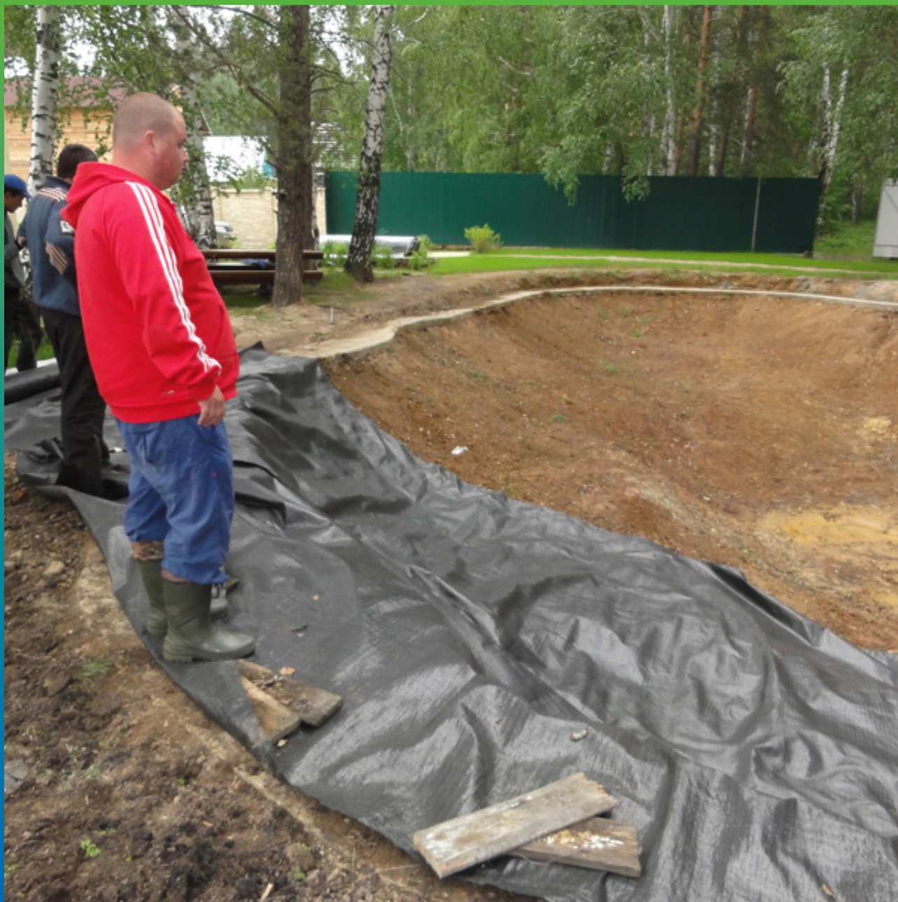
Начало укладки геотекстиля