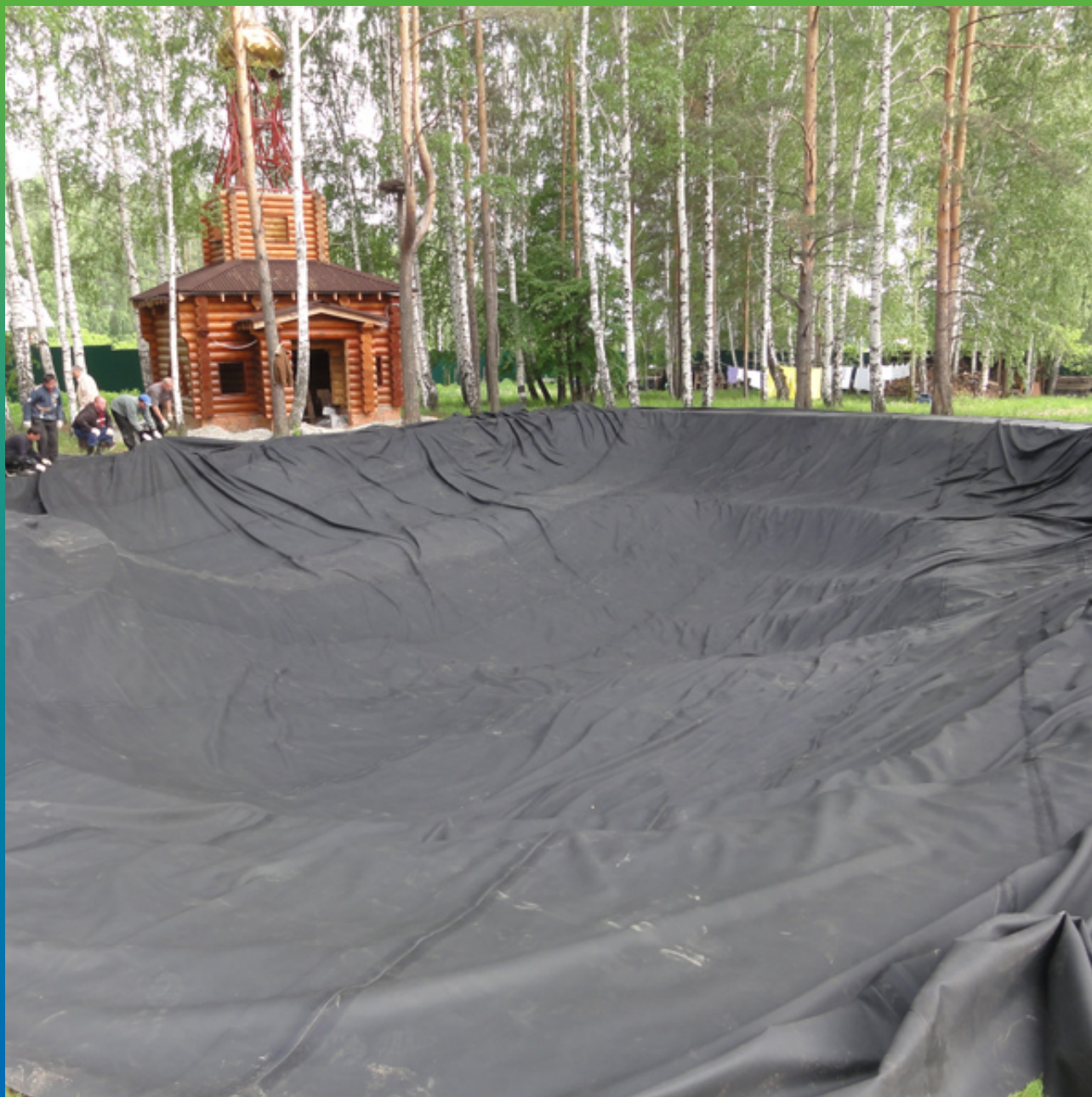
Укладка ЭПДМ мембраны Эластосил Т