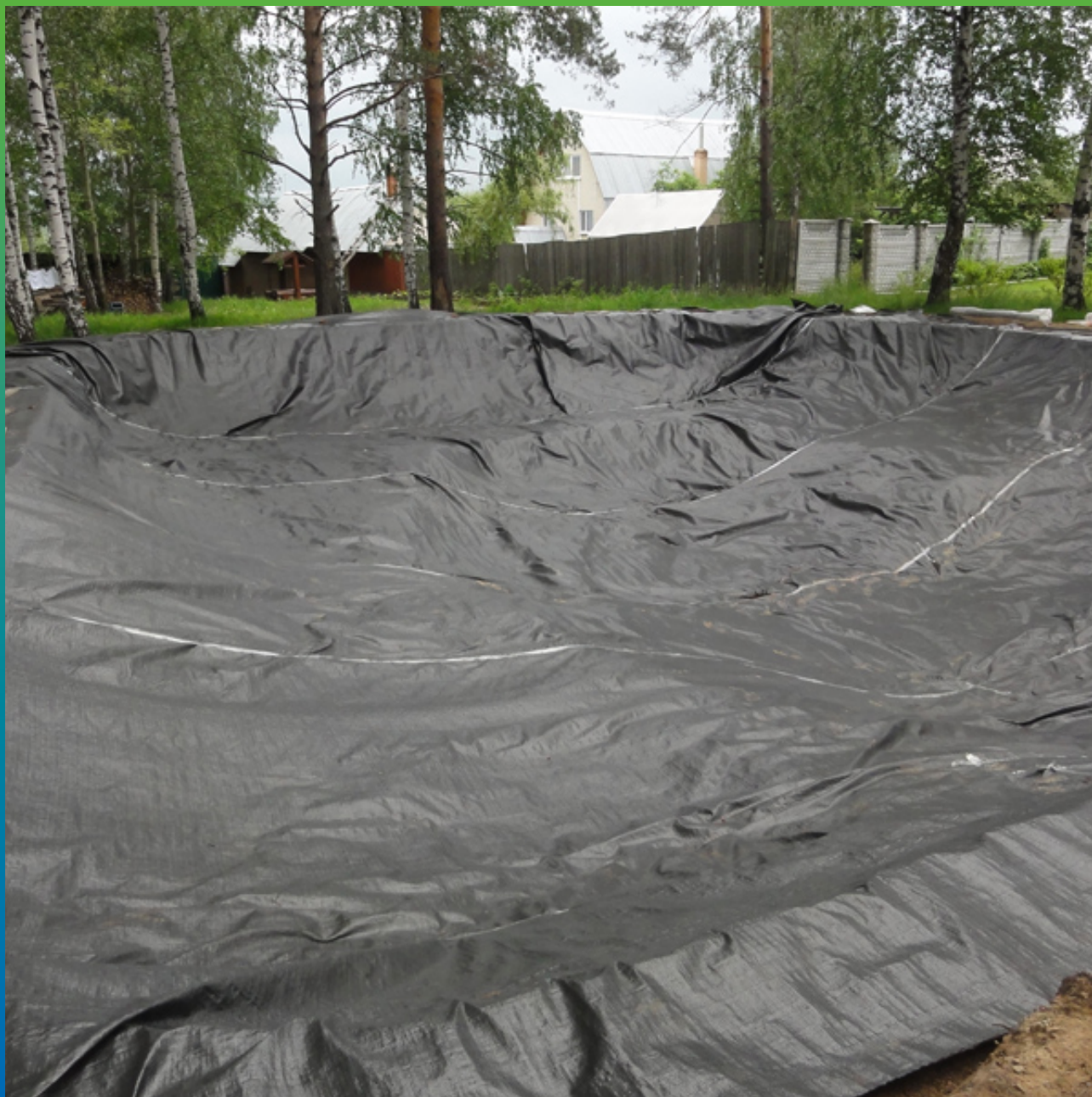
Готовая площадка для укладки ЭПДМ