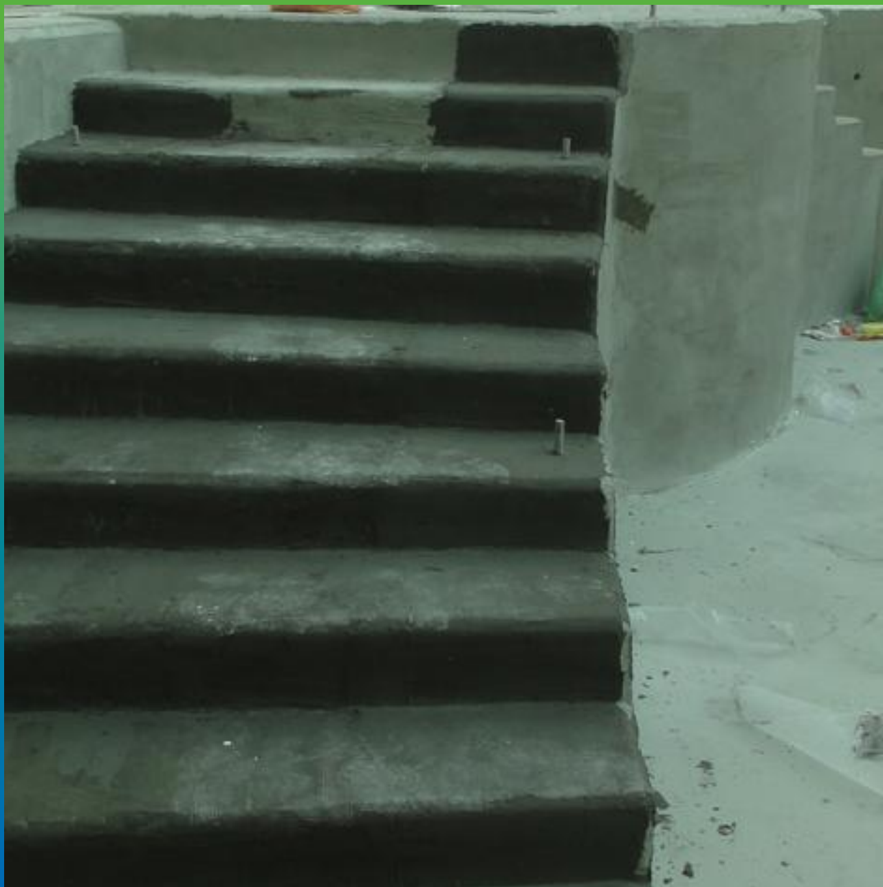
Нанесение Стармекс Сил Флекс на ступеньки бассейна