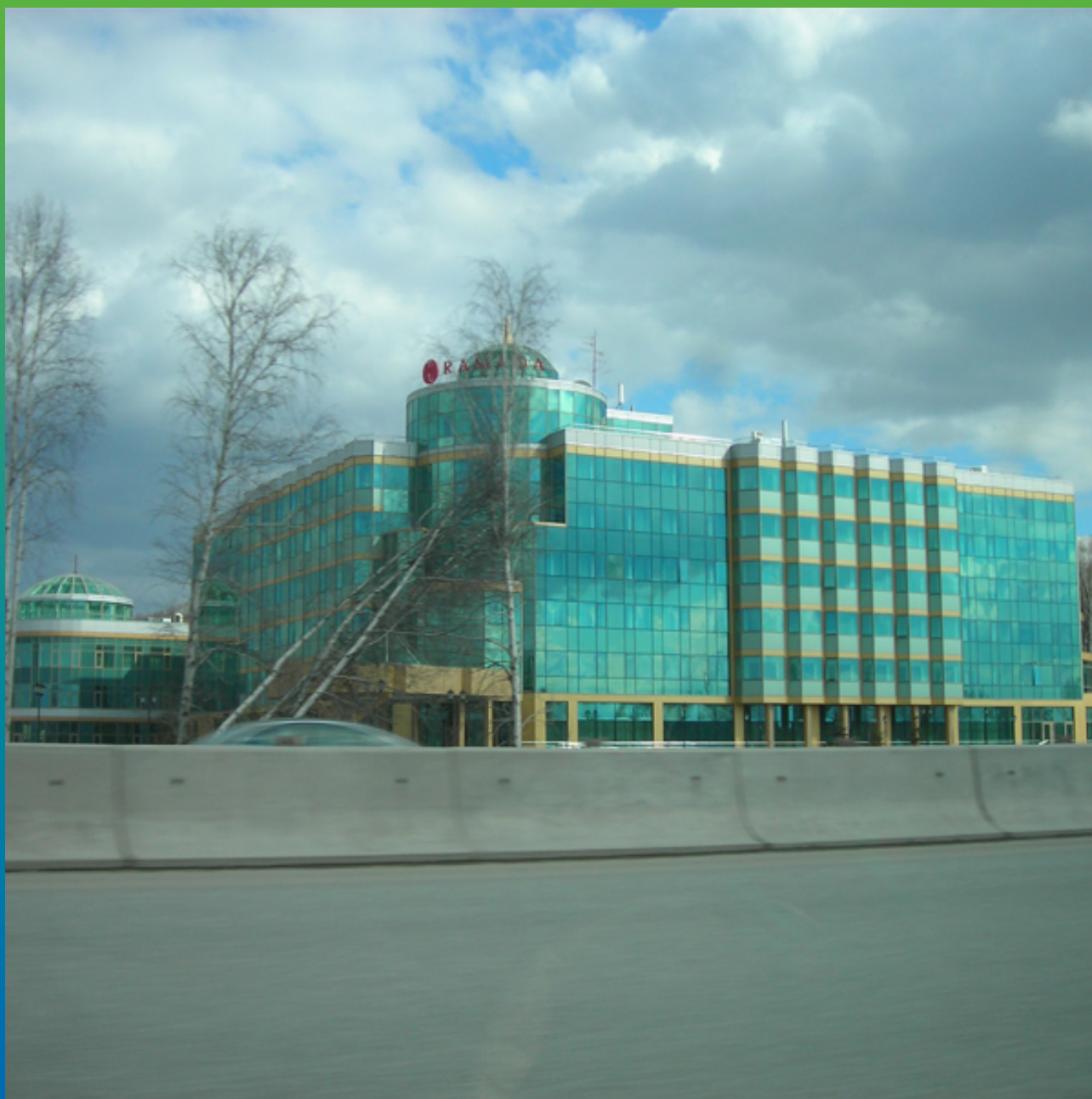
Общий вид объекта