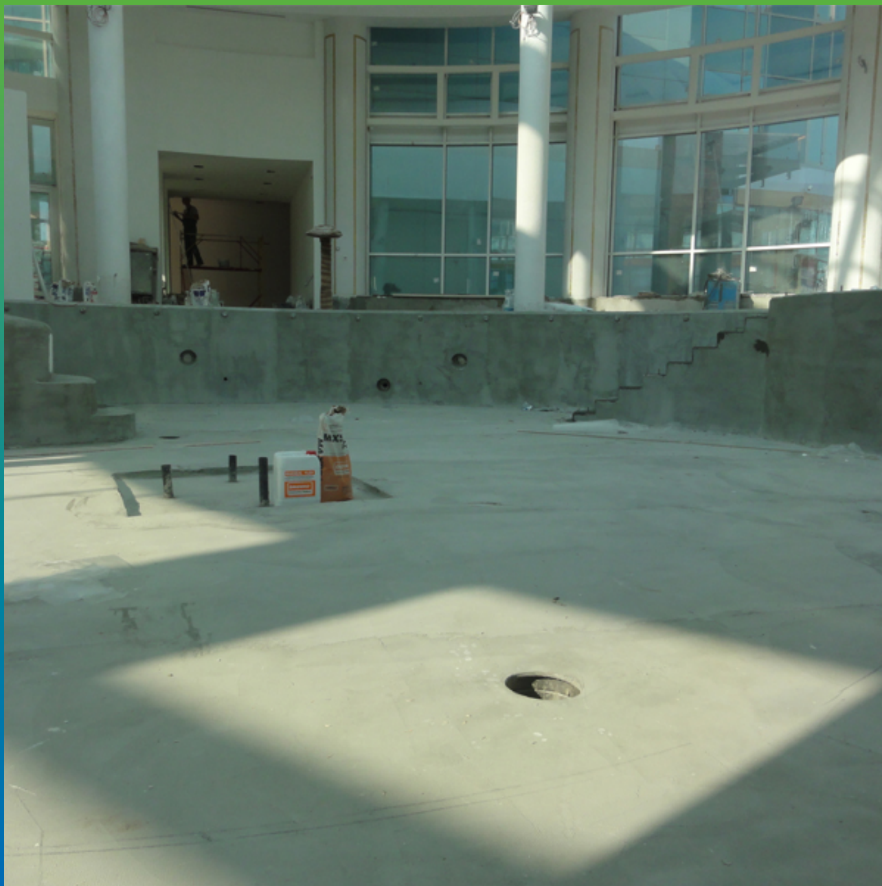
Общий вид чаши бассейна после нанесения гидроизоляционного материала Стармекс Сил Флекс в два слоя