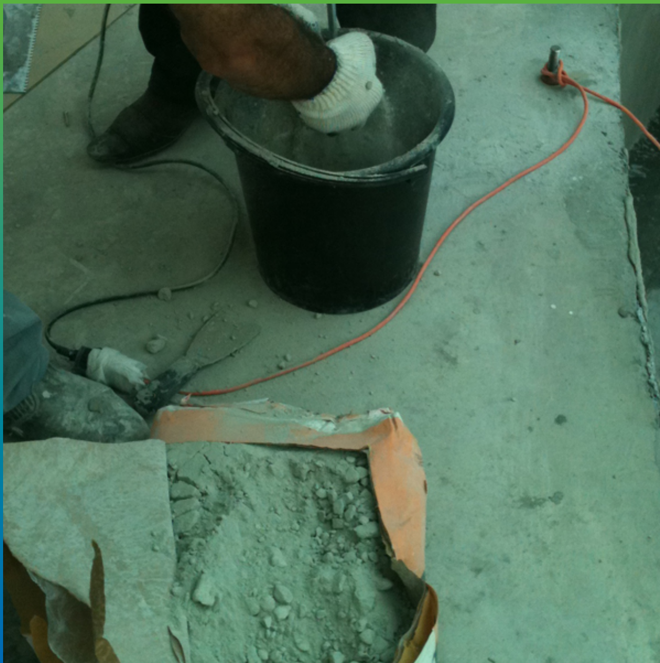
Затворение Стармекс Сил Флекс