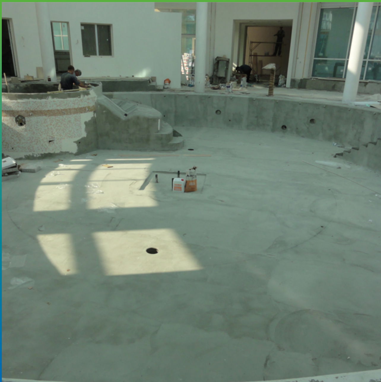
Облицовка чаши бассейна плиткой