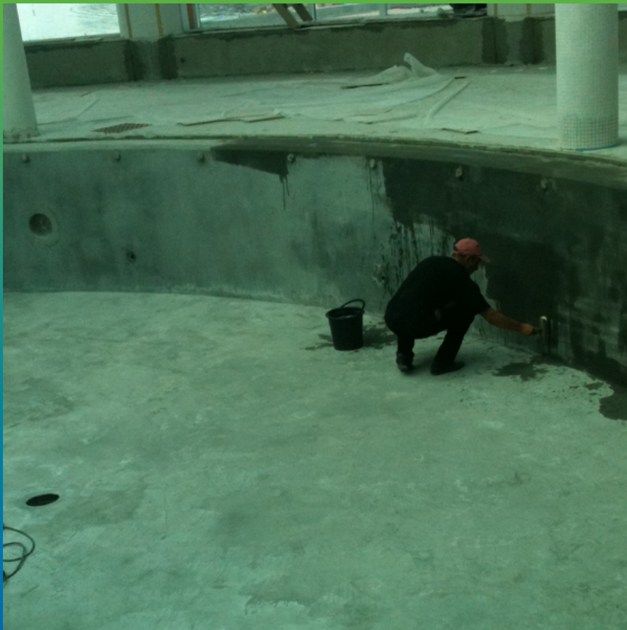
Нанесение гидроизоляционного покрытия Стармекс Сил Флекс на подготовленную поверхность