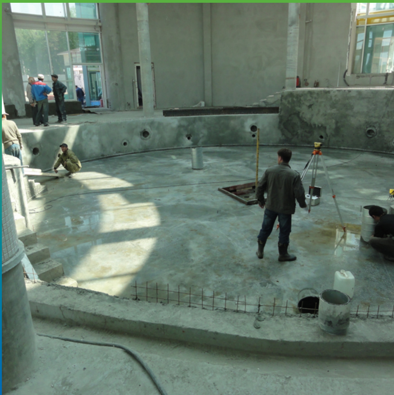
Подготовительные работы - выравнивание поверхности