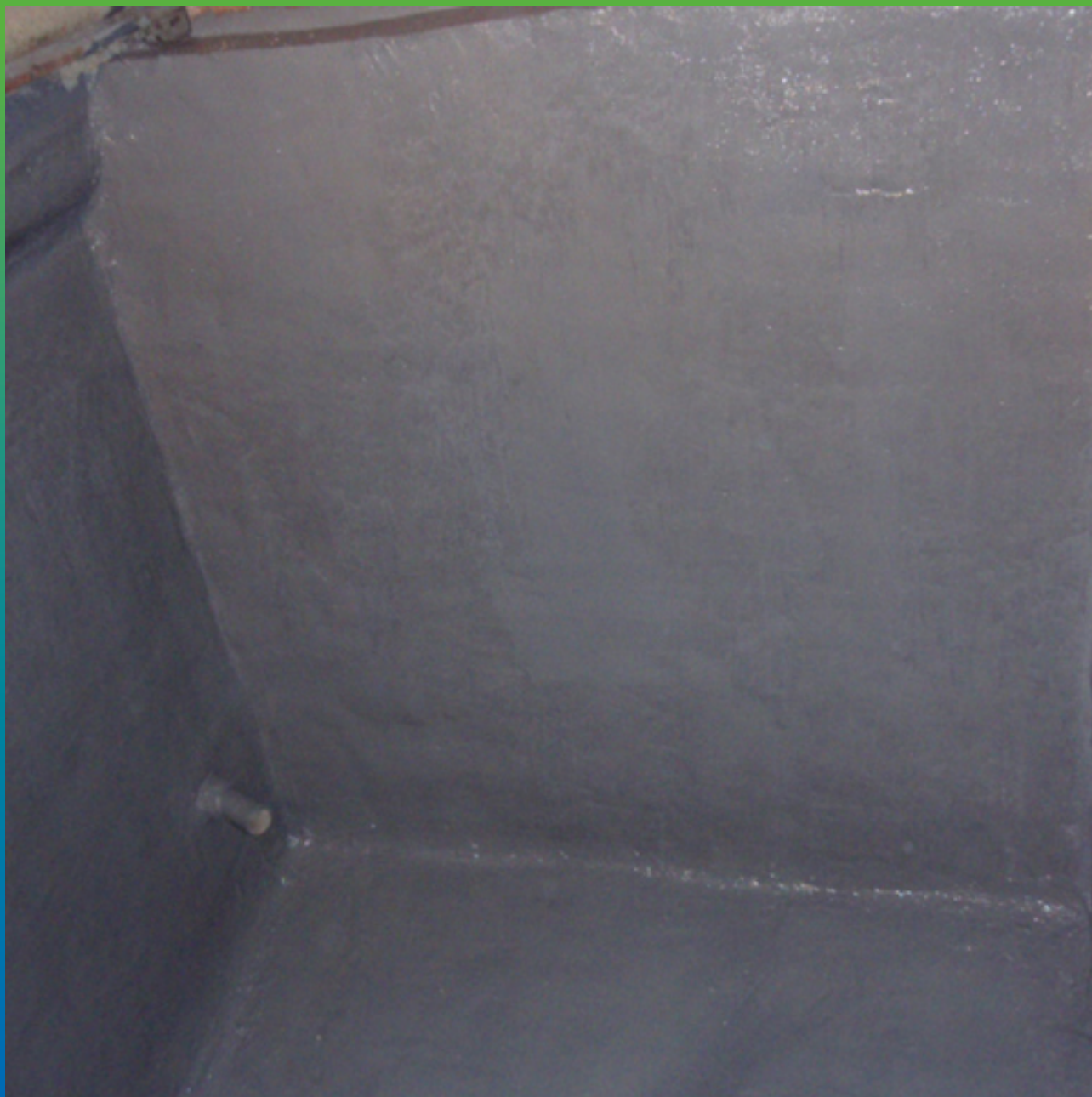
Бак после нанесения материала Максэпокс Флекс