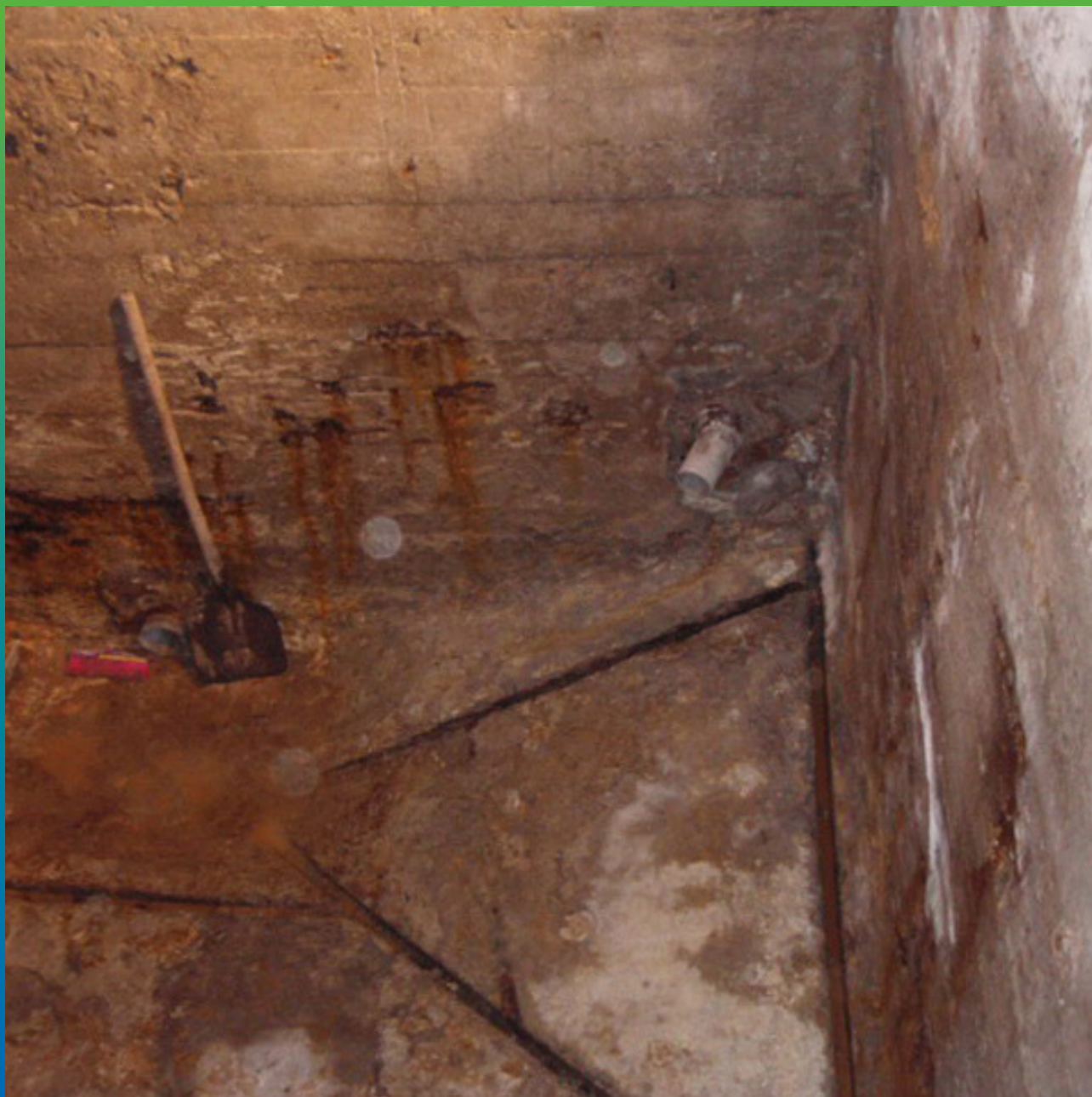
Бак после очистки