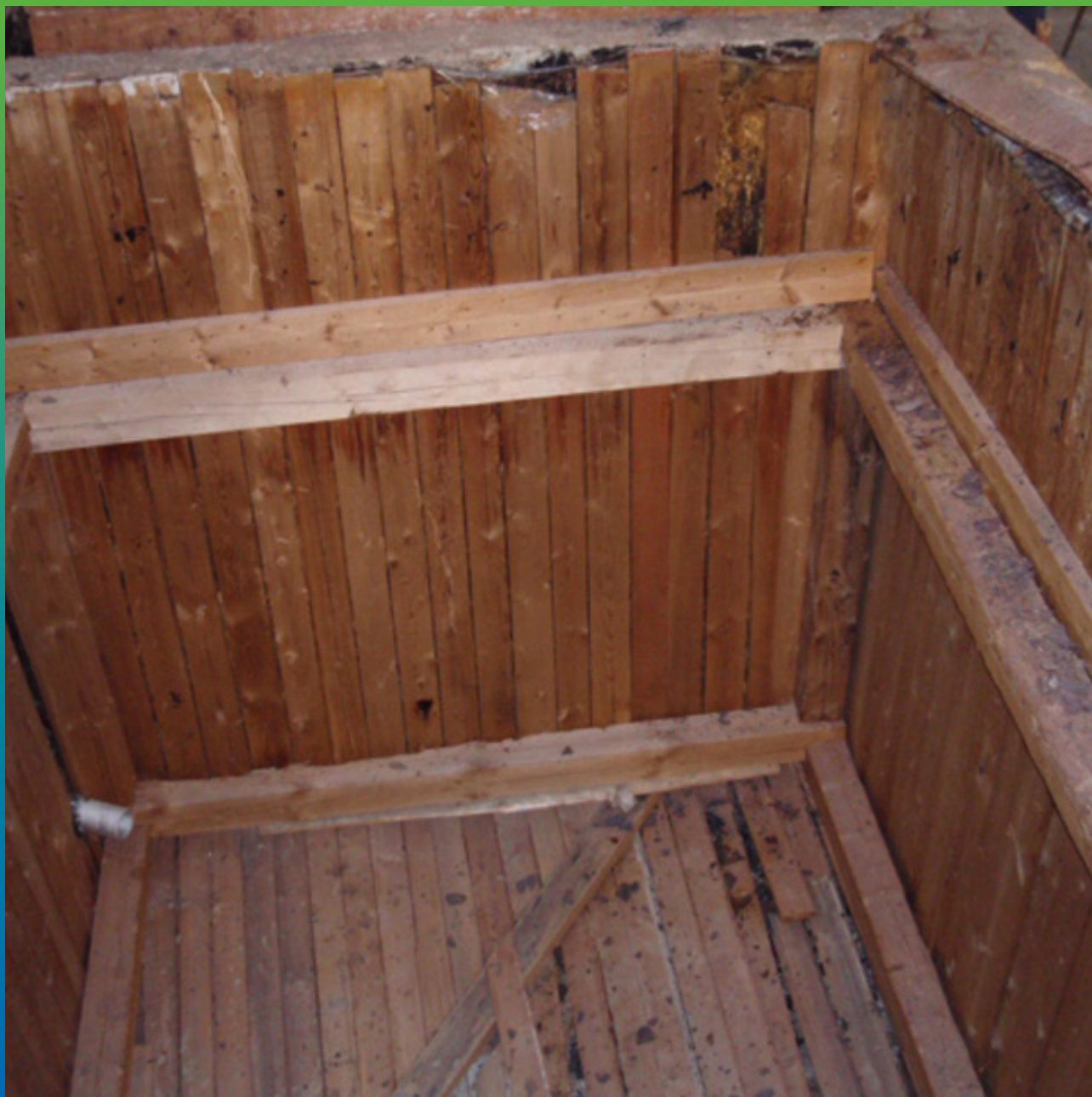
Вид объекта до начала производства работ