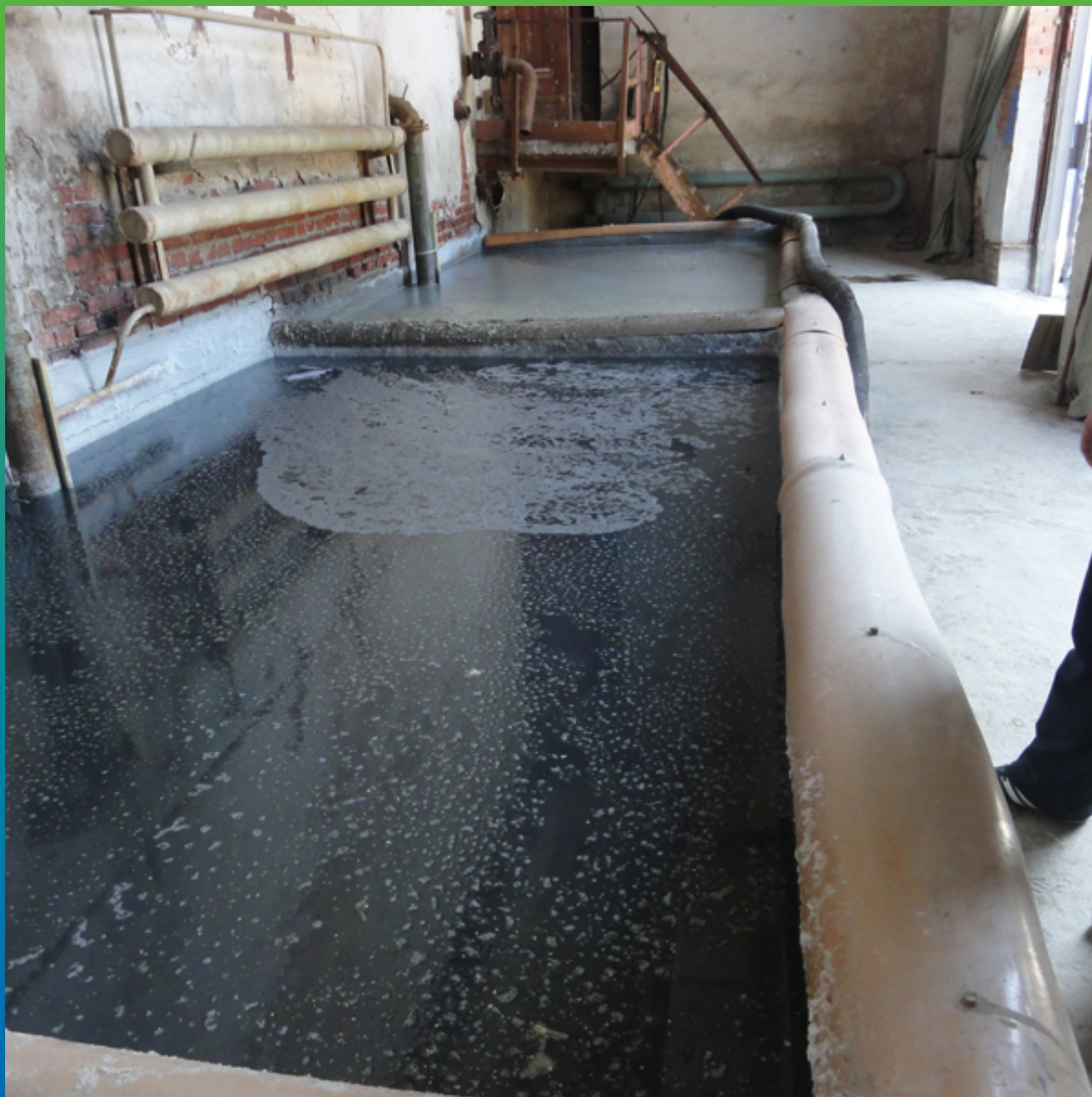
ЛЕВЫЙ ПОДВОДЯЩИЙ КАНАЛ ЗАПАДНОЙ ФИЛЬТРОВАЛЬНОЙ СТАНЦИИ МУП "ВОДОКАНАЛА"