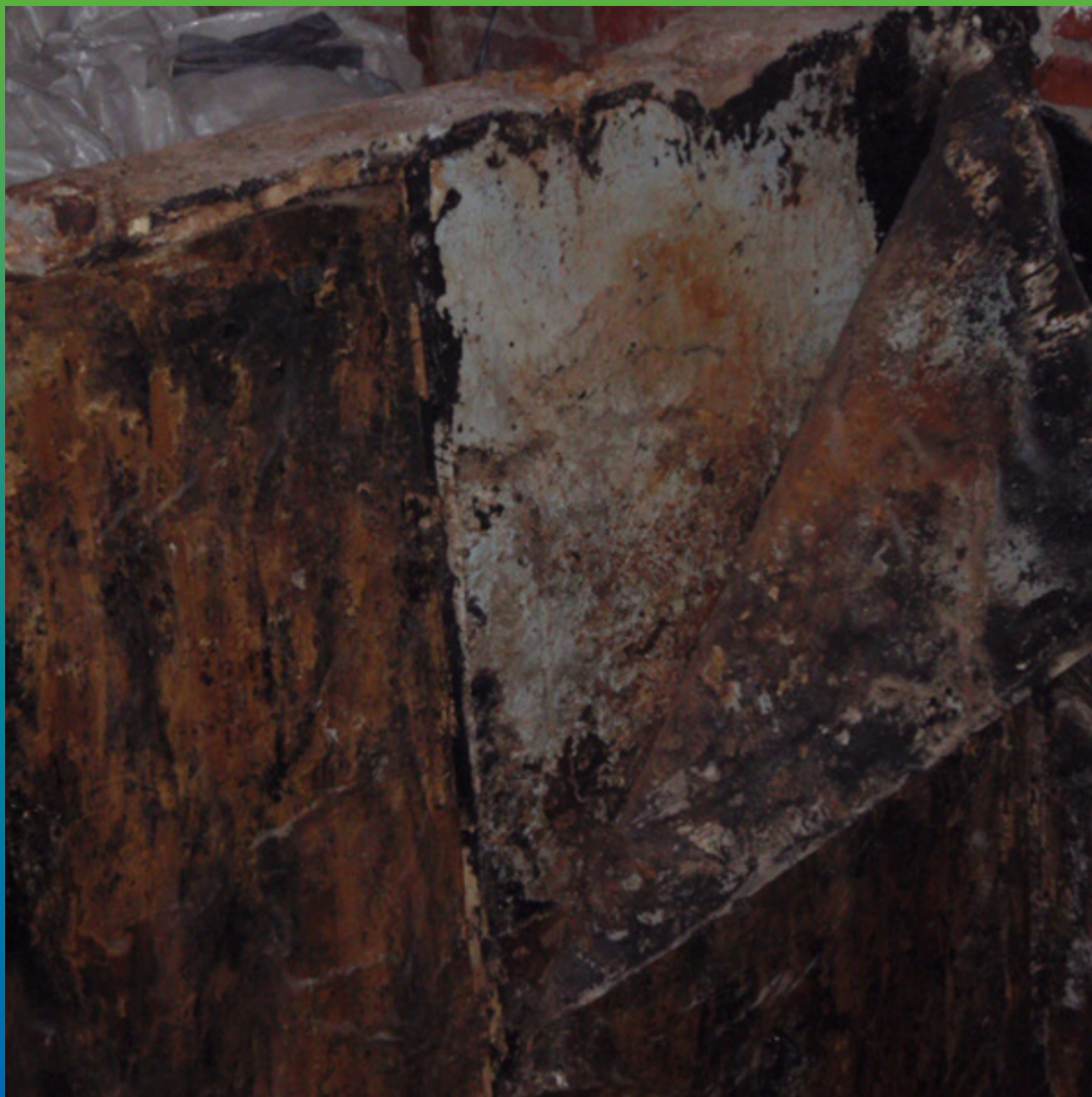
Очистка поверхности бака