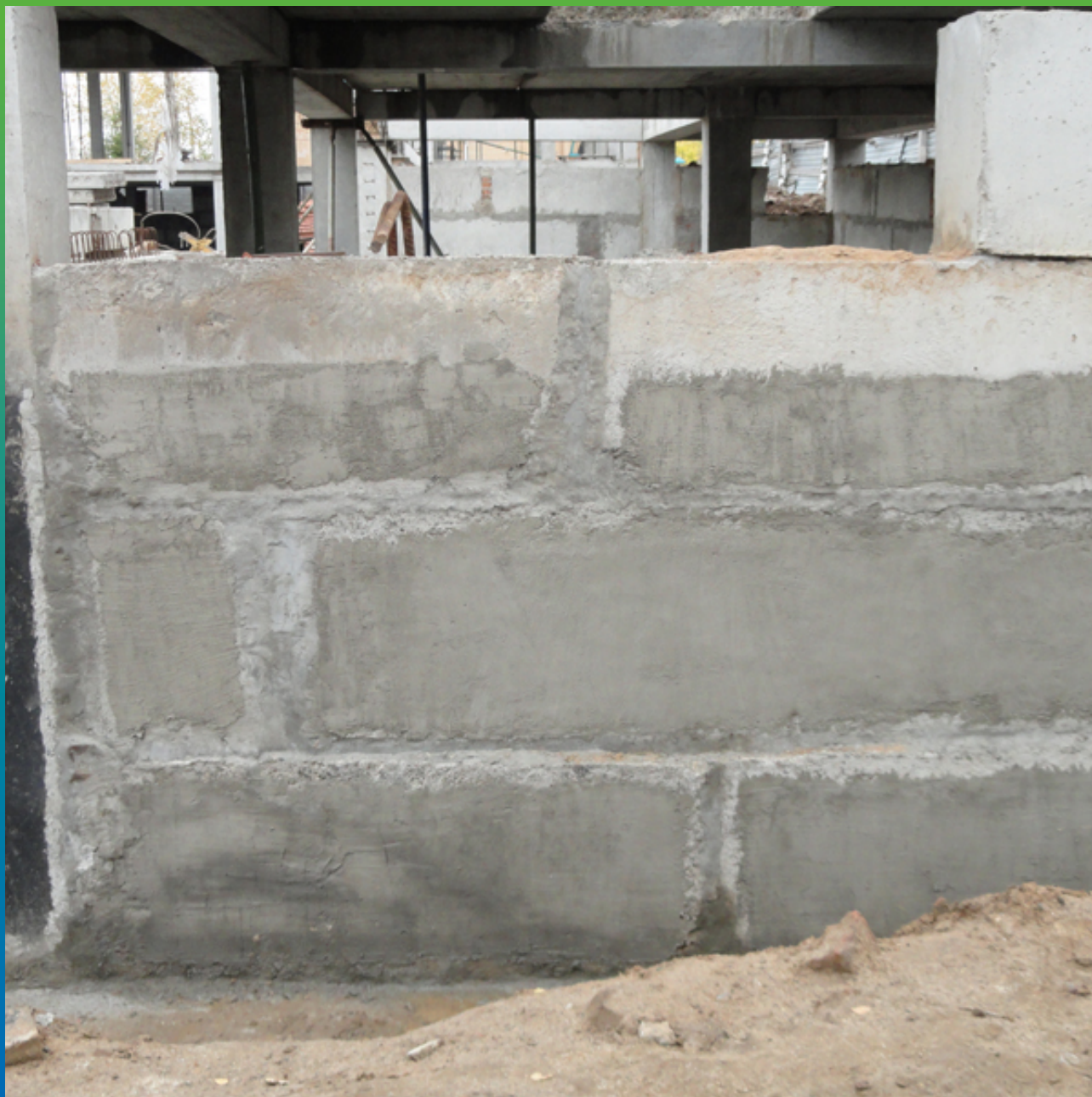
Стена фундамента с нанесенным Максил Флекс, швы обработаны Максрест