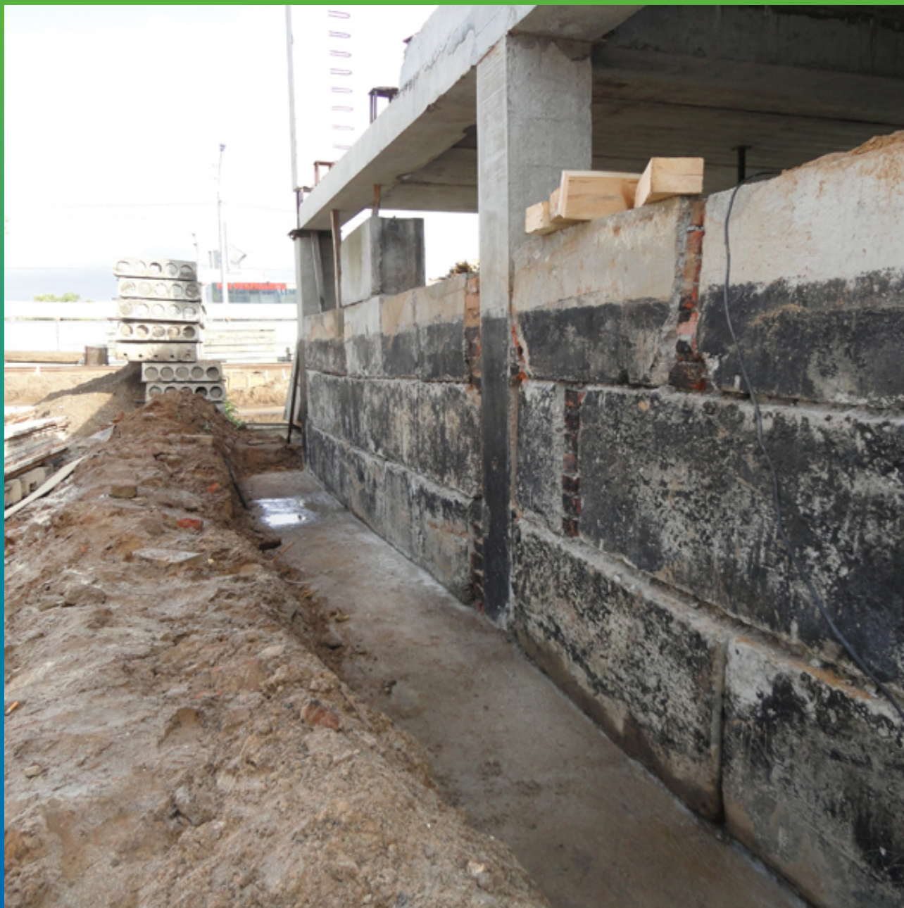
Общий вид фундамента до начала работ