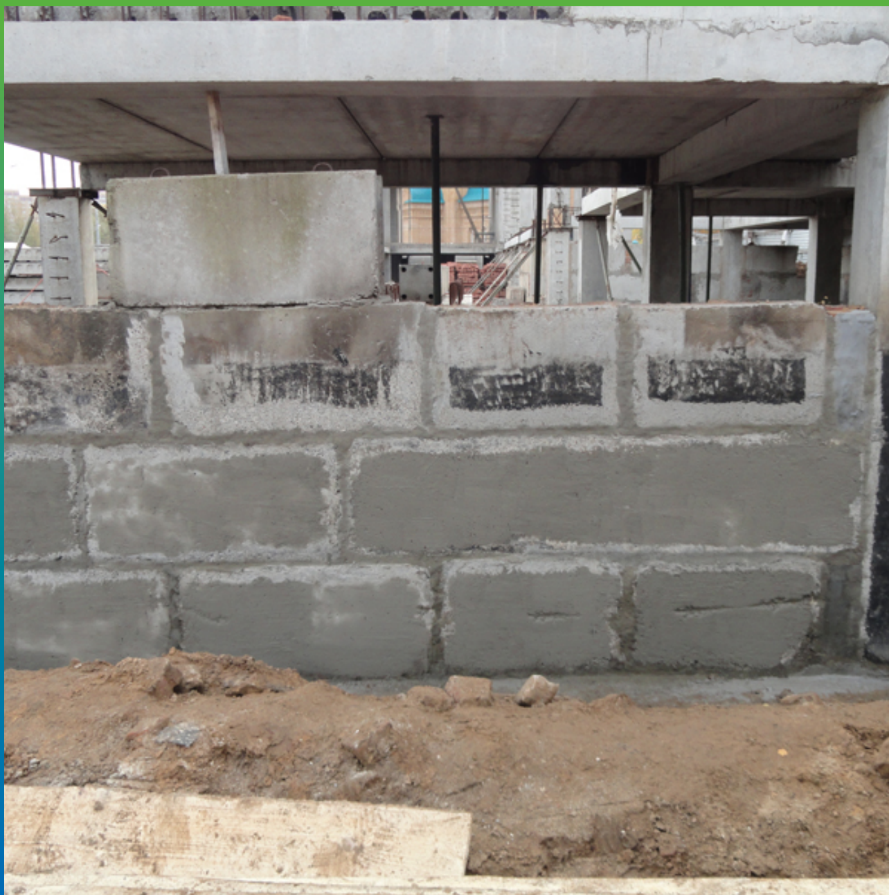
Стена фундамента с нанесенным материалом Макссил Флекс