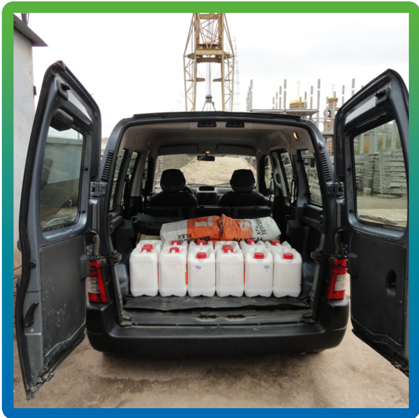
Материалы на объекте