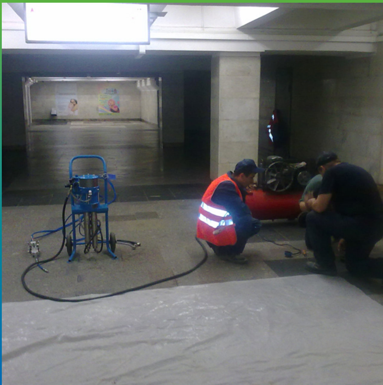
Подготовка инъекционного насоса БМ 1425 к работе