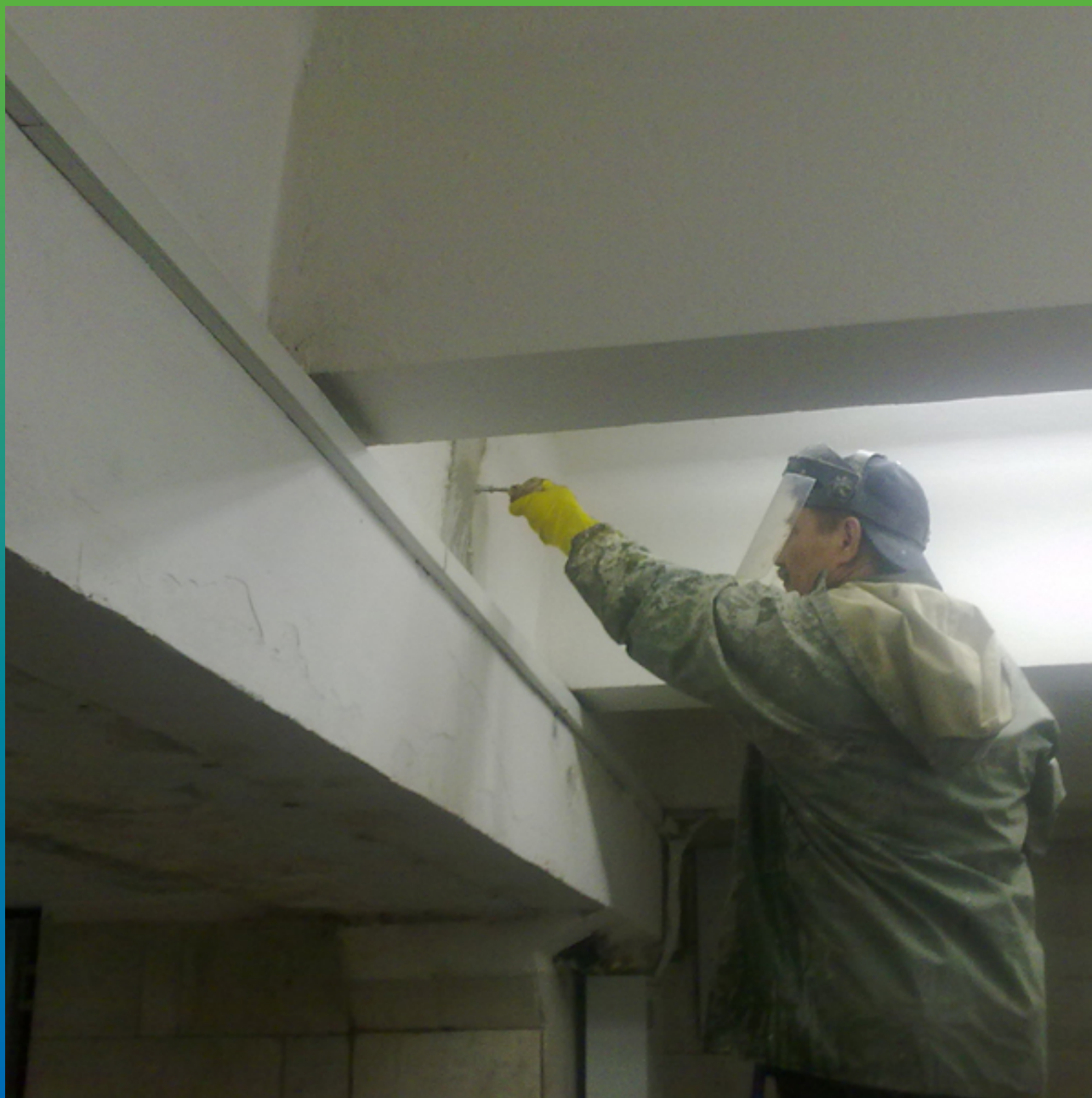
Установка инъекционных пакеров