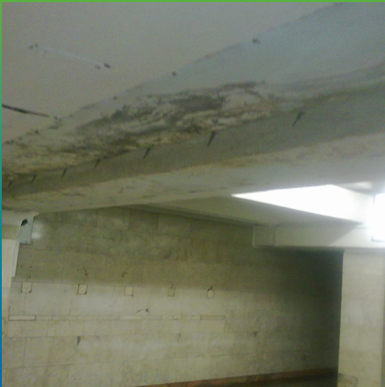
Перекрытие до начала работ