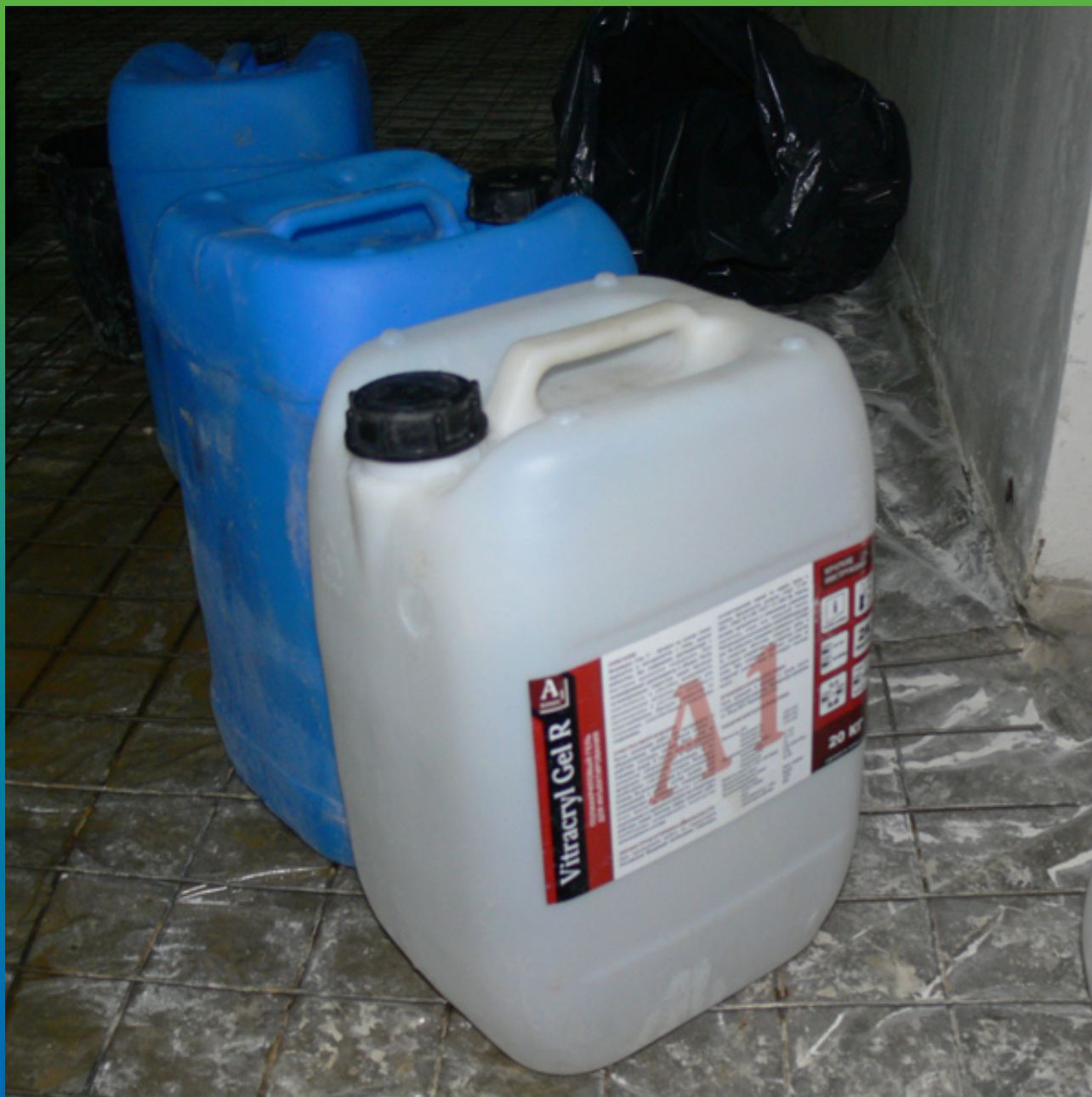
Материалы на объекте, Витракрил гель Р