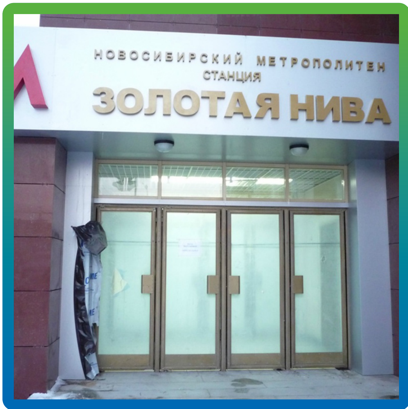
Внешний вид объекта