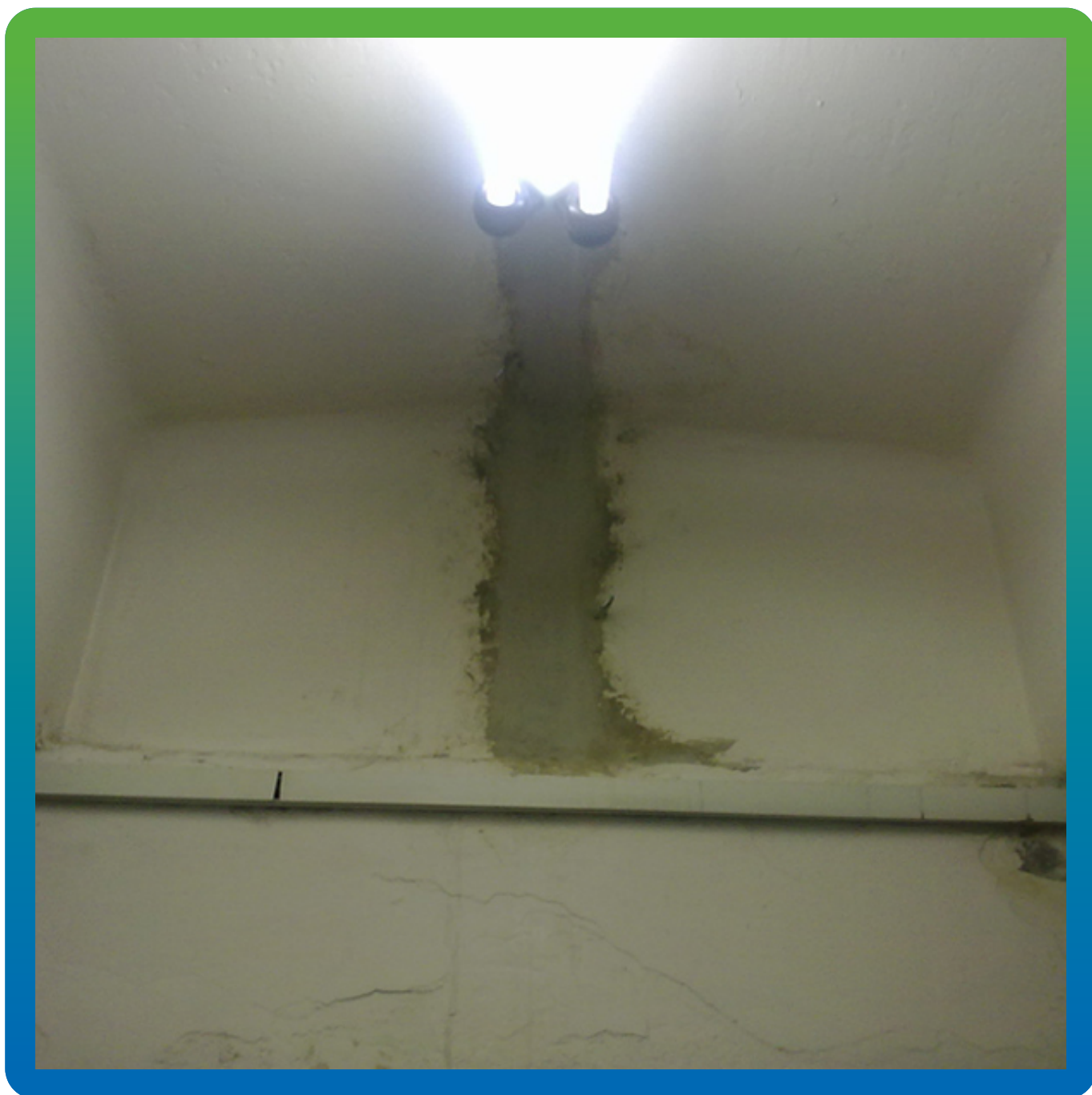
Шов после окончания работ