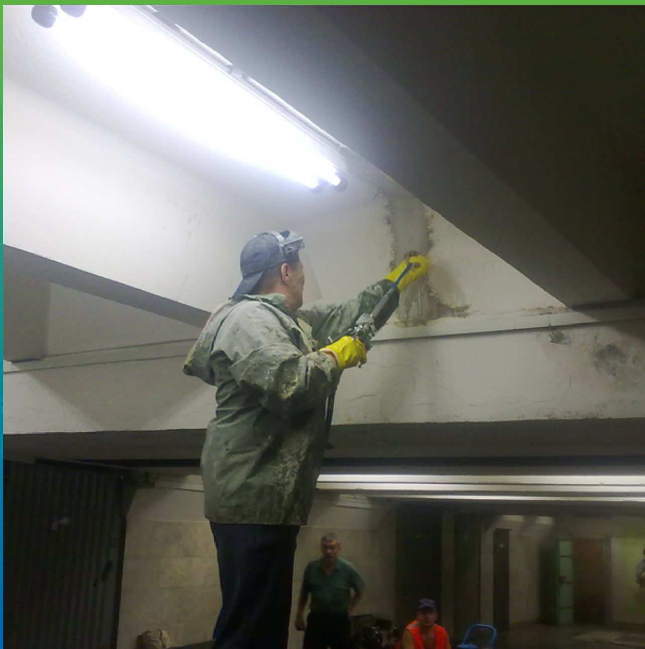
Инъектирование акрилатного геля в шов