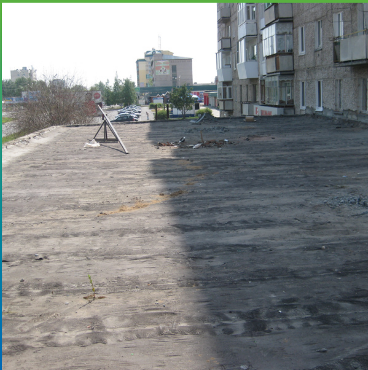
Общий вид объекта перед началом проведения работ