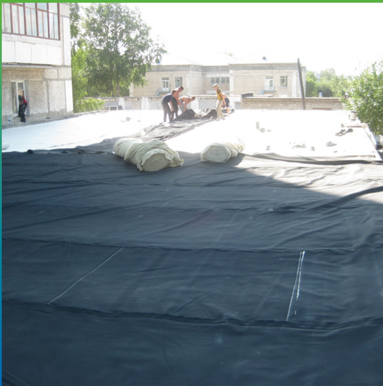
Укладка мембраны ЭПДМ Эластосил Т 1,2 мм