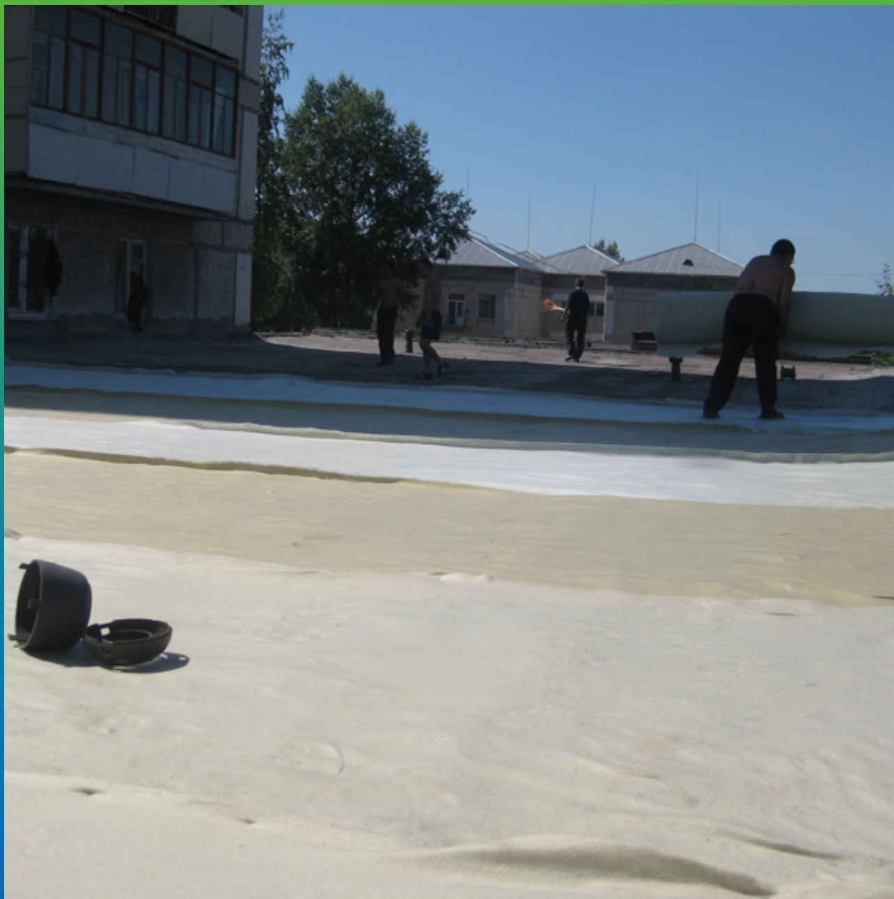
Укладка геотекстиля (подстилающий слой)