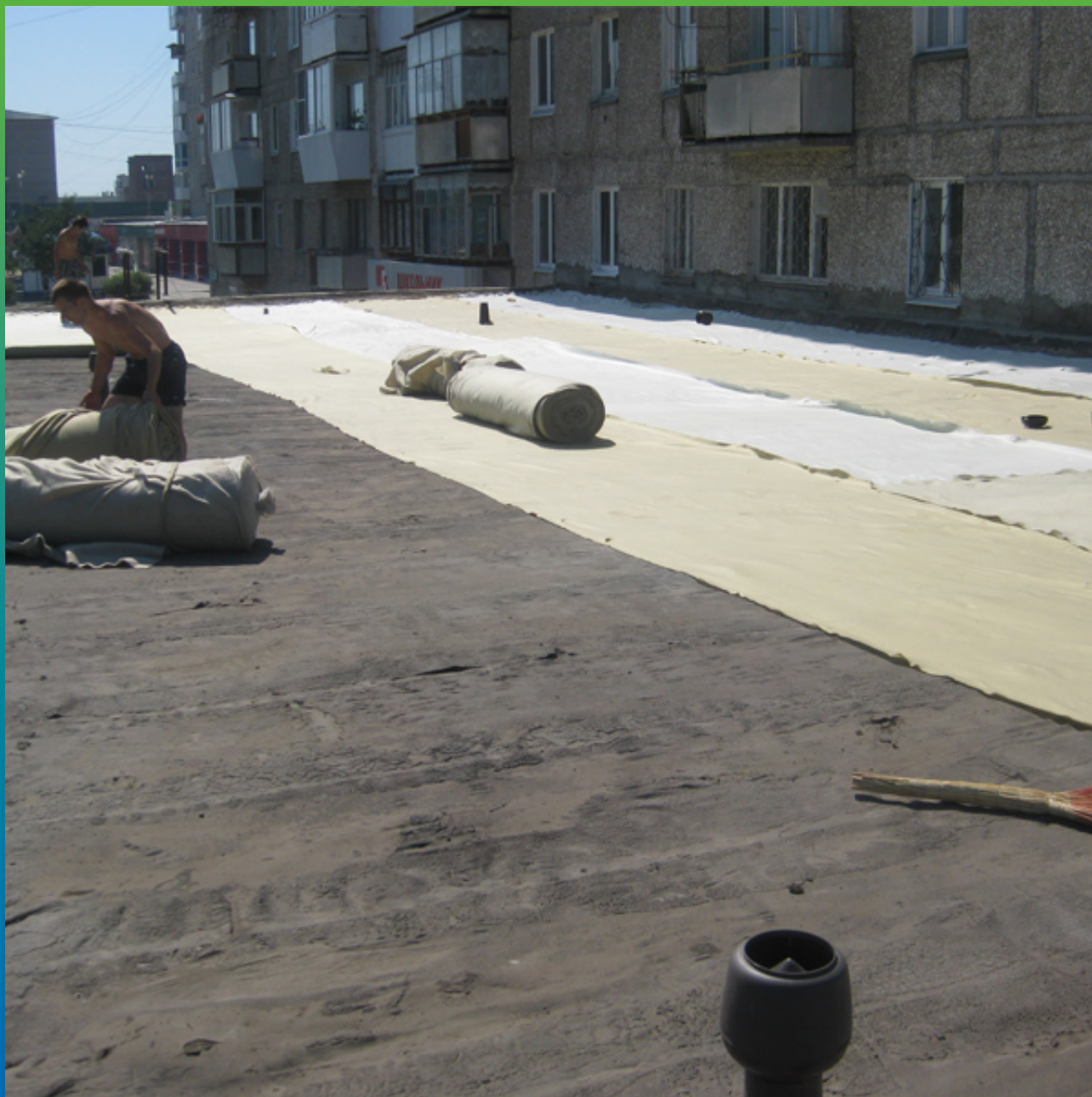
Укладка геотекстиля (подстилающий слой)