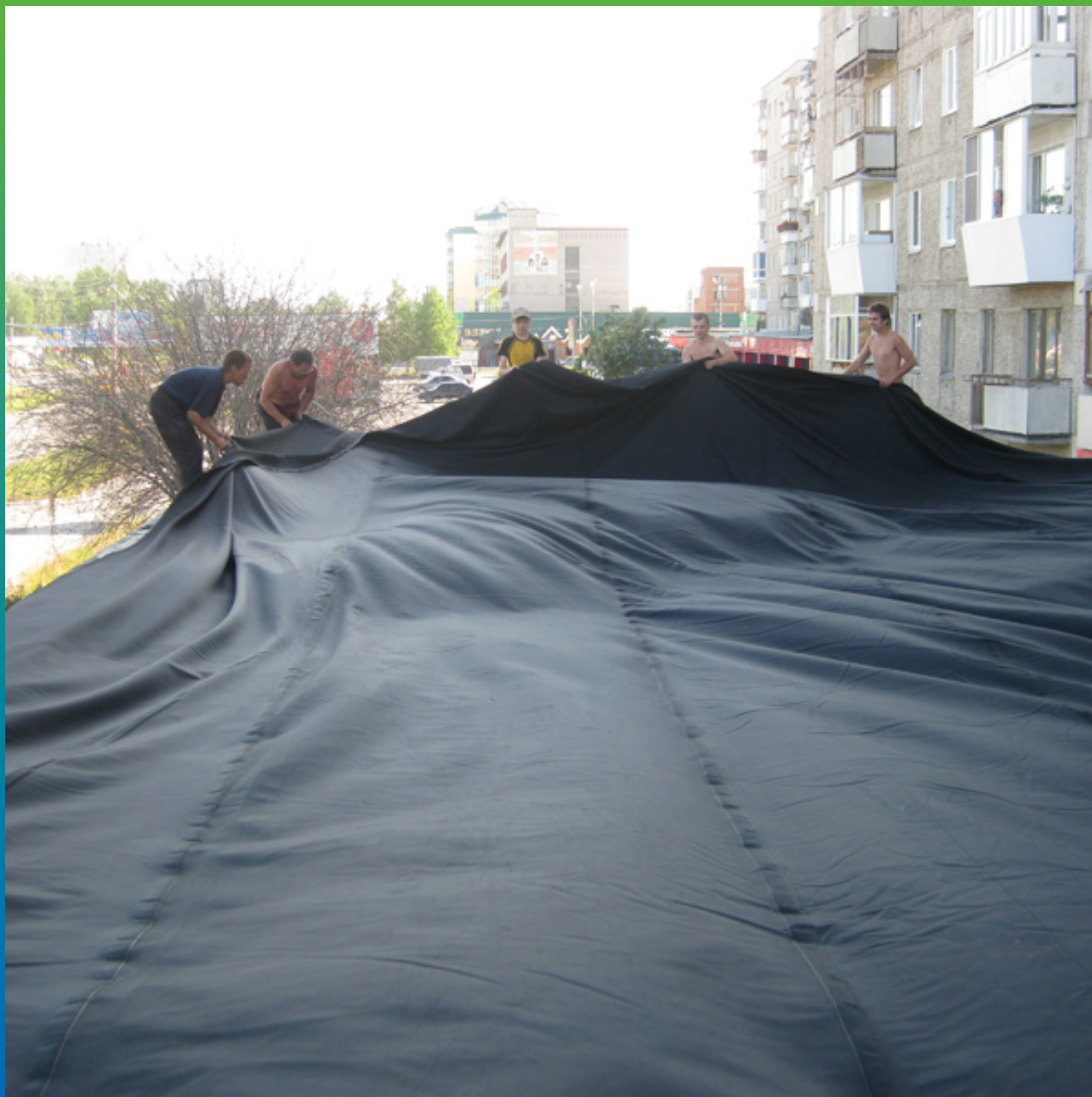
Укладка ЭПДМ-мембраны Эластосил Т 1,2 мм