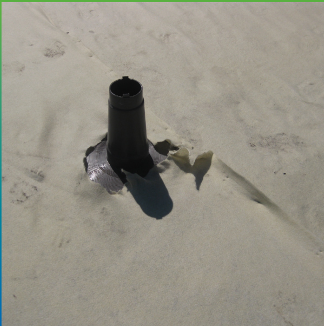
Укладка защитного слоя геотекстиля